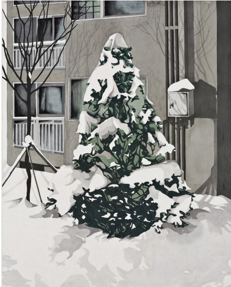
작품3] Merry Christmas!