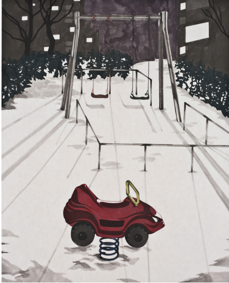
작품5] Stop! The Racing.