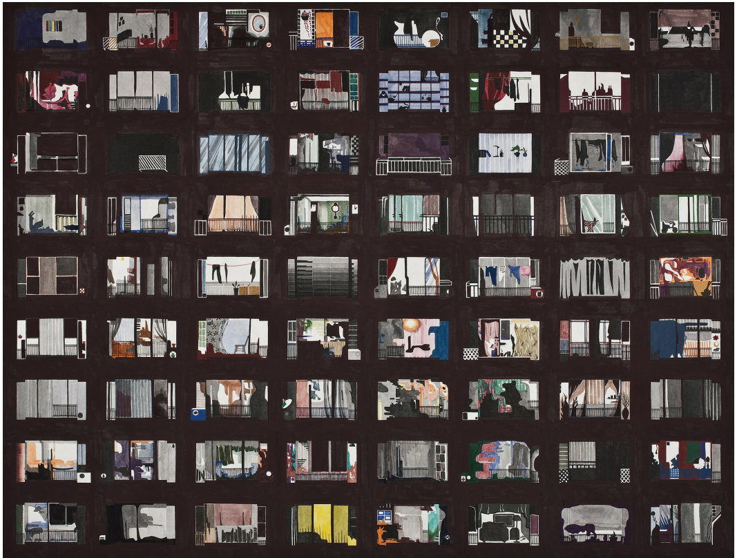
[작품1] veranda. 장지에 수묵 채색. 135cm x 178cm. 2010