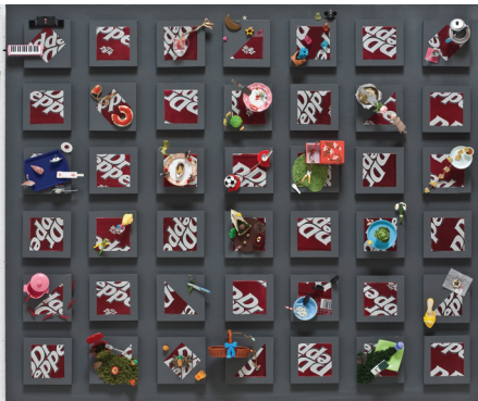
[작품9] Dr. Pepper Land