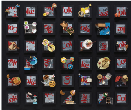
[작품8] Coke Land.