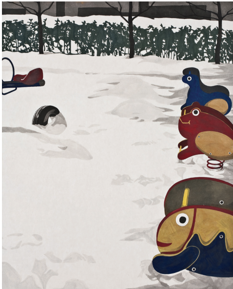
작품6] Their Own Racing.