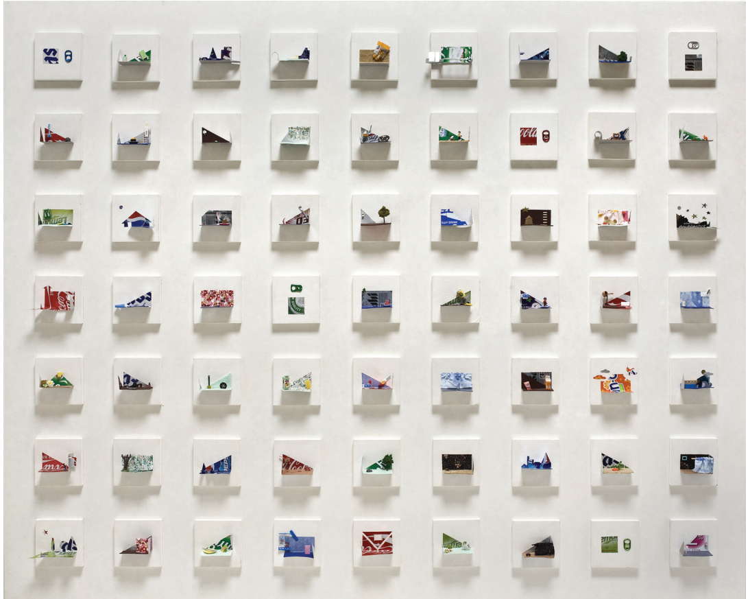
[작품7] Story in Land. 혼합 재료. 130cm x 162cm. 2008