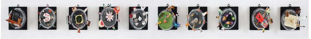
[작품11] Orgel. 가변 설치. 2010