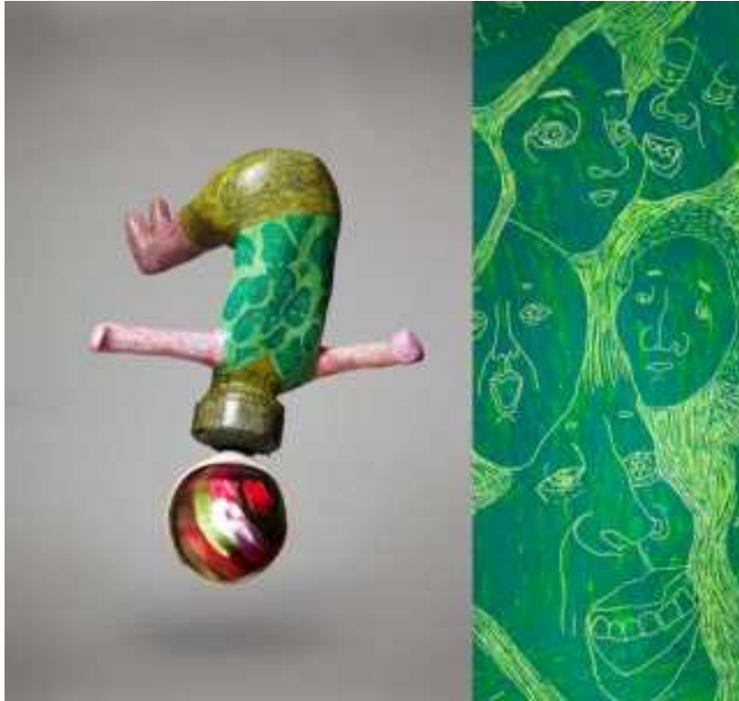
【작품3】 뿔이 부르는 노래 (Song Horns Sing)