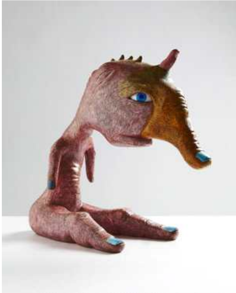
【작품6】 손가락질 (Finger - pointing)