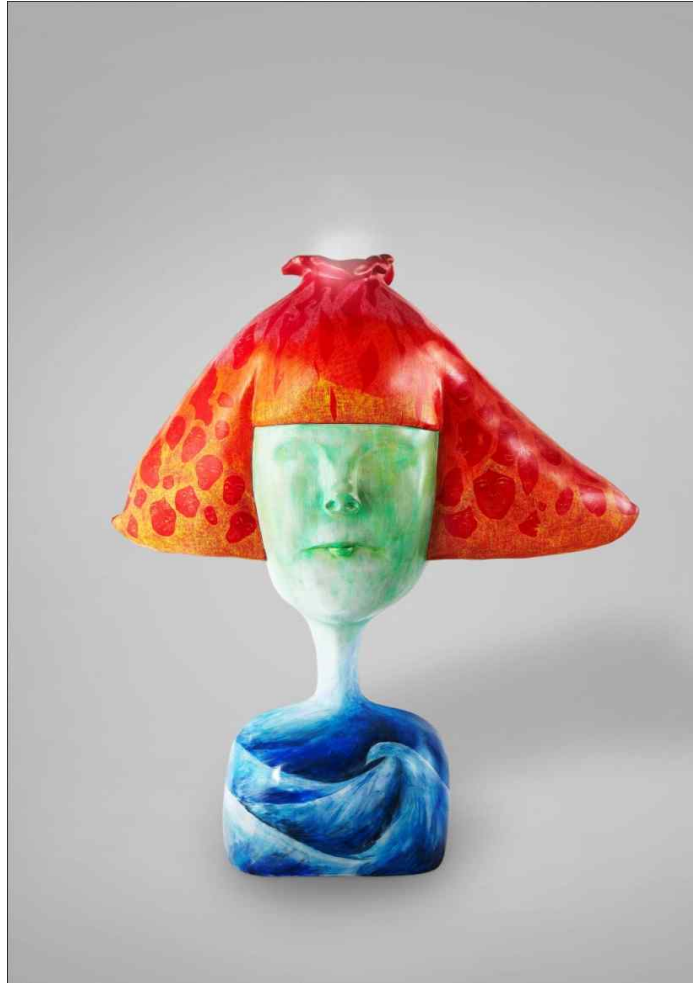
【작품5】 빨 좀 꺼주세요 2 (Soothe your Anger2)