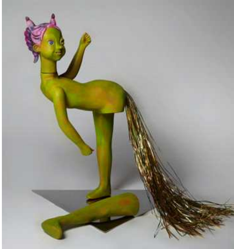
【작품1】 뿔 파워(The Horn power)