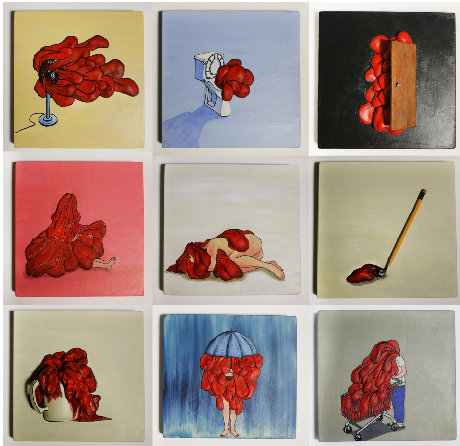
【작품 9】 흑 에세이