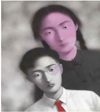
<도판 1> 혈연- 남매, 1996

실제사람과 비슷한 인체에서 나오는 흑이 현실과 비슷하게 보여서 작품의 의미를 더 강조시킨다. 본인이 실제로 입었던 옷과 같은 형태로 제작, 채색한 것도 같은 이유이다. 작품에서 주제가 되는 흑은 강렬한 빨간색 12) 을 사용하였다. 우리 모두는 유년시절 뛰어 놀다 다친 경험이 한번쯤은 있을 것이다. 무릎이나 팔꿈치가 까져 붉은 피와 함께 통증으로 남은 기억은 자신도 모르게 트라우마로 남게 되어, 작은 상처의 피만 보게 되어도 과거 통증으로 인해 아팠던 기억이 자신도 모르게 본능적으로 떠올라 반응하게 된다. 빨간색만 보고도 겁나고 불안한 이유도 마찬가지이다.