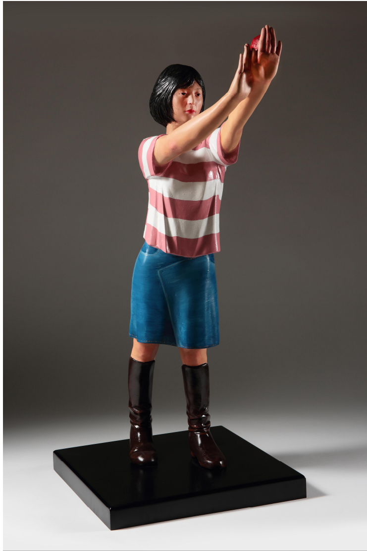
【작품 5】 반지