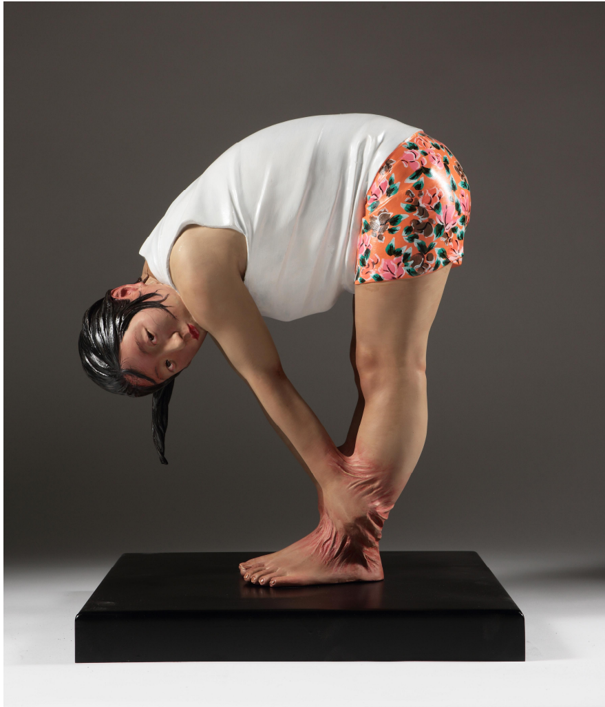
【작품 2】 연결