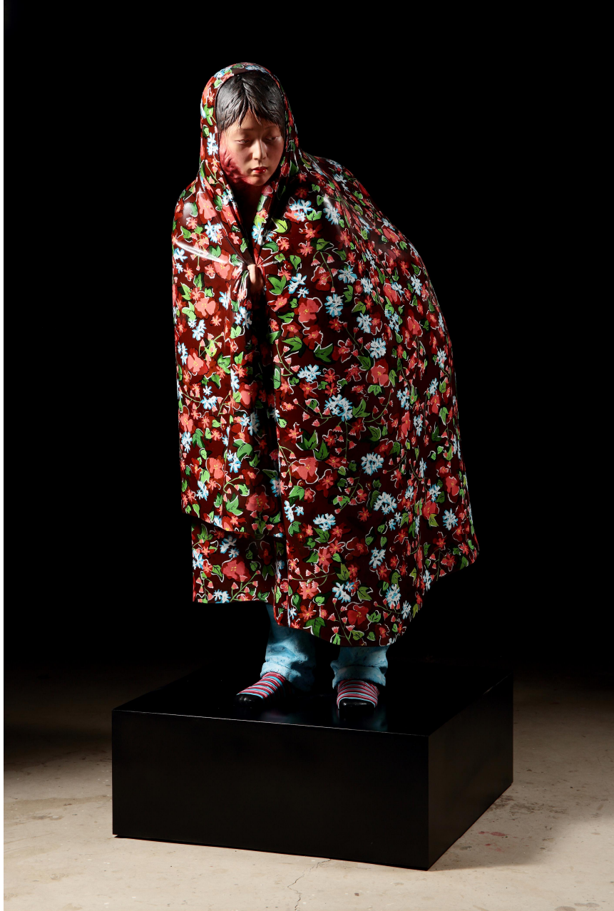
【작품 7】 은폐