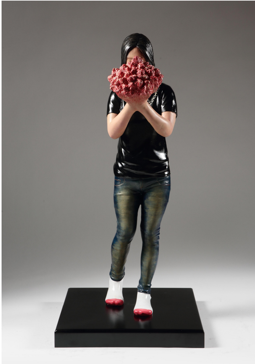
【작품 8】 꽃다발