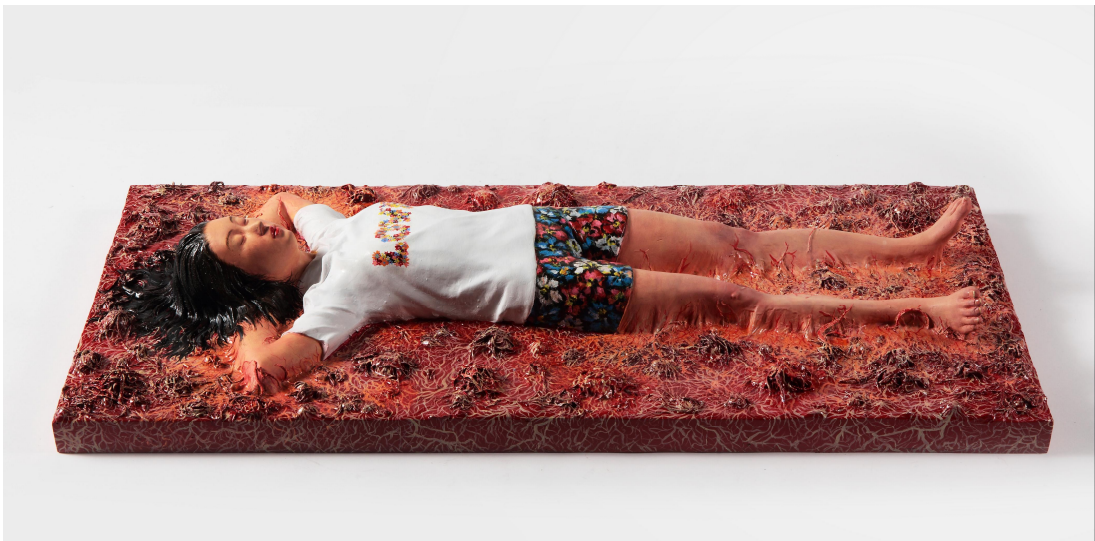
【작품 6】 잠식