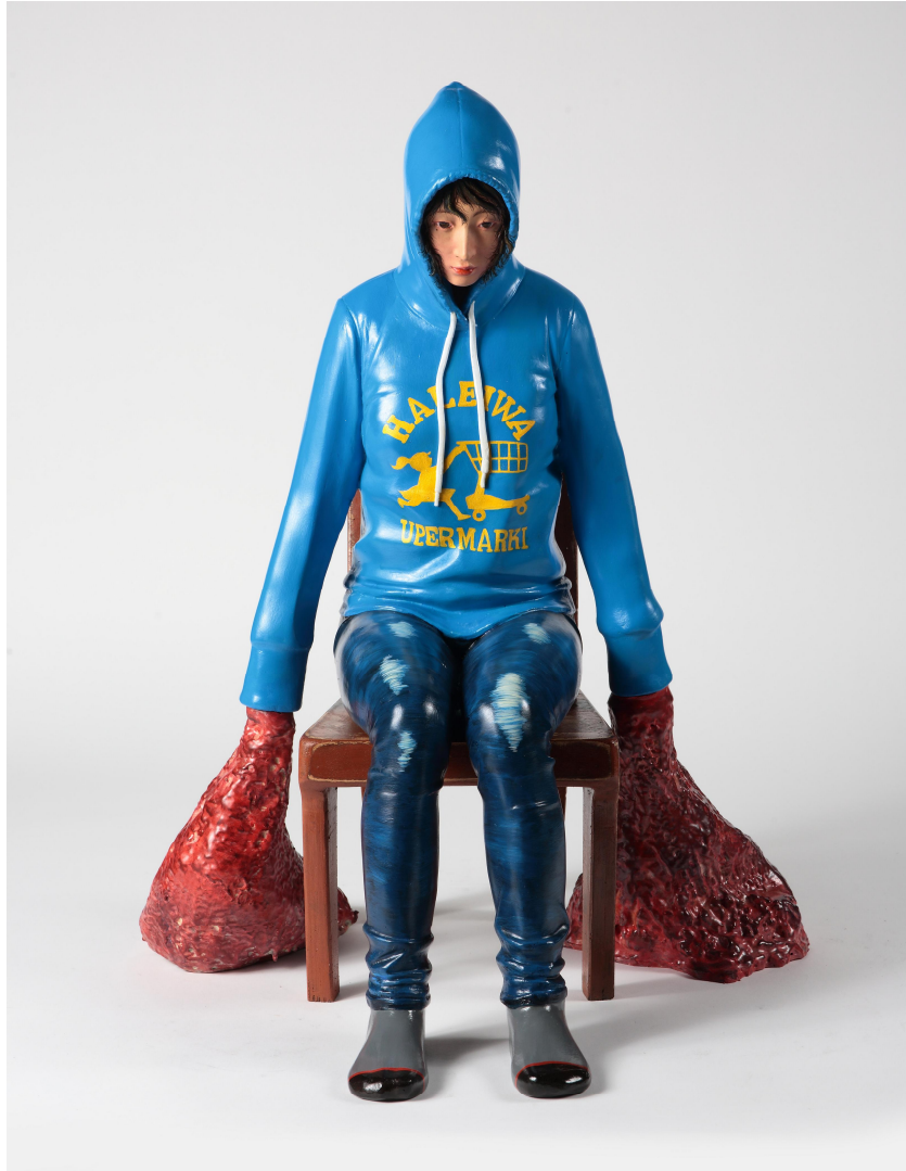
【작품 3】 사색