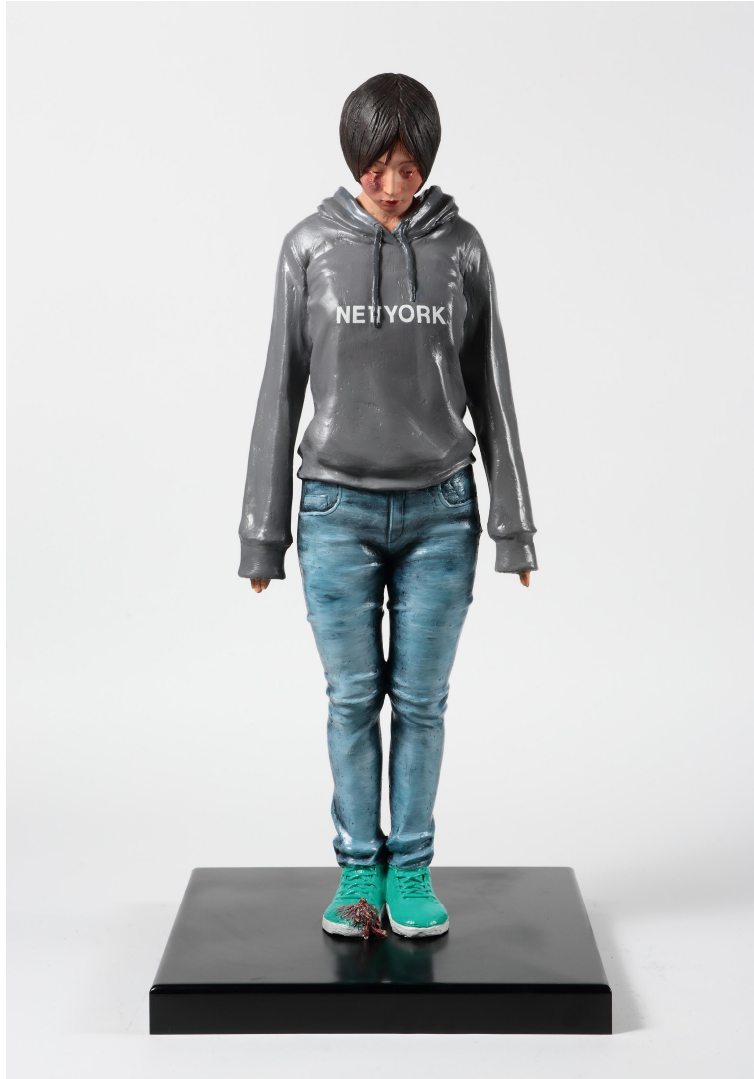
【작품 4】 눈물