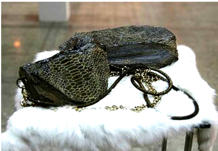
【작품 6】 Crocodilian 230x140x180 (mm) 자연석 2012