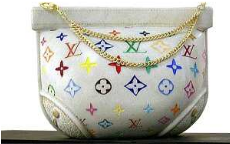
【작품 1】 루이비 뚱! 380x260x220(mm) 대리석에 채색 2010