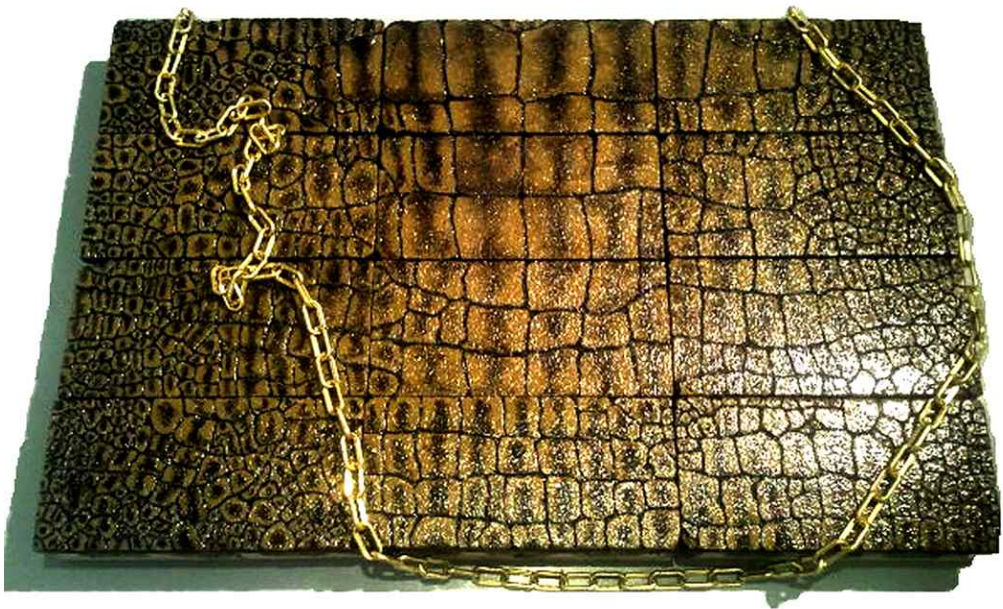
【작품 5】 Crocodilian 1140x1200x100 (mm) 벽돌에 페인팅 2011