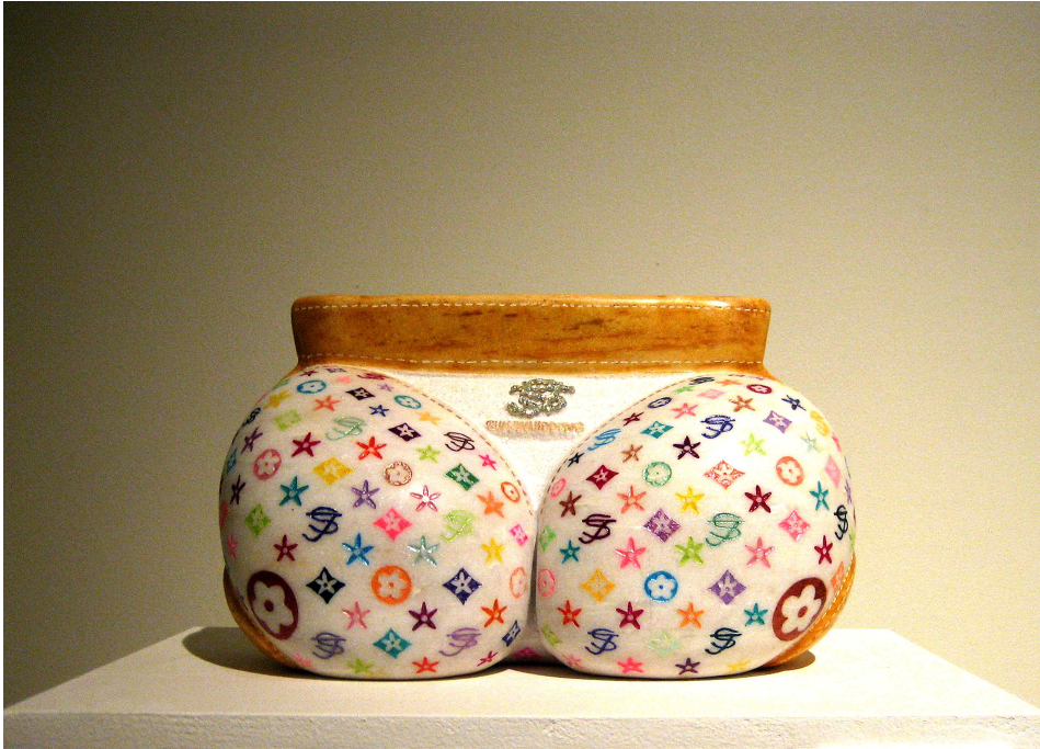
【작품 3】 SUNJINIUS DDONG 380x220x245(mm) 대리석에 채색 2011