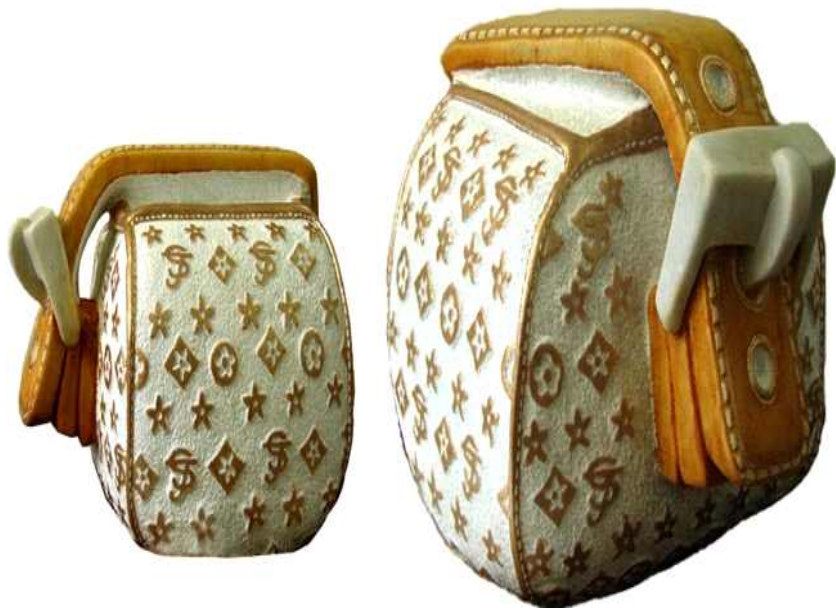
【작품 2】 SUNJINIUS DDONG 330x280x270(mm) 대리석에 채색 2011