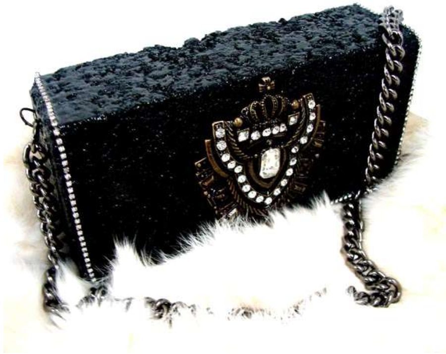
【작품 4】 Original brick bag 190x50x90(mm) 벽돌, 오브제 2011