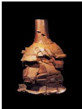
【도판 11】 피터 블커스, 「pinatubo」, 1994.