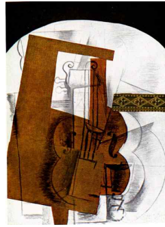
【도판 4】 조르주 브라크, 「바이올린」 1914.