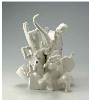
【도판 17】 김혜영, 「박제된 기억들2」, 2005.