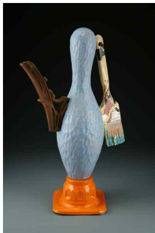
【도판 15】 Robin Campo, 「2 a Pin Pot」, 2013.