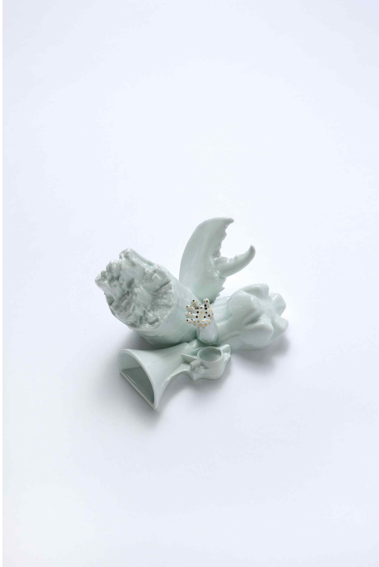
백자, 환원소성, 190x130x130(mm)