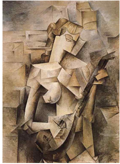
【도판 3】 파블로 피카소, 「만들린을 든 소녀(파니 텔리어)」, 1910.