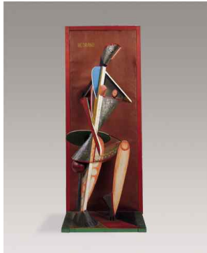
【도판 9】 아르키펙코, 「Médrano II」, 1913-14.