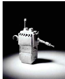
【도판 18】 이은정, 「기억」, 2006.