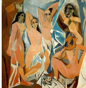
【도판 2】 파블로 피카소, 「아비뇰의 처녀들」, 1907.