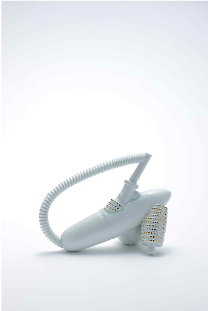
백자, 환원소성, 230x110x170(mm)

한 줄기의 빛이 필요할 때 마음속 한 편 희망을 던져 주듯 기억 속 무언가가 떠오르며 위안이 되는 순간이 있다. 시간의 흐름에 따라 사라진 기억들은 최소의 범위로 남아있는데 적은 개체의 구성으로 한줄기 희망이 될 수도 있는 빛을 표현해보고자 하였다.