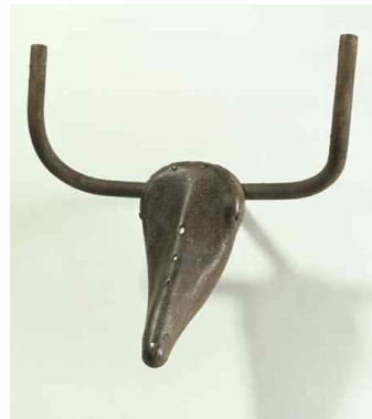
【도판 6】 파블로 피카소, 「황소머리」, 1942.