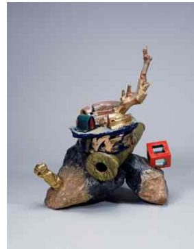
【도판 12】 나카무라 긴베이, 「Sumptuousness and Untruth」, 1991.