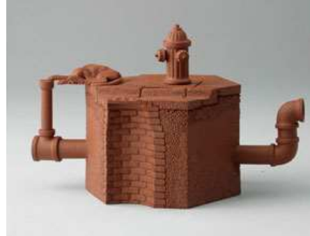
【도판 14】 리처드 노킨, 「육각주전자(변화 21)」, 2001.