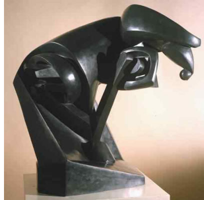
【도판 8】 뒤상 비용, 「말」, 1914.