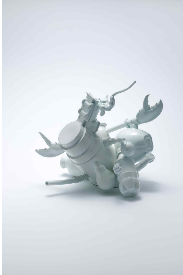
백자, 환원소성, 320x340x360(mm)

세상에 나아가기 위해 그동안 많은 생각과 걱정,에 움츠렸던 당당한 꿈을 펼쳐 보이며 실현시키려 하였지만 마저 펼치지 못한 성숙으로 견뎌야하는 힘이 되어주는 지난날들을 기억하고자 하였다. 날개주축이 되는 단순한 형태를 중심으로 금방이라도 날아오를 듯 날개를 활짝 폈지만, 아직 성숙되지 못한 나 자신의 모습을 되돌아보며 지난 추억 속 사물들로 구성해보았다.