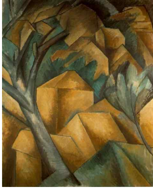
【도판 1】 조르주 브라크, 「에스타크의 집들」, 1908.