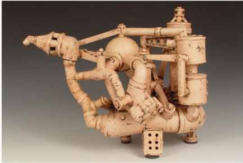
【도판 13】 Patrick Taddy, 「salvage yard teapot-F3L」, 2004.