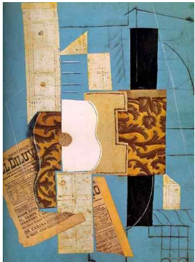
【도판 5】 파블로 피카소, 「기타」, 1913.