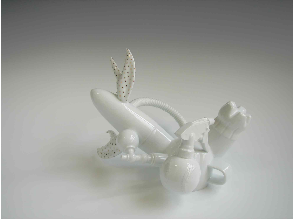
백자, 환원소성, 230x170x270(mm)

【시작품1】, 【시작품2】 소유란 물질적인 소유 뿐 아니라 건강과 정신적인 면도 포함되며 소유와 욕망의 차이가 적을수록 행복한 삶에 다가간다. 소유하고자하는 욕망과 현실의 충돌은 언제나 있으며 이러한 자각에 따라 얼마나 행복한 삶인가에 대한 결과를 가져다준다. 하나를 얻어 그 것이 열매를 맺을 즈음이면 또 하나를 향해 두 손을 뻗어 달려든다. 필요에 의한 소유가 아닌 욕망에 의해 끊임없는 소유하고자하는 부푼 욕구를 사물로 대신하여 심상화 하였다.