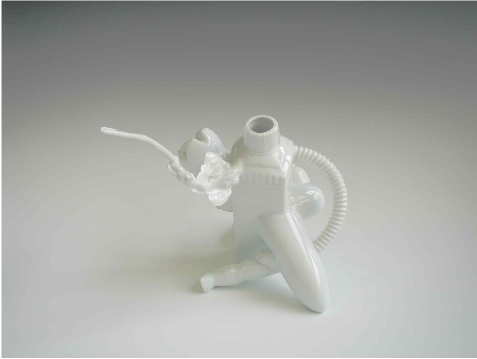
백자, 환원소성 200x200x290(mm)