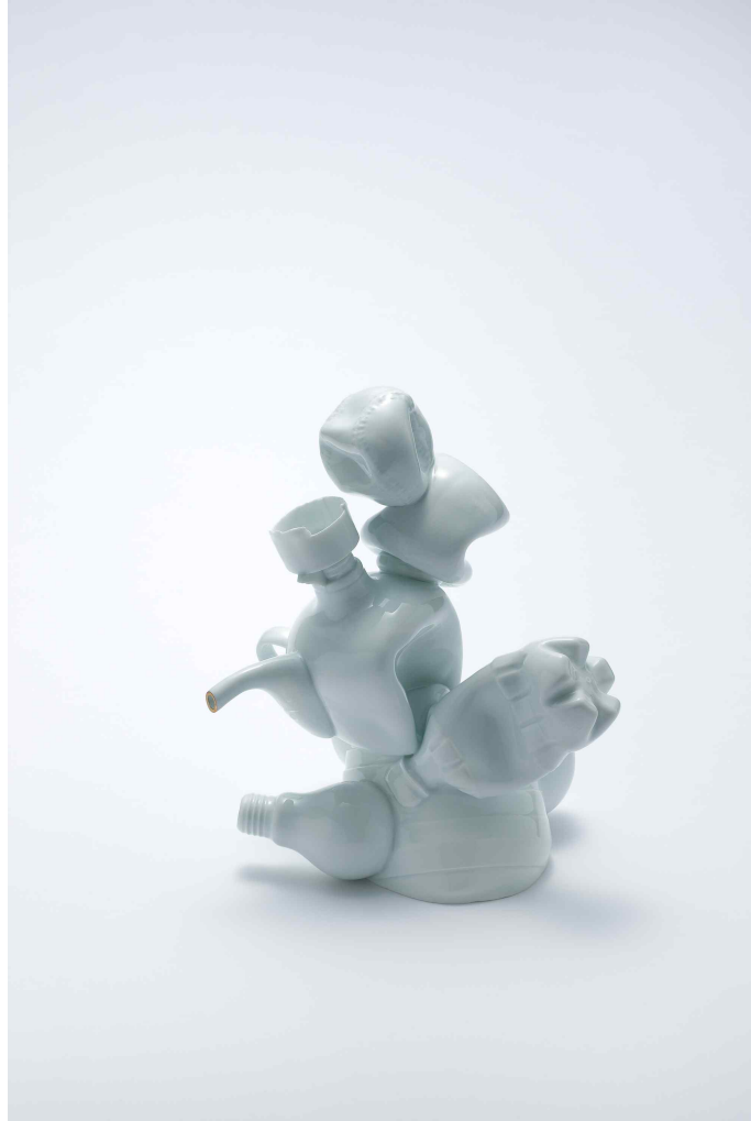
백자, 환원소성, 270x200x270(mm)

지난날의 헛됨은 일그러진 형상으로 남아있기 마련이다. 누구에게는 불효가 될 수도 있고, 누구에게는 돌이킬 수 없는 시간일 수도 있다. 지나간 일을 후회에 따른 눈물로 씻어내려 하는 이미지를 주전자의 형상으로 일그러진 형태인 흙의 물성을 이용하여 표현하였다.