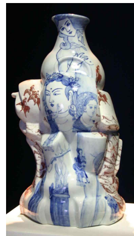
【도판 16】 신영 호, 「지혜로운 이브」, 2009.