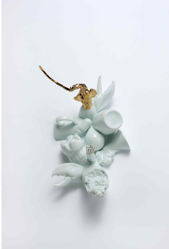
백자, 환원소성, 220x380x100(mm)