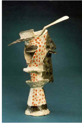
【도판 7】 파블로 피카소, 「암생트의 잔」, 1914.