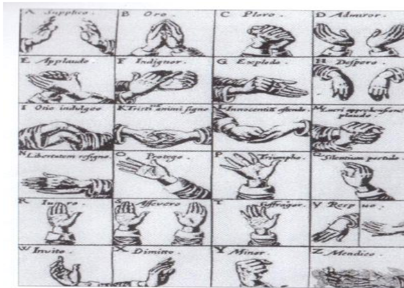
<그림 1> 카이로노미 원리에 의한 지휘

중세 합창의 지휘에는 때때로 선율의 움직임이 공중에서 그려지는 손의 움직임에 의하여 표시되기도 하였다. 다성의 발전기를 맞으면서 악곡의 내용이 차차 복잡해져서 고도의 표현 효과를 요구하게 되자, 지휘자의 역할이 단지 박자만 짓는데 한할 수는 없게 되었다. 그러므로 지휘가 곤란하게 되어 오선보가 발명되고 복잡한 대위법 기술이 전개되며 그것에 상응한 지휘자의 기술이 필요하게 되었다.