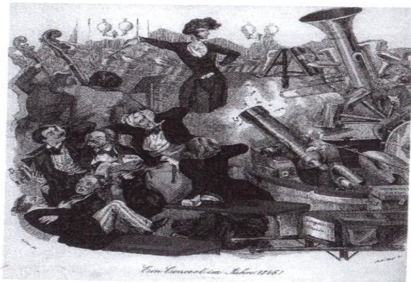
<그림6> 베를리오즈가 음악의 군대를 이끄는 그림