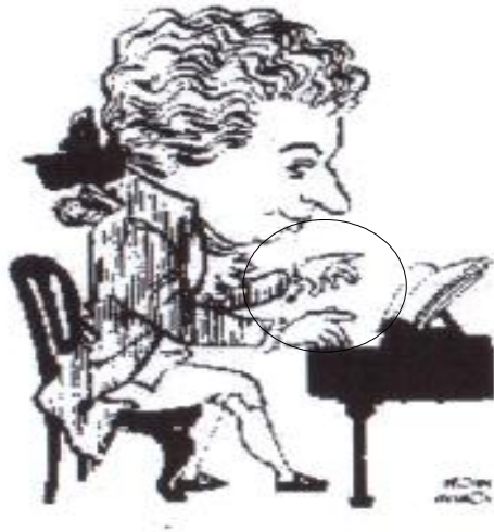
<그림3> 모차르트가 왼손으로 지휘하는 모습

고전시대의 작곡가는 자신이 작곡한 곡을 직접 지휘를 했다. 모차르트는 하이든과 함께 빈 고전파를 대표하는 한 사람으로 고전파의 양식을 확립하였다. 고전시대의 모차르트는 오른손으로 첼발로를 치며 왼손으로 지휘하는 모습이 연상된다.