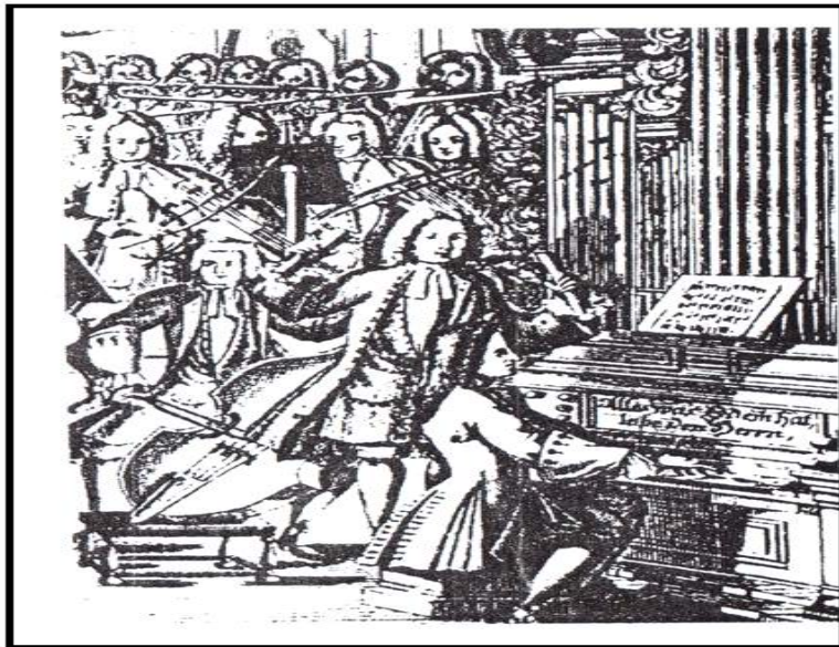
<그림 4> 멘델스존이 피아노앞에 앉아 지휘하는 장면

18세기 초기, 중기의 오케스트라는 특별한 지휘자 없이 수석 바이올린 주자가 지휘자의 역할을 담당하였다. 18세기와 19세기 초 모든 연주의 지휘자는 작곡자들이었다. 그러나 19세기 중엽까지도 모든 작곡자가 지휘를 하는 것은 아니었으며, 멘델스존(Felix Mendelssohn)은 1835년 라이프치히에서 게반트하우스 관현악단을 지휘하면서 지휘봉을 사용하였다.