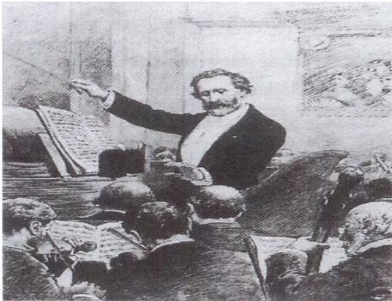
<그림7> 파리에서 아이다를 지휘하는 베르디

19세기 후반부 작곡가 겸 지휘자인 프란체스코 베르디(Giuseppe Fortunino Francesco Verdi 1813-1901)는 이탈리아의 작곡가로, 그는 19세기 이탈리아 오페라의 가장 영향력 있는 작곡가이다.