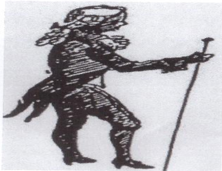
<그림 2> 바로크 시대 지휘 하는 모습

바로크 시대가 열리면서 오케스트라가 형성되기 시작하였다. 그 결과 기악합주가 성악음악으로 점차 독립되어 가면서, 지휘는 더욱 중요해졌다. 시작과 끝맺음을 통일시키기 위하여 합창장이나 악장이 고개나 활을 사용하였으며 또 속도를 조정하였다. 특히 지휘자가 따로 기다란 나무 조각이나 악보를 들들 만 것을 가지고 흔들면서 박자를 지었다고 한다.