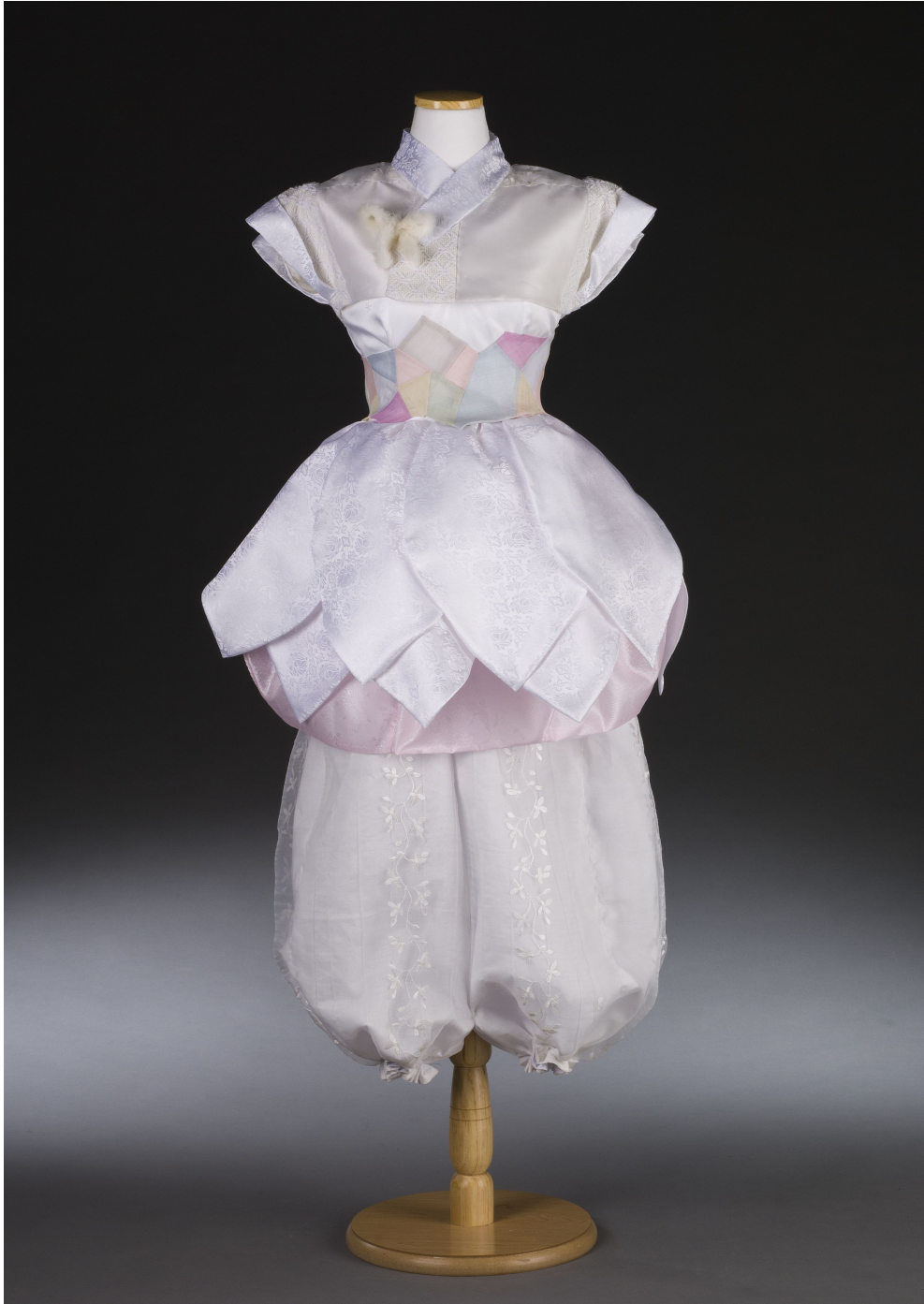
<그림 23> 작품Ⅵ 앞