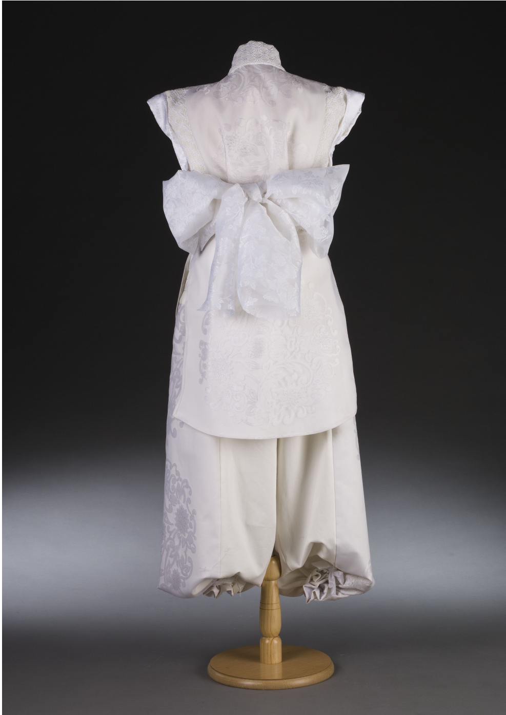
<그림 21> 작품 V 뒤