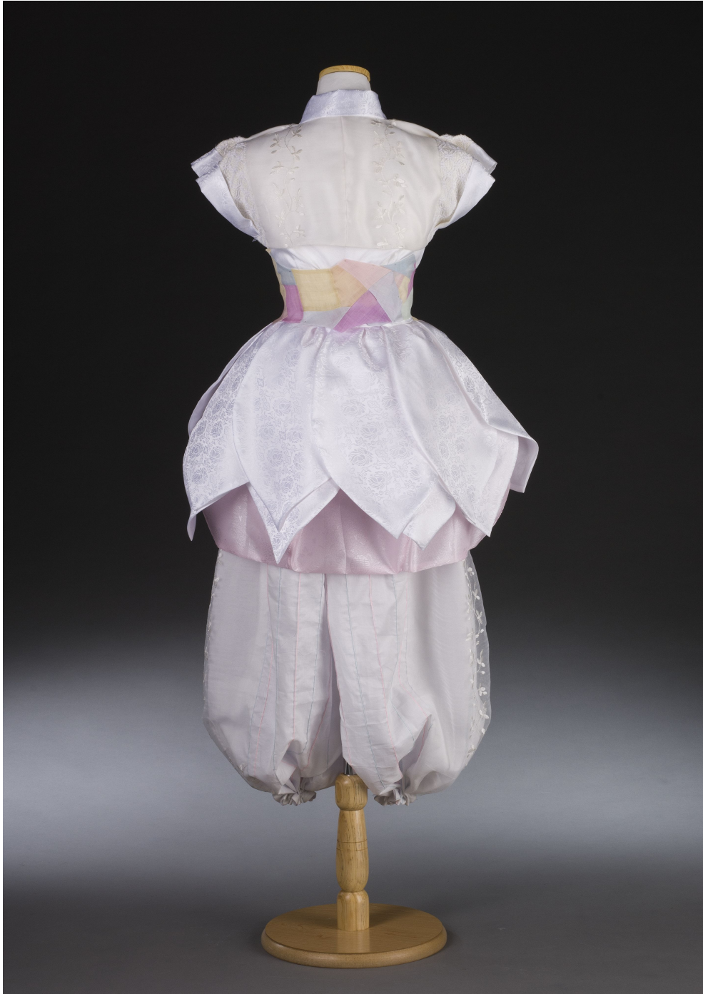
<그림 24> 작품Ⅵ 뒤