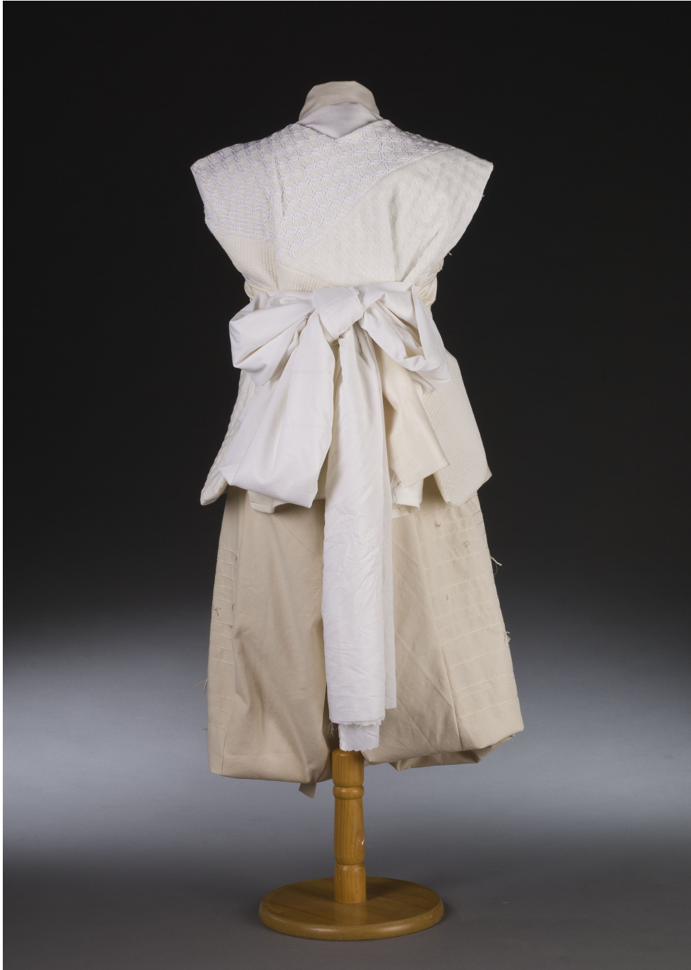
<그림 27> 작품Ⅶ 뒤