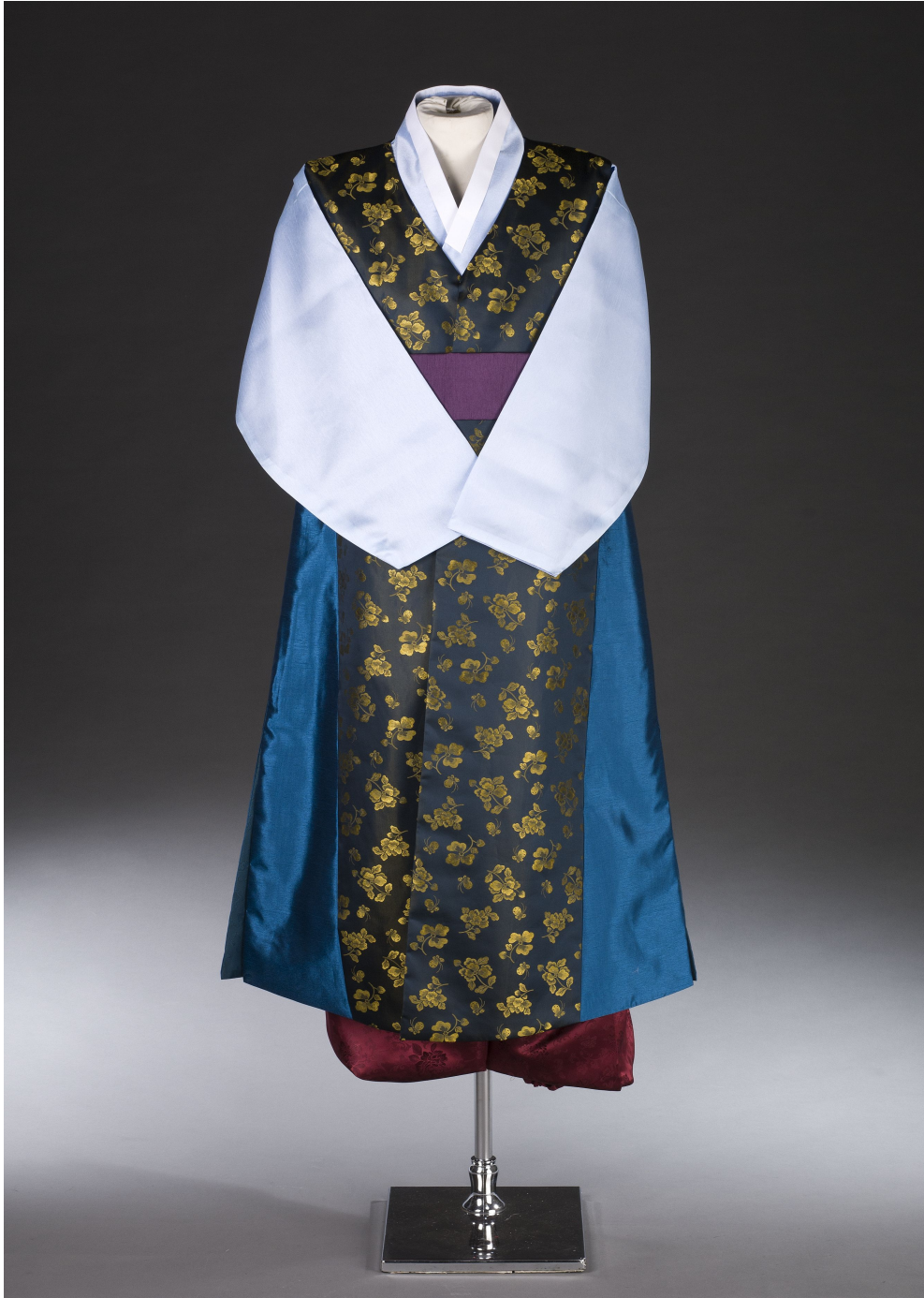
<그림 11> 작품 II 앞