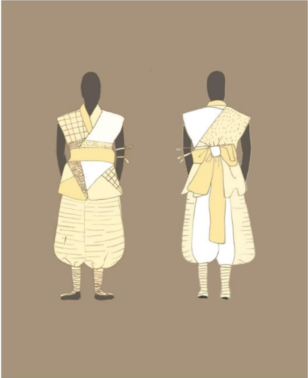
<그림 25> 작품Ⅶ 일러스트레이션