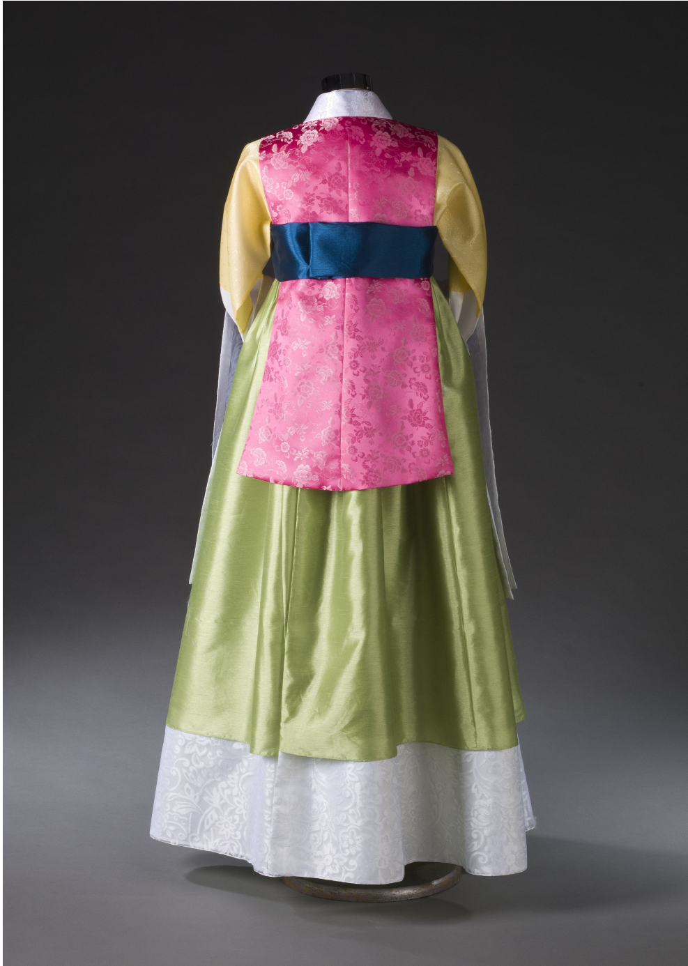
<그림 9> 작품 I 뒤