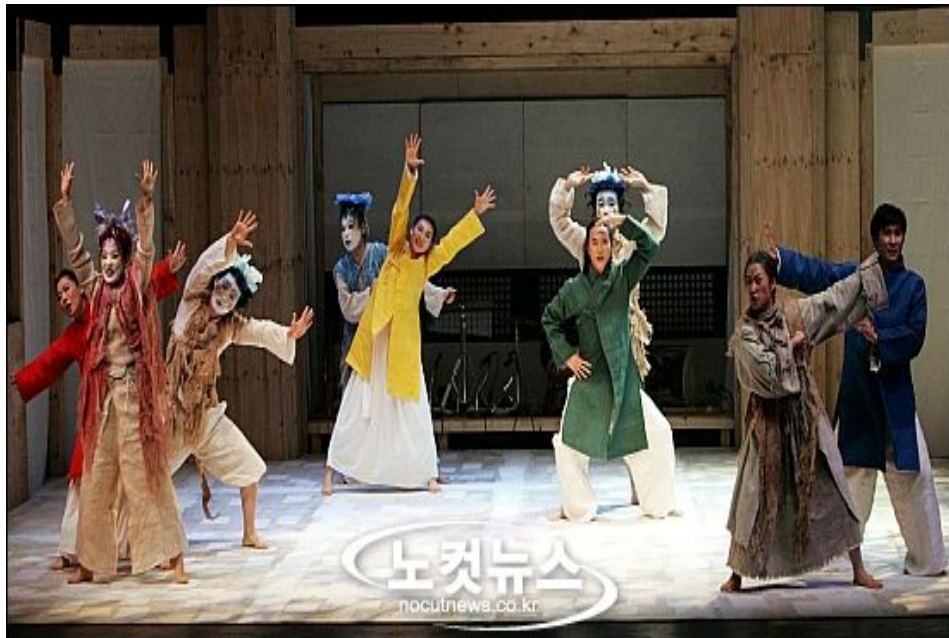
<그림 4> 극단 '여행자' 공연사진 II