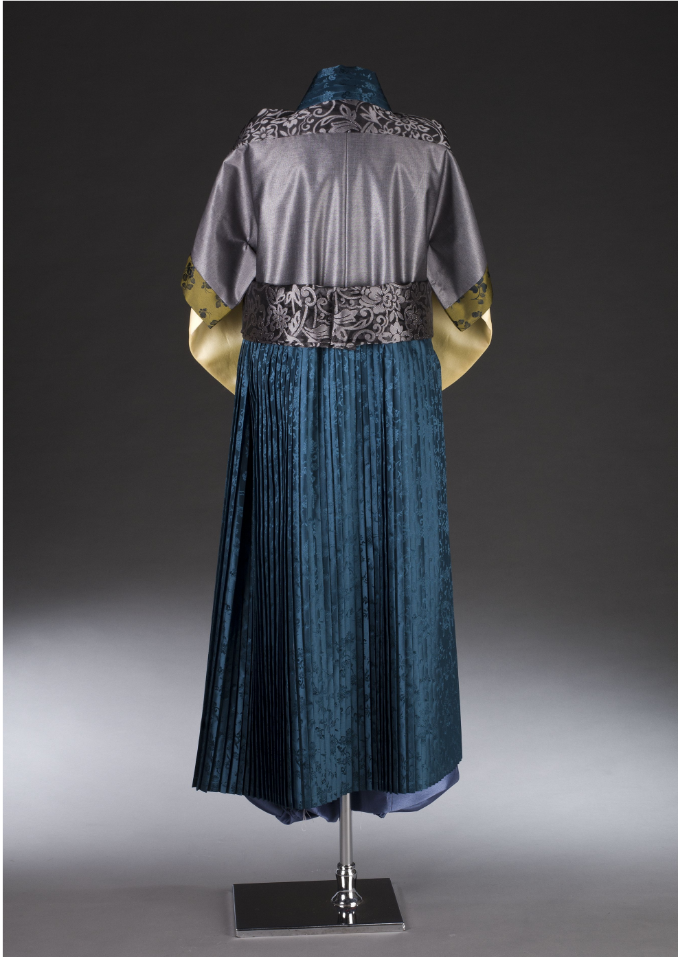
<그림 18> 작품Ⅳ 뒤