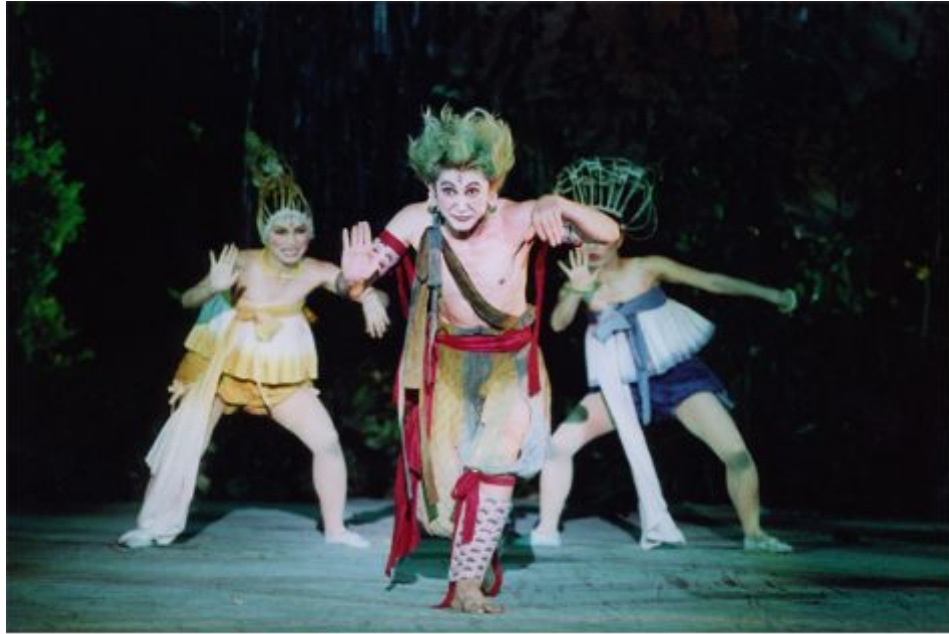
<그림 2> 극단 ‘미추’의 공연사진Ⅱ