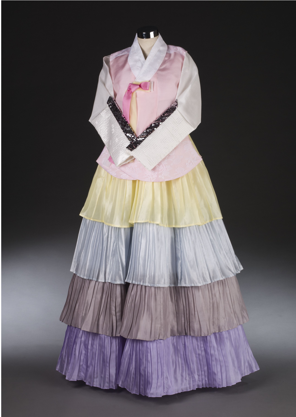
<그림 14> 작품Ⅲ 앞