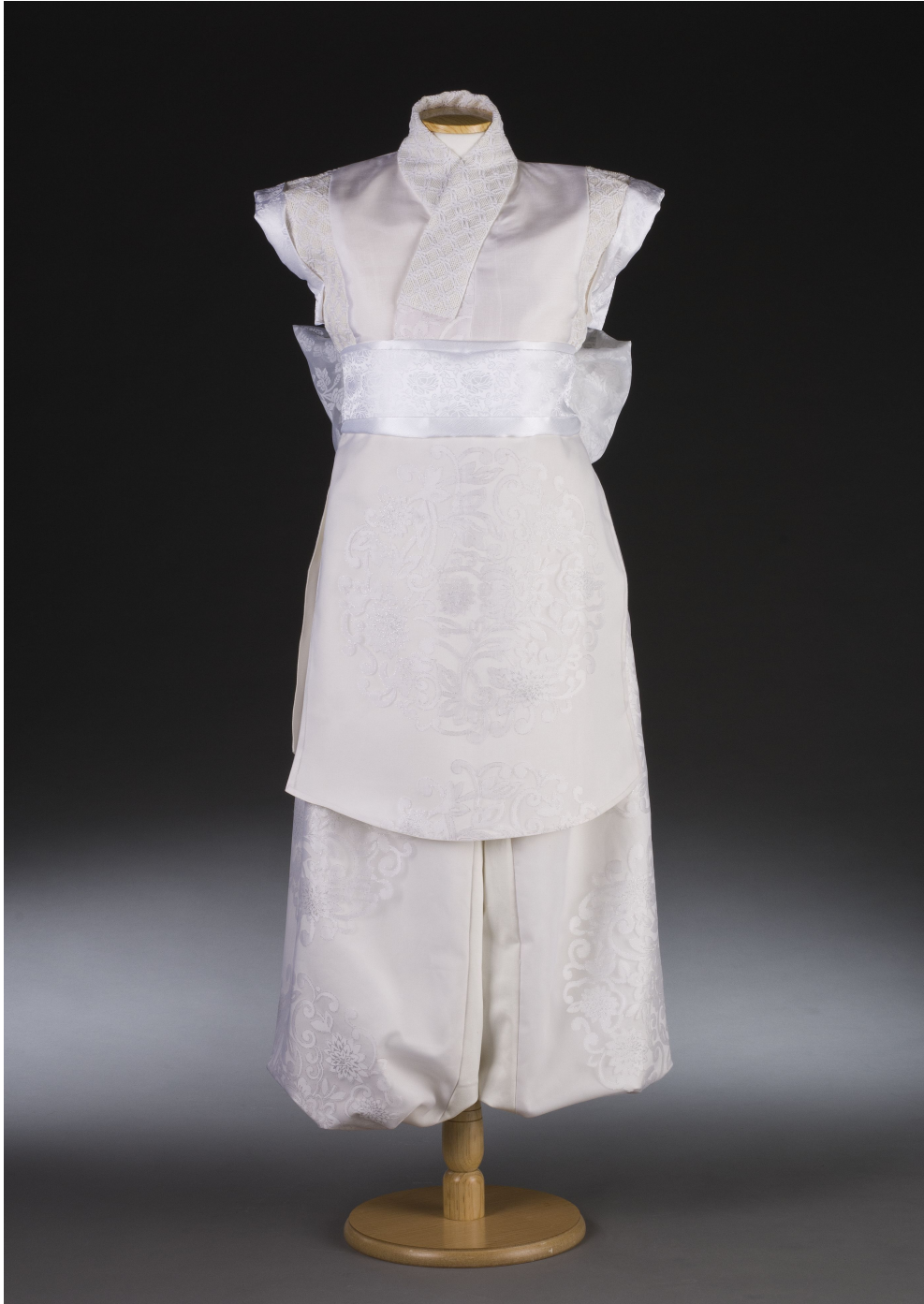
<그림 20> 작품 V 앞