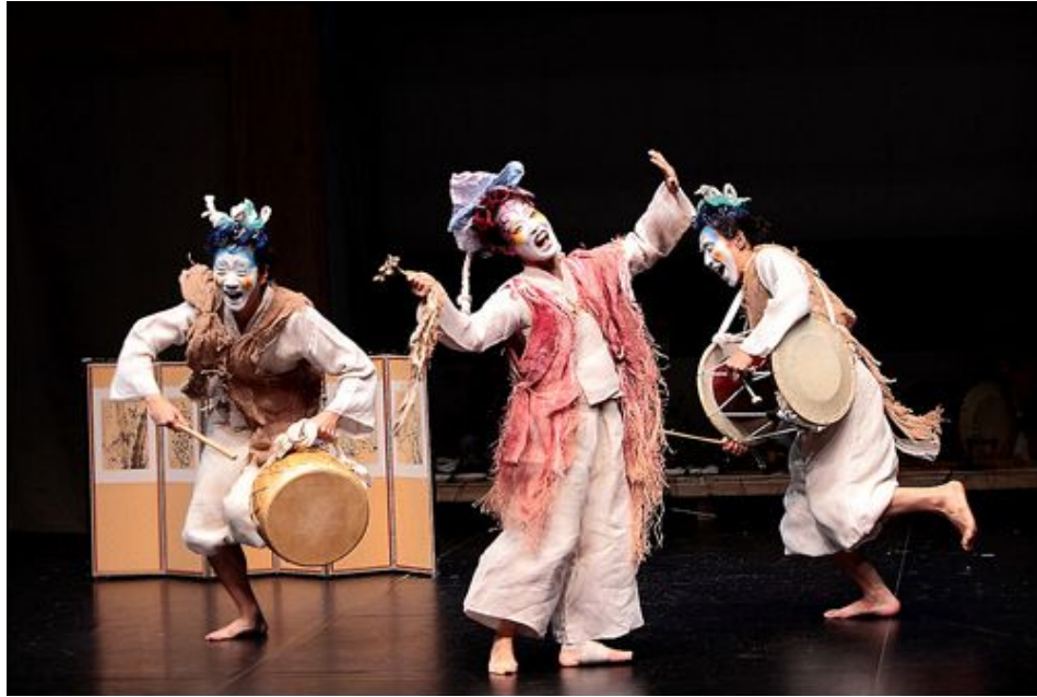
<그림 3> 극단 '여행자' 공연사진 I