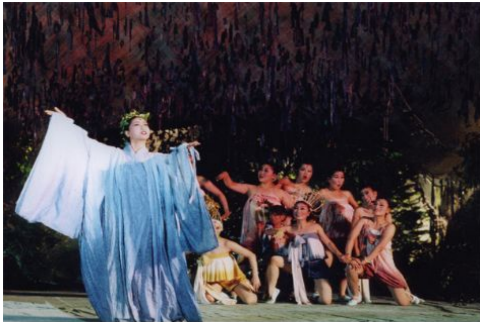
<그림 1> 극단 ‘미추’의 공연사진 I