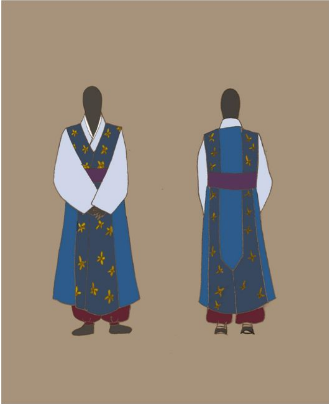
<그림 10> 작품Ⅱ 일러스트레이션