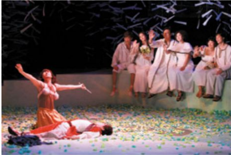
<그림 5> 극단 ‘한양레퍼토리’의 공연사진 I