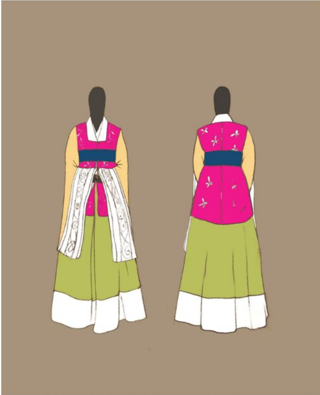
<그림 7> 작품 I 일러스트레이션