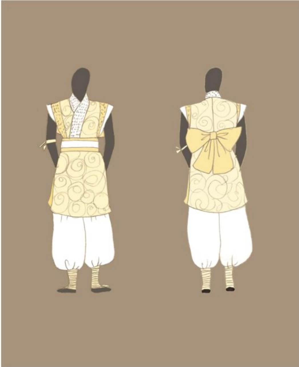
<그림 19> 작품 V 일러스트레이션