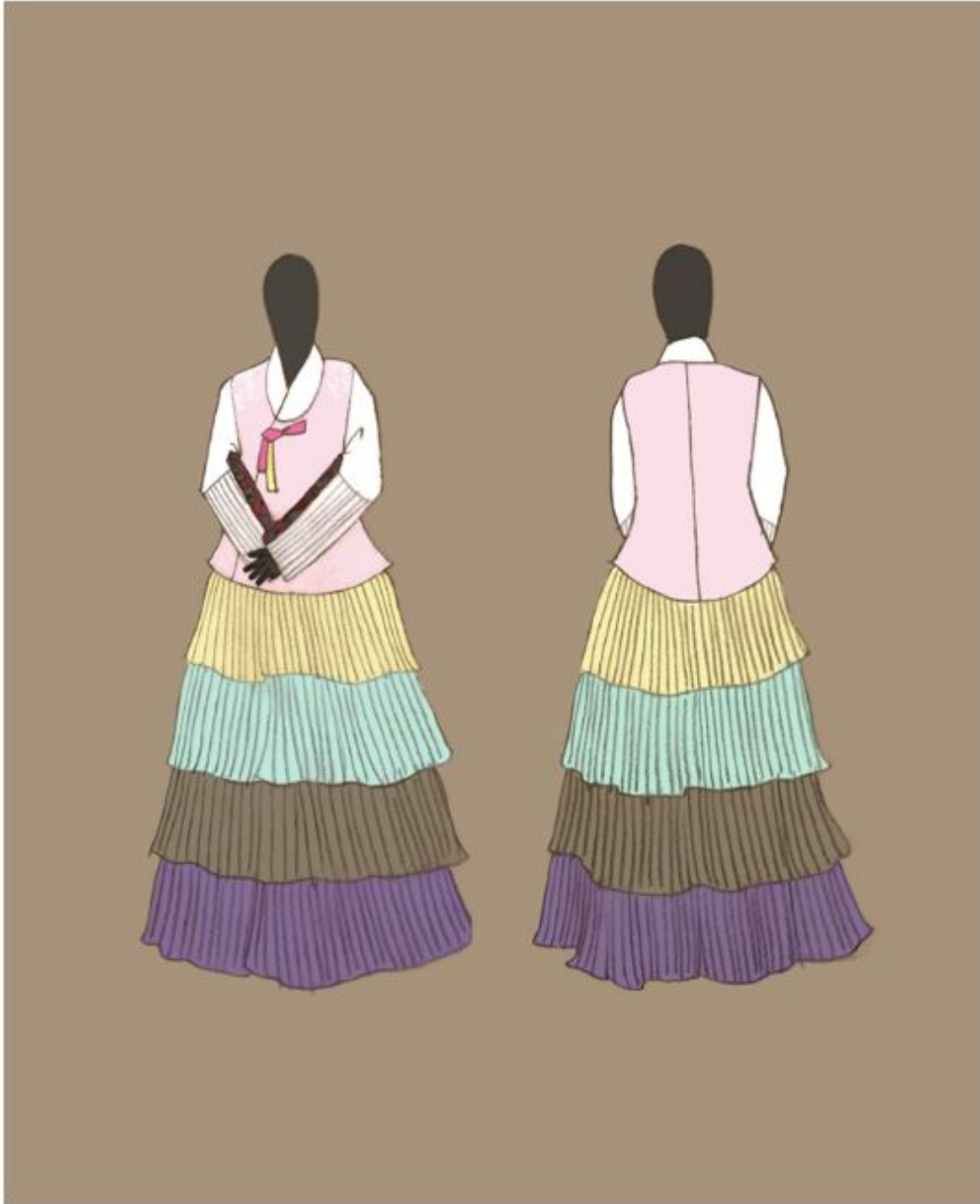
<그림 13> 작품Ⅲ 일러스트레이션