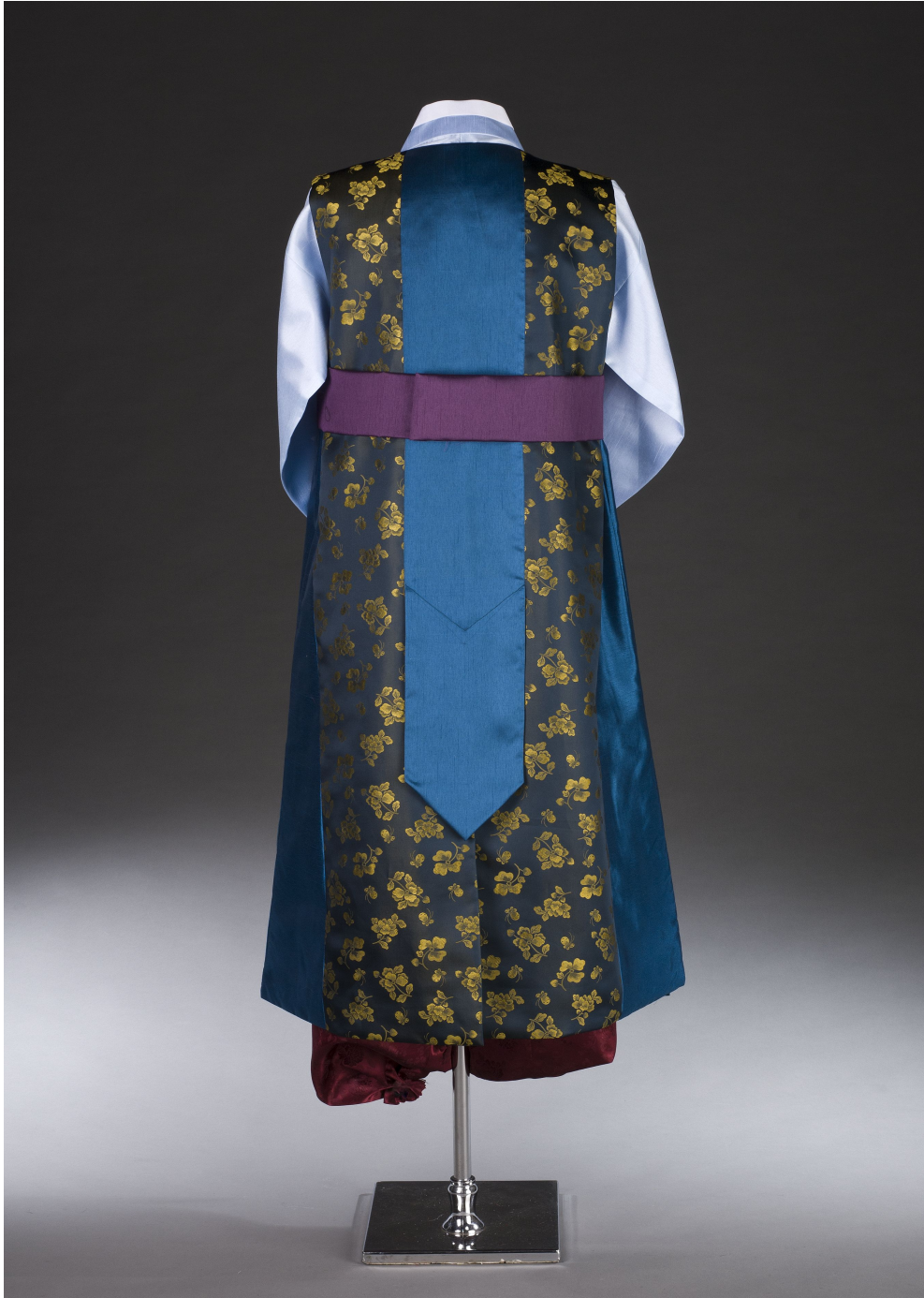
<그림 12> 작품Ⅱ 뒤