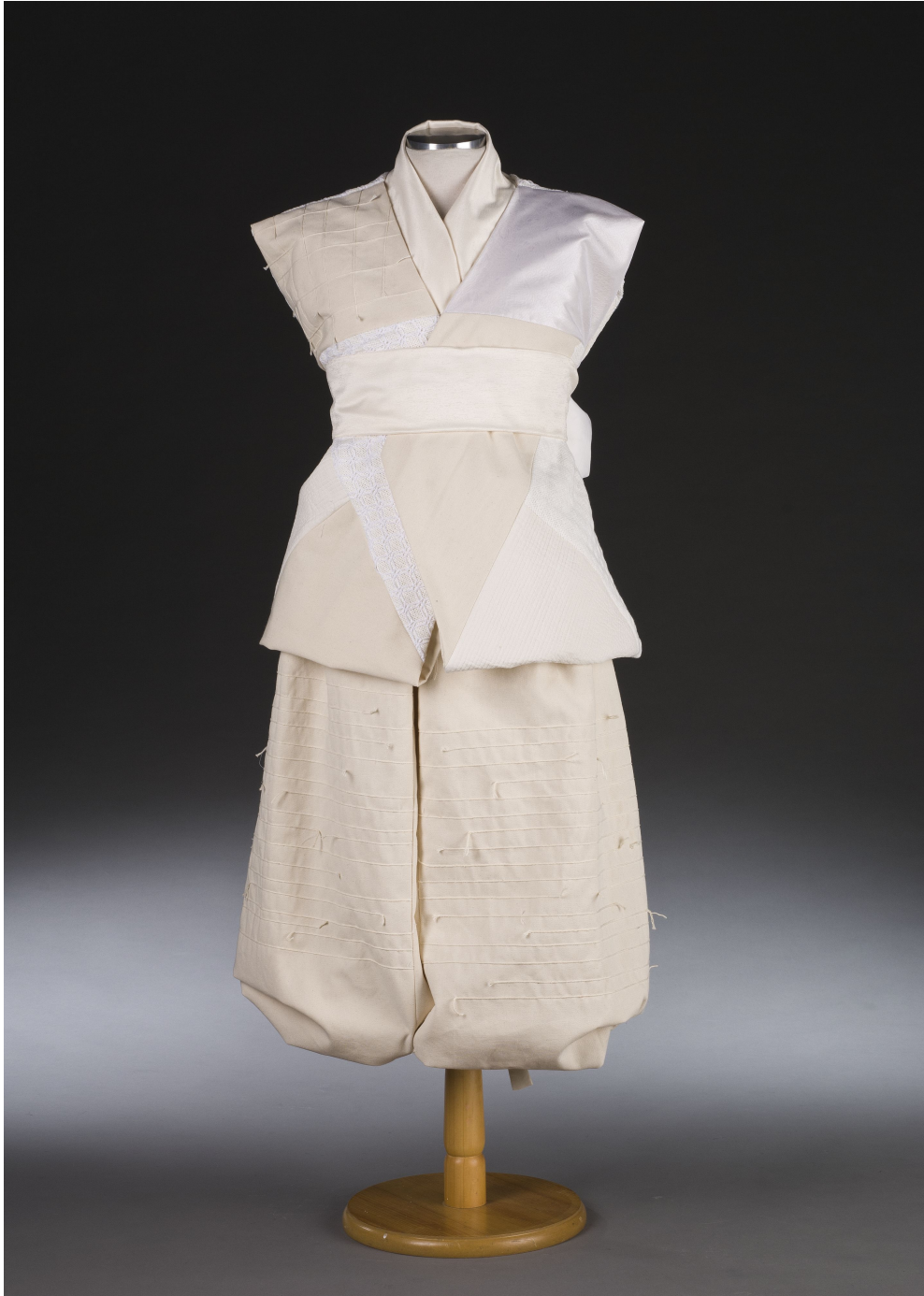
<그림 26> 작품Ⅶ 앞