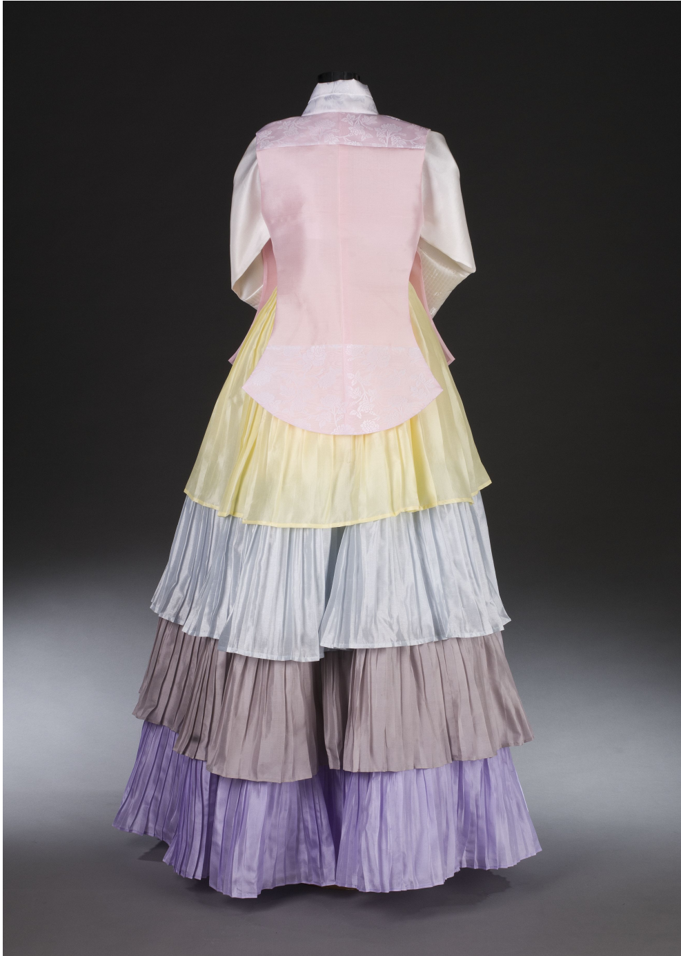
<그림 15> 작품Ⅲ 뒤