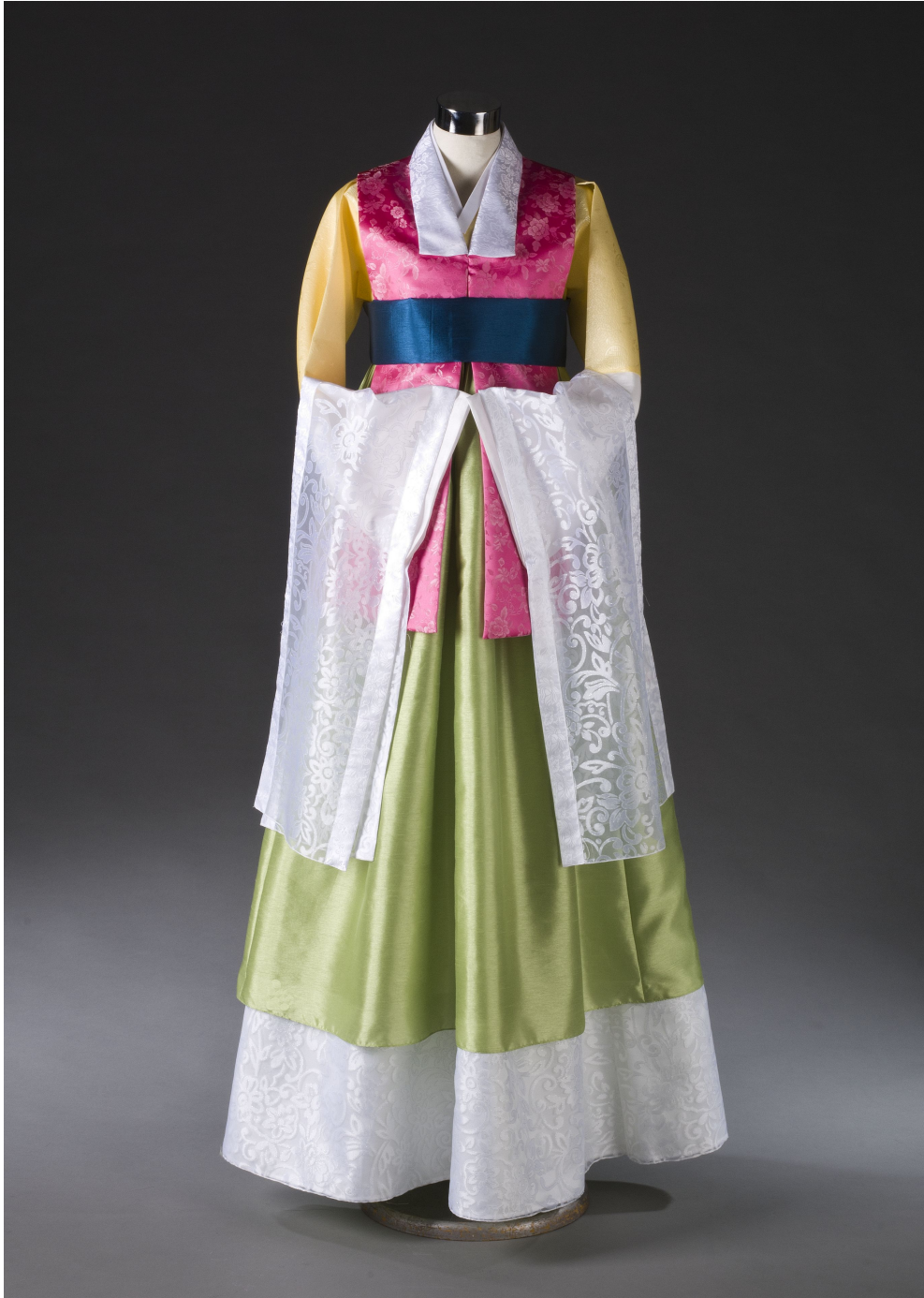
<그림 8> 작품 I 앞