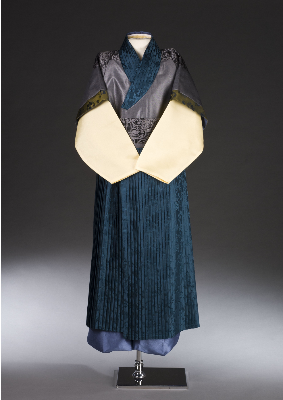
<그림 17> 작품Ⅳ 앞