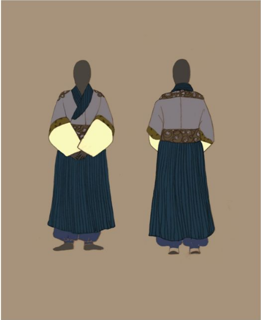
<그림 16> 작품Ⅳ 일러스트레이션