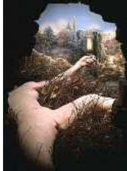
31. 마르셀 뒤샹, <주어진: 1. 폭포 2. 점등된 가스등(Étant donnés: 1° la chute d'eau, 2° le gaz d'éclairage...)>, 1946-1966