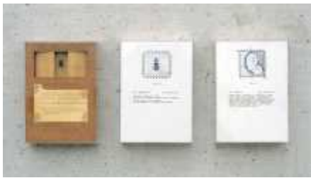
20. 메리 켈리, <산후 기록 (Post-Partum Document)>, 1973-1979