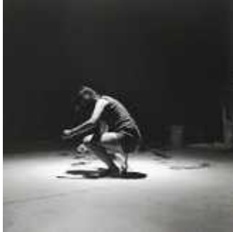
25. 구보타 시게코, <버자이너 페인팅(Vagina Painting)>, 1965