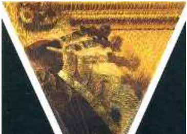
2. 자코모 발라, <바이올리니스트의 리듬(The Hand of the Violinist)>, 1912