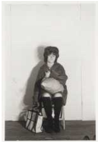
45. <버스 승객(Bus Riders)>, 1975