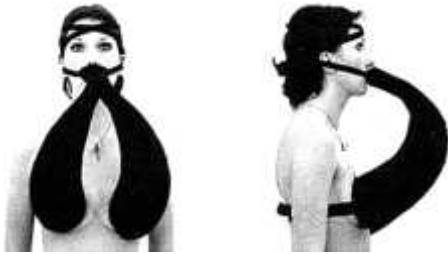
56. <풍요의 뿔, 두 가슴을 위한 만남(Cornucopia, Séance for Two Breasts)>, 1970