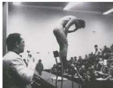
6. <예술과 혁명(kunst und revolution)>, 1968