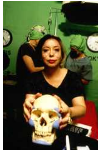
18. 오를랑, <성녀 오를랑의 환생(The Reincarnation of Saint-Orlan)>, 1990-1993