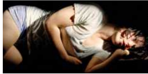
52. <무제 #86>, 1981