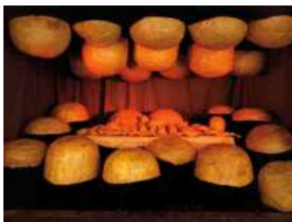
21. 루이스 부르주아, <아버지의 파괴(The destruction of the father)>, 1974