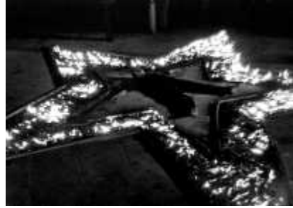
40. <Rhythm 5>, 1974