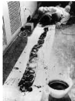
5. 백남준, <머리를 위한 선(Zen for Head)>, 1962