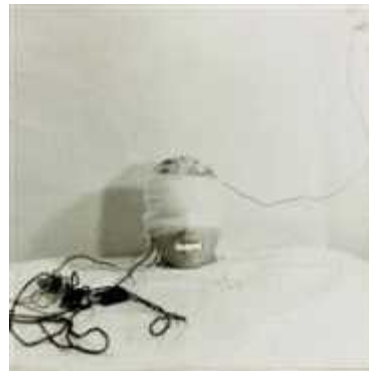
12. <네 번째 행동>, 1965