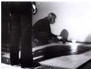
27. 발리 엑스포르트, <작열통(Kausalgie)>, 1973