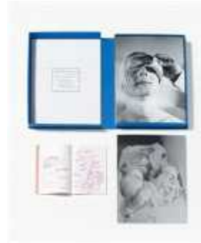
10. 루돌프 슈바르츠코글러, <두 번째 행동>, 1965