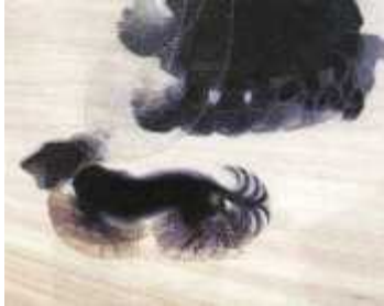
1. 자코모 발라, <줄에 묶인 개의 다이나미즘(Dynamism of A Dog on a Leash)>, 1912