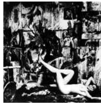
23. 캐롤리 슈니만, <아이 바디 #1(eye body #1)>, 1963