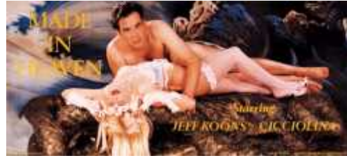
16. 제프 쿤스, <메이드 인 헤븐(Made in Heaven)>