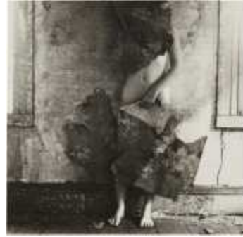
34. 프란체스카 우드만, <공간2>, 1977