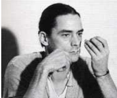
43. <유사성에 대한 대화(Talking about similarity)>, 1976