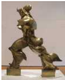
3. 움베르토 보치오니, <공간 속 연 속성의 특별한 형태들(Unique Form s of Continuity in Space)>, 1913