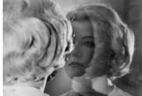
46. <무제 영화 스틸 #56>, 1980