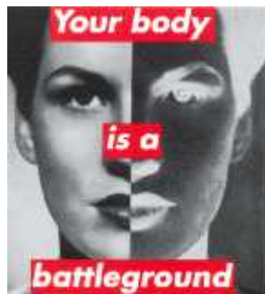
33. 바바라 크루거, <무제(너의 육체는 싸움터다)>, 1987