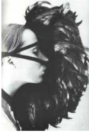
55. <수탉 깃털 마스크(Cockfeather Mask)>, 1973