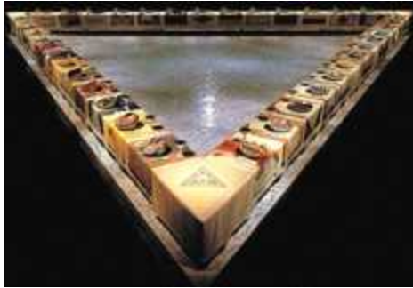
19. 주디 시카고, <디너 파티(dinner party)>, 1974-1979