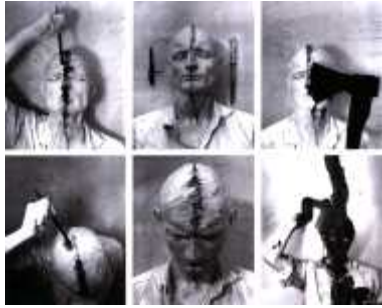
7. 권터 브루스, <스스로 그리기, 스스로 절단하기(Self-Painting, Self-mutilation)>, 1965