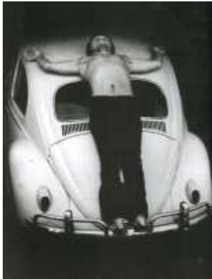
14. <관통(Trans-Fixed)>, 1974