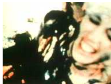
24. 캐롤리 슈니만, <고기의 즐거움 (Meat Joy)>, 1964