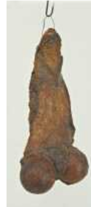
22. 루이스 부르주아, <소녀>, 1968