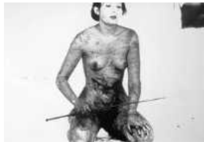
36. 마리나 아브라모비치, <토마스의 입술(Thomas Lips)>, 1975