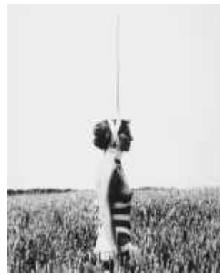
53. 레베카 호른, <유니콘(Unicorn)>, 1971