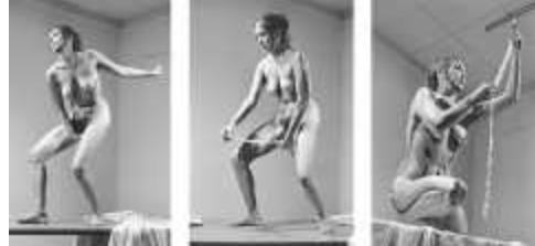
28. 캐롤리 슈니만, <내밀한 두루마리(Interior Scroll)>, 1975