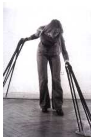
54. <손가락 장갑(Finger Gloves)>, 1972