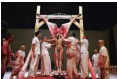
9. 헤르만 니취, <망아적이고 비밀스런 종교의식(Orgien Mysterien Theater)>, 1962-1998