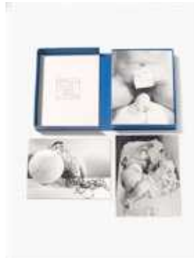
11. <세 번째 행동>, 1965