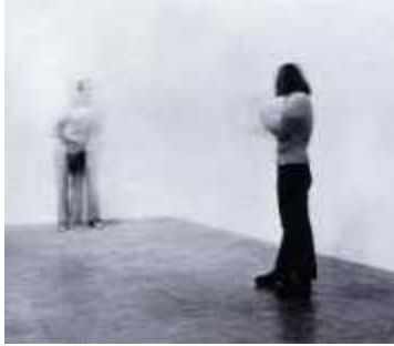
13. 크리스 버든, <발사(Shoot)>, 1971