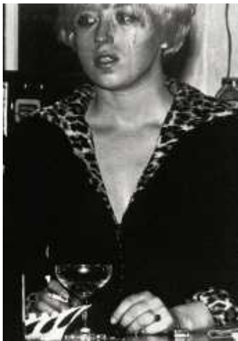
51. <무제 영화 필름 #27>, 1979