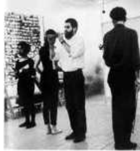
4. 앨런 캐프로, <여섯 부분으로 구 성된 18 해프닝(18 Happenings in 6 Parts)>, 1959