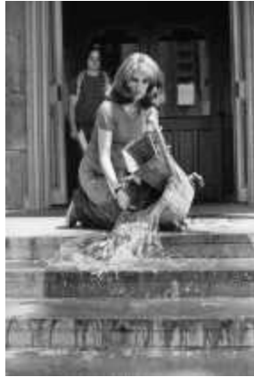
26. 미얼 래더맨 유켈리스, <유지보수 예술 퍼포먼스(Maintenance Art Performances)>