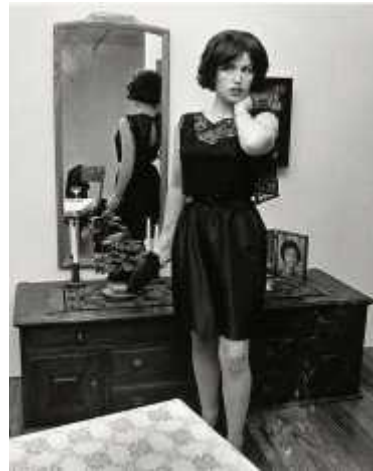
47. <무제 영화 스틸 #14>, 1978