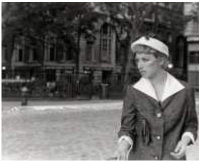
50. <무제 영화 필름 #23>, 1978