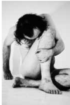
15. 비토 아콘치, <트레이드마크 (Trademarks)>, 1970