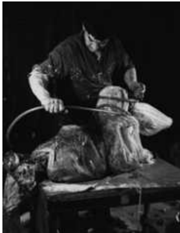
8. 오토 뮐, <물질적인 행위(Material-aktion)>, 1965