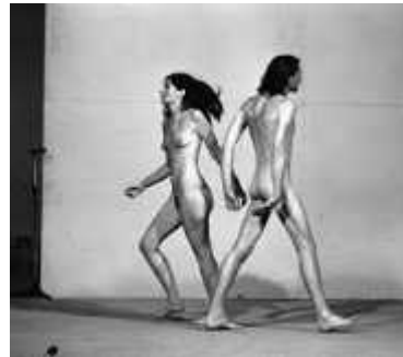
42. <공간 속의 관계(Relation in Space)>, 1976