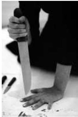
38. <Rhythm 10>, 1973