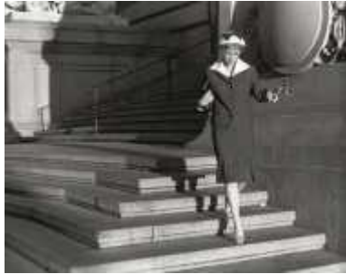
49. <무제 영화 필름 #22>, 1978