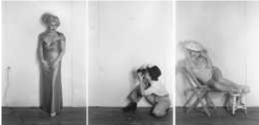
44. 신디 셔먼, <살인 미스터리 인물(Murder Mystery People)>, 1976