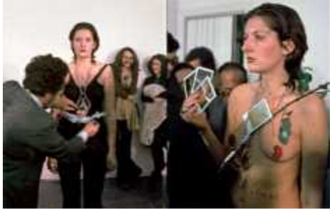
37. <Rhythm 0>, 1974