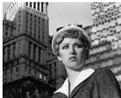
48. <무제 영화 스틸 #21>, 1978