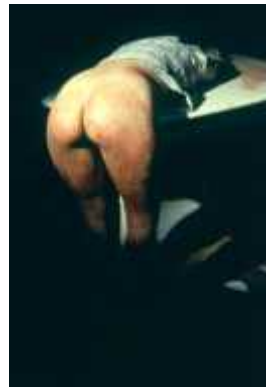
30. 아나 멘디에타, <무제(강간 현장)>, 1973