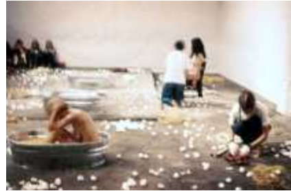
29. 주디 시카고, 수잔 레이시, 산드라 오겔, 아비바 라흐마니, <목욕의례(Ablutions)>, 1972