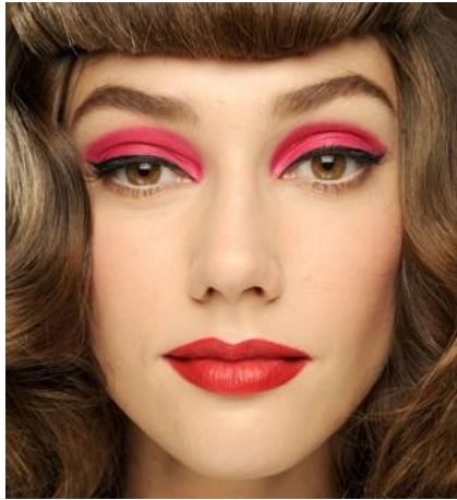
<그림 9> 2011 S/S Paris Christian Dior ( http://runway.vogue.co.kr/2010/10/26/ready-to-wear-2011-ss-christian-dior/#1:49 ) 검색일: 2018.03.08.