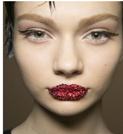
<그림 12> 2013 S/S Couture Christian Dior ( http://www.livingly.com/runway/Couture+/Spring+2013/Christian+Dior/Backstage/54nsCDJEmzl ) 검색일: 2018.03.09.