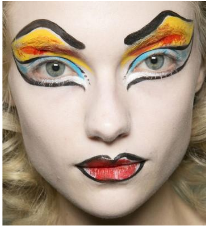
<그림 21> 2012 F/W London Vivienne Westwood ( http://www.livingly.com/runway/London+Fashion+Week+Fall+2013/Vivienne+Westwood/Backstage/hOp18dDdfdC ) 검색일: 2018.03.18.