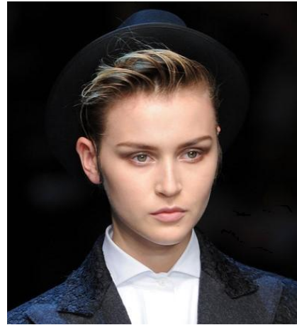
<그림 2> 2011 F/W Milan Dolce & Gabbana ( http://www.livingly.com/runway/Milan+Fashion+Week+Fall+2011/Dolce+Gabbana/Details/oYSjpytw-p5 ) 검색일: 2018.03.04.