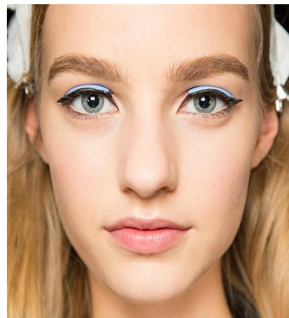
<그림 8> 2015 S/S Milan Fendi ( http://runway.vogue.co.kr/2014/09/19/ready-to-wear-2015-ss-fendi/#1:19 ) 검색일: 2018.03.08.