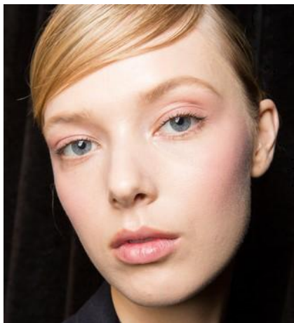
<그림 7> 2017 F/W New York Marchesa ( http://www.livingly.com/runway/New+York+Fashion+Week+Fall+2017/Marchesa/Backstage/BH1zpu45wyx ) 검색일: 2018.03.07.