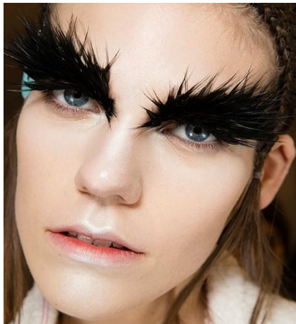
<그림 27> 2014 F/W Prais Alexander McQueen ( http://runway.vogue.co.kr/2014/03/05/ready-to-wear-2014-fw-alexander-mcqueen/#1:22 ) 검색일: 2018.03.22.