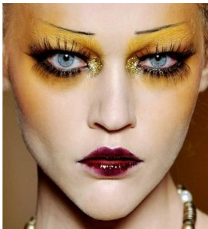
<그림 23> 2009 F/W Paris Christian Dior ( http://www.livingly.com/runway/Paris+Fashion+Week+Fall+2009/Christian+Dior/Details/EVfBLgX7Id9 ) 검색일: 2018.03.19.