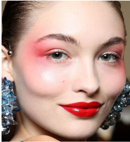
<그림 25> 2017 S/S Prais Kenzo ( http://www.vogue.co.uk/gallery/springsummer-2017-backstage-beauty ) 검색일: 2018.03.21.