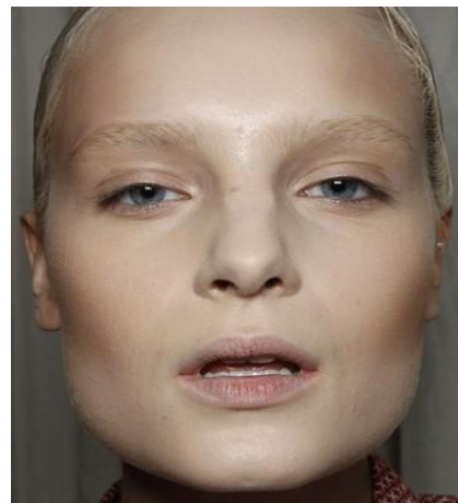
<그림 24> 2012 S/S London Vivienne Westwood ( http://www.livingly.com/runway/London+Fashion+Week+Spring+2012/Vivienne+Westwood/Backstage/PqX4mZlpHvc ) 검색일: 2018.03.20.