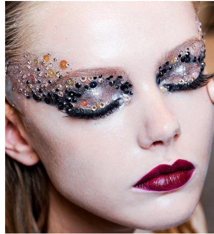
<그림 26> 2011 F/W Couture Christian Dior ( http://makeupforlife.net/2011/07/runway-beauty-christian-dior-couture-2011.html ) 검색일: 2018.03.22.