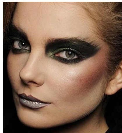
<그림 20> 2009 F/W New York Marc Jacobs ( http://makeupforlife.net/2009/02/backstage-makeup-breakdown-marc-jacobs-fall2009-at-ny-fashion-week.html ) 검색일: 2018.03.17.