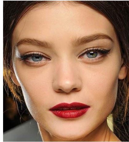
<그림 10> 2013 F/W Milan Dolce & Gabbana ( http://www.livingly.com/runway/Milan+Fashion+Week+Fall+2013/Dolce+Gabbana/Backstage/3S_cPWbTaH ) 검색일: 2018.03.08.