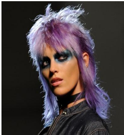
<그림 3> 2011 S/S Paris Jean Paul Gaultier ( http://runway.vogue.co.kr/2010/10/26/ready-to-wear-2011-ss-jean-paul-gaultier/#1:70 ) 검색일: 2018.03.05.