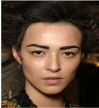
<그림 13> 2005 S/S Paris Alexander McQueen ( http://www.livingly.com/runway/ Paris+Fashion+Week+Spring+2005/ Alexander+McQueen/IGr7v4OS3fo ) 검색일:2018.03.10.