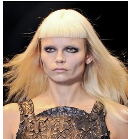
<그림 4> 2012 F/W Milan Versace ( http://www.livingly.com/runway/Versace/Milan+Fashion+Week+Fall+2012/Details/s-J3Pzhxh3i ) 검색일: 2018.03.05.