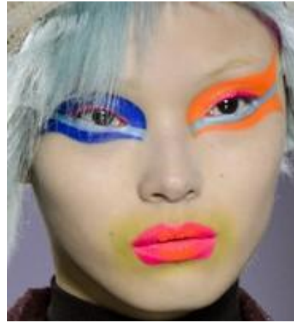
<그림 22> 2015 F/W Paris Maison Margiela ( http://www.livingly.com/runway/Paris+Fashion+Week+Fall+2015/MAISON+MARGIELA/Details/eGafXoXcUIR ) 검색일: 2018.03.18.