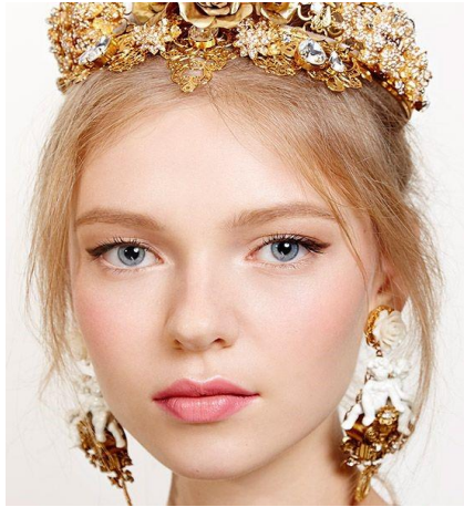
<그림 5> 2016 S/S Milan Dolce & Gabbana ( http://www.livingly.com/runway/Milan+Fashion+Week+Spring+2016/Dolce+Gabbana/Details/rShFO_JlPh3 ) 검색일: 2018.03.06.