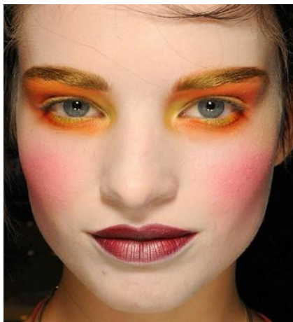
<그림 19> 2012 S/S Paris Vivienne Westwood ( http://www.livingly.com/runway/Paris+Fashion+Week+Spring+2012/Vivienne+Westwood/Backstage/hQkl5coQjjh ) 검색일: 2018.03.16.