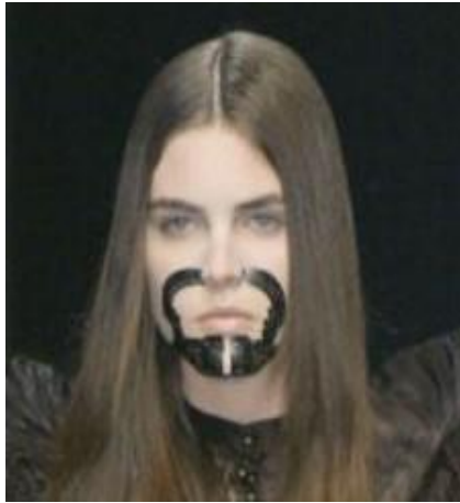
<그림 1> 2006 F/W Couture Givenchy ( http://www.livingly.com/runway/Couture+Fall+2006/Givenchy/J5qde_hhgS7 ) 검색일: 2018.03.04.