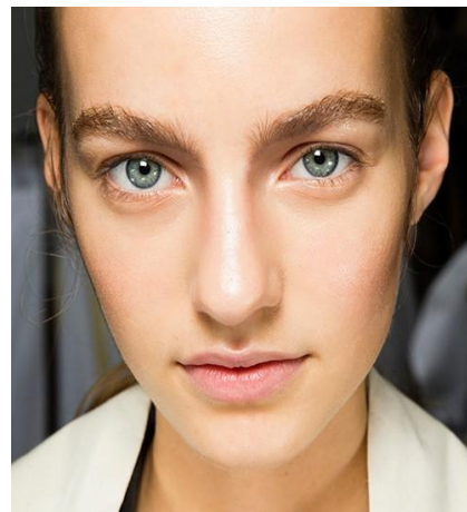
<그림 16> 2015 S/S Milan Marni ( http://runway.vogue.co.kr/2014/09 /22/ready-to-wear-2015-ss-marni /#1:4 ) 검색일:2018.03.12.