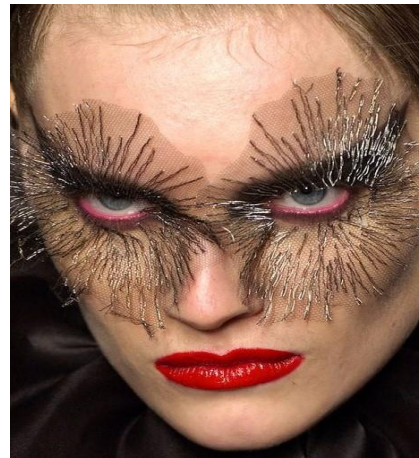
<그림 28> 2003 S/S Couture Balmain ( https://www.vogue.ru/collection/s2003/couture/paris/Balmain/detail/#gallery1/61972 ) 검색일: 2018.03.23.