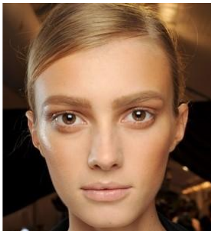
<그림 15> 2011 S/S Paris Chloe ( http://runway.vogue.co.kr/2010/10 /26/ready-to-wear-2011-ss-chloe /#1:39 ) 검색일:2018.03.11.