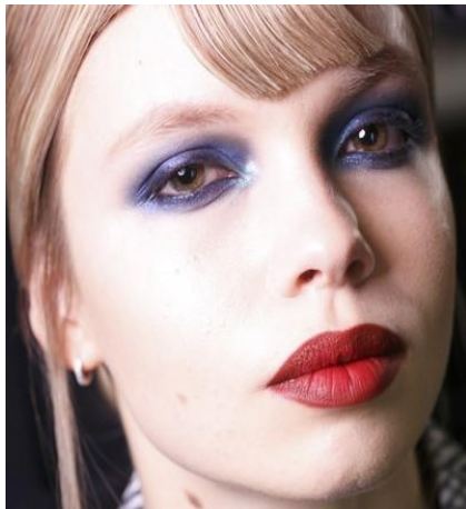
<그림 11> 2014 S/S New York Anna Sui ( http://www.livingly.com/runway/Anna+Sui/New+York+Fashion+Week+Spring+2014/Backstage/z2wX8LL1T5gl ) 검색일: 2018.03.09.