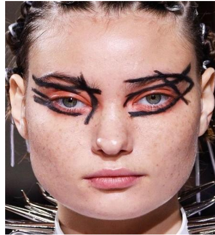
<그림 18> 2018 S/S Prais Junya Watanabe ( https://www.elle.com/beauty/makeup-skin-care/g12184682/spring-makeup-trends-2018/?slide=4 ) 검색일: 2018.03.16.