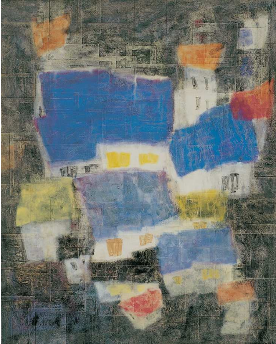
【작품 5】 사색의 시간-5, 종이, 채색, 130×162cm, 2005