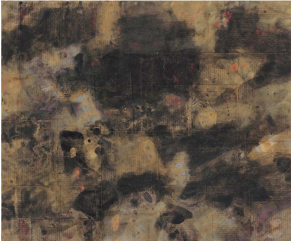
【작품 2】 사색의 시간-2, 종이, 채색, 73×61cm, 2005