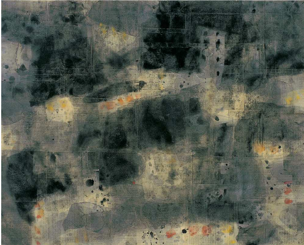
【작품 1】 사색의 시간-1, 종이, 채색, 91×73cm, 2005