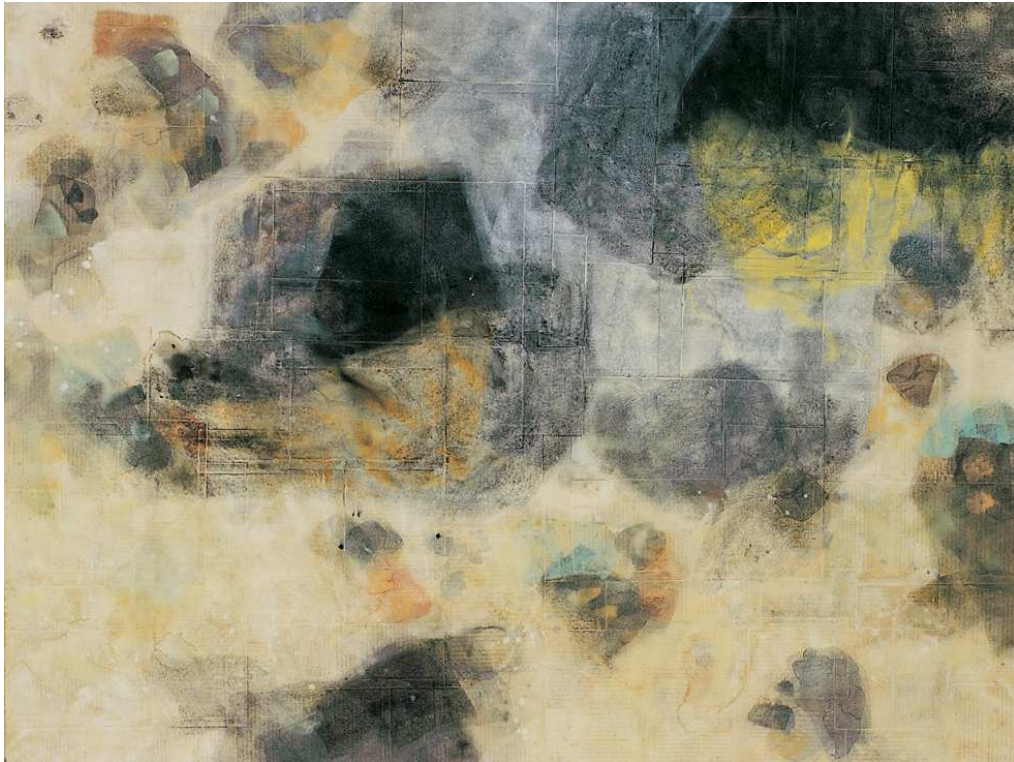
【작품 7】 사색의 시간-7, 종이, 채색, 140×107cm, 2005