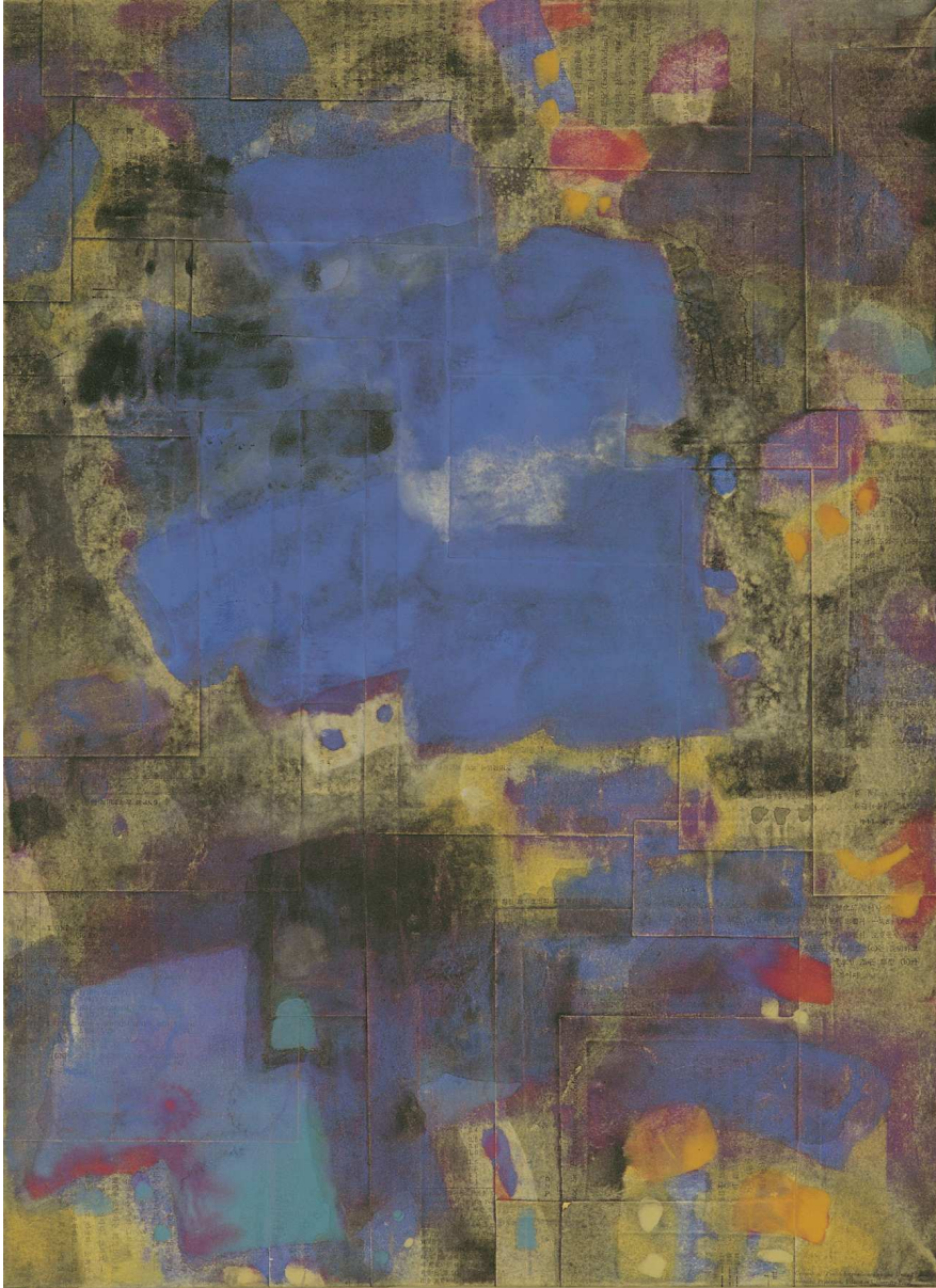
【작품 4】 사색의 시간-4, 종이, 채색, 41×56cm, 2005