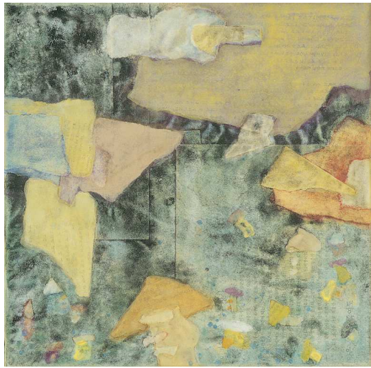
【작품 6】 사색의 시간-6, 종이, 채색, 20×20cm, 25×25cm, 2005