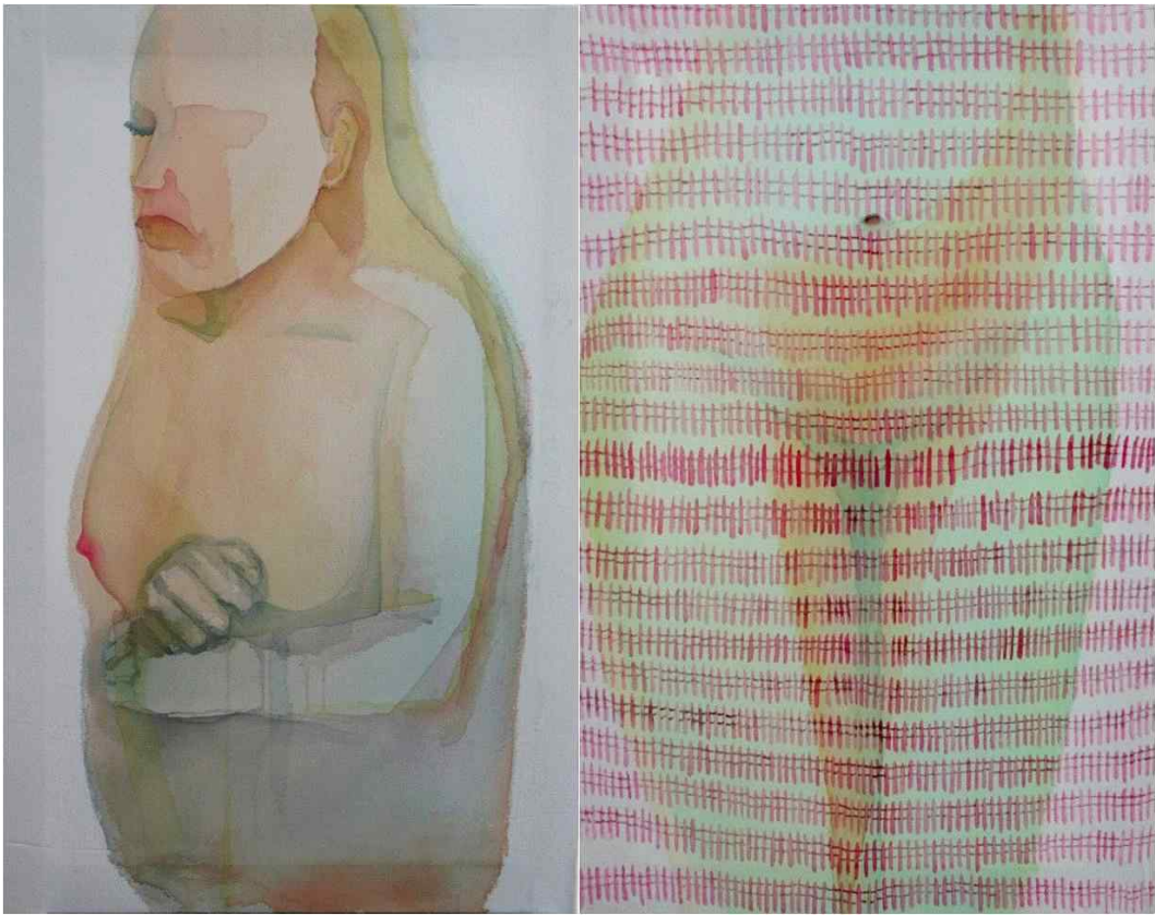
[작품 4] Untitled, 천에 아크릴, 68x48cm x2, 2013