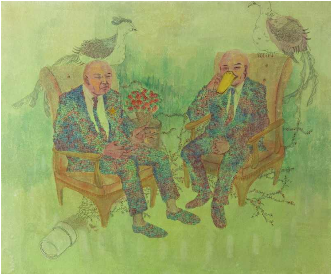
[작품 2] 그대와 의 대화, 장지에 혼합재료, 60.6x72.7cm, 2012