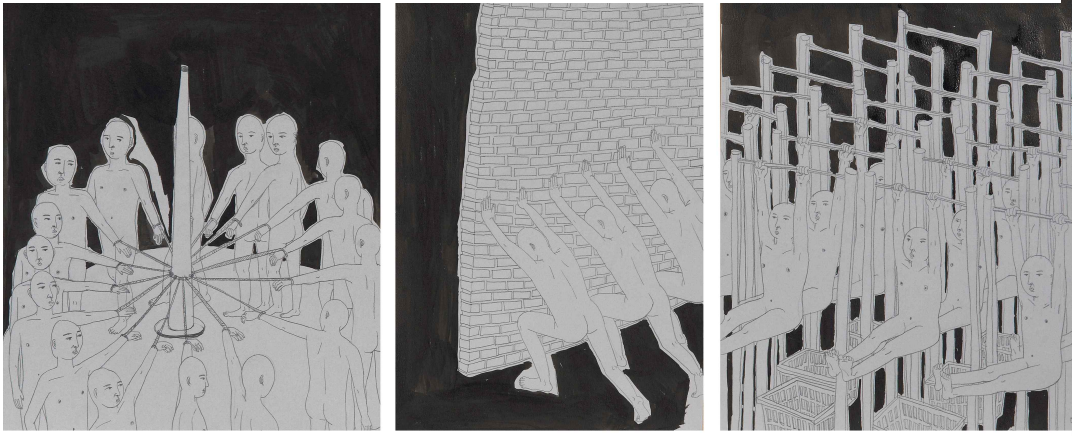
[작품 11 인고의 삼중경기, 종이에 연필, 먹, 39x80cm, 2014