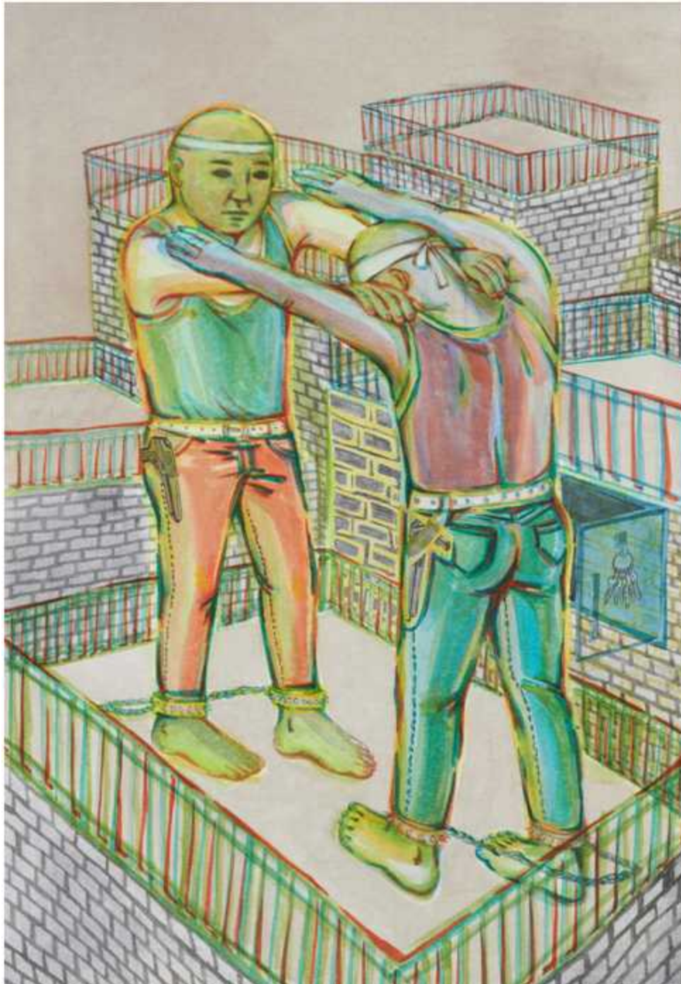
[작품 10] Final match, 장지에 혼합재료, 116.8x80.3cm, 2014