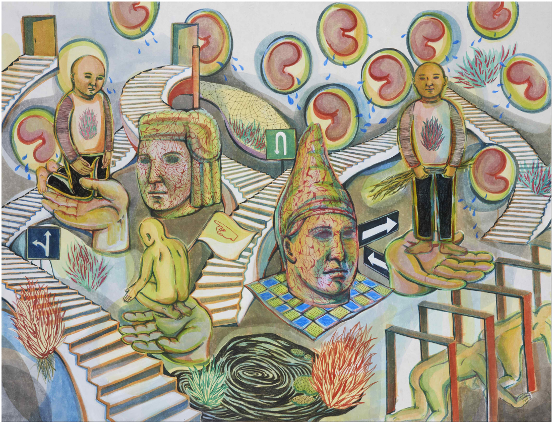
[작품 8] Human being, 장지에 혼합재료, 112x145cm, 2014