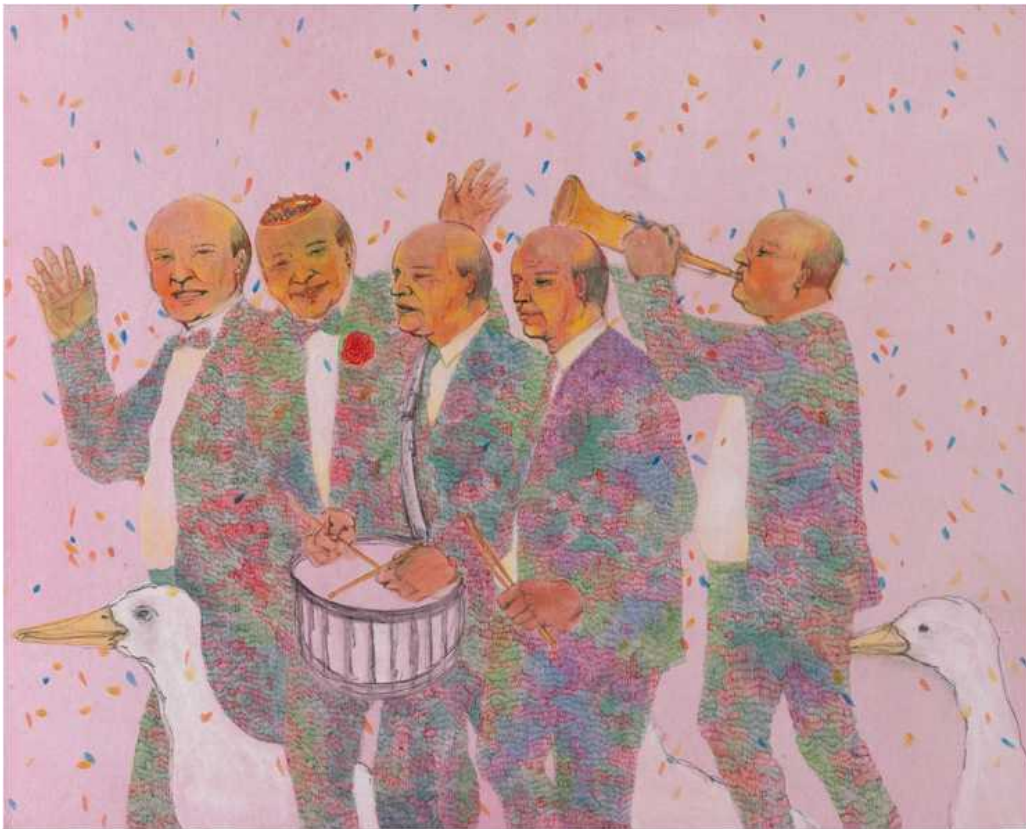
[작품 1] 그림에도 우리는, 장지에 혼합재료, 90.9x72.7cm, 2012