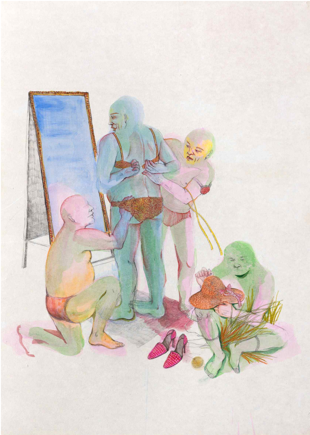
[작품 3] 오늘부터 우리는, 장지에 혼합재료, 108x77cm, 2012