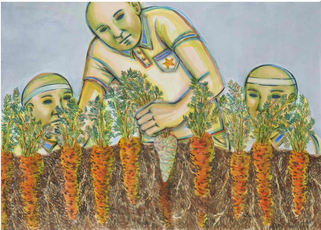
[작품 7] 체험학습, 장지에 혼합재료, 77.5x108cm, 2014