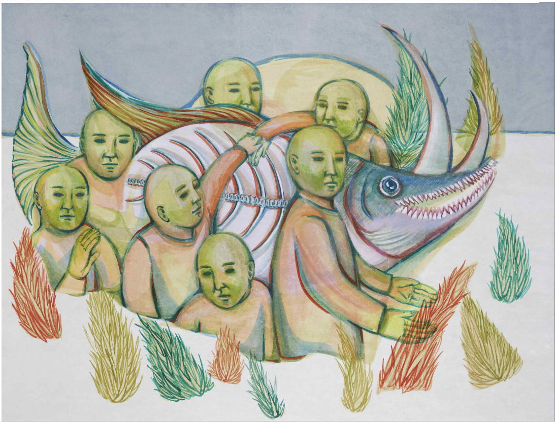
[작품 9] Suspending, 장지에 혼합재료, 97x130cm, 2014