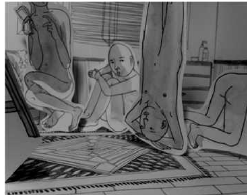
[작품 13] 이심전심(以心傳心), 램다프린트, 29.7x42cm x4, 2014