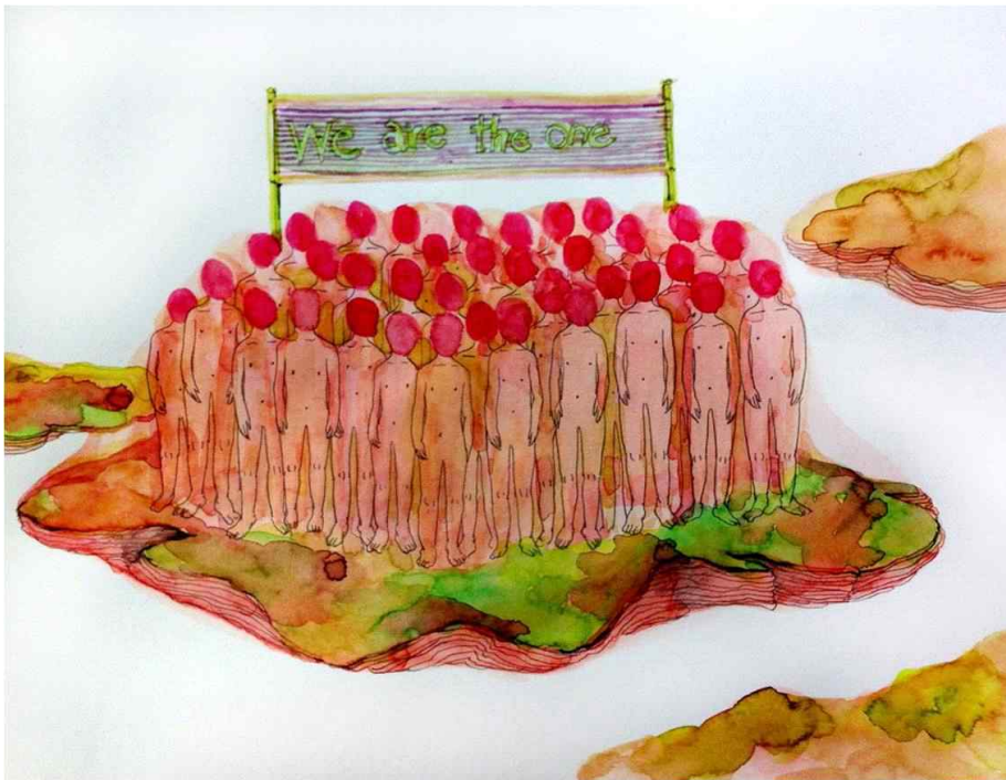
[작품 6] We are the one, 종이에 연필, 수채물감, 42x29cm, 2013