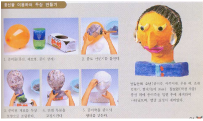
반달눈의 소년 (종이죽, 이쑤시게, 우유팩, 조개껍데기, 빨대/26cm), 장보경(학생작)