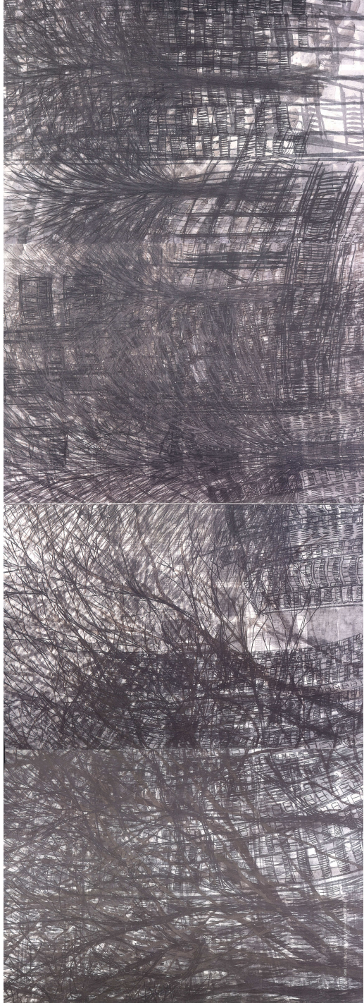
【작 품 6】 산책 - stroll, 600x210, 장지에 수묵채색, 목탄, 2003.