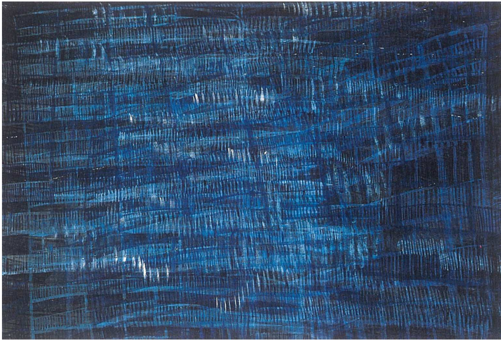
【작 품 7】 서서 - Be the head, 160×110cm, 장지에 수묵채색, 목탄, 2003