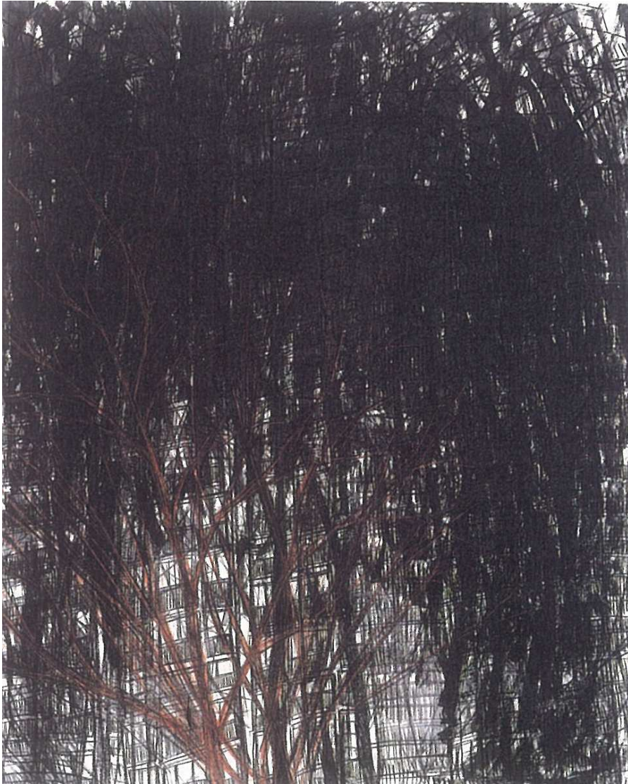
【작 품 5】 산책 - Take an outing, 130×160cm, 장지에 수묵채색, 목탄, 2003