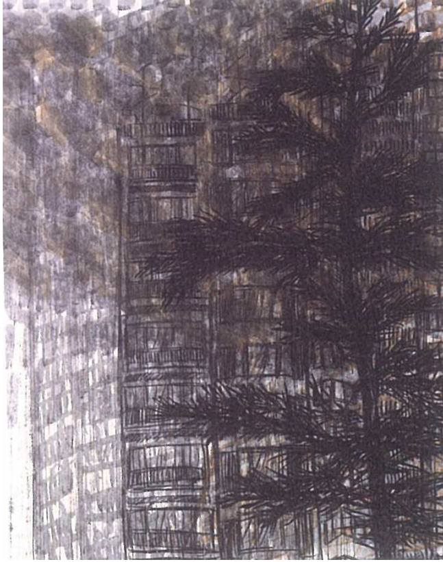
【작 품 2】 산책 - Take the air II, 90 X 116cm, 장지에 수묵채색, 2003