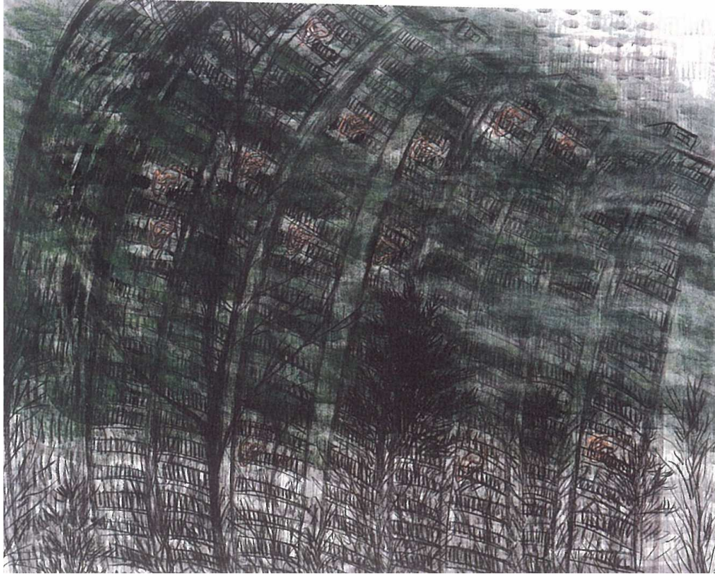
【작 품 3】 산책 - Take the air I, 160×130cm, 장지에 수묵채색, 목탄, 2003