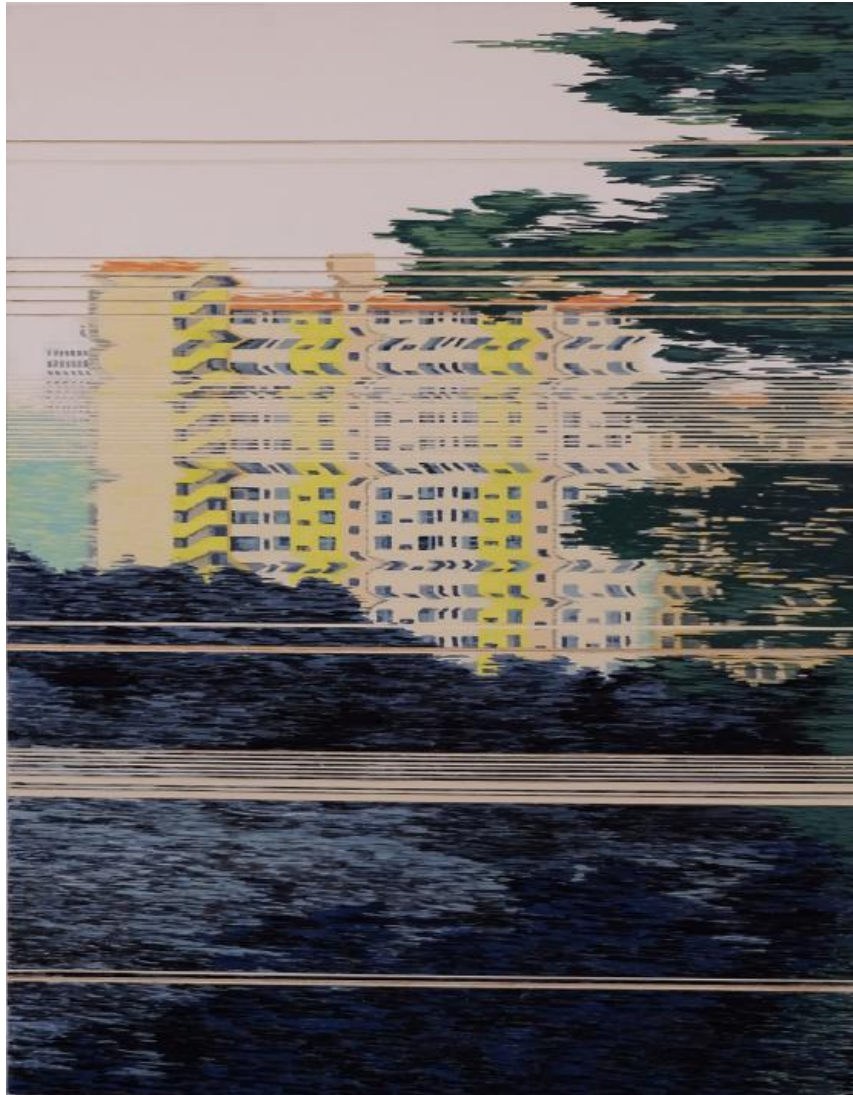
【작품 6】 류경희, 〈흐르다〉, 116cm × 91cm, 호분지에 혼합재료, 2016