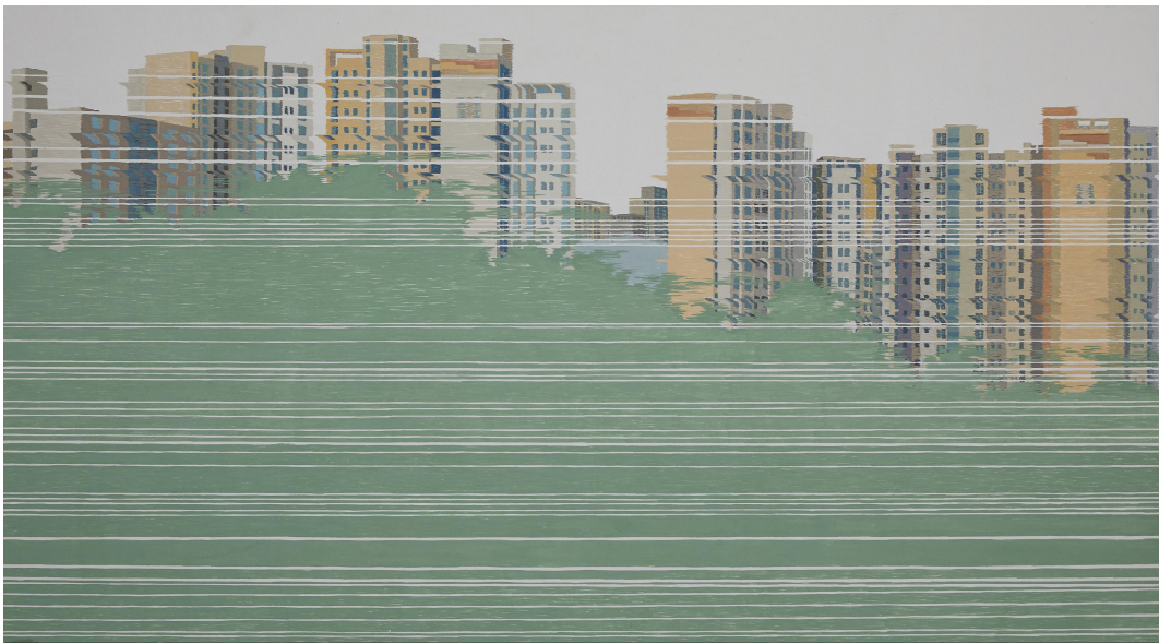
【작품 8】 류경희, 〈흐름...얻는 것과 지워진 일상〉, 112cm×162.2cm, 삼합지에 분채, 2016.