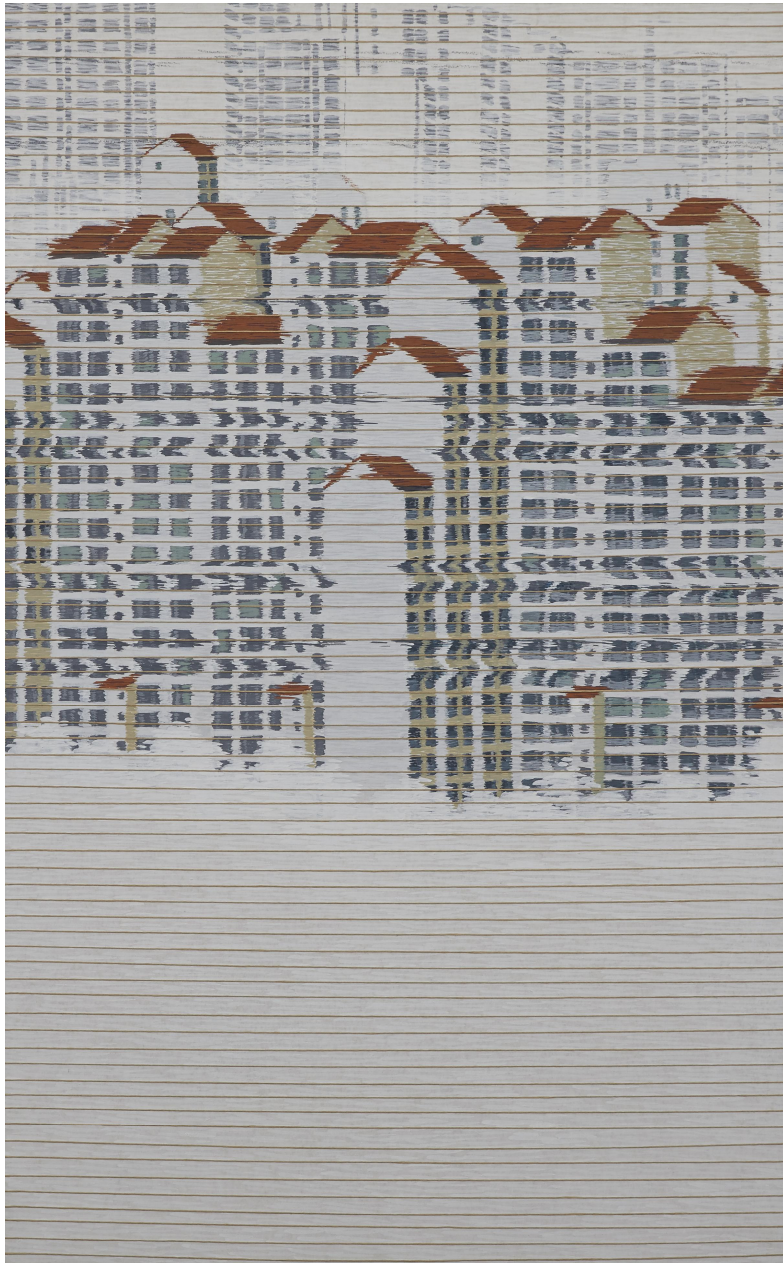
【작품 7】 류경희, 〈지금…바라보다〉, 116.8cm × 72cm, 삼합지 .분채. 종이끈, 2016