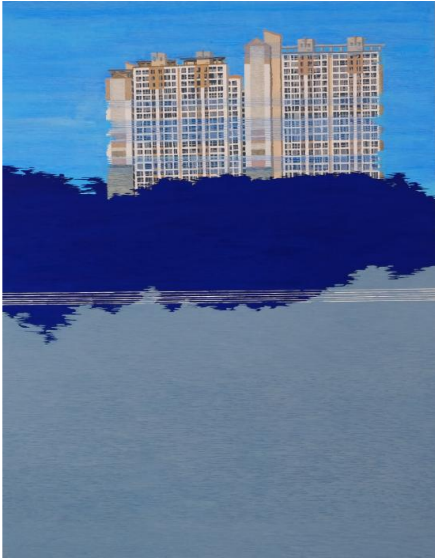
【작품 4】 류경희, 〈흐름 II〉 , 116cm × 96cm, 호분지에 분채, 2016