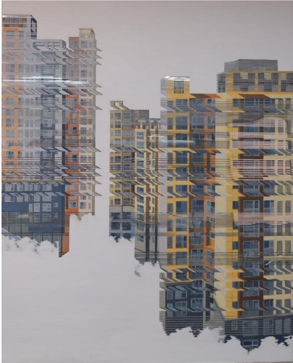
【작품 1】 류경희, 〈도시의 시간Ⅱ〉, 162cm×130cm, 거울에 혼합재료, 2017