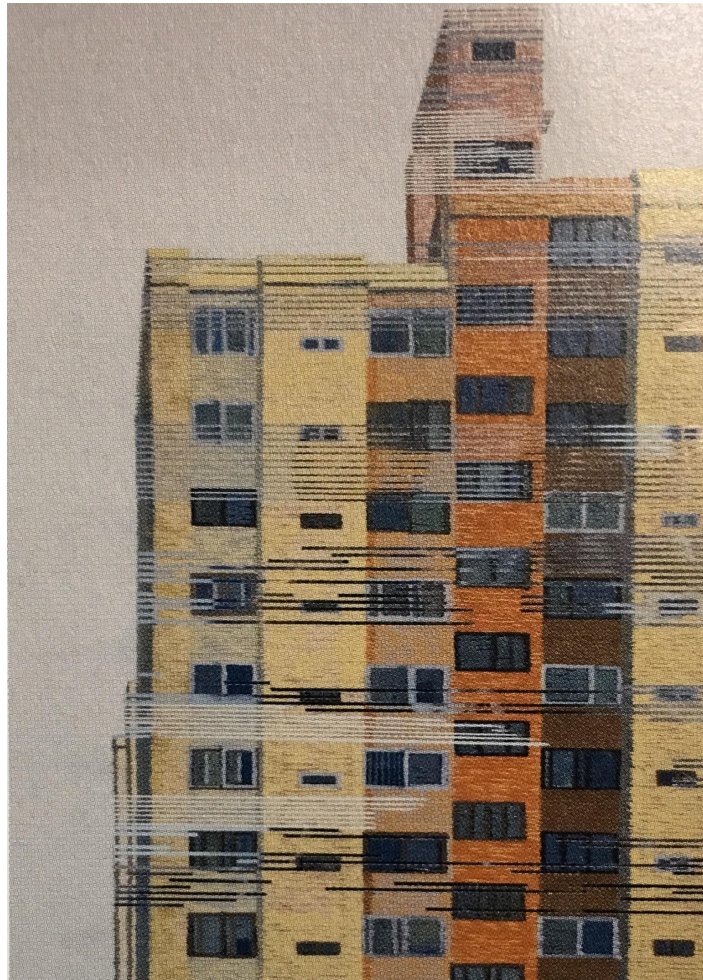
【작품 5】 류경희, 〈도시의 시간 III〉, 72cm × 53cm, 거울에 분채, 2017