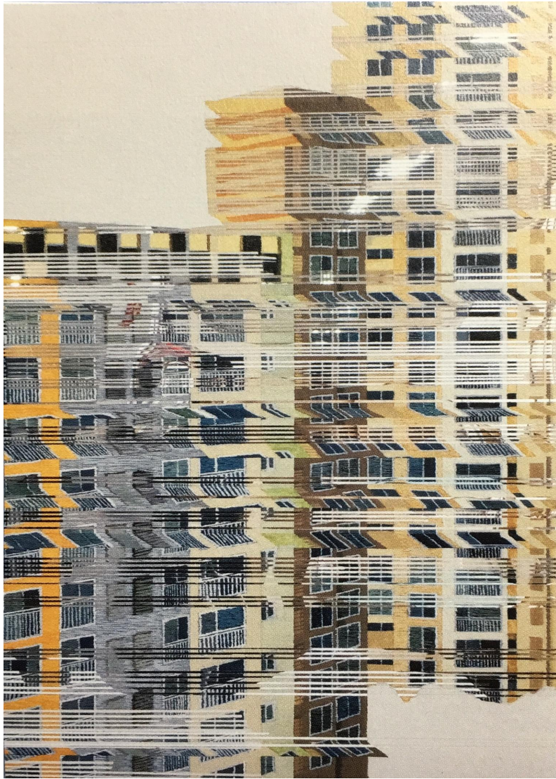
【작품10】 류경희, 〈시간…현재…〉, 40호, 거울에 혼합재료, 2017