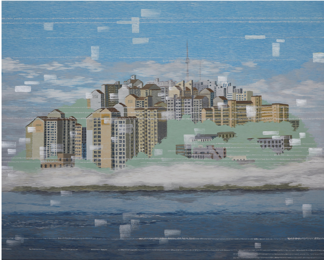
【작품 3】 류경희, 〈도시의 시간 I〉, 130cm×161cm, 호분지.분채.은분, 2016