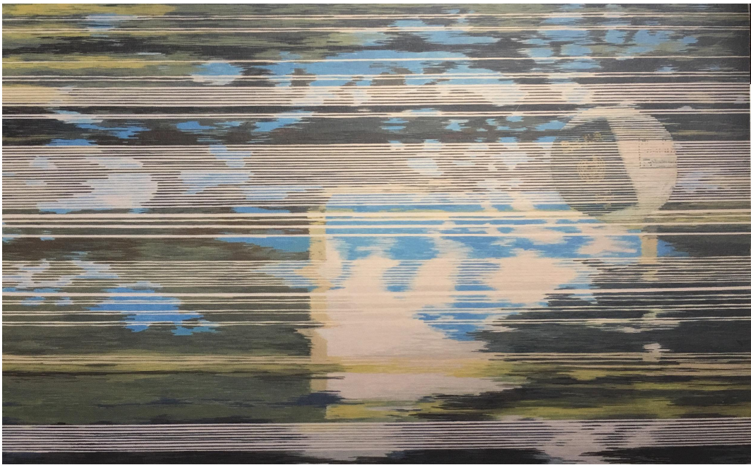
【작품12】 류경희, 〈555,840 seconds〉, 92cm×145.5cm, 삼합지에 분채, 2017