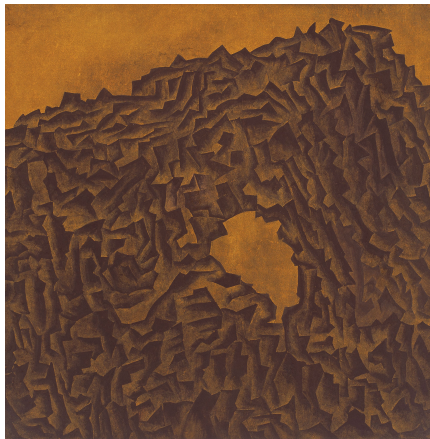
【작품 4】 홀림 길 장지에 채색 30 × 30cm 2007