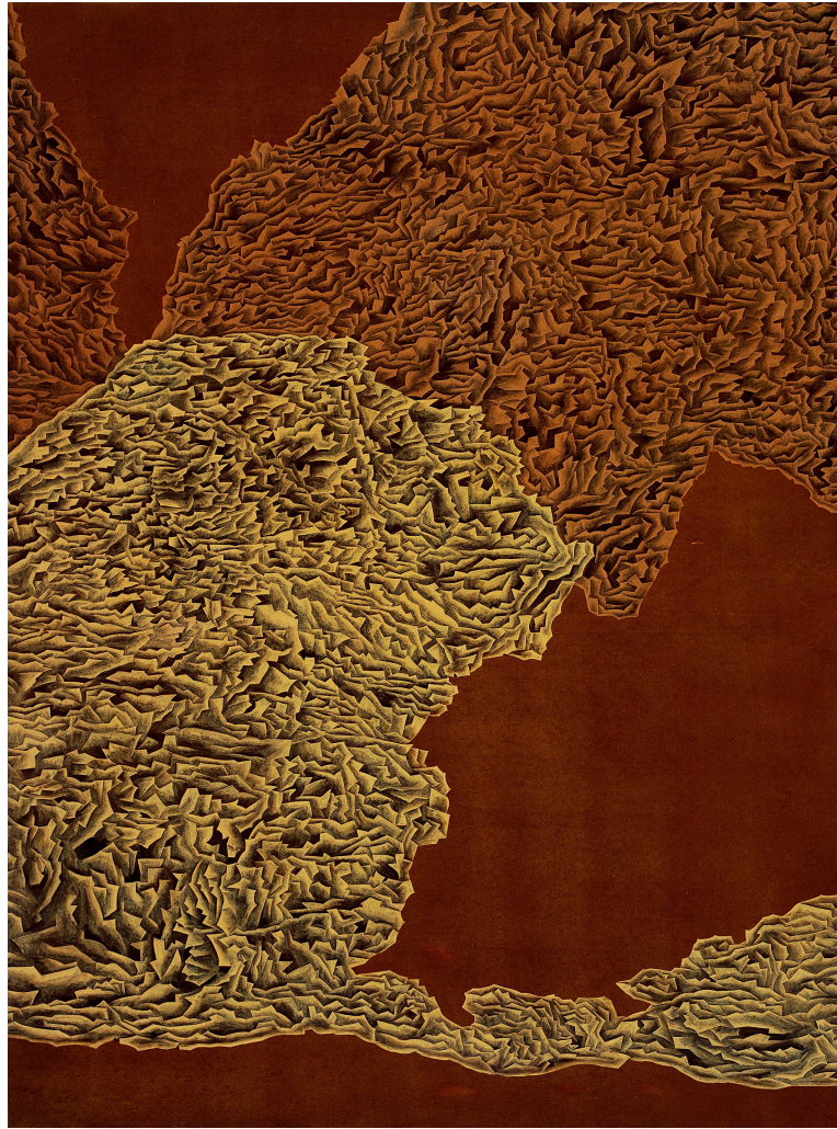
【작품 7】 홀림 길, 장지에 채색, 194 × 130.5cm 2007