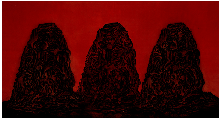
【작품 1】 홀림 길 , 장지에 채색, 130 × 344 cm 2007