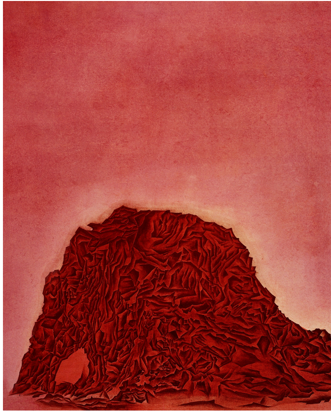
【작품 6】 홀림 길 장지에 채색 146 × 112cm 2007