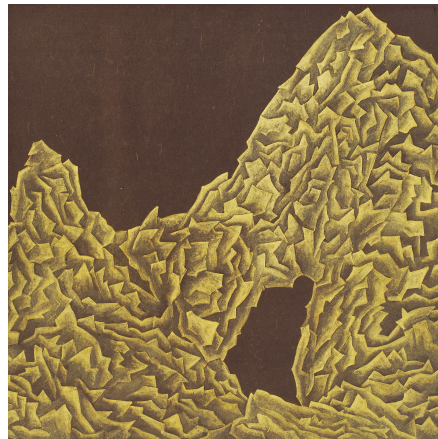
【작품 5】 홀림 길 장지에 채색 30 × 30cm 2007