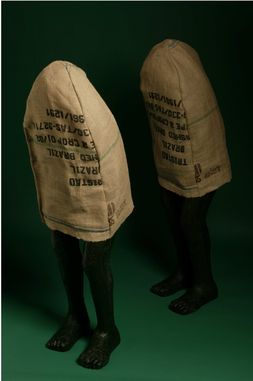
【작품 7】 The Flat boredom, Mixed Media, 45 x 55 x 160cm (20pieces),