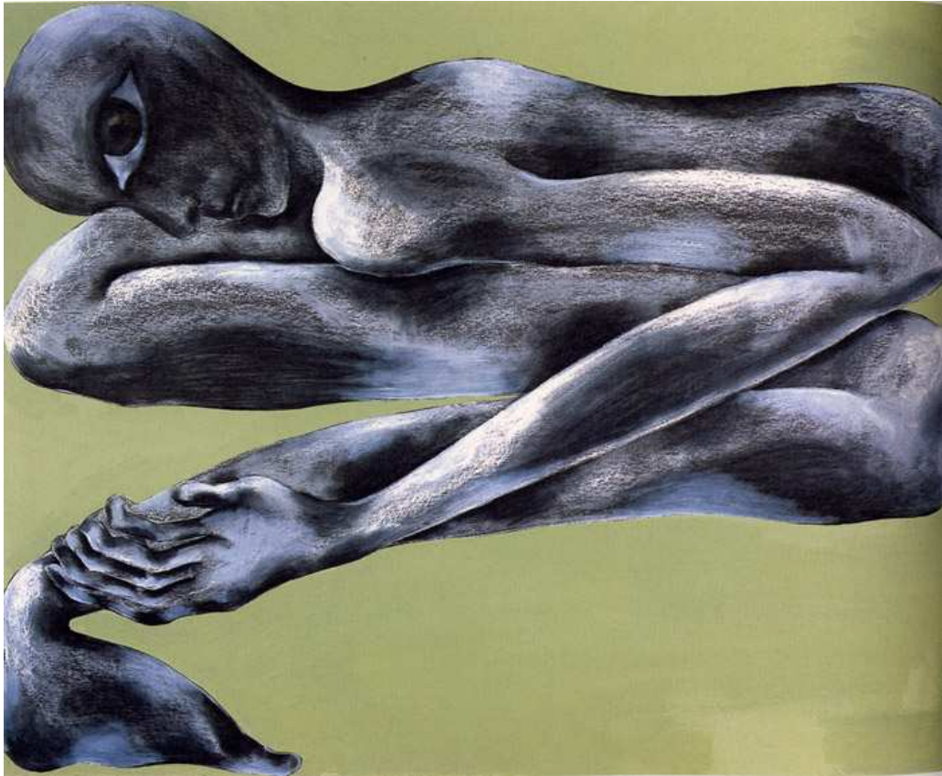
【작품 3】 Flat Man I, oil pastel, Conte, acryl color on board, 81 x 101cm