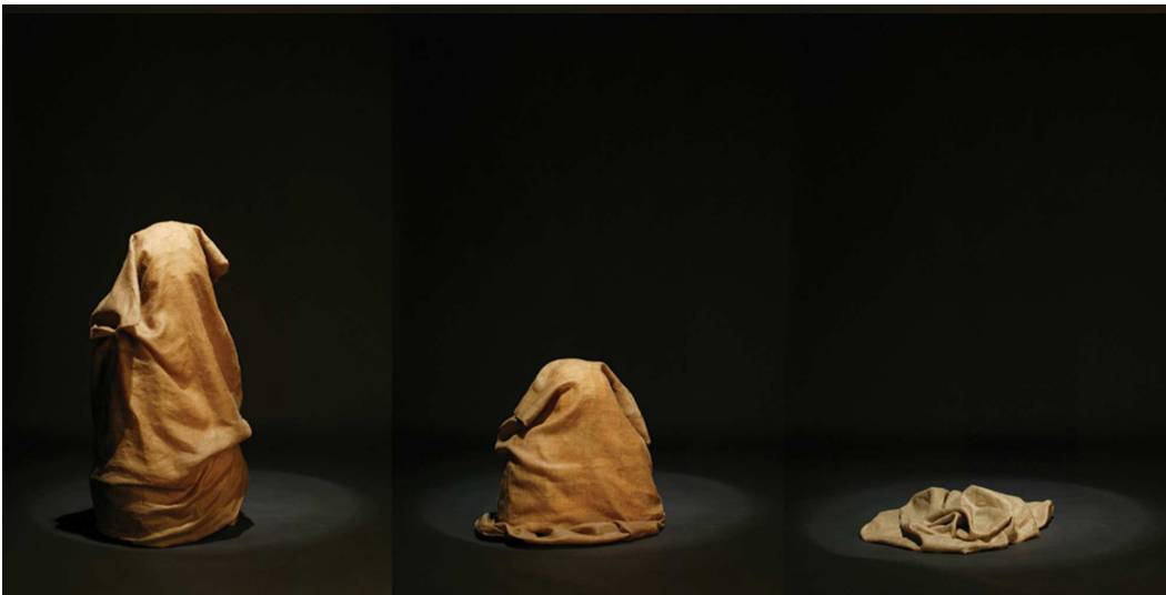
【작품 9】 Untitled, Mixed Media, 45 x 55(x20, x60, x100, x120, x140, x150)cm(가변적 설치), 2004