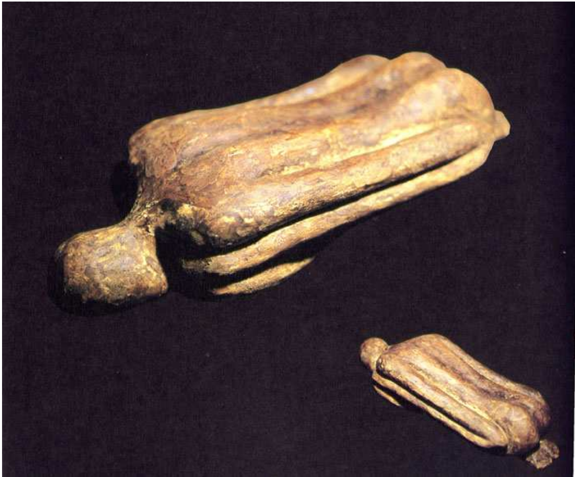
【작품 5】 Untitled, Plaster, Coffee, 44 x 17 x 9cm, 2004