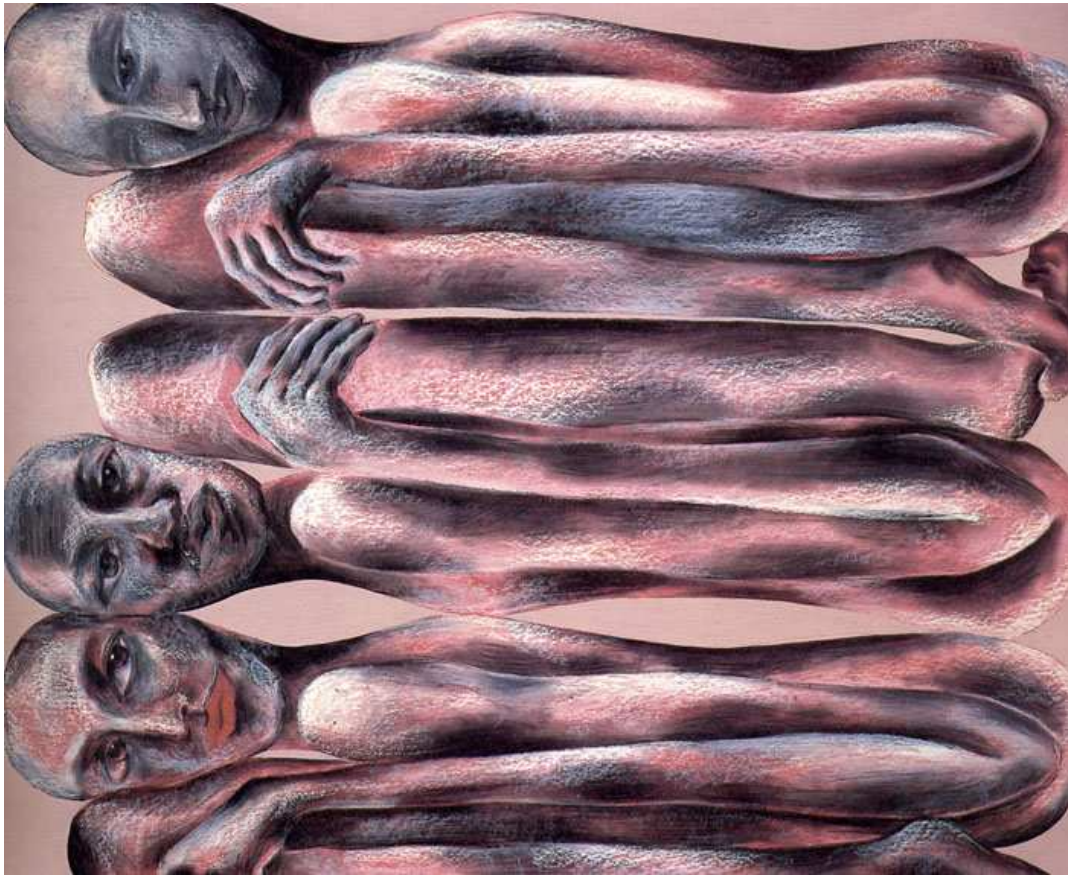
【작품 4】 Flat Man II, oil pastel, Conte, acryl color on board, 81 x 101cm , 2004