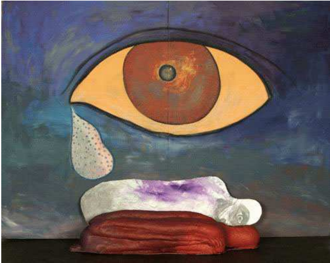
【작품 6】 Flat Man-Big eye, Mixed Media, 222 x 42 x 153cm, 2004