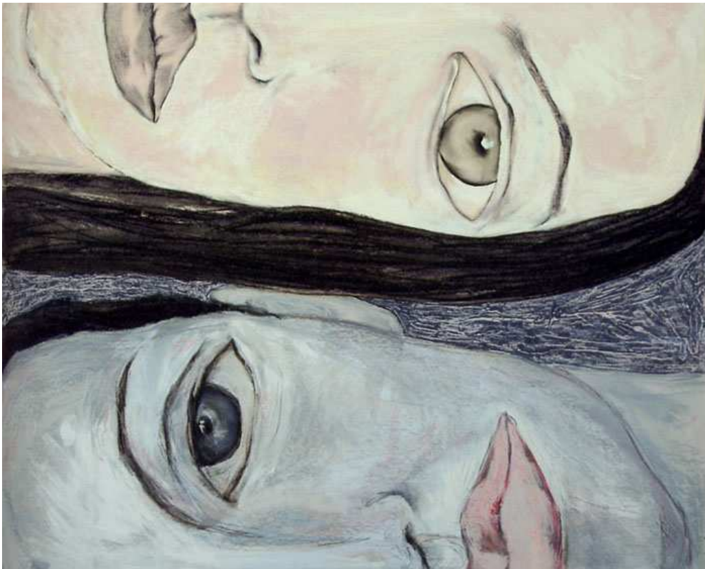
【작품 2】 Flat, oil pastel, charcoal, acryl color on board, 81x101cm, 2004