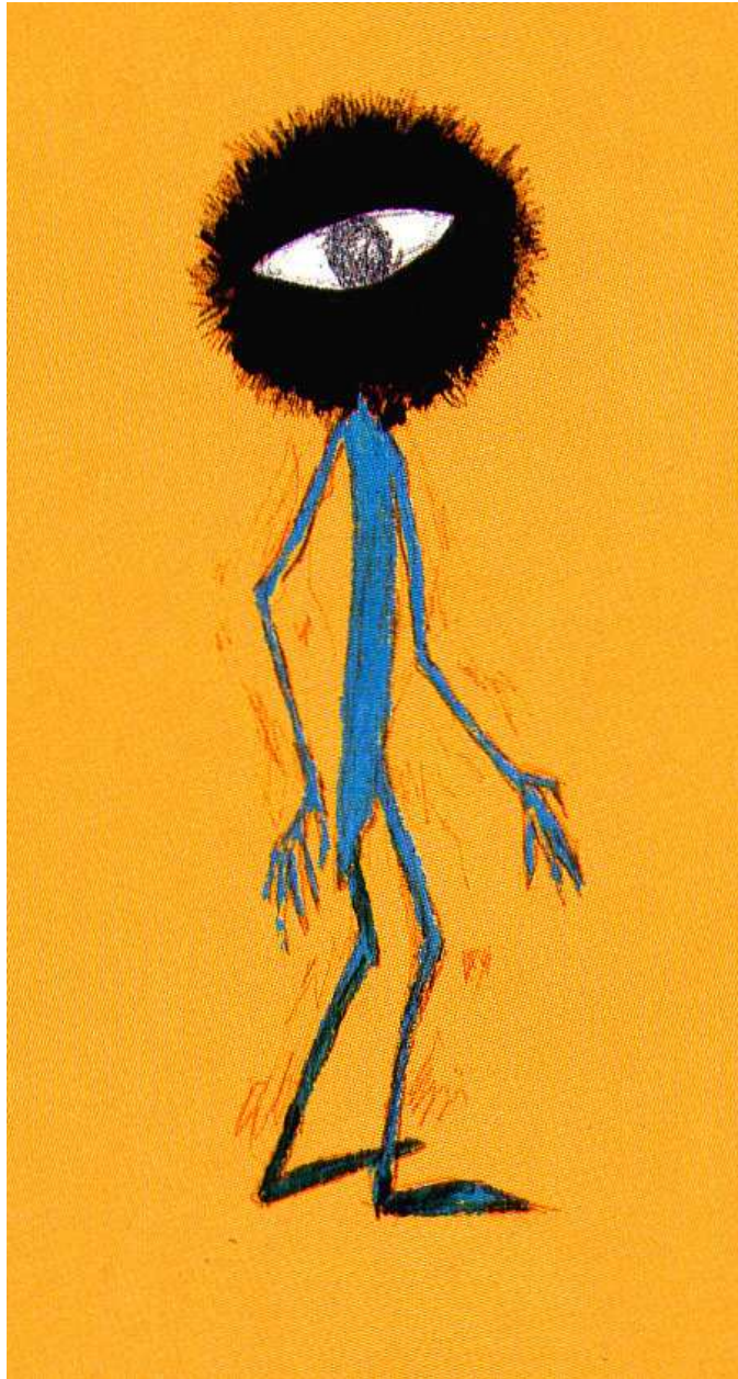
【작품 1】 The One eye, Pen, Acryl color on board. 35 x 63 cm, 2004