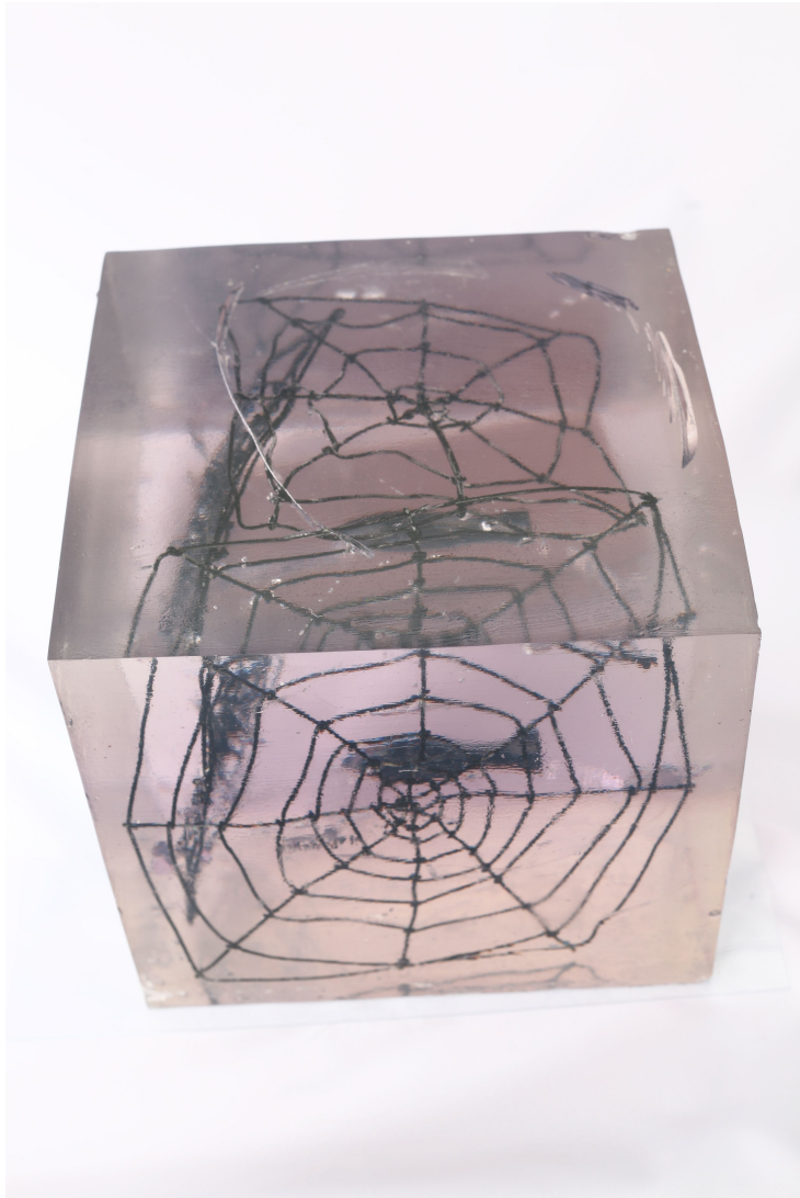
[작품 7] 잃어버린 시간, 25×25×25cm, 폴리카보네이트, 철사, 안료, 2008