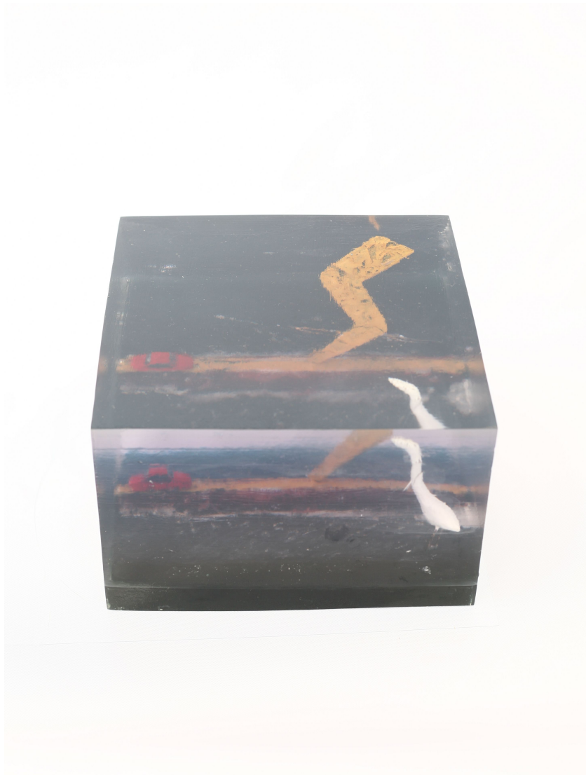
[작품 8] 길, 24×24×16cm, 폴리코트, 안료, 아크릴 칼라, 2008