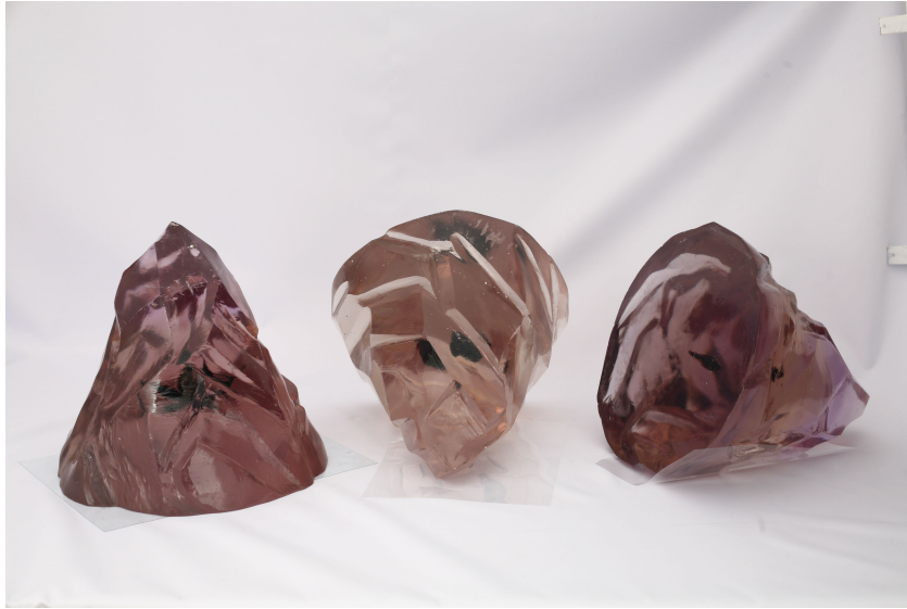
[작품 6] 정지된 시간 1, 2, 3, 32×32×30cm, 나뭇잎,소라껍데기,폴리코트, 안료, 2006~2008