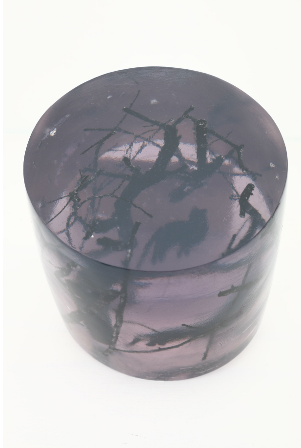
[작품 3] 숲1, 23×23×24cm, 나뭇가지,폴리코트,안료, 2008