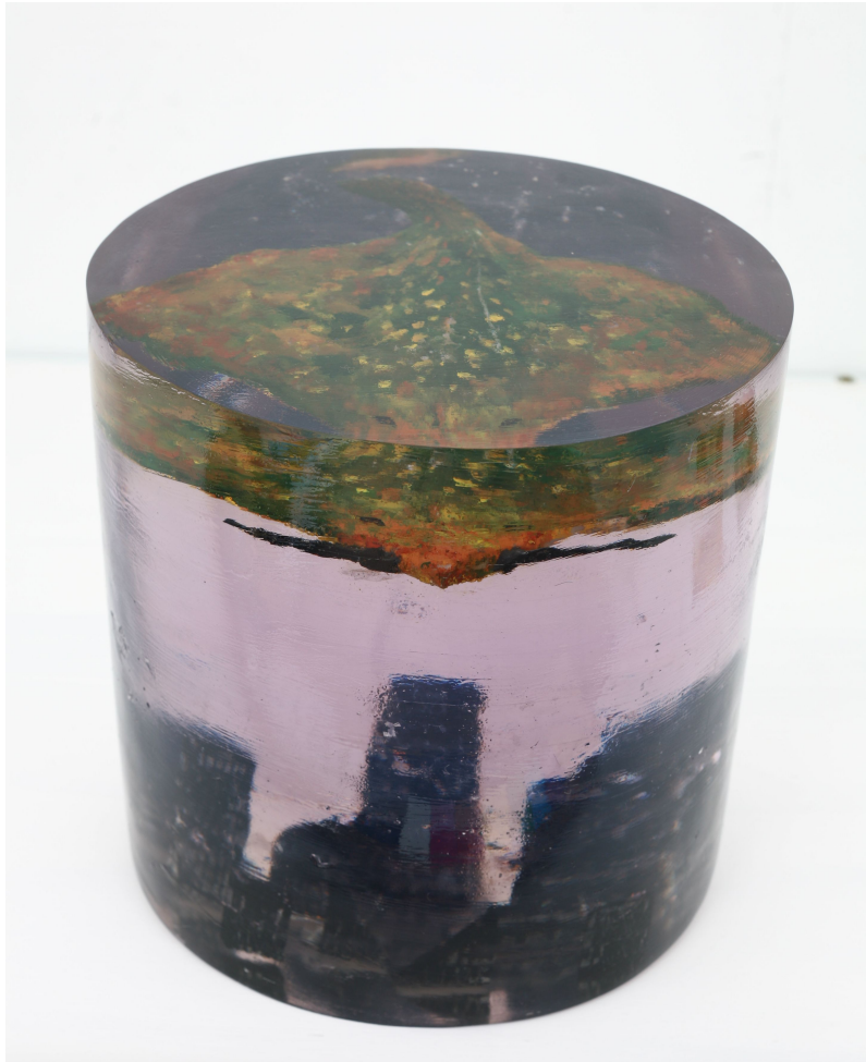
[작품 2] 도시, 28×28×29cm, 폴리코트, 안료, 아크릴 칼라, 2008