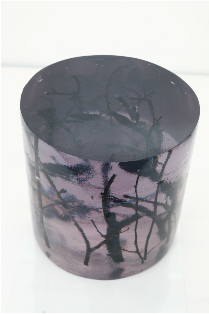
[작품 4] 숯2, 23×23×24cm, 나뭇가지,폴리코트,안료, 2008