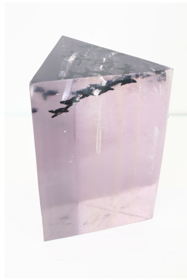
[작품 5] 동행1,2, 동행1, 17×23×44cm, 동행2, 28×32×44cm, 폴리코트, 안료, 2008