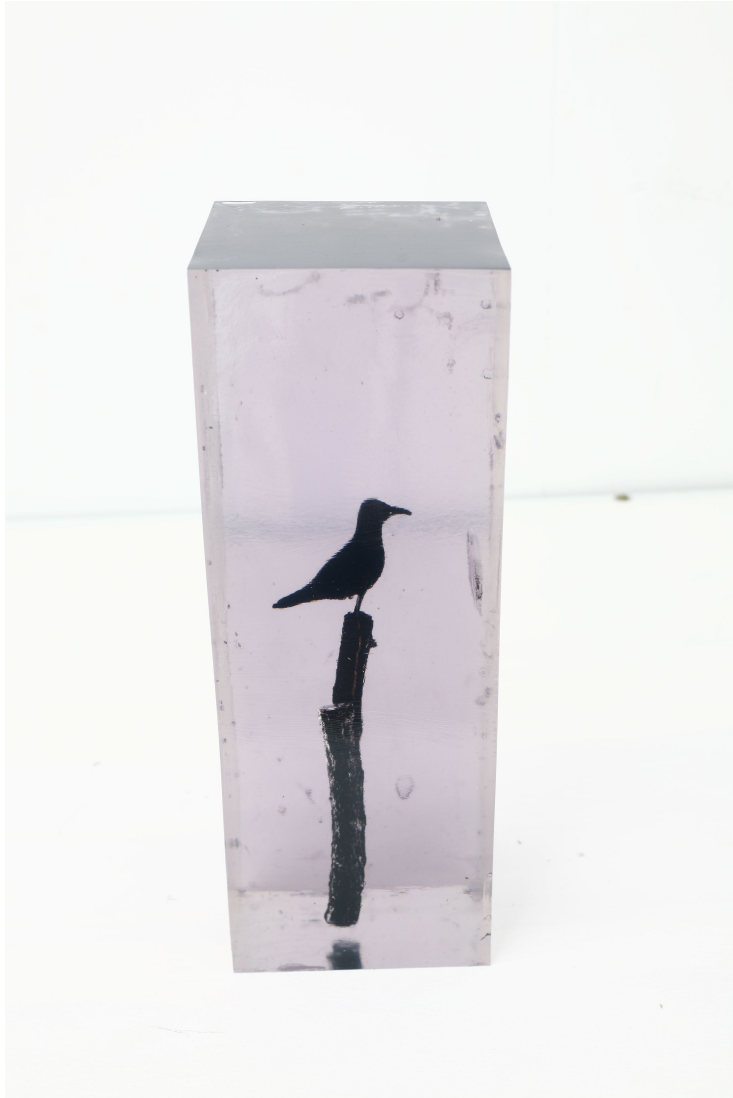
[작품 1] 이상1, 15×15×40cm, 나뭇가지, 폴리코트, 철사, 안료, 2008