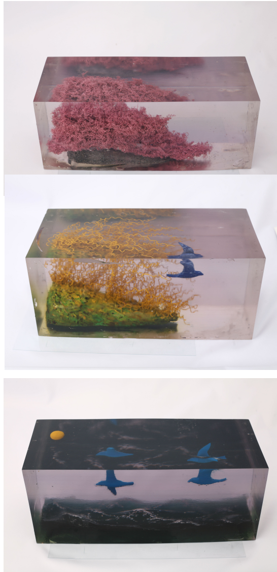
[작 품 10] 봄 1.2.3, 15×40×16cm, 폴리카보네이트, 철사, 안료, 2008