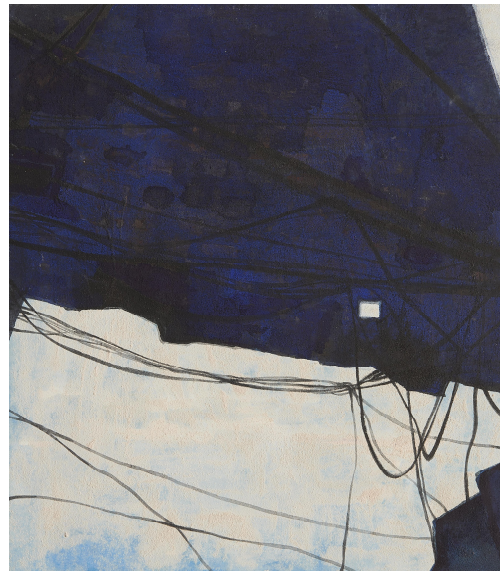
【작품 8】 벽-창2, 장지에 혼합재료, 45x53cm, 2017