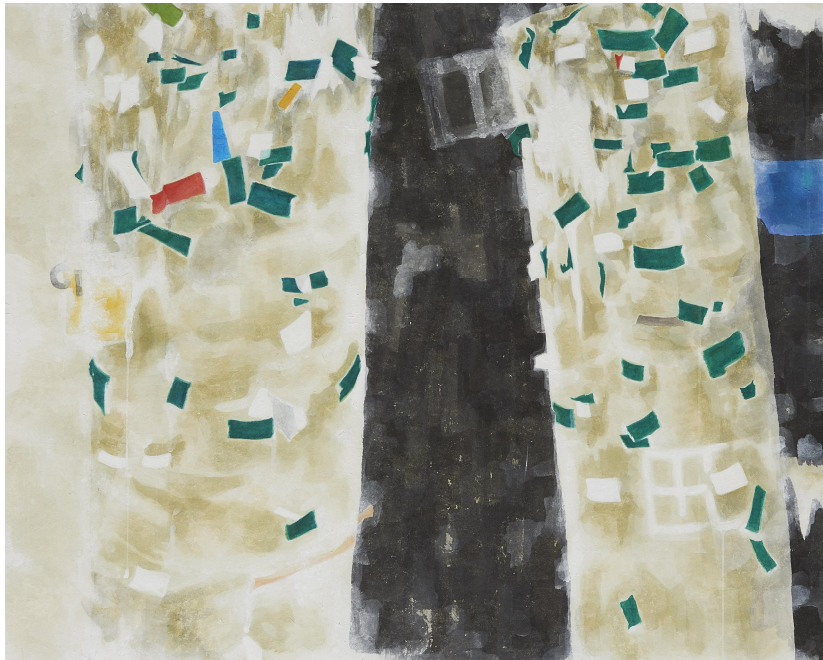
【작품 4】 두 개의 전봇대287, 장지에 채색, 91x73cm, 2014