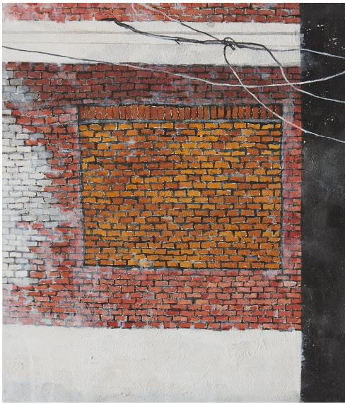
【작품 7】 벽-창1, 장지에 혼합재료, 45x53cm, 2017