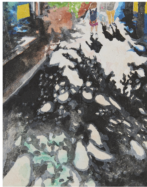
【작품 12】 이춘동, 캔버스에 혼합재료, 27x35cm, 2017