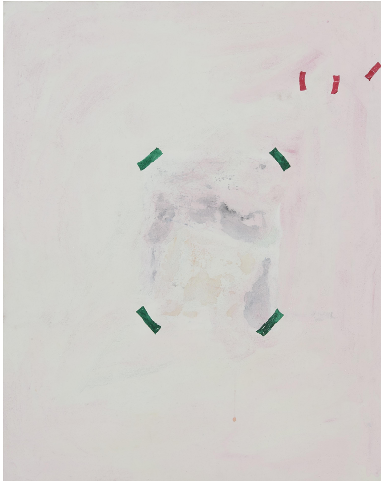
【작품 5】 벽-설이, 장지에 혼합재료, 73x91cm, 2017