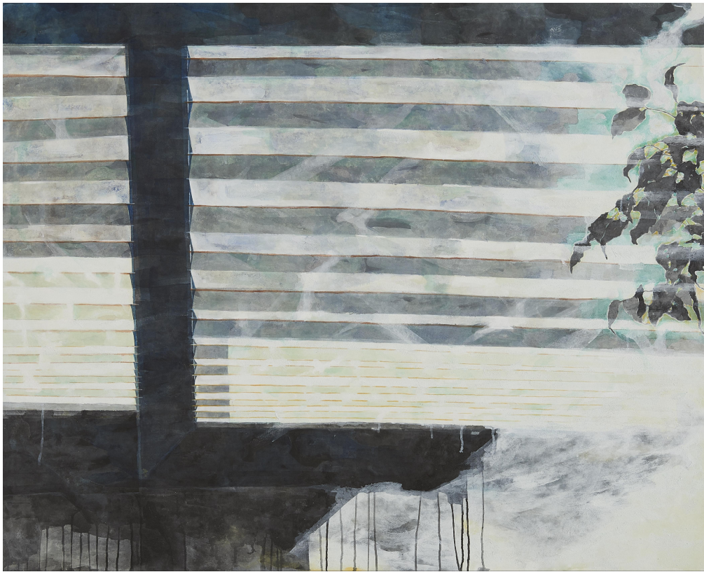
【작품 10】 창-2, 장지에 혼합재료, 162x130cm, 2017