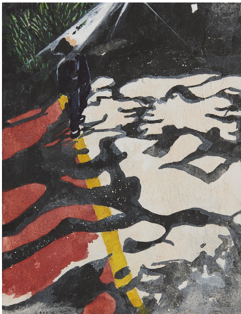
【작품 11】 남산, 캔버스에 혼합재료, 27x35cm, 2017