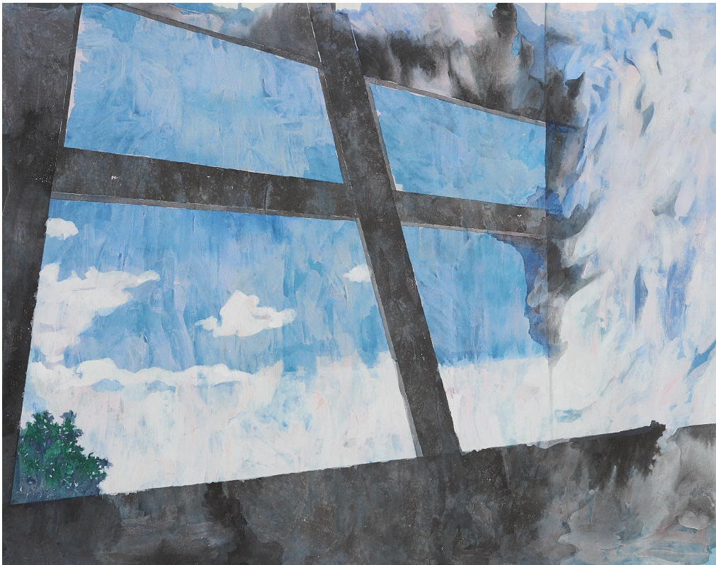
【작품 9】 창-1, 장지에 혼합재료, 162x130cm, 2017