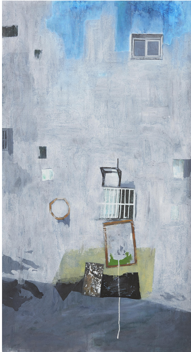
【작품 6】 벽, 장지에 혼합재료, 74x136cm, 2017