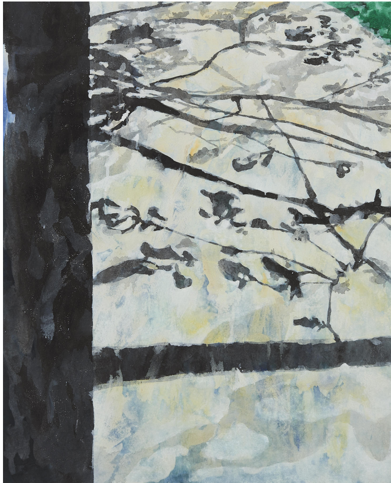
【작품 14】 공원, 장지에 혼합재료, 97x130cm, 2017