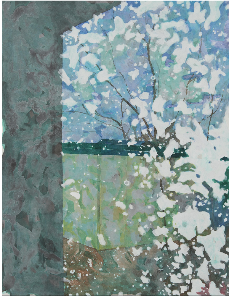
【작품 15】 세차장, 장지에 혼합재료, 112x145cm, 2017