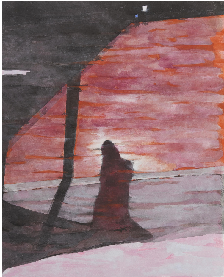
【작품 13】 밤, 장지에 혼합재료, 97x130cm, 2017