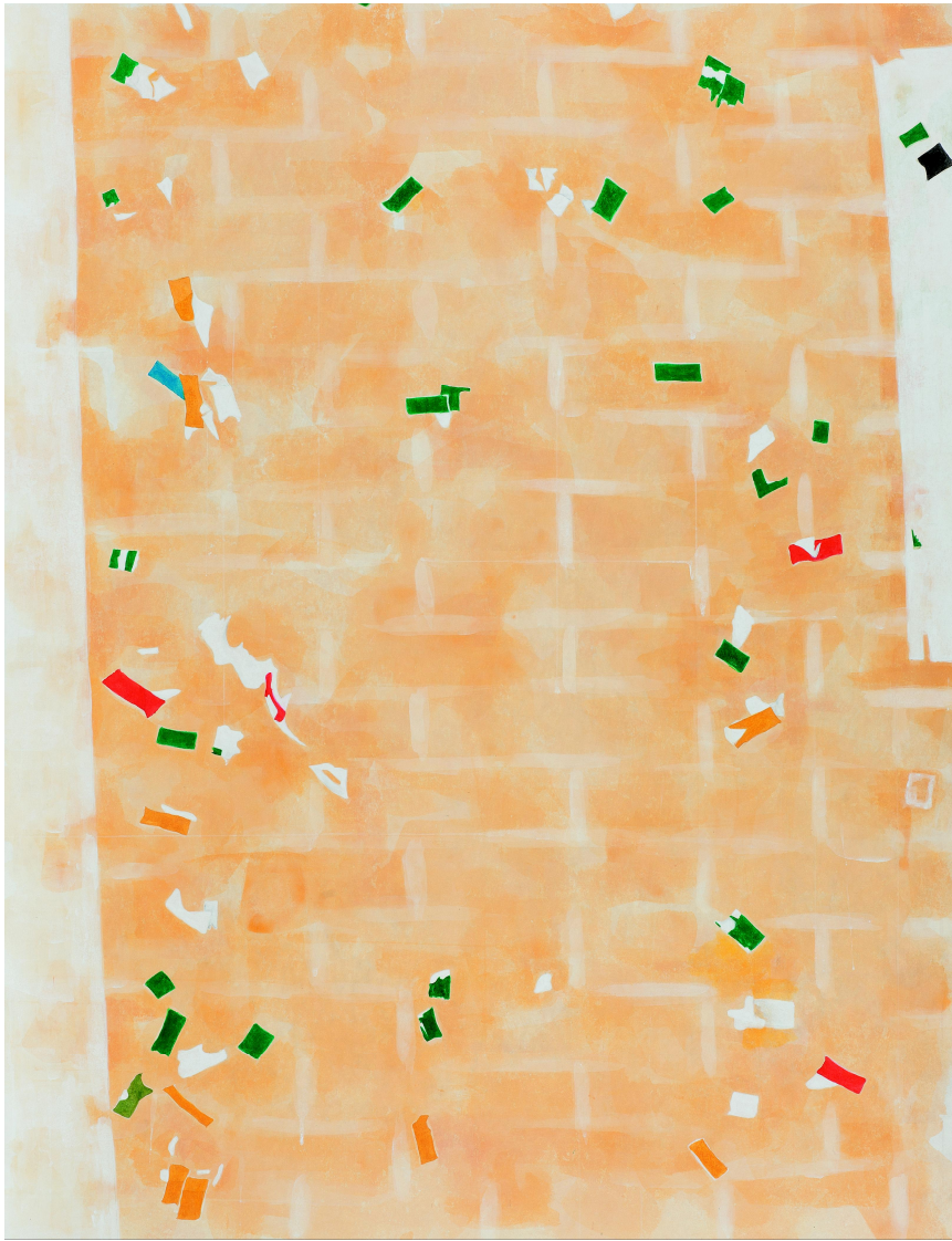
【작품 3】 서계동220-5, 장지에 채색, 112x145cm, 2014