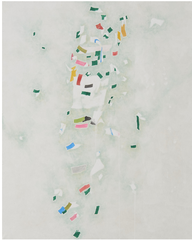
【작품 2】 임정로55-1, 장지에 채색, 60x73cm, 2014