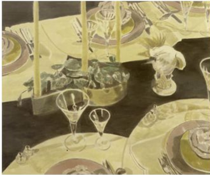
【도판 3】 루크 토이만스, The Perfect Table Setting, Oil on canvas, 131.0x158.0cm, 2005