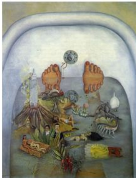
【도판 2】 프리다 칼로, 물이 나에게 주는 것,