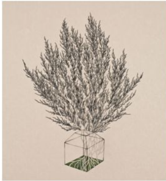
【작품 7】 그녀의 방 80.3x86.0cm 장지에 채색 2009