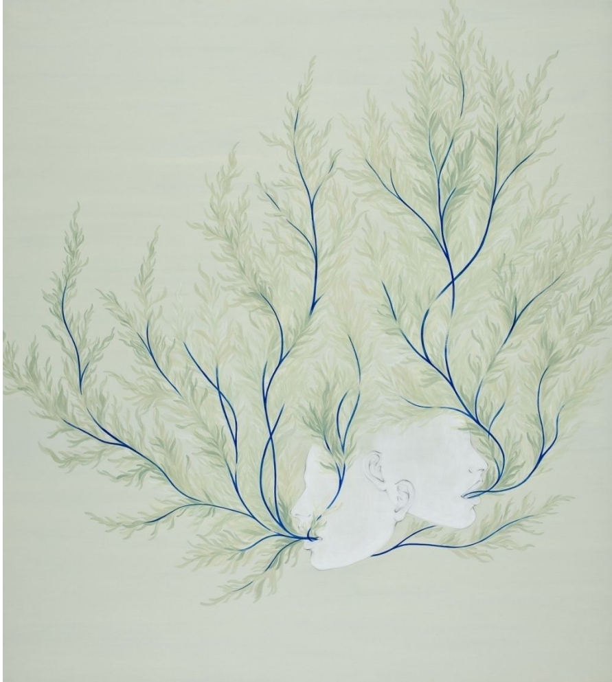
【작품 3】 a scene 145.3x162.2cm 캔버스에 과슈 2009