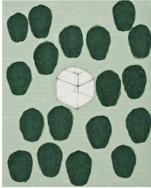
【작품 6】 그녀의 방 80.3x100.0cm 캔버스에 파슈 2009