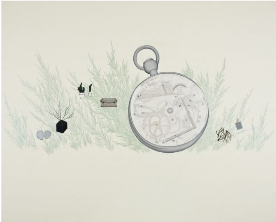
【작품 2】 언제나 따뜻하게 흐르길 바랍니다 227.3x181.8cm 캔버스에 과슈 2009