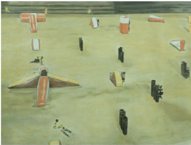
【도판 4】 루크 토이만스, Mayhem, Oil on canvas, 187.0x291.0cm, 2003