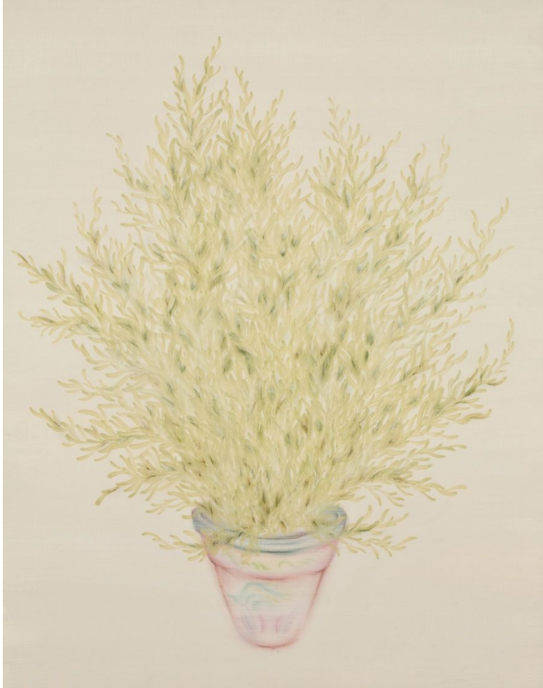
【작품 4】 키우다 72.7x90.9cm 캔버스에 파슈 2009