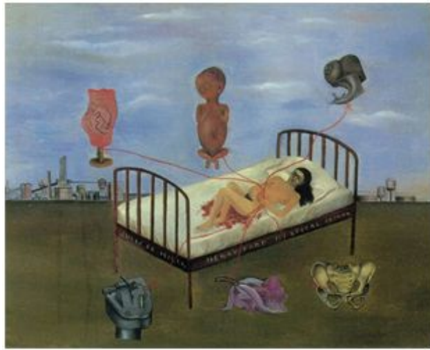
【도판 1】 프리다 칼로, 헨리포드 병원,