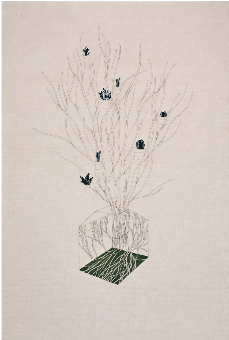
【작품 5】 특별한 H 130.3x193.9cm 장지에 채색 2009