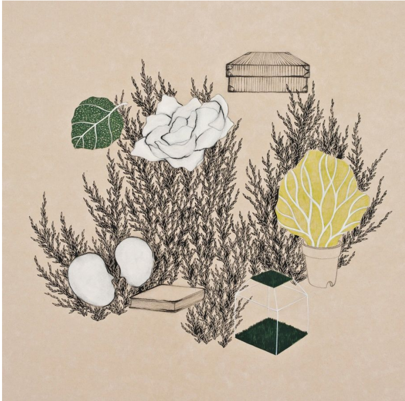
【작품 8】 H 60.0x60.0cm 장지에 먹 2009