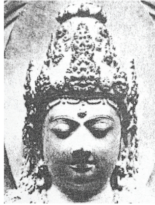
<그림 25> 서기 1225년경 파르바티 원형