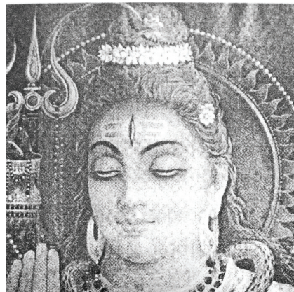
<그림 23> 현대의 시바상 <게오르그 포이어스타인, 최초의 문명은 고대 인도에서 시작되었다, p.318>