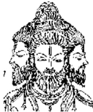
<그림 4> 현대의 브라마 <비네이 칼, 힌두교, p.50>