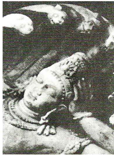
<그림 9> 5세기경, 비슈누 <굽타왕조, Joseph Campbell, The mythic image, p. 25.>