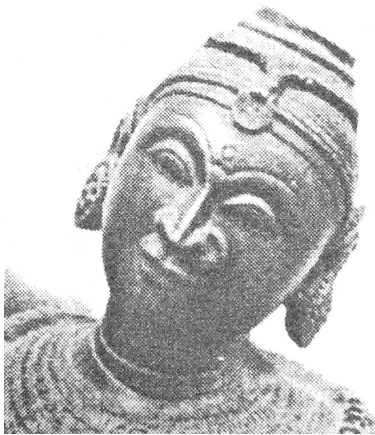
<그림 14> 2세기경, 락슈미의 화신 라다 <게오르그 포이어스타인, 최초의 문명은 인도에서 시작되었다. P.304>