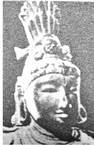
<그림 21> 12세기 춤추는 시바상 <정병조, 인도사. p.63>