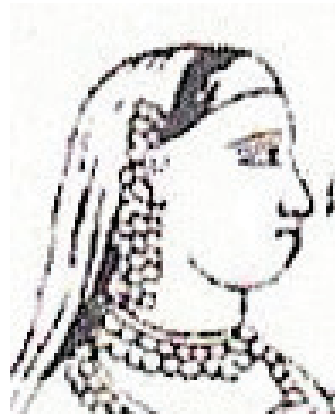
<그림 27> 파르바티 1864,

<Rachel Storm, Eastern Mythology, p. 250>