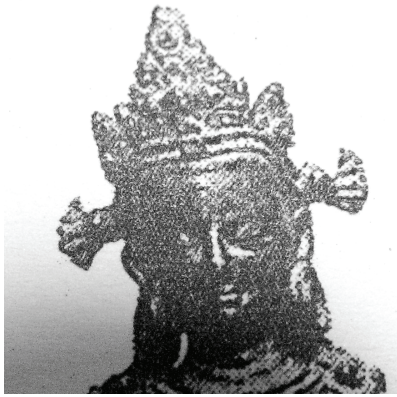
<그림 24> 9세기, 파르바티