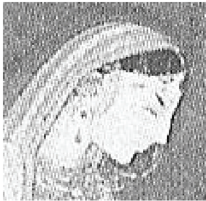
<그림26> 18세기 파르바티

<Rachel Storm, Eastern Mythology, p. 250>