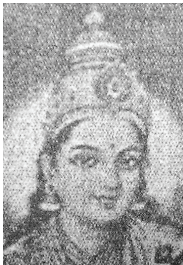
<그림 7> 사라스와띠 삽화 <류경희, 인도신화의 계보, p.25>