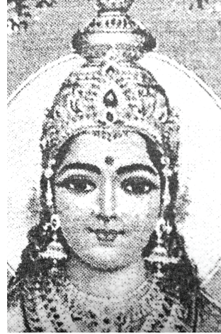
<그림 17> 현대의 락쉬미 <류경희, 인도신화의 계보, p.37>