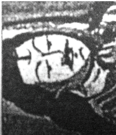
<그림 22> 19세기 누워있는 시바 <플랭크 웨일링, 지도로 본 세계종교의 역사, p.53>