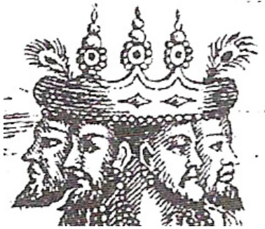
<그림 3> 18세기 브라마 형상 <Rachel Storm, Eastern Mythology, p. 156>