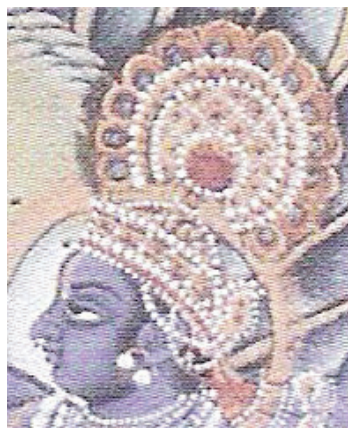
<그림 11> 1770년경, 비슈누 회화 <Rachel Storm, Eastern Mythology, p. 203>