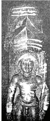
<그림 20> 1세기 남근상과 시바상 <플랭크 웨일링, 지도로 본 세계종교의 역사 p.45>