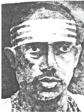
<그림 18> 시바파의 머리 표식 <Lucille Schulberg, historic india, p.120>