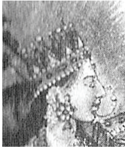
<그림 6> 1820, 사라스와띠 삽화 <Rachel Storm, Eastern Mythology, p. 265>