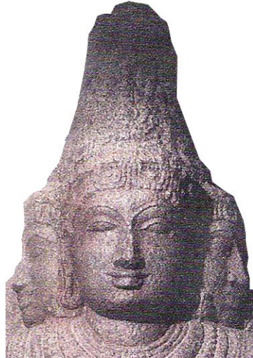
<그림 2> 11세기, 브라마 형상 <Rachel Storm, Eastern Mythology, p. 185.>