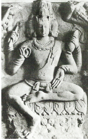
<그림 1> 5세기, 브라마 형상 <Hachchappyagudi Temple, Aihole, India, Prince of Wales Museum of Western India, Bombay.>