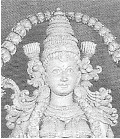
<그림 16> 18세기 락쉬미 <Rachel Storm, Eastern Mythology, p.230>