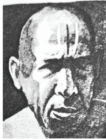
<그림13> 비슈누와의 머리 표식 <Lucille Schulberg, historic india, p.120>