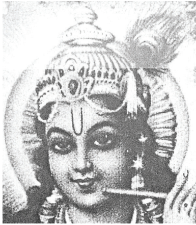
<그림 12> 현대의 비슈누 <D.N.jha, The myth of the holy cow, P.79>