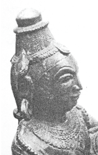
<그림 8> 2세기경, 비슈누 <게오르그 포이어스타인, 최초의 문명은 인도에서 시작되었다. P.304>