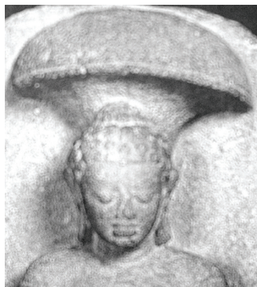
<그림 10> 5세기경, 불상 <한국국제교류재단, 인도의 불교미술, p.99>