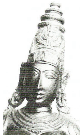
<그림15> 16세기 락슈미 <Joseph Campbell, the mythic image, p. 291.>