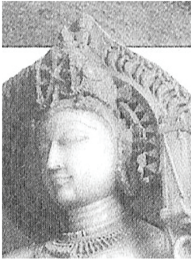
<그림 5> 12세기, 사라스와띠 <Rachel Storm, Eastern Mythology, p. 243>