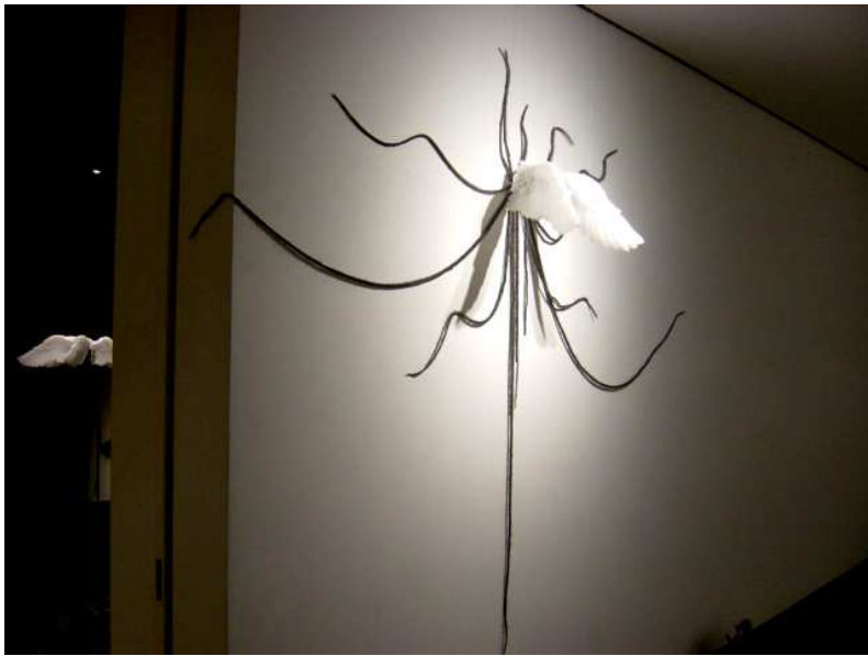
【작품 2】 Māyā & Ātman II-4, 140×180×45cm, 파라핀 왁스, 실리콘, 뉘시 줄, 2004