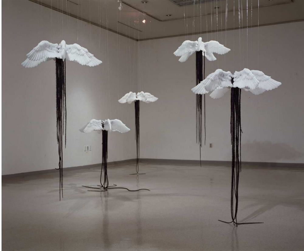
【작품 1】 Māyā & Ātman I , 90×115×90 ~ 90×210×45cm, 파라핀 왁스, 실리콘, 낚시 줄, 2004