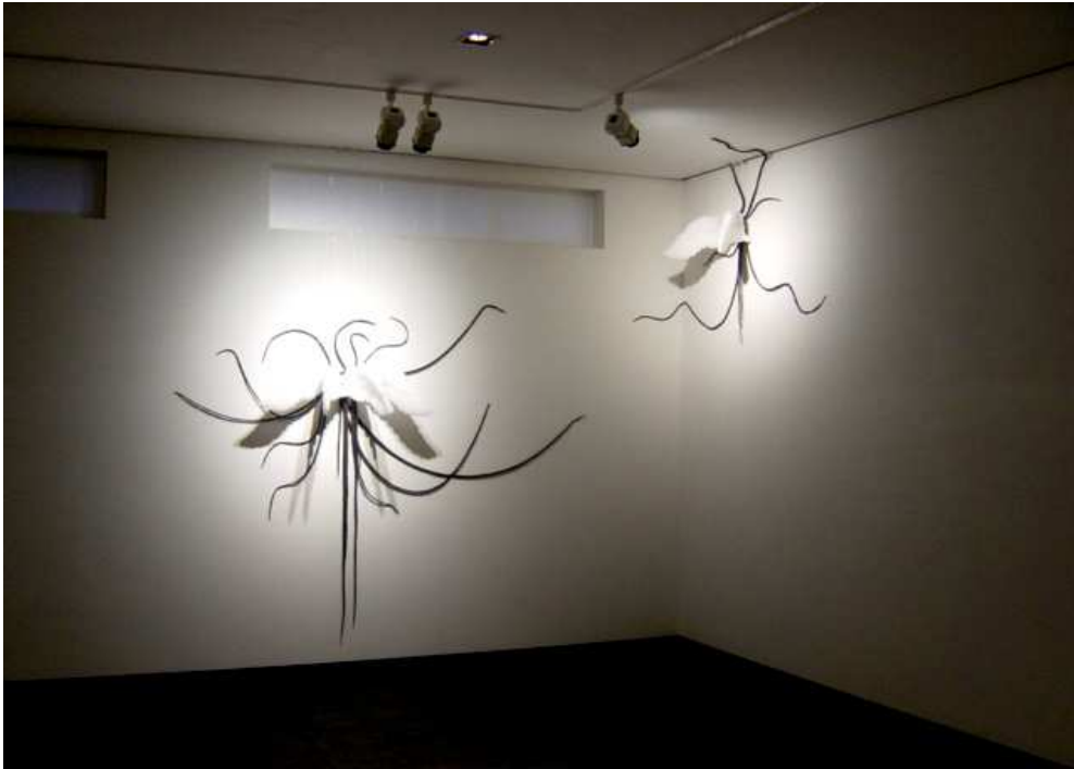
【작품 2】 Māyā & Ātman II -1,2, 190×170×45, 100×90×45cm, 파라핀 왁스, 실리콘, 낚시줄, 2004