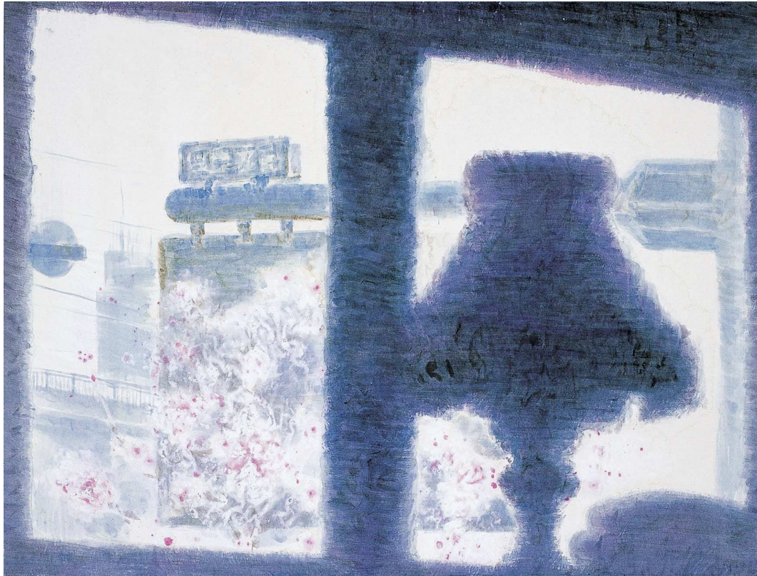
【작품 5】 카페에서, 116.7×91cm, 화선지에 분채, 2004.