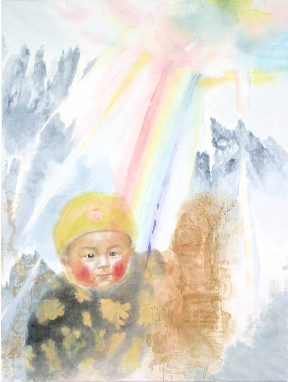
【작품 1】 장가계(長家界) 아이, 116.7×91cm, 장지에 분채, 2005.