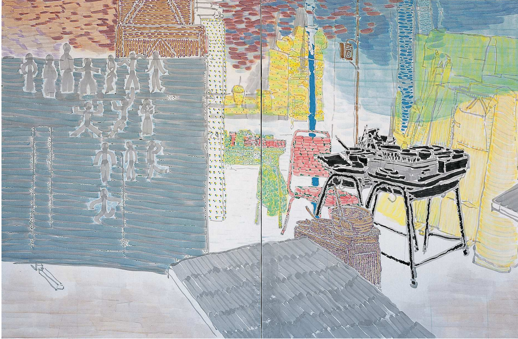
【작품 3】 학교작업실, 112×145.5cm×2ea, 이합 화선지에 분체, 2004.