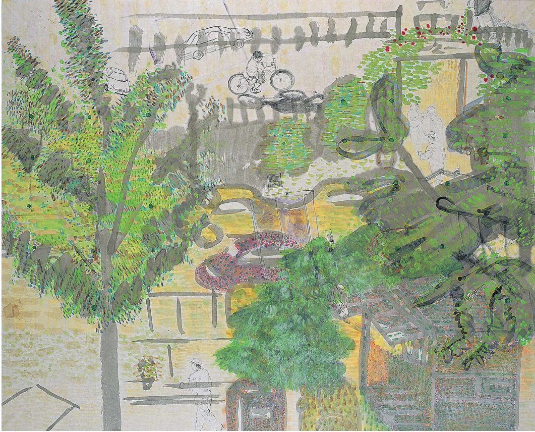
【작품 4】 집 앞 풍경, 162×130.3cm, 화선지에 분채, 2004.