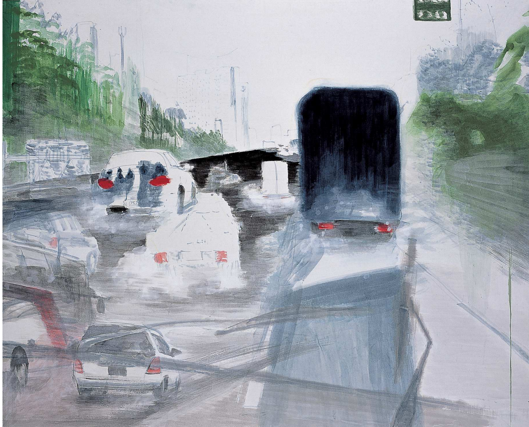
【작품 9】 비 오는 고속도로, 162×130.3cm, 이합 화선지에 분채, 2004.