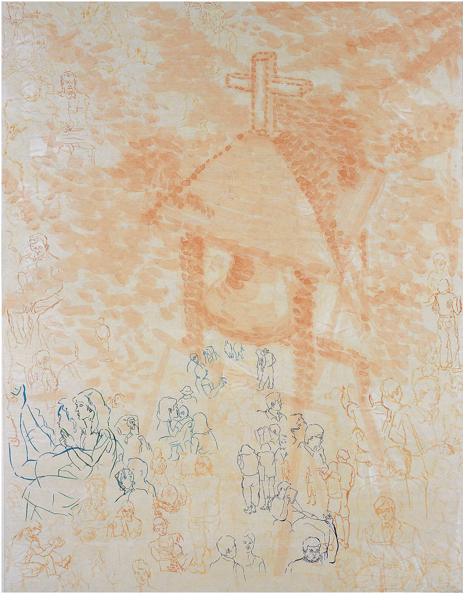
【작품 6】 종탑, 112×146cm, 화선지에 분채, 2004.