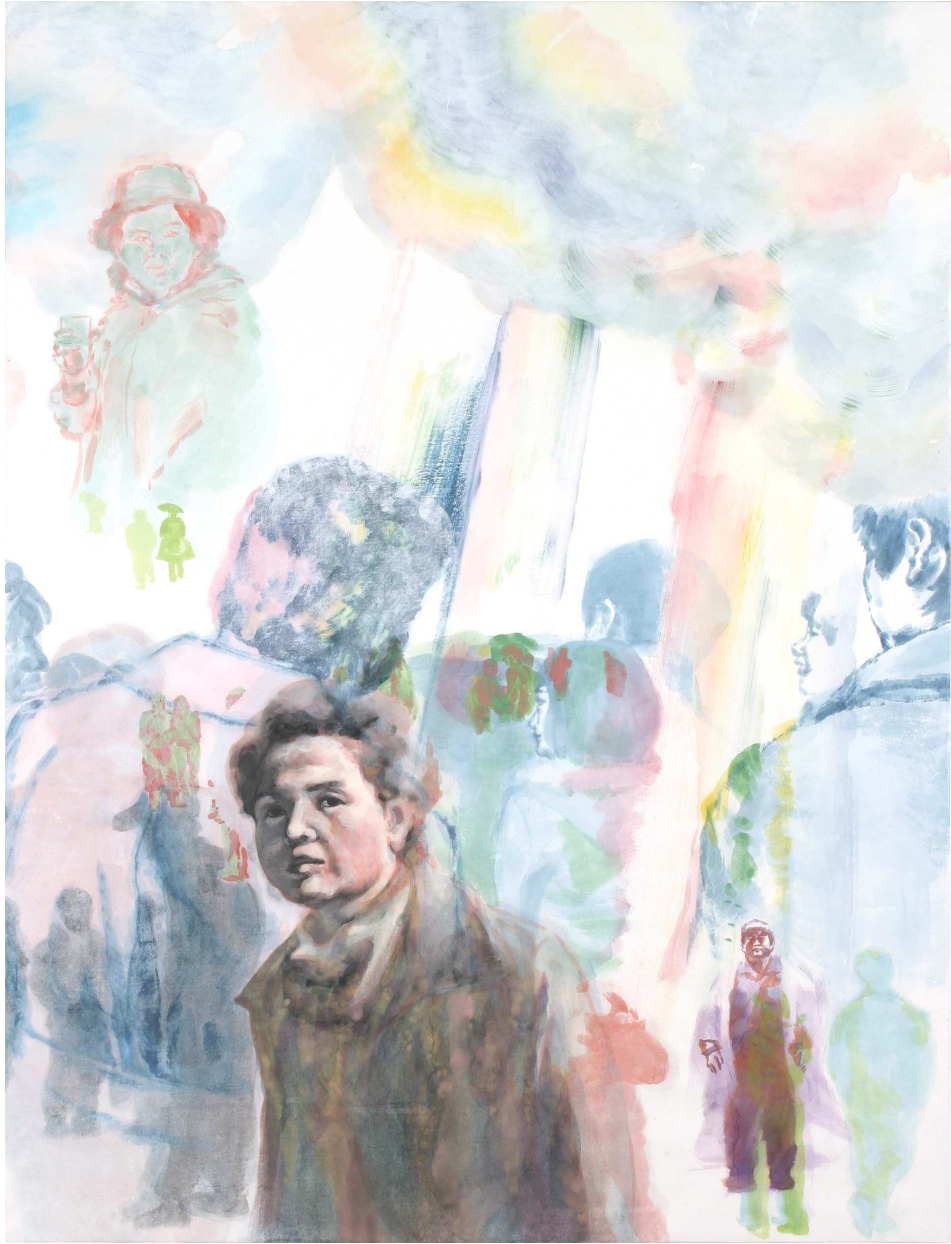
【작품 2】 함께 여행한 사람들, 116.7×91cm, 장지에 분채, 2005.