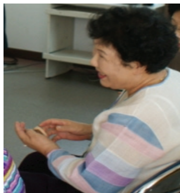
<사진 IV-12> 5차시 캐스터네츠 연주활동 중