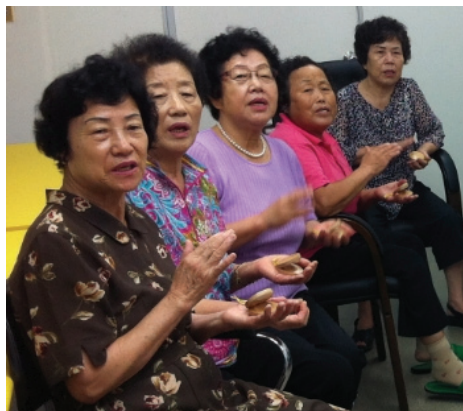
<사진Ⅳ-9> 5차시 캐스터네츠 연주활동 중

<6차시 핸드벨 연주> 활동은 핸드벨 연주 방법을 알려주고 일대일로 자세를 교정해주고 여러 다양한 방법으로 연주를 진행하였다. 5차시 캐스터네츠 연주를 통해 자신감을 얻은 어르신은 핸드벨 연주 활동에 대