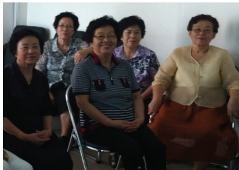
<사진 IV-1> 음악활동 시작하기 전 어르신들 모습