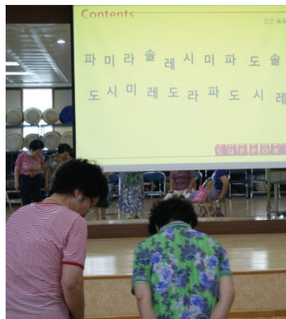
<사진 IV-3> 4차시 인간음표 활동 중

<5차시 캐스터네츠 연주>의 학습 목표는 첫째, 타악기 연주를 통해 신체근육 기능을 강화한다. 둘째, 다양한 연주법을 통해 자신감을 향상하는 것이었다. 캐스터네츠는 한 번 짚은 봤던 악기고 캐스터네츠는 쉽고 편하게 연주 할 수 있어 어르신들이 거부감 없이 다가갈 수 있었던 악기영역 활동이었다(사진 IV-4 참조).