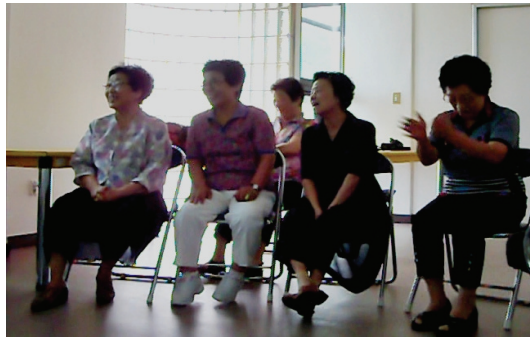
<사진Ⅳ-13> 8차시 추억 속 노래 마지막 활동 중