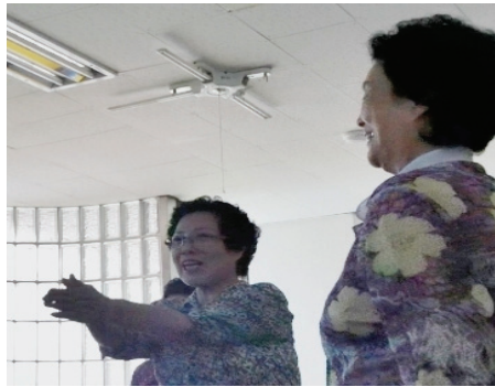
<사진 IV-10> 7차시 추억 속 노래 활동 중