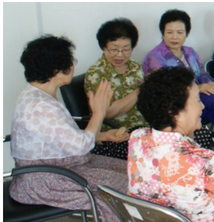
<사진 IV-4> 5차시 캐스터네츠 연주 활동 중

<7차시 추억 속 노래>는 자신의 과거를 회상하며 곡을 선곡하고 그 곡을 선곡한 이유를 이야기 하면서 그 시절을 돌아보는 시간이었다. 1차시 활동부터 한 분씩 나와 발표하는 시간을 자주 가졌기 때문에 앞에