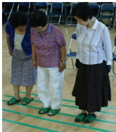
<사진Ⅳ-8> 4차시 인간 음표 활동 중