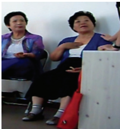
<사진Ⅳ-5> 7차시 추억 속 노래 활동 중