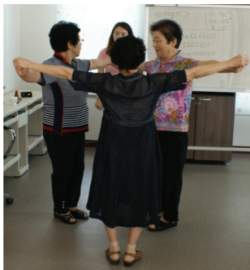
<사진Ⅳ-7> 3차시 몸 게이름 활동 중