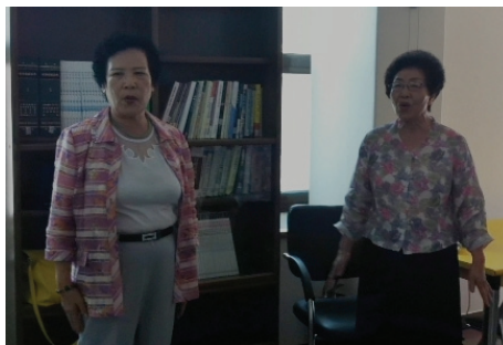
<사진Ⅳ-6> 1차시 “안녕하세요” 노래 부르기 활동 중