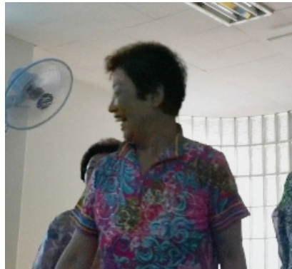
<사진 IV-11> 3차시 쌤님 역할 활동 중

<5차시 캐스터네츠 연주> 활동에서 캐스터네츠 악기에 대한 관심이 많았었다. 캐스터네츠는 금방 배울 수 있어 어르신들이 성취감을 빨리 느낄 수 있었다. 캐스터네츠 연주는 다양한 방법으로 진행하였는데 그 중 게임을 각자 정해주고 곡을 연주하는 활동이 있었다. 처음에는 곡에 나오는 게임으로 차례대로 정해주었다가 어느 정도 익숙해지면 일정한 규칙이 없이 무작정 정해주고 연주를 하는 부분에서 어르신들은