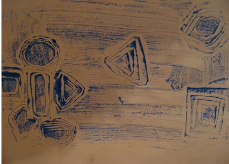
【그림 12】 마분지 판화 <재미있는 도형>

두꺼운 종이를 원하는 모양으로 오려 겹쳐 마음껏 구성하고 물감을 묻혀 찍는 것으로 자연스럽게 판화의 원리를 이해하였다. 또한 판화와 쉽고 간단하게 접할 수 있는 좋은 기회가 되었다.