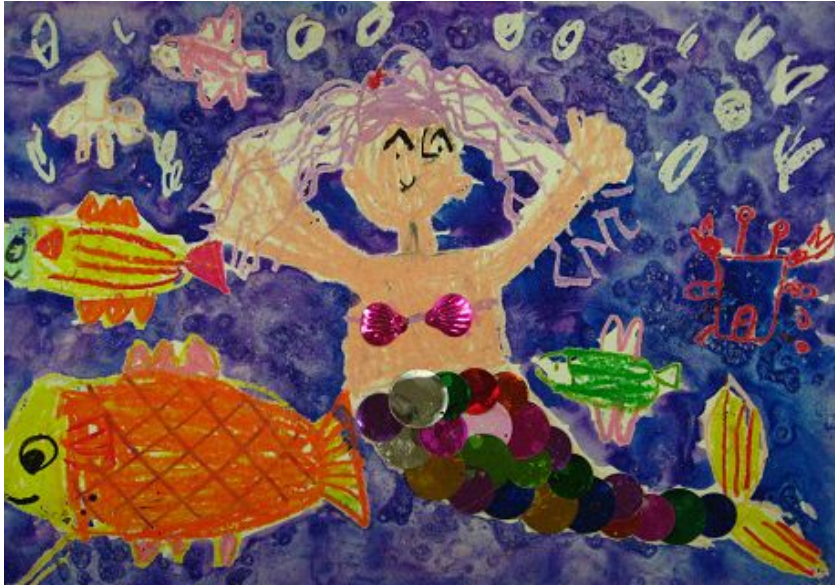
【그림 28】 동화 듣고 그리기, 소금번지기

인어공주라는 동화를 듣고 그린 그림은 풍부한 상상력과 잠재능력을 발견하는 계기가 되었다. 또한 여기에 사용되었던 소금 번지기의 기법은 유아들에게 있어 예상치 못한 화면의 효과를 얻게 하여 신기함을 주었다.