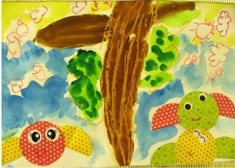
【그림 16】 원 응용 그림

동그라미만을 이용하여 만든 새는 사물의 형태를 새로운 눈으로 볼 수 있는 방법을 제시하였고 도형의 응용력을 기르는데 도움을 주었다.