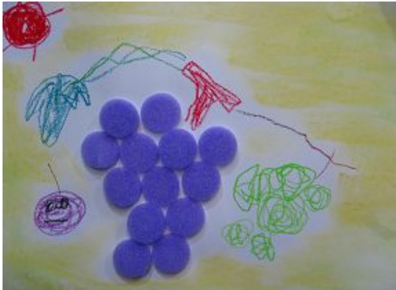
【그림 6】 백엽 풀라주 <탐스러운 포도>

물체(백엽)를 직접 붙여 포도를 구성해 보았다. 본 활동은 그리기 도구만을 사용하여 그린 그림과는 또 다른 느낌을 주었다. 작업이 쉽고 큰 효과를 보여 유아들에게 큰 만족감을 줄 수 있다.