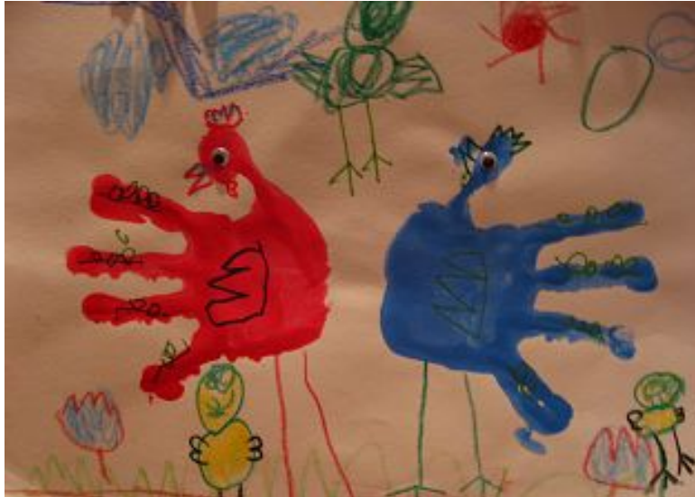
【그림 2】 손바닥 찍어 그리기 <꼬꼬닭>

손바닥을 찍어 그린 그림은 자신의 신체를 이용하여 작업을 진행한다는 것에 상당한 관심을 보였고 물감의 경험, 즉 촉감에 대한 다양한 생각들을 기발하게 이야기하였다.