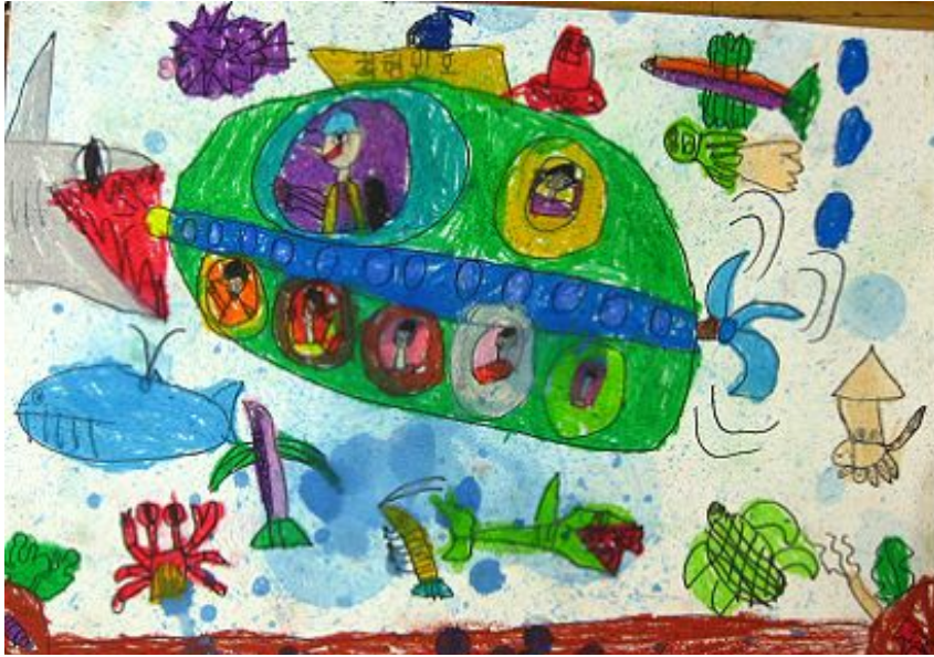
【그림 23】 비누방울 그림

비누방울이 만들어내는 우연적인 모양에 즐거워하며 활동과정 자체를 즐기는 모습을 볼 수 있었다. 비누방울에 의해 만들어진 무늬들을 다양하게 응용하여 그림으로 연결시키는 유아들의 생각이 놀라웠다.