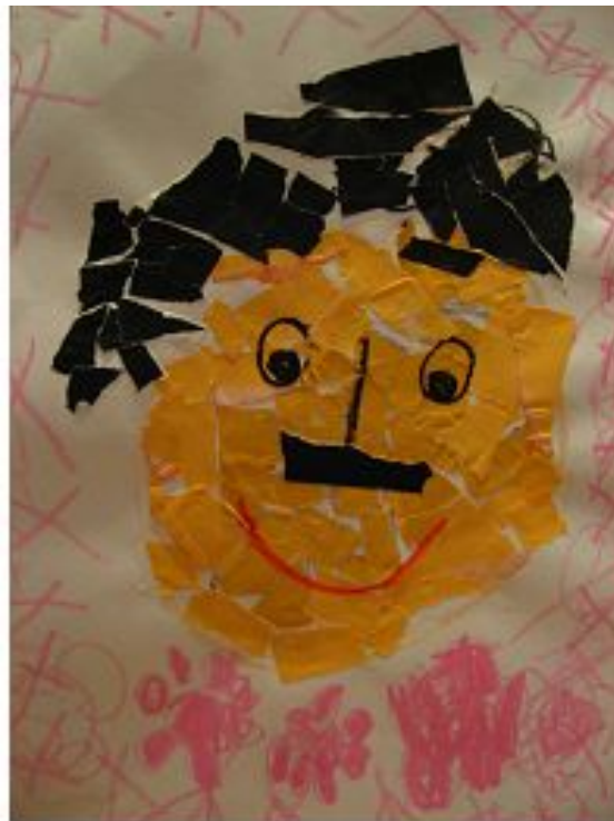
【그림 10】 모자이크 <친구 얼굴>

색종이를 찢어 모자이크 기법으로 얼굴을 나타내는 작업에서는 유아들의 인내심과 참을성을 엿볼 수 있었다. 색연필, 크레파스로 얼굴을 칠할 때에는 빨간색이나 파란색 등을 사용하던 유아가 색종이를 이용하여 얼굴을 표현할 때에는 신기하게도 연주황색의 색종이를 골라 사용하였다. 사물의 색에 대한 다양한 경험을 하는데 좋은 시간이었다.