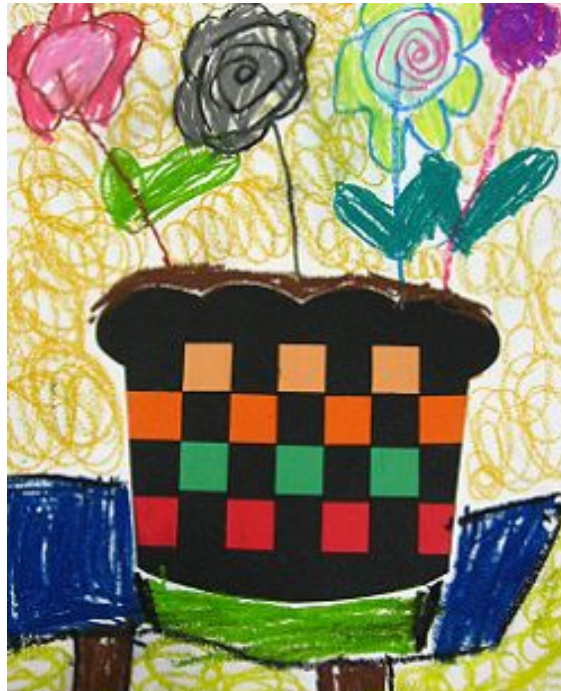
【그림 30】 종이 직조 <예쁜 꽃 화분>

서로 다른 색의 종이를 교차하여 알록달록 예쁜 무늬를 만들어 본 종이 직조 활동은 인내심과 집중력을 십분 발휘할 수 있게 하였다. 활동 과정 중 다소 힘들어하는 모습을 보이기도 했지만 완성한 뒤 그만큼 큰 기쁨을 느낄 수 있었다.