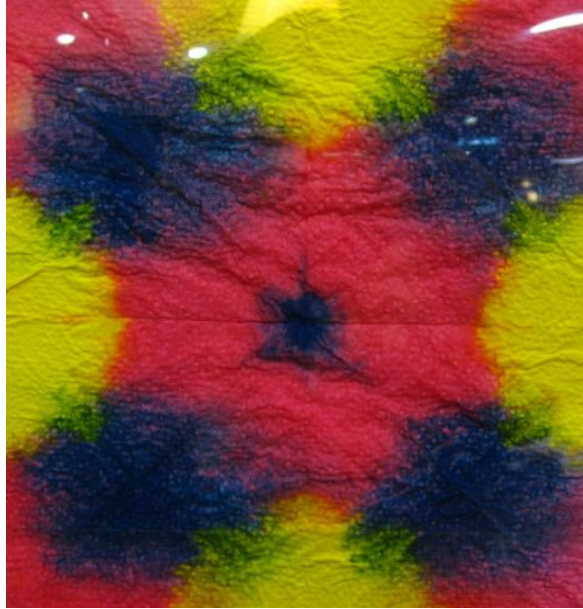
【그림 1】 휴지염색 <멋진 방패>

휴지 염색 작업은 물감의 섞임과 대칭의 원리를 자연스럽게 배우고 우연의 효과로 얻어진 멋진 무늬를 경험할 수 있었다.