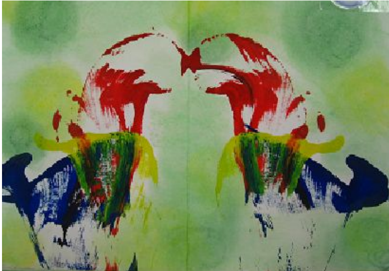
【그림 3】 실 잡아당겨 그리기

실을 잡아당겨 그린 그림은 물감의 섞임과 대칭의 원리를 자연스럽게 배우고 미세하게 손을 움직임으로써 소근육 발달에 도움을 준다. 또한 우연히 얻어진 무늬에 대하여 이야기를 나눔으로써 상상력을 자극한다.