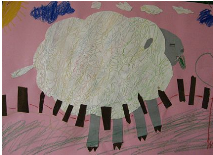
【그림 25】 스크래치

물감을 마구 긁어 양을 표현한 작업은 스크래치 기법을 다른 방법으로 경험해 보도록 하였고 다양한 색과 예쁜 무늬를 만들어 낼 수 있었다.