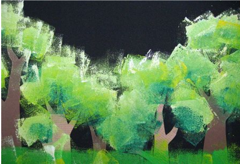
【그림 20】 스펀지 찍기 <울창한 숲>

스펀지를 찍어 표현한 울창한 숲은 적은 노력으로 큰 효과를 볼 수 있어 성취감과 자신감을 심어 주었고 스텐실의 기본 원리를 이해시키기에 좋은 활동이었다.