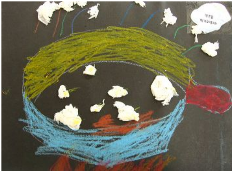
【그림 11】 휴지 풀라주 <고소한 팝콘>

휴지를 재료로 사용하여 활동하는 방법에는 여러 가지가 있다. 이번 작업에서는 휴지를 마구 구겨 팝콘과 비슷한 모양을 만들어 보는 작업이었다. 휴지가 팝콘모양이 된다는 것에 의아해 하던 유아들도 완성된 작품을 보며 친구들과 실제 팝콘을 나누어 먹는 것처럼 재미있는 상황을 연출하기도 하였다.