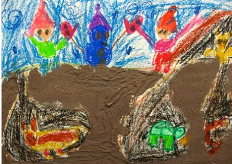
【그림 29】 핸디코트 그림 <겨울 잠 자는 동물들>

핸디코트에 모래를 섞어 땅을 표현했던 활동에서는 핸디코트라는 새로운 재료를 접할 수 있었고 간접적으로나마 땅의 질감과 느낌을 경험하며 그것의 소중함을 배울 수 있는 시간이었다.