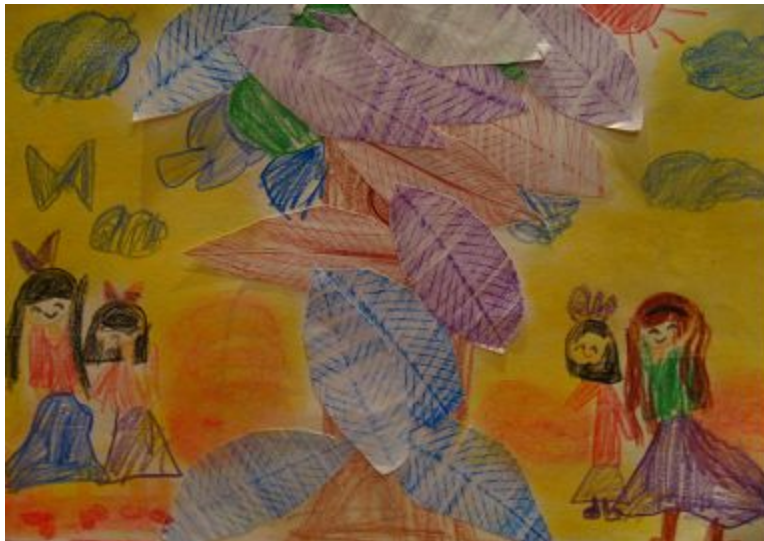
【그림 21】 나뭇잎 프로타주 <가을 소풍>

나뭇잎을 이용한 프로타주 활동은 주위의 자연물에 대한 생각을 새롭게 확장시켜주었고 탁본의 방법을 간접적으로 알아보는 계기가 되었다. 또한 다양한 확장 활동이 가능하여 아동 혼자서도 충분히 여러 가지 응용이 가능한 기법이다.