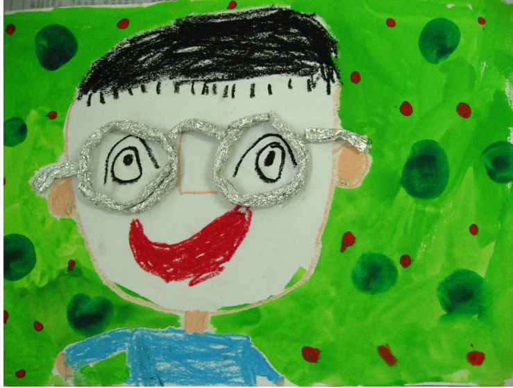
【그림 15】 호일로 만들기 <안경 쓴 친구>

만지고 찢고 구기면서 호일의 특성을 마음껏 탐색해 보았고 소중한 친구의 생김새를 자세히 관찰하는 시간이 되었다.