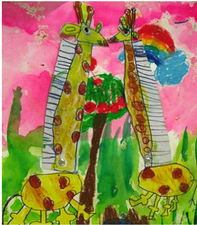
【그림 24】 움직이는 그림 <아프리카의 기린>

기린의 특성과 생김새를 관찰한 후 특징을 살려 그림으로 표현하였다. 할핀을 이용하여 움직이는 기능을 더함으로써 유아들의 관심과 흥미를 배가시켰으며 단순한 그리기 작업보다는 새로운 요소들을 첨가함으로써 아동의 호기심과 집중력을 높일 수 있다.