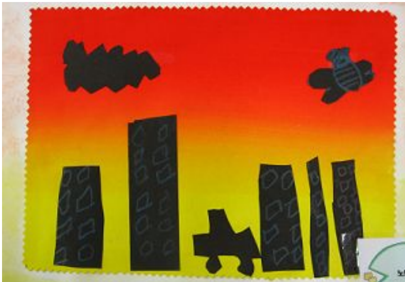
【그림 13】 검은 종이로 그리기

미술활동은 그리기 도구를 사용하여 그리는 것만이 형태를 표현 할 수 있다는 고정관념을 탈피하여 오리고 붙임으로써도 구상한 내용을 충분히 표현 할 수 있다는 것을 배웠고 노을 지는 풍경이 효과적으로 표현 된 작업이 었다.