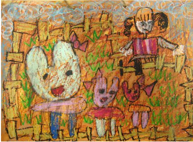
【그림 17】 황토물 그림

황토물을 사용하여 작업한 그림은 흙에 대한 소중함과 가치를 다시 한번 인식하고 재료의 특성을 여러 가지 방법으로 살리는 기회를 제공하였으며 오래된 듯한 그림의 효과를 얻어낼 수 있었다.