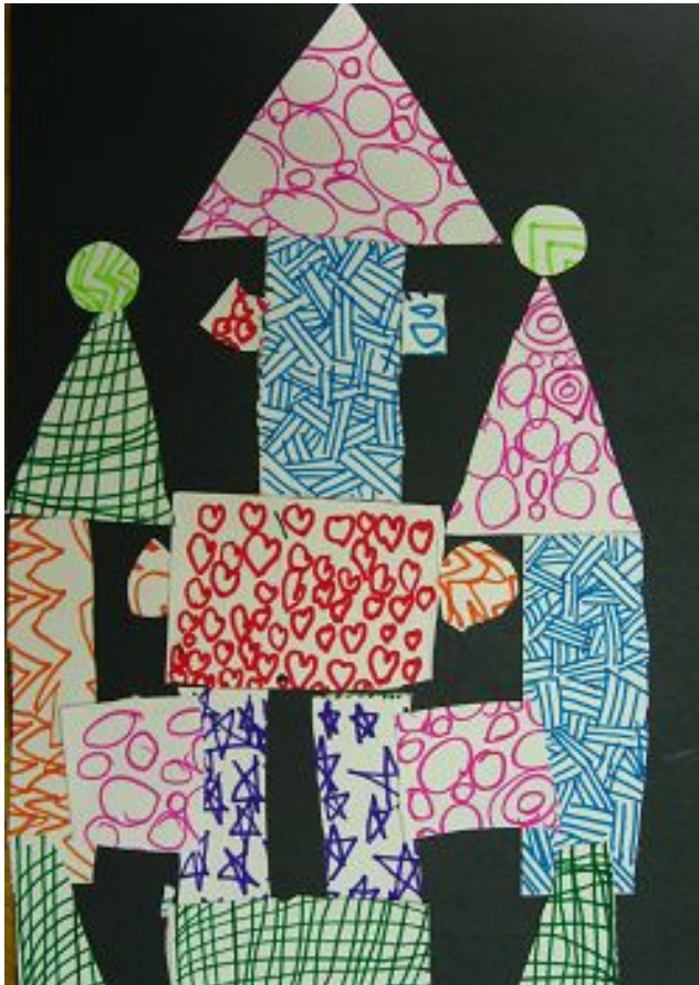
【그림 27】 도형 구성

도형을 조합하여 구상한 것을 구체적으로 나타내어 본 이 작업에서 아동들의 응용력과 기발함을 엿볼 수 있었다. 또한 형태에 대한 사실적인 표현에 많은 관심을 기울인다는 것을 느낄 수 있다.