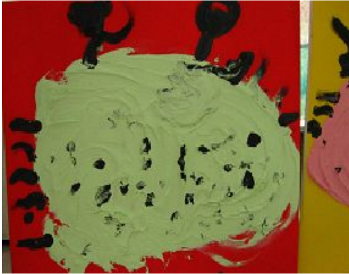
【그림 8】 핸디코트 문지르기 <말썹꾸러기 꽃게>

핸디코트를 마구 문질러 계를 표현했던 수업은 유아들로 하여금 손을 사용하여 내적 욕구를 마음껏 발산하도록 하였고 제자리에 앉아 진행하던 작업과는 다르게 적극적으로 몸을 움직이며 활동하는 경험을 제공 해 주었다.