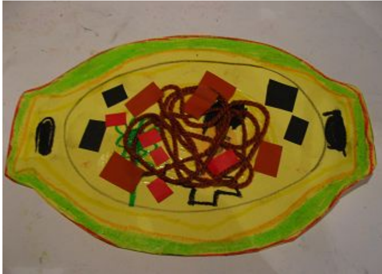
【그림 4】 실 붙여 그리기 <맛있는 스파게티>

실을 이용하여 스파게티를 표현한 활동은 유아들로 하여금 음식에 대한 새로운 시각과 경험을 제공하였고 가느다란 털실이 지닌 질감과 특성을 알게 하였다.