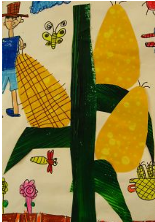
【그림 22】 탈색 콜라주 그림 <옥수수 밭에서>

옥수수의 알갱이를 표현하는 방법으로 면봉에 표백제를 묻혀 점을 찍는 기법을 사용하였다. 표백제가 묻은 부분은 탈색이 되면서 무늬가 나타나고 유아들은 이를 관찰하며 재료가 변하는 과정을 살펴 볼 수 있다.