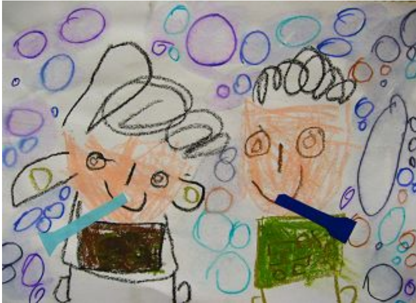
【그림 5】 싸인펜 번지기 <신나는 비누방울 놀이>

싸인펜으로 그림을 그리고 물을 뿌려 번지는 효과를 관찰한 작업은 유아들에게 신기함을 주고 호기심을 자극하였다. 한 아동은 “크레파스는 두껍게 나오는데 싸인펜은 얇게 나와요.”라며 차이점을 말하기도 했다.