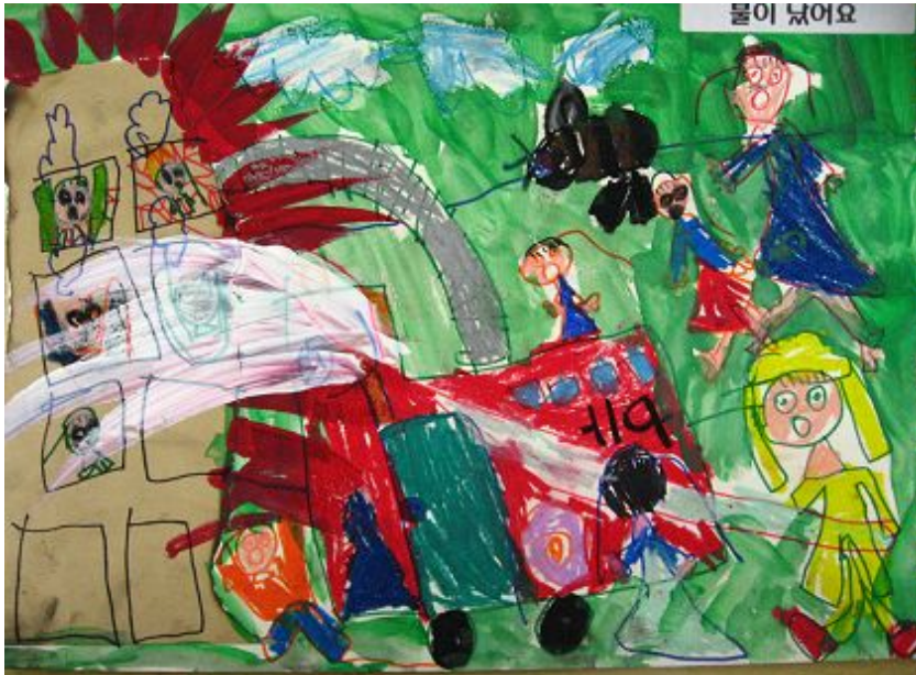
【그림 19】 태워서 그리기 <불이 났어요>

불로 태운 종이를 소재로 한 그림은 우연의 효과를 표현으로 연결시켜 봄으로써 창의력 증진에 도움을 주고 불의 소중함과 위험성을 되새기는 기회가 되었다.