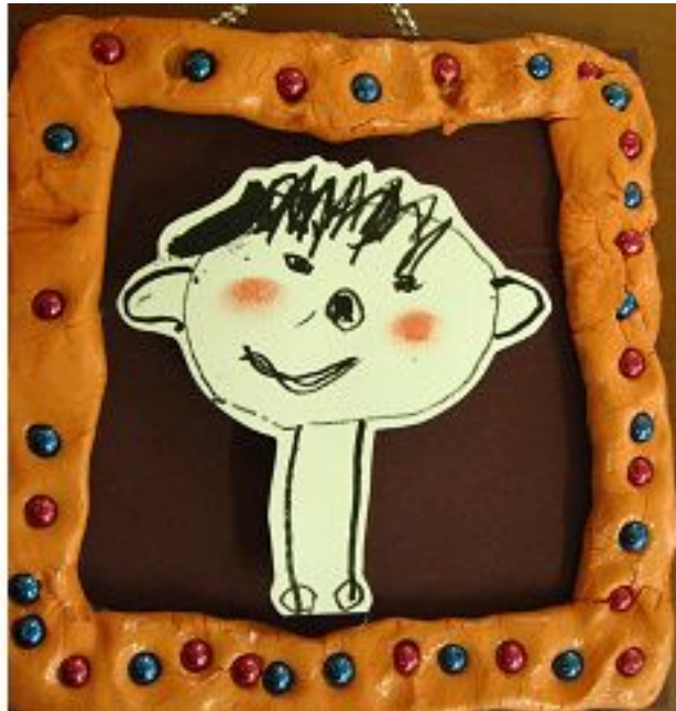
【그림 9】 젓가락으로 먹물 찍어 그리기 <수줍은 내 얼굴>

젓가락에 먹물을 찍어 그린 그림은 주로 사용하는 그리기 도구 이외의 다른 그리기 재료를 접할 수 있게 하여 도구들의 다양한 차이점들을 알 수 있도록 하였다. 또한 먹물의 특성 및 장·단점을 배운 시간이었다.