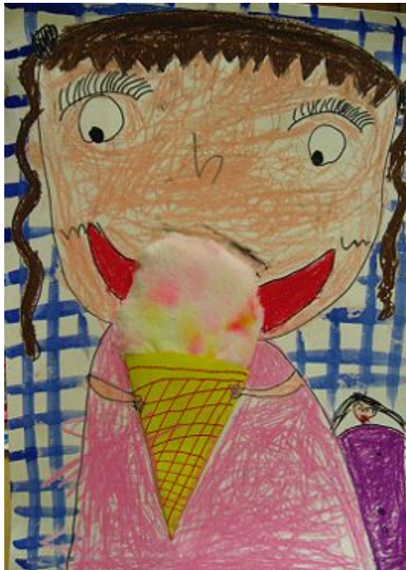
【그림 18】 사인펜 번지기 <달콤한 아이스크림>

솜이라는 재료는 유아들에게 포근한 느낌과 부드러운 질감을 느낄 수 있게 해 준다. 손으로 솜을 만지며 촉감을 충분히 경험하고 사인펜의 번지는 특성을 이용하여 색을 입혀 보았다. 색이 변함에 따라 더욱 관심을 보이는 유아들의 모습을 볼 수 있었다.