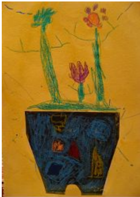
【그림 7】 사포에 그리기 <꽃 화분>

그림은 도화지에 그려야 한다는 생각을 가진 유아들에게 사포 위에 그림을 그려보게 함으로써 색다른 질감과 느낌을 경험해 보도록 유도하였다. 시작 처음 “선생님 왜 여기에 그림을 그려요?”라며 질문하던 아동들도 질감과 효과에 재미를 느꼈고 “크레파스가 빨리 없어져요.”하며 도화지를 사용할 때와 다른 점을 이야기 하였다.