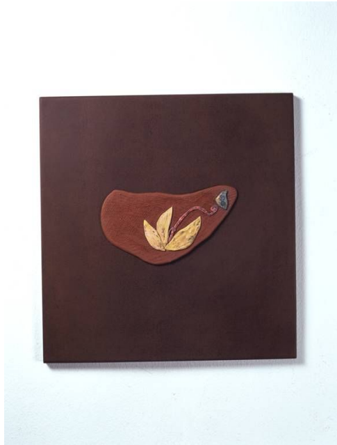
<작품 1> 日常 & INSIDE (2004~2006) / 옹기토, 도자용안료, 수금, 36x36