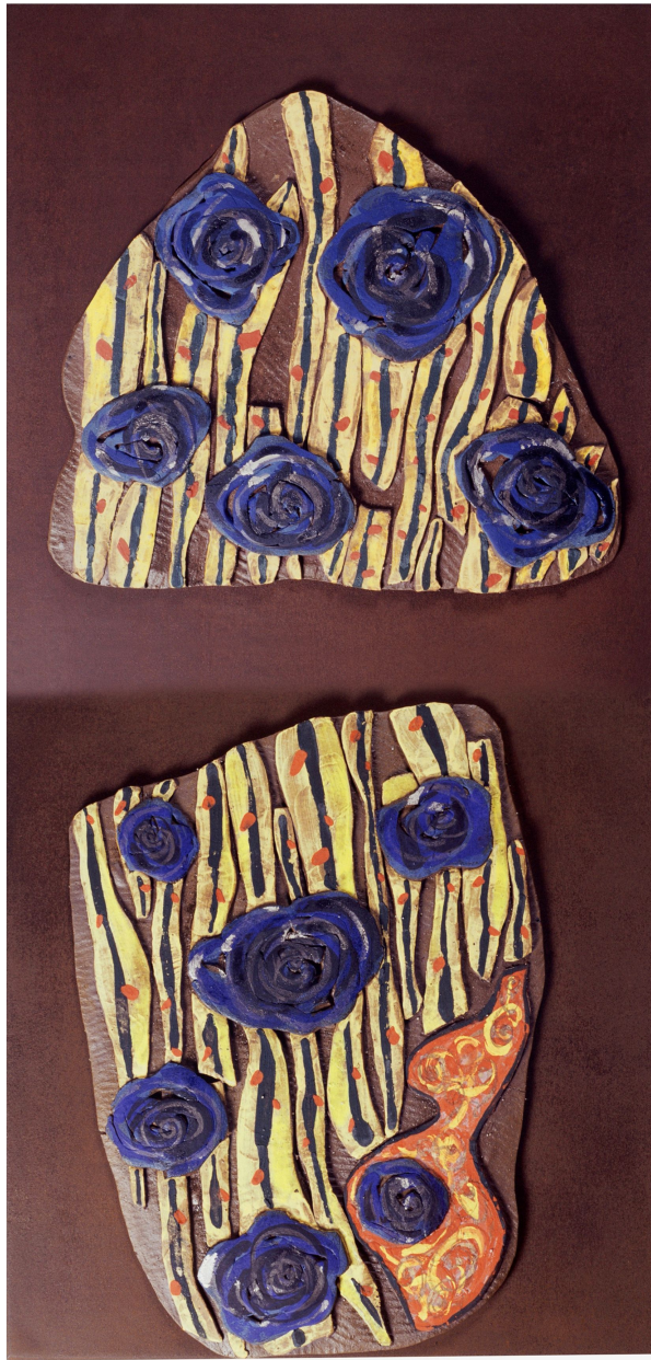
<작품 7> 日常 & INSIDE (2004~2006) / 옹기토, 도자용안료, 수금, 72x36