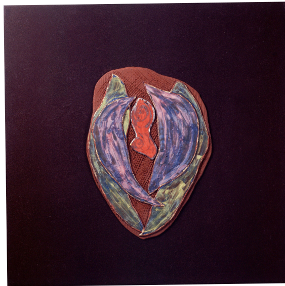
<작품 6> 日常 & INSIDE (2004~2006) / 옹기토, 도자용안료, 수금, 36x36