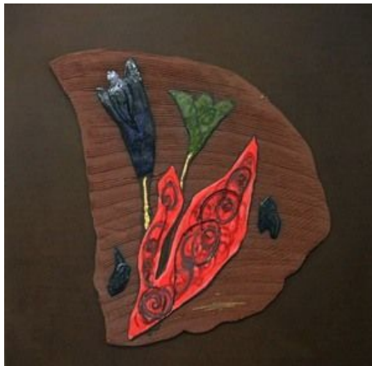
<작품 4> 日常 & INSIDE (2004~2006) / 옹기토, 도자용안료, 수금, 45x45