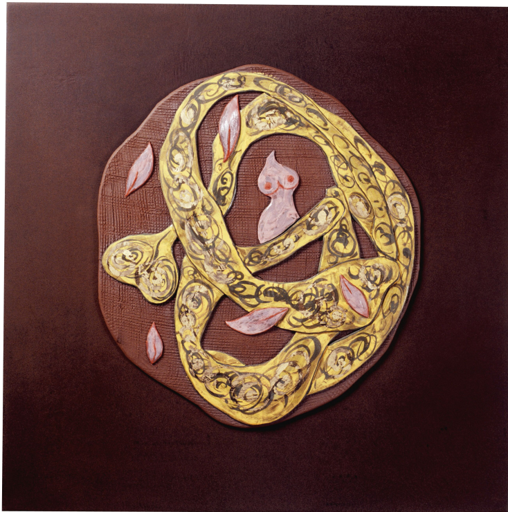
<작품 9> 日常 & INSIDE (2004~2006) / 옹기토, 도자용안료, 수금, 45x45