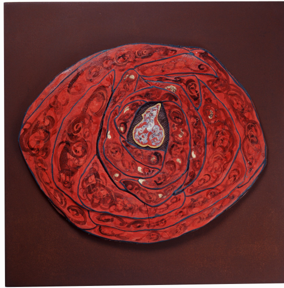
<작품 5> 日常 & INSIDE (2004~2006) / 옹기토, 도자용안료, 수금, 45x45