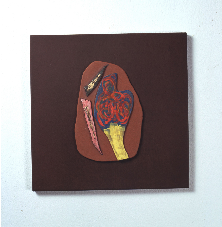
<작품 10> 日常 & INSIDE (2004~2006) / 옹기토, 도자용안료, 수금, 30x30