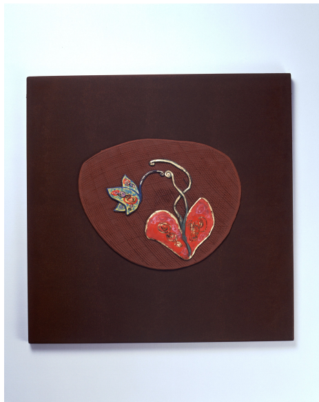
<작품 2> 日常 & INSIDE (2004~2006) / 옹기토, 도자용안료, 수금, 36x36