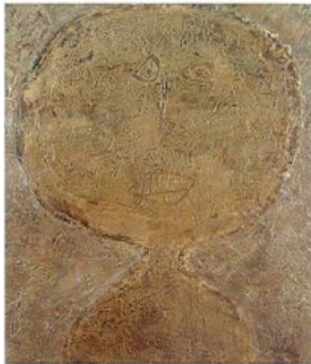
<도판 2> 돌로 된 여인, 1950