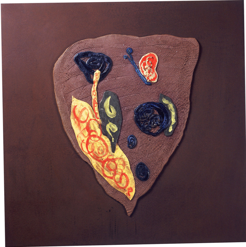
<작품 8> 日常 & INSIDE (2004~2006) / 용기토, 도자용안료, 수금, 45x45