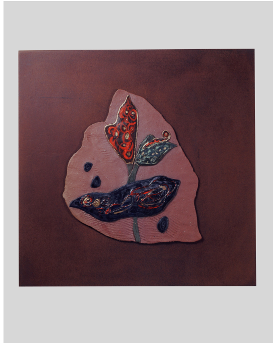
<작품 3> 日常 & INSIDE (2004~2006) / 옹기토, 도자용안료, 수금, 45x45