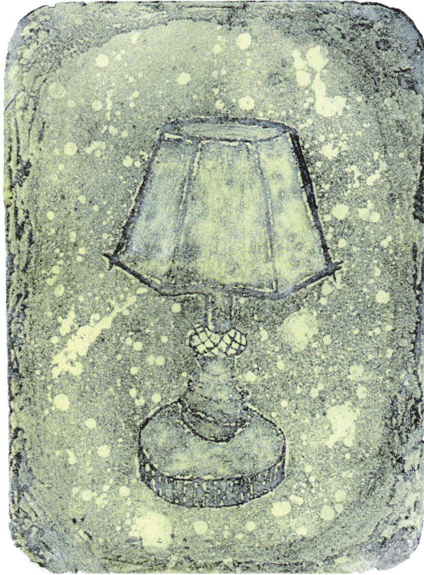
[작품 12] <Afterglow>, 30×21cm, 종이에 에칭, 아퀴틴트, 헤이터 기법, 2022