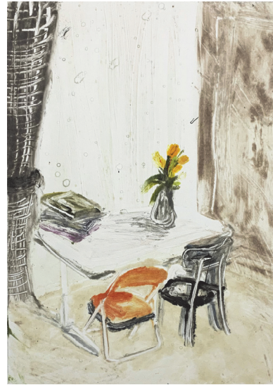
[참고 도판 6]