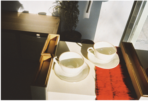
[참고 도판 2]

2011년 10월 11일, 런던 테이트 모던 터빈 홀에 11분 분량의 35mm 필름이 13m 높이의 거대한 흰색 돌기둥 위에 영사되기 시작했다. 5) <필름>은 영화 상영을 위한 필름이 아닌 거대한 비율로 확장된 35mm 셀룰로이드 필름 그 자체였으며, 빛에 의한 필름의 변화와 흑백, 컬러 손자국 등이 자유롭게 섞인 화면의 내용은 구상과 추상, 실내와 실외, 자연과 인공 등 다양한 주제들을 다룬다. 찰나의 현상을 표현해 내는 필름의 사진적 본성을 활용하여 풍부한 미적 효과들을 보여주고 있다. 6)