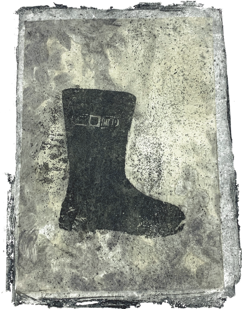
[작품 8] <장화>, 50.5×40.5cm, 종이에 모노타입, 아퀴틴트, 2022