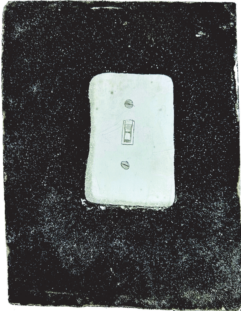
[작품 11] <on/off>, 60×42.5cm, 종이에 에칭, 아쿼틴트, 2022