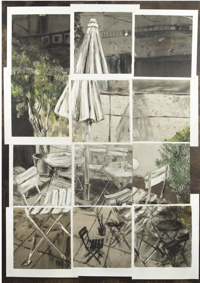
[작품 5] <밤산책>, 130.5×97cm, 종이에 모노타입, 2022

이 작품은 늦은 밤 산책 중에 포착한 장소를 바탕으로 재구성한 작품이다. 작업을 시작하기 전에는 쉽게 잠들지 못하는 날이 많았고 그럴 때마다