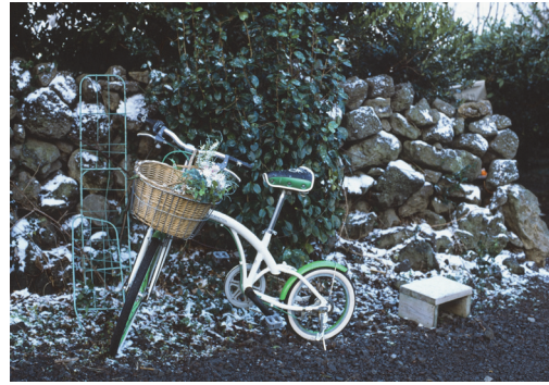
[참고 도판 3]