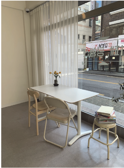
[참고 도판 5]