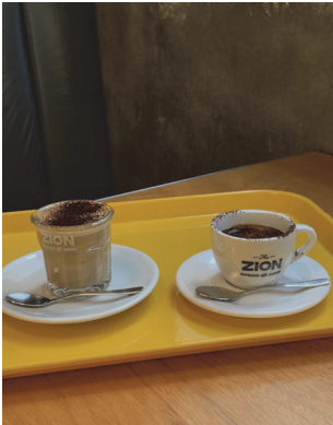
[참고 도판 7]

반영되어 있다. 좋아하는 색감으로 꾸며내거나 선호하는 패턴을 포인트로 주거나 통일된 자재로 맞추는 등 공간에 대한 애정을 기반으로 각각의 이야기를 가진 사물들로 꾸러진다.