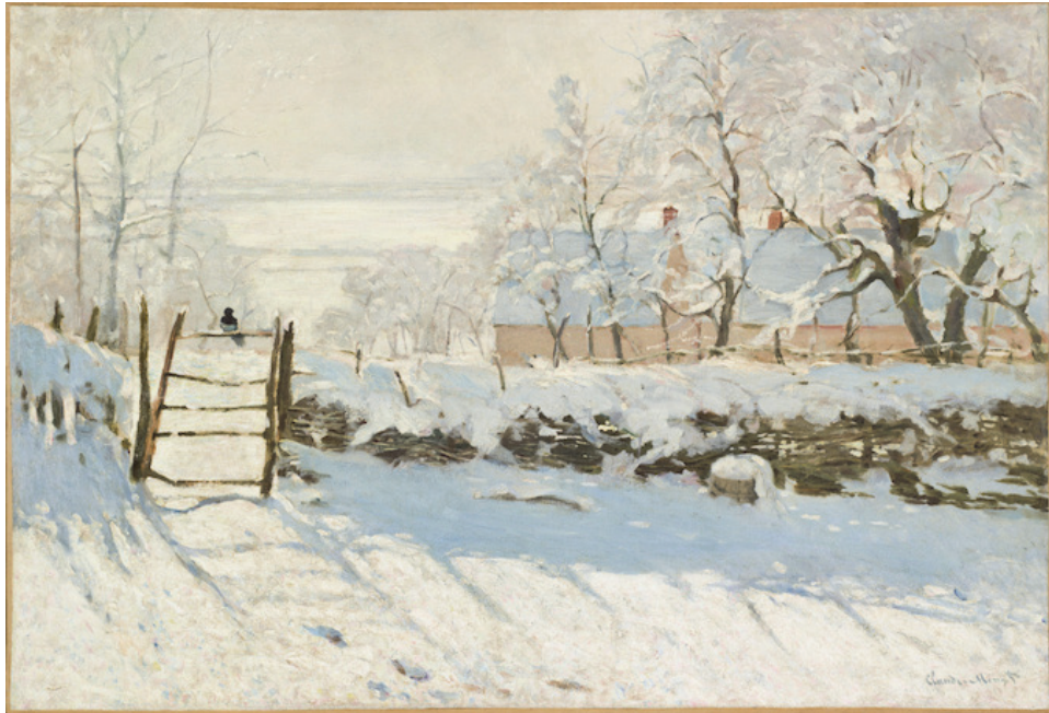
[참고 도판 4] <La Pie>, Entre 1868 et 1869, Huile sur toile, 89×130cm, Musée d'Orsay.

그의 대표적인 작품 중 하나인 <La Pie>는 에트르타 근처의 시골 마을에서 그린 설경이다. 그의 작품 중 가장 동양적인 작품으로 정중동(靜中動), 즉 조용한 가운데 미세하지만, 까치의 움직임이 두드러지게 나타난 작품 7) 이며, 짧은 행복의 순간이 담겨있다. 오르세 미술관에서 실제로 접한 <까치>를 통해 따사로운 겨울의 햇살, 빛과 그림자를 직관적으로 표현한 모네의 작업에서 즉각적인 시각언어를 경험할 수 있었다. 미술관 홈페이지에서 설명하는 이 작품의 제작과정은 그가 살던 에트르타 근처의 시골 마을에서 그려진 풍경이라고 얘기한다. 작가는 작품을 통해 심각한 의미나 메시지를 이야기하기보단 그의 눈에 보이는 빛 그 자체를 작품에 담아내었다.