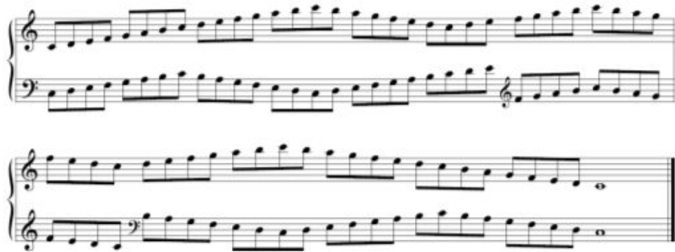
<악보-5> RCECP 테크닉(스케일)- Formula Pattern 2급 예

<악보-6>은 테크닉 요목 중 코드 으뜸음에서 4개의 음이 교차되는 패턴이다. 제시된 악보는 9급에 속하며 3화음의 1전위와 2전위 형태가 같은 패턴으로 교차되어 나타난다. <악보-7>의 I-VI-IV-V4/6-V8-7-I로 진행되는 C코드의 종지형도 함께 제시하였다.