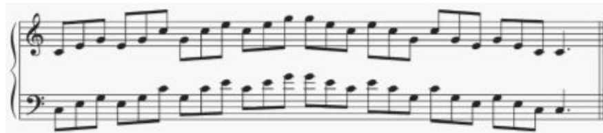
<악보-15> AMEB 테크닉 1급 아르페지오 예 126)

음역에 있어서 3급까지는 주로 1~2옥타브로 연주하고 4급부터는 4옥타브가 등장하고 2급부터 화성단음계와 가락단음계가 함께 제시되어 있다. 또한 평가 항목에 4급부터는 p, f, mf, cresc 등으로 이루어진 다이내믹 레벨을 지켜 연주할 것이 제시되어 있다. 6급부터는 스케일에서 장단조 뿐만 아니라 딸림 7 화음과 감7화음이 나타나며 7급부터 장단조, 딸림7화음의 전위형을 연주해야 한다. 위에 제시된 표와 같이 8급에서는 이전 급수와 다르게 스케일에서 세 개의 그룹으로 나누어 ①의 그룹 1(C, E \flat , B, a, c, g \sharp ), 그룹 2(F, A \flat , A, d, f, f \sharp ), 그룹 3(E, F \sharp , B \flat , c \sharp , e \flat , g) 중 지원자가 하나의 그룹을 선택하여 연주한다. 아르페지오도 마찬가지로 3개의 그룹 중 하나를 선택하여 연주한다.