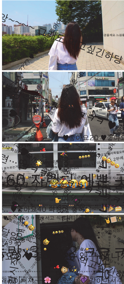
【작품 7】 Text Attack