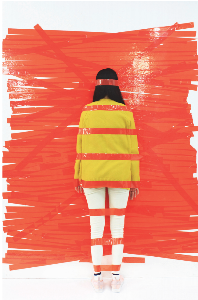
【작품 1】 타인의 영향으로 만들어진1