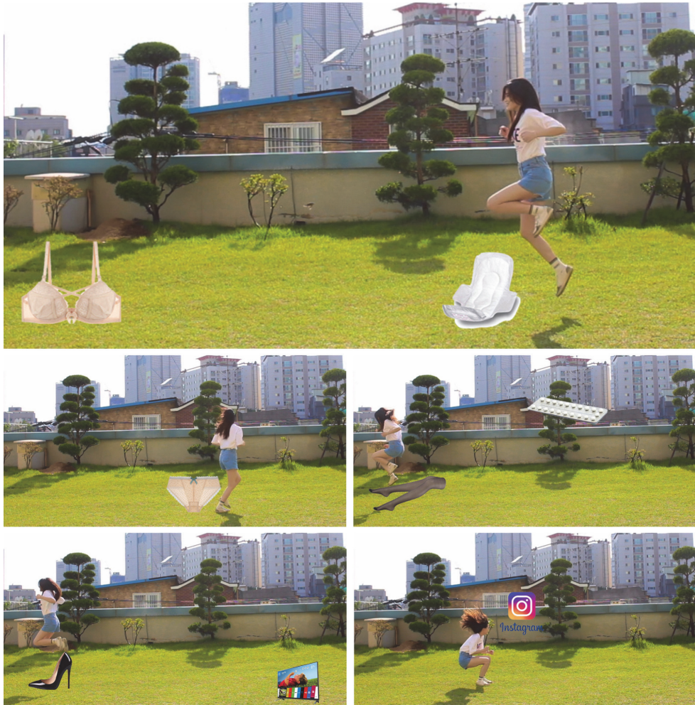
【작품 6】 Run like a girl