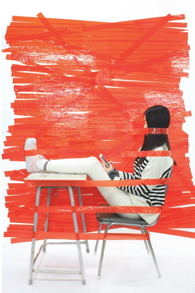
【작품 4】 타인의 영향으로 만들어진4