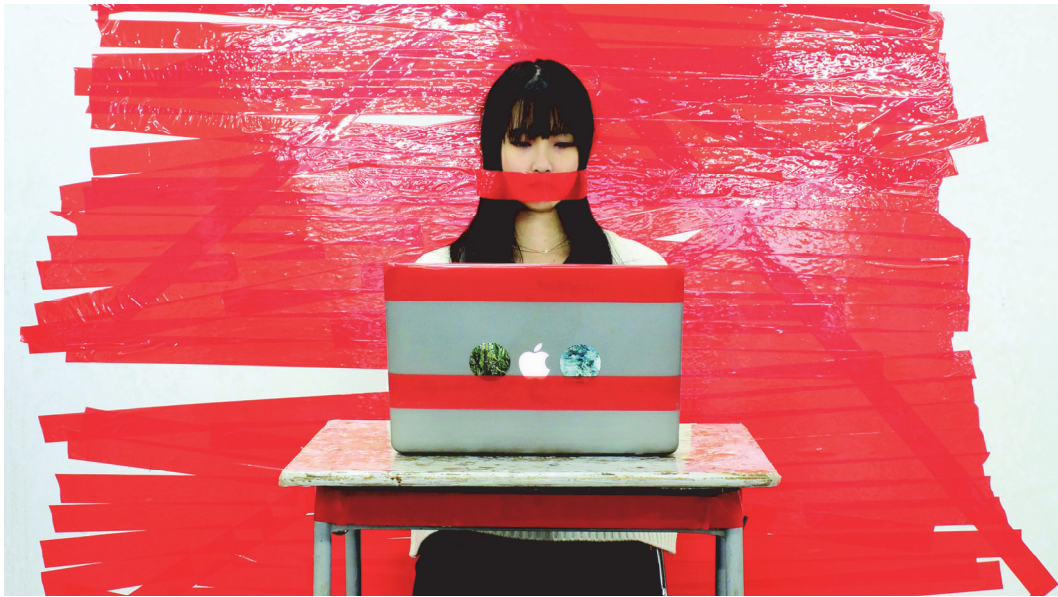
【작품 5】 타인의 영향으로 만들어진5