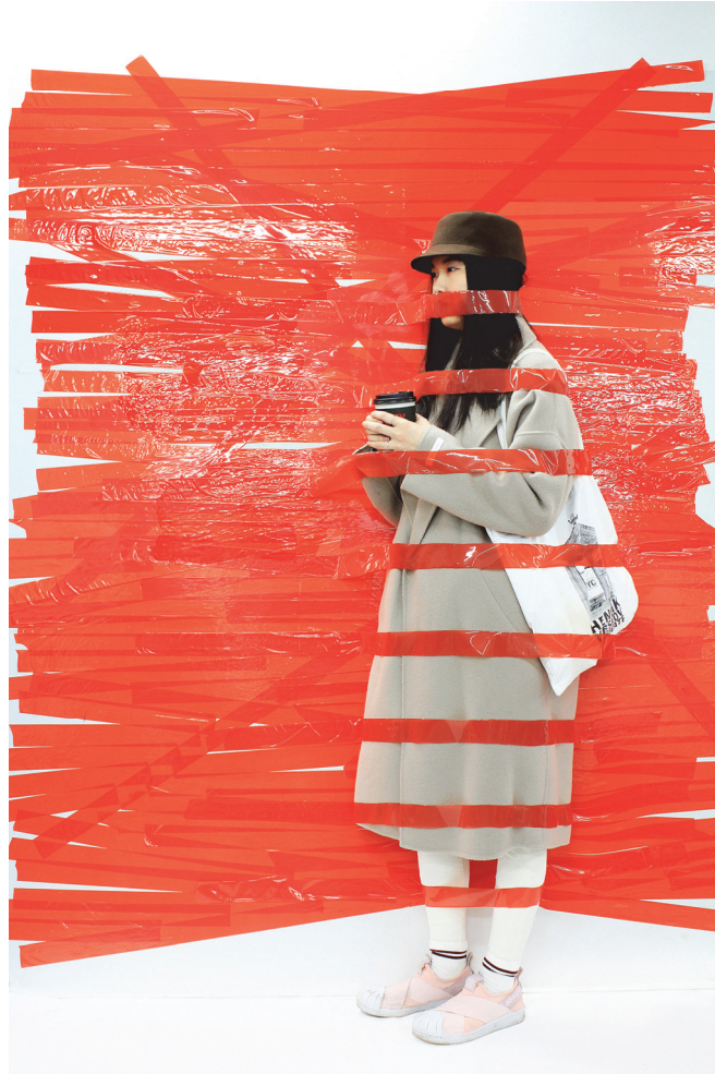
【작품 3】 타인의 영향으로 만들어진3