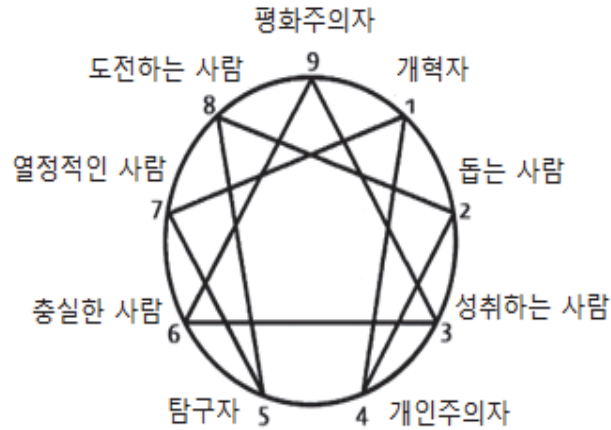
<그림 2> 에니어그램 아홉 가지 성격유형의 이름

에니어그램의 아홉 가지 성격유형은 각각 다른 특징을 나타내며 구체적인 특징은 다음과 같다. 1유형은 원칙적이고 이상적이다. 1유형의 사람들은 매사에 완벽을 기하며 옳고 그름을 따지기를 좋아하고 마음속에 구체화된 한가지의 옳은 원칙을 굳게 믿으며 이에 따라 결정한다. 이들은 정직하고 양심적이며 모든 일을 꼼꼼하게 계획하고 정확하게 처리하고자 한다. 건강한 1유형들은 확고한 자기주장이 있으며 좋은 성과를 이루기 위해서 모든 노력을 다한다 (Goldberg, 2001).