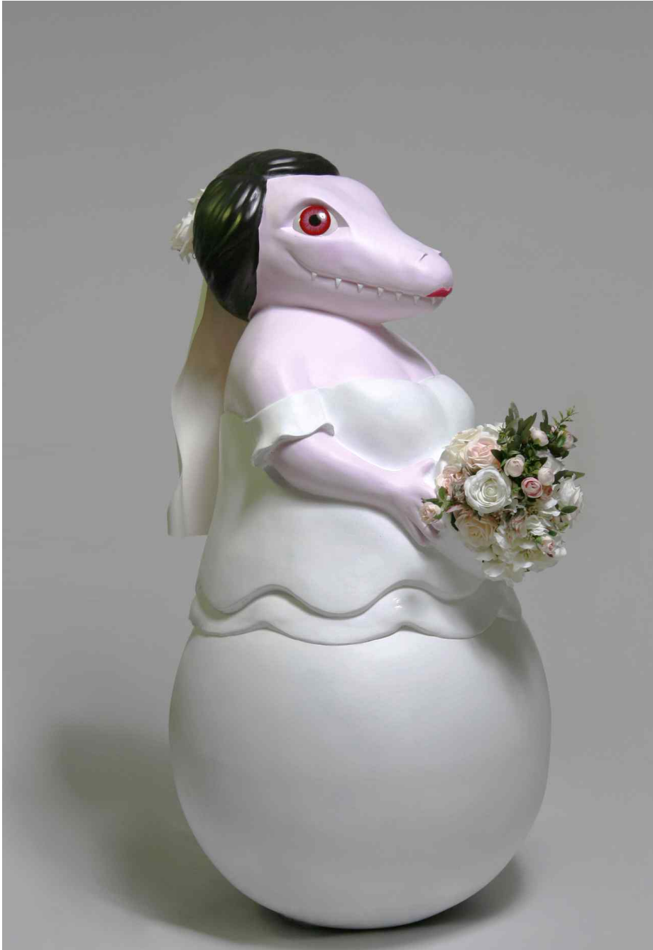
【작품 1】 JinJoo 62 x 62 x 132cm / 2015