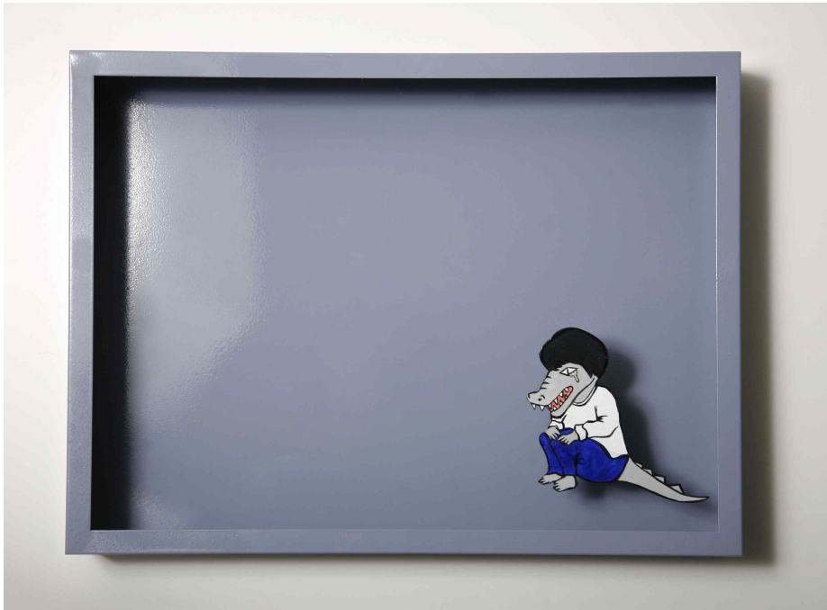
【작품 7】 melancholic / 30 x 40 x 6cm /2015