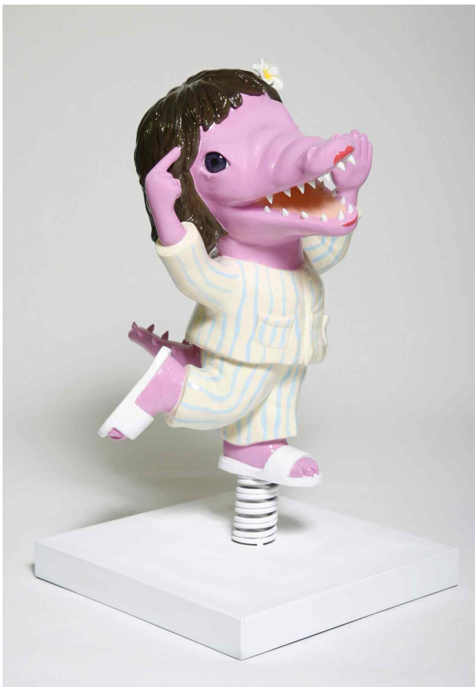
【작품 6】 Bora /40 x 40 x 67cm / 2015