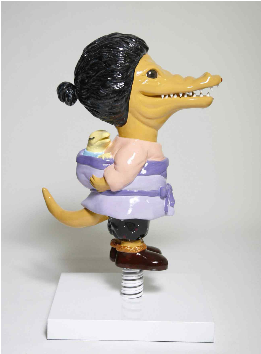
【작품 3】 MiOk / 40 x 40 x 73cm / 2015