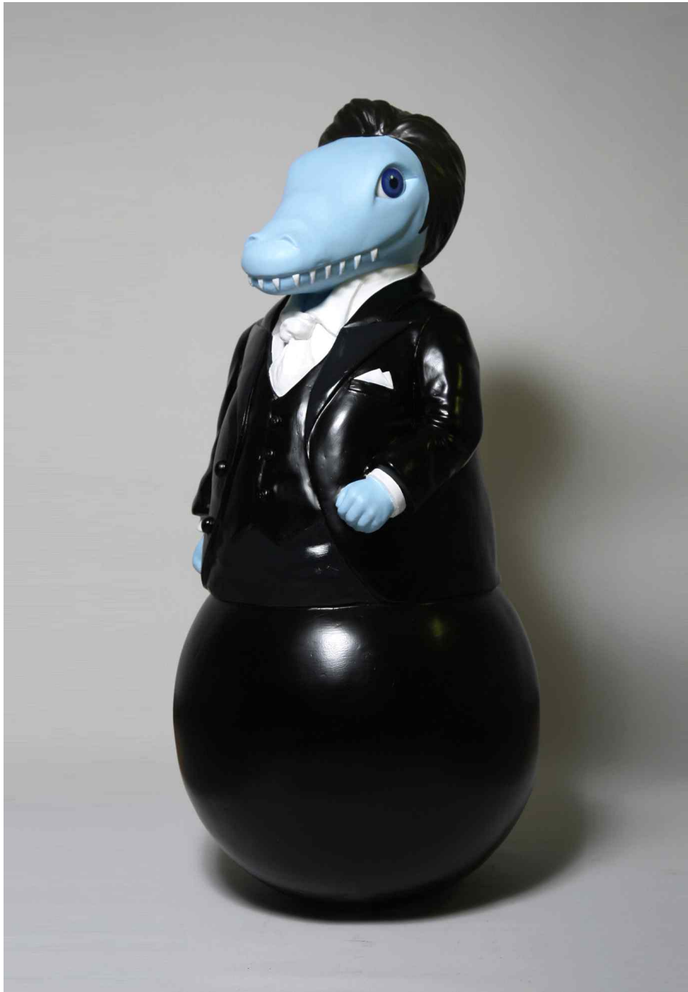
【작품 2】 DongHyun / 62 x 62 x 145cm / 2015