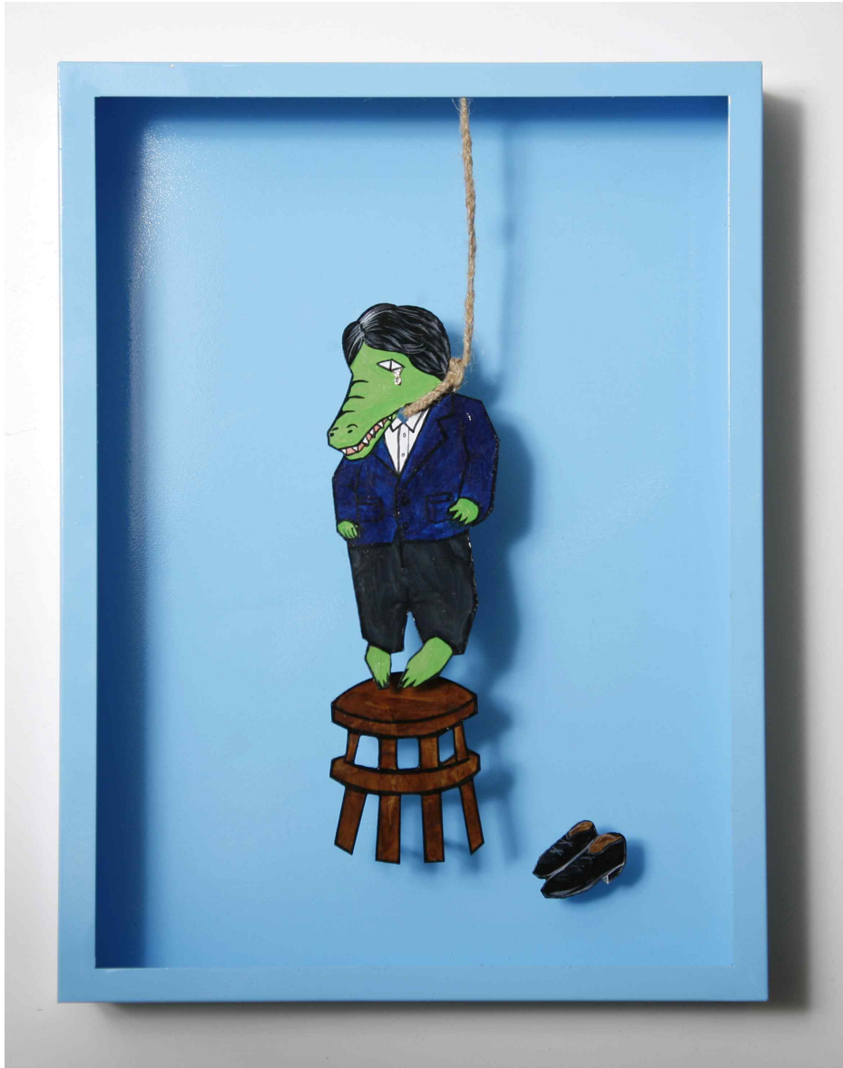
【작품 8】 A suicide / 40 x 30 x 6cm /2015