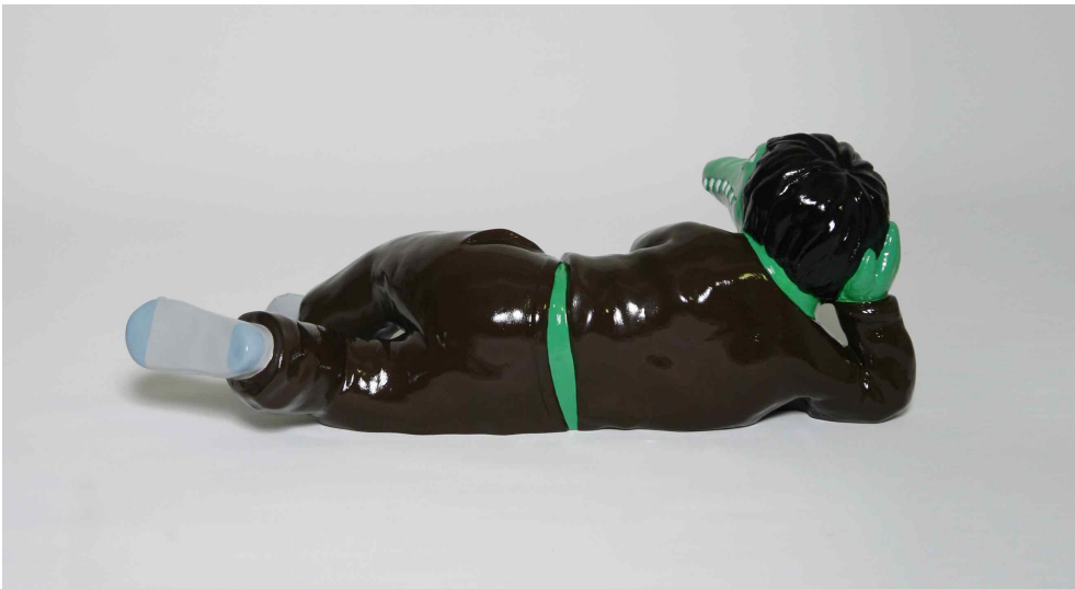
【작품 5】 TaeWan / 67 x 38 x 25cm/ 2015