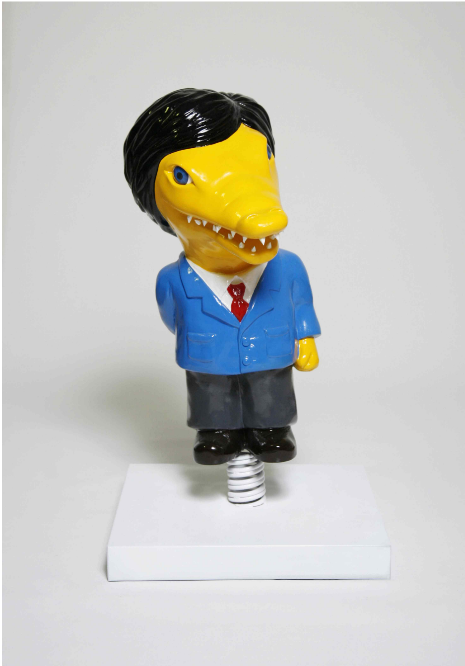
【작품 4】 JaeWoo / 40 x 40 x 70cm / 2015