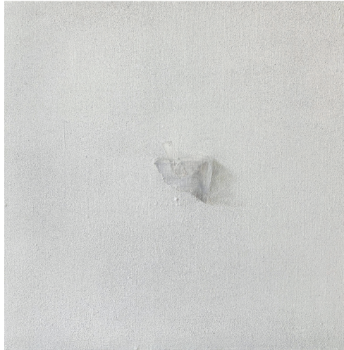
[작품 9] 흔적 1, oil on canvas, 45.5×45.5cm, 2024

세계로 상징되는 흰 벽면을 상단에 배치하고, 아날로그를 상징화한 나무 바닥을 하단에 배치하여 디지털의 근간이 되는 아날로그의 면모와 더불어 디지털이 우선시되는 사회 풍조를 가시화하였다.