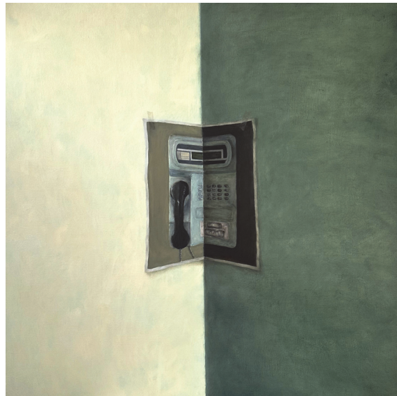
[작품 3] 기다리다, oil on canvas, 97×97cm, 2023

전반적인 색 처리는 원색을 자제하고 푸근하고 따뜻한 분위기를 연출하기 위해 선별하여 색을 사용하였다. 요즘 유행하는 필름카메라의 레트로 감성보다는 실내 벽에 내리치는 한낮의 따사로운 공기와 온도를 담고자 하였다. 내가 선택한 아날로그 사물 이미지는 신속하고 편리한 것과는 거리가 먼 것으로, 화면 속에서 아련함과 따사로움을 끌어낸다.