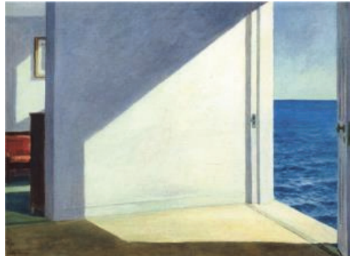
[도판 8] Edward Hopper, Rooms by the Sea, oil on canvas, 74.3x101.6cm, 1951, Yale University Art Gallery, New Haven, CT

앞에서 언급한 호퍼의 작품과 나의 작품은 직선과 사선으로 캔버스 화면을 분할하고, 차분한 색감이 구조를 이루는 것에서 유사성을 찾을 수 있다. 호퍼는 작품에서 고독, 침묵, 공허함, 무기력 등의 감정을 전달하기 위