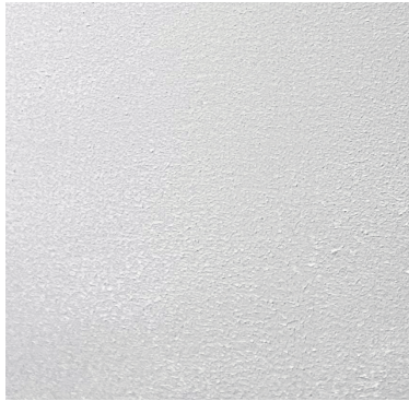
[도판 11] '흔적 1'의 배경 부분 이미지 컷

경 작업을 할 때 물감을 두껍게 도포 해 판화용 롤러로 문질러서 거칠고 차가운 벽의 이미지를 두드러지게 하였다. 이는 급속한 발전의 속도를 따라가지 못하면 도태되는 현실 세계의 모습을 내포한 회화적 표현이다.