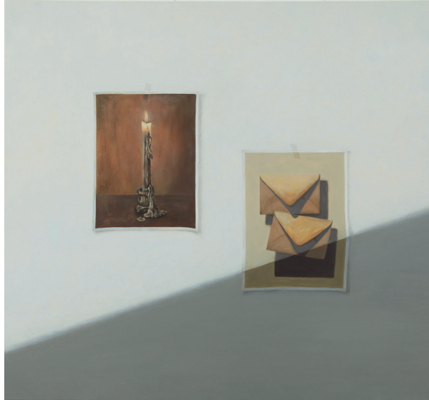
[작품 1] 마음, oil on canvas, 97×97cm, 2023

촛불은 흔히 인간의 염원 혹은 자신의 몸을 태워 어둠을 밝힌다고 해서 희생의 상징으로 해석되는 한편, 서양미술사에서는 인생의 유한성과 덧없음을 뜻하기도 한다. 전쟁을 경험했던 독일 화가 게르하르트 리히터(Gerhard Richter, 1932년생)는 약 25점의 촛불과 해골 소재의 연작을 남겼는데, 명상과 죽음, 침묵에 관한 감정을 이야기한다. 33) 나는 이 작품에서 앞서 말한 의미들에 더해 불변하는 아날로그적 사물로서의 지위를 부여하고자 한다. 어둠을 밝히기 위해 사용했던 도구는 초, 석유 등불, 가스등, 백열등, 형광등을 거쳐 LED 등까지 많은 발전을 해왔다. 요즘은 대부분 형광등이나 LED 등을 사용하고 있지만, 촛불도 여전히 사용하고 있다. 실용적인 면에서는 정전이 됐을