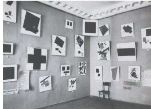
[도판 6] '0.10: 마지막 미래주의 회화 전시회'의 카지미르 말레비치 섹션, 페트로그라드, 1915(전시실 귀퉁이에 「흰 바탕의 검은 사각형」이 있다.)

러시아의 화가 카지미르 말레비치(Kazimir Severinovich Malevich, 1878.2.23.~1935.5.15.)는 1915년 페트로그라드에서 열린 ‘0.10: 최후의 미래주의자 회화 전시회’에서 절대적으로 순수한 기하학적 추상을 표방한 ‘절대주의’를 처음으로 선보였다. 39점의 캔버스는 구조화되지 않은 공간에 원초적 색채의 기하학 형태로 환원된 작품이었다. 특히 「흰 바탕의 검은 사각형」에서 회화적 수단을 최대한 절제하여 환원주의의 표상을 창조하였는데,