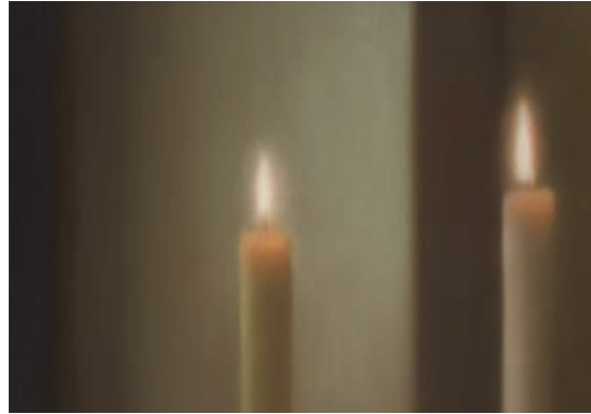
[도판 10] Gerhard Richter, Zwei Kerzen (Two Candles), oil on linen, 1982, 서울 리움 미술관 소장

때, 혹은 악취 제거나 심신 안정용으로 향초를 사용하기도 하고, 사회문제가 발생했을 때 촛불 집회에서 초는 순응하지 않는 저항의 의미로 등장하기도 한다. 기능적인 면을 넘어선 염원의 가치가 더해져 초의 생명력을 연장시킨다고 생각한다.