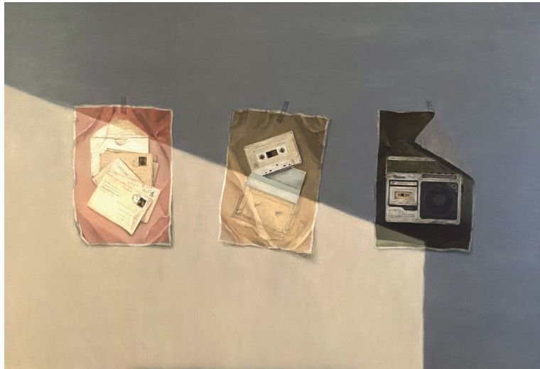
[작품 7] 나의 아날로그에게, oil on canvas, 112.1×162.2cm, 2023

만, 그것이 붙잡고 있는 아날로그 TV에 대한 그리움과 사라져감에 대한 안타 까워하는 마음까지도 작다 할 수는 없을 것이다.