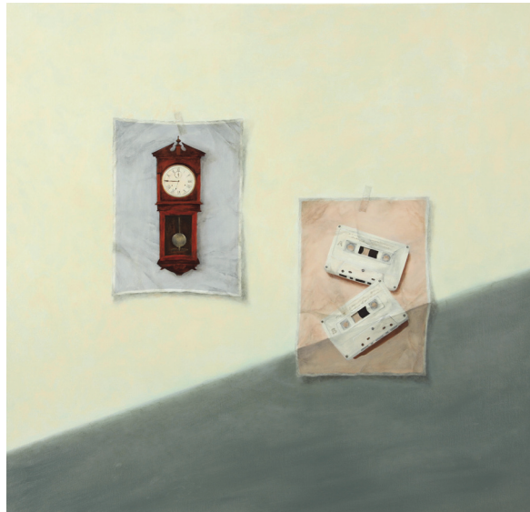
[작품 2] 소리의 시간, oil on canvas, 97×97cm, 2023

원목 께종 벽시계는 1980년대 전후 주택의 거실 벽면에 걸어 사용한 대형시계이다. 매시간 종이 울리는 실용성과 고풍스러운 장식성을 가진 추시계로 대중들에게 많은 사랑을 받았다. 매시간 현재 시각을 알려주는 벽시계의 께종소리는 거실 공간을 진동하면서 마치 교회나 성당의 종소리처럼 마음을 차분하게 하고 경건한 느낌을 준다. 요즘은 빈티지, 복고풍, 엔틱, 레트로 감성을 추구하는 복고상품으로 다시 선보이고 있기는 하지만 시대 변화에 따른 시계 디자인의 변화, 소형화, 스마트폰의 기능 수행 등으로 그 의미와 역할이 많이 변했다. 스마트폰에 익숙한 현대인은 시간을 확인할 때 디지털 화면을 통해 대부분 텍스트로 파악한다. 개인적 선호에 따라 다양한 알림음을 매번 다르게 설정할 수 있고, 원치 않으면 그 알림음을 무음화 시킬 수도 있다.