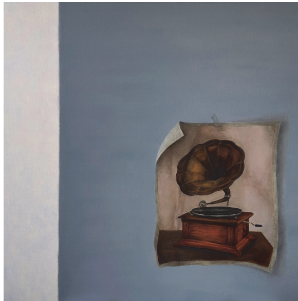
[작품 4] 소리 기억, oil on canvas, 91×91cm, 2023

작품 안에서 출력물을 부착하고 있는 투명 셀로판테이프 역시 화면의 밝은 면과 어두운 면에 하나씩 붙어있는데, 이는 공중전화가 활성화됐던 과거에 대한 그리움과 디지털 시대에도 명맥을 유지하고자 하는 바람을 표현하는 장치로 작용한다.