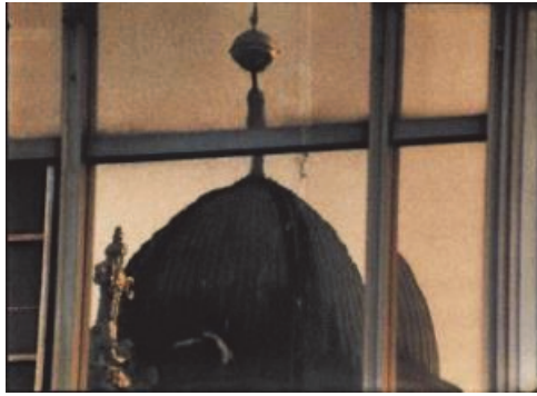
[도판 1] Tacita Dean, 궁전(Palast), 16mm film projection, color, optical sound, 10:30min, 2005.

된 필름으로 쇠퇴와 시대착오를 통 한 시간성을 표현한다. 던은 폐허 화된 구조물, 낡은 오브제와 같은 것을 촬영 소재로 삼는데 [도판 1] 의 작업에서 1976년 동독의 전형 적 공산주의 양식 건축물인 공화국 궁전을 일몰이 지는 시간에 창문 표면의 반사되는 이미지로 담아냈 다. 동독 의회로 사용되던 궁전을