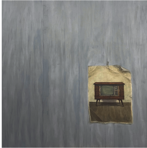
[작품 6] 드르륵 텔레비, oil on panel, 97×97cm, 2023

시간의 흐름 속에서 낡아지고 흘러간 과거가 된다. 잠재적 과거의 산물이자 혁신의 대상이 되는 순리에 따라 할머니의 발재봉틀은 현실에서 부재하지만, 나의 기억 속에는 존재자로서 살아있다.