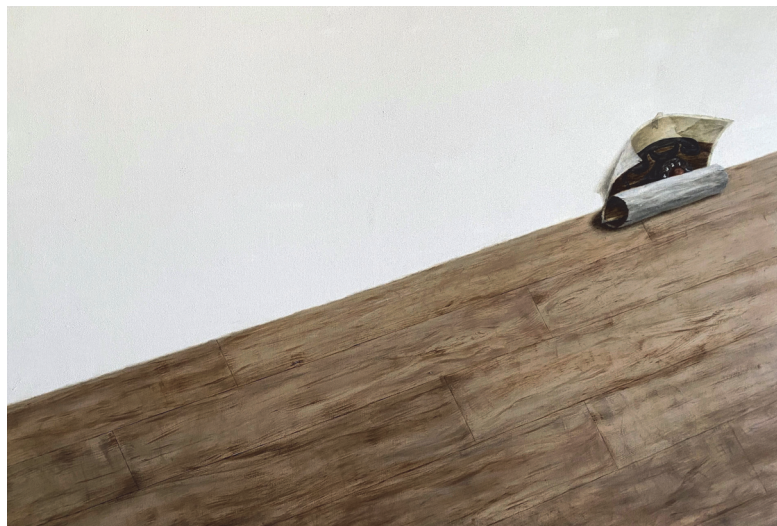
[작품 8] 떨어지다, oil on canvas, 112.1×162.2cm, 2023

작품에 등장하는 옛날 엽서와 우표는 현재 찾아보기 쉽지 않은 관계로 인터넷에서 수집한 이미지를 편집하여 작업했고, 카세트테이프는 내가 소유한 것을 직접 촬영하여 작품에 담았다. 레트로 바람을 타고 재해석된 디자인이 아닌 구형 카세트 라디오를 작품에 내세우기 위해 품물시장에서 발견한 카세트 라디오를 촬영하고 작품화하였다. 나는 어릴 때 라디오를 들으며 잠이 들었고, 카세트 라디오와 카세트테이프를 사용해본 경험이 있다. <별이 빛나는 밤에> 주파수를 맞추던 기억이 손끝에 남아있고, 이 불편하면서도 설레던 추억을 연약한 셀로판테이프에 담아 표현하고 싶었다. 얇은 셀로판테이프 한 조각으로 지나간 시간을 붙잡고 기억하려는 시도는 현실의 영역에서 뒤로 물러나 앞선 과거로 발을 들이는 의미로 볼 수 있을 것이다.