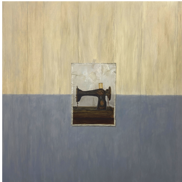
[작품 5] 할머니의 재봉틀, oil on panel, 97×97cm, 2023

진 자국은 지워지지 않는다. 마찬가지로 시대의 발전에 따라 음악을 향유하는 방식이 변해가는 것 역시 거부할 수 없는 현실이다. 이러한 세태에서 LP 레코드판과 턴테이블을 소유하고자 하는 사람들에게 실체가 없는 가상의 음원에 비해 물리적 실재, 촉각적 느낌, 눈앞에 보이는 형태와 더불어 풍부하고 자연스러운 음질이 아날로그 방식의 기록 매체인 LP 판을 찾게 하는 이유일 것이다. 이렇게 소수이지만 LP 판의 가치를 인정하고, 미약하게나마 붙잡고자 하는 이들의 마음을 투명 셀로판테이프에 의지한 모습으로 표현했다.