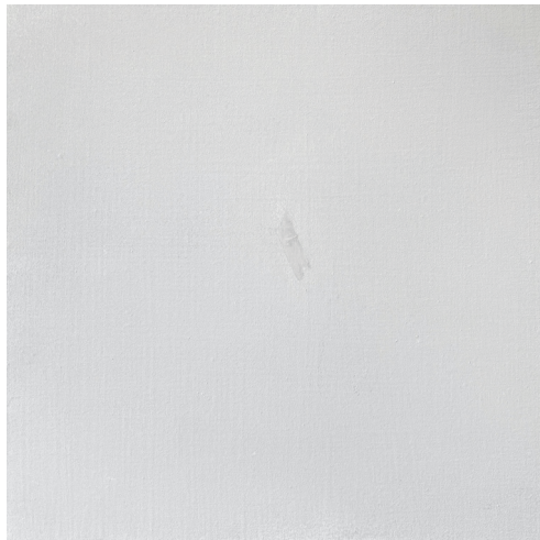
[작품 10] 흔적 2, oil on canvas, 45.5×45.5cm, 2024

앞선 작품들에서는 종이 위에 출력된 아날로그 사물 이미지를 투명 셀로판테이프로 부착해 벽면에 겨우 지탱하고 있는 형식을 취하고 있었다.