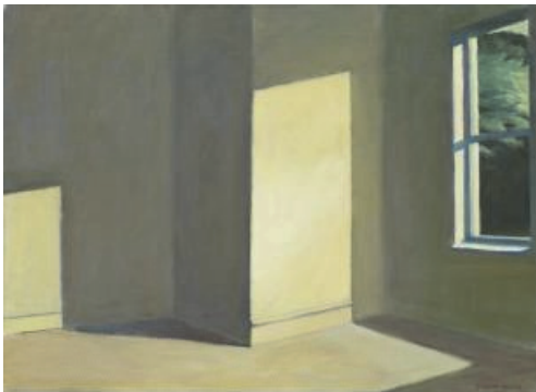
[도판 7] Edward Hopper, Sun in an Empty Room, oil on canvas, 73x100cm, 1963, Private Collection

현대생활이 불러오는 단절과 소외감을 표현하는 미국의 화가 에드워드 호퍼(Edward Hopper, 1882.7.22.~1967.5.15.)의 풍경화는 현실을 복제했다기보다 비어있는 공간을 창조하는 것에 가깝다. 31) 호퍼의 작품 「Sun in an Empty Room」과 「Rooms by the Sea」는 빛, 그림자, 창문, 벽의 요소들이 상호작용하여 침묵이 흐르는 듯한 공간을 연출한다. 비스듬히 기울어지고 각진 그림자는 관람자의 시선을 사선으로 유도한다. 공간의 내부에는 대상이나 인물 없이 빛과 그림자로 채우는데, 극도로 단순한 하드 에지는 텅 빈 내부에 보이지 않는 무언가의 존재를 암시한다. 32) 원초적이고 기하학적 형태가 두드러지는 빛과 그림자는 뉴트럴 톤의 색채와 어우러져 고립과 허무감을 불러오는 듯하다.