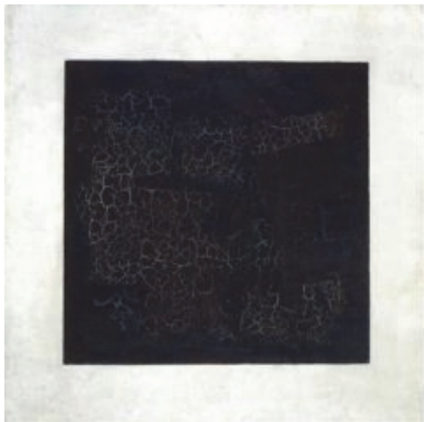
[도판 5] Kazimir Severinovich Malevich, Black Square on White Ground, oil on linen, 79.5x79.5cm, 1915, Tretyakov Gallery, Moscow

날로그 이미지이기도 하고, 디지털화에 잠식되어가는 아날로그 이미지이기도 하다. 작품 안에서 인쇄된 두 개의 이미지의 위치가 상이한데, 왼편의 시계는 아날로그 사물이지만 비교적 활용도가 높고, 오른편의 카세트테이프는 디지털 음원에 대체된 비율이 높아 현시점에서 일상적 사물은 아니기에 두 사물의 일상성 측면에서 비교하여 차등 배치하였다. 화면을 사진으로 분할하며 가로지르는 그림자로 아날로그에 덧씌워진 디지털의 그림자를 나타내고자 하였다.