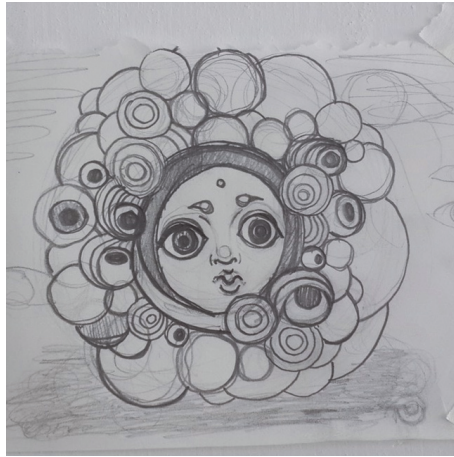
【작품3】 Drawing, 종이에 연필, 7.5cm×9cm