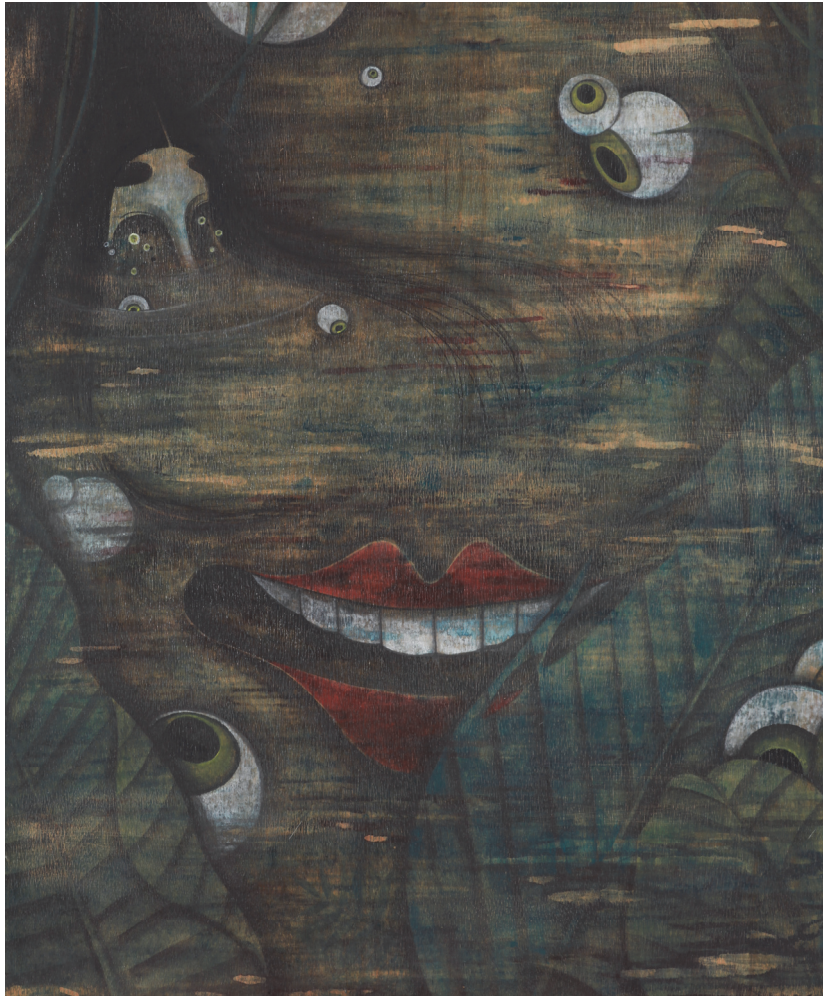
【작품6】恨 (한), 나무에 채색, 72.7cm×60.6cm, 2015

본인은 눈동자를 작업에 많이 활용하는데, 위의 작품처럼 악마의 눈(Evil eye)으로 타인이나 본인을 감시하는 역할로 등장 시키기도 하고, 눈물을 비유(比喩) 하는 매체로 묘사(描寫) 하기도 한다.