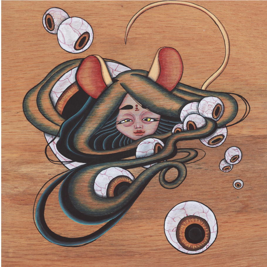
【작품1】 子 (쥐), 나무에 채색, 30cm×30cm, 2016