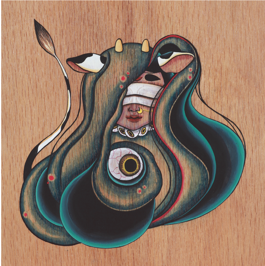
【작품9】丑 (소), 나무에 채색, 30cm×30cm, 2016