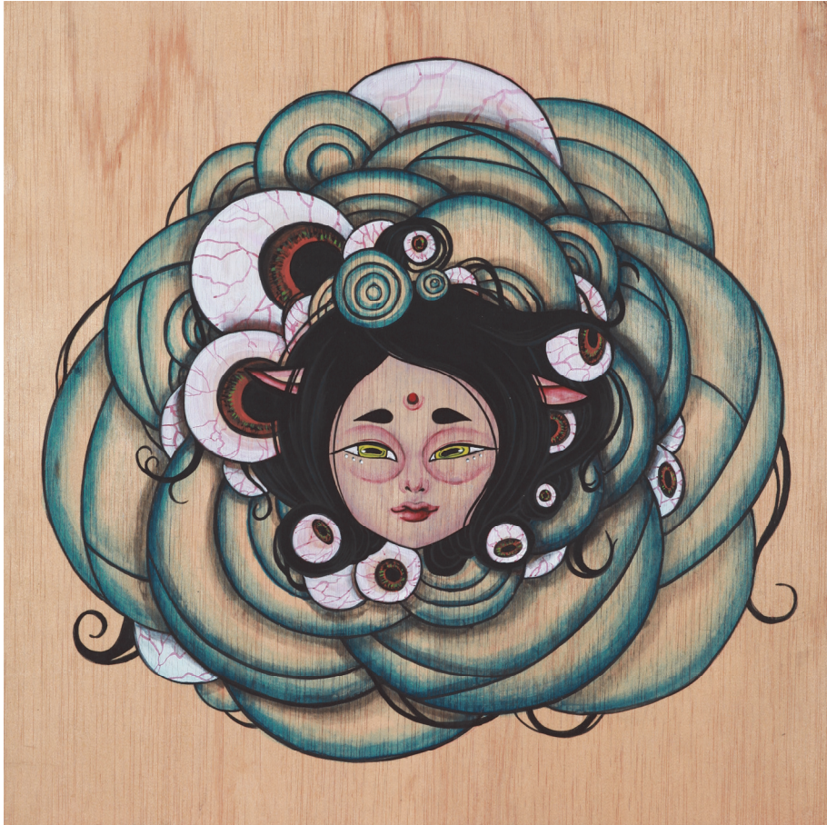
【작품4】 未 (양), 나무에 채색, 30cm×30cm, 2015