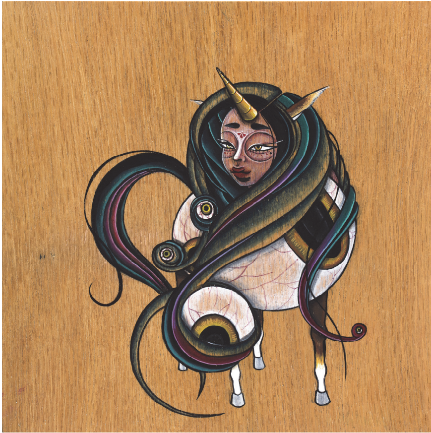
【작품11】午 (말), 나무에 채색, 30cm×30cm, 2017

아교포수 과정을 마친 화판 위에 미리 떠 놓은 스케치를 옮겨 먹으로 선을 그려주고, 편채(片彩)와 분채(粉彩)를 이용해 색을 한 겹 한 겹 쌓아 올려 주는데, 편채는 물계 타서 담(淡)하게 표현하고, 분채는 진한 농도로 개어 강하게 올려준다.