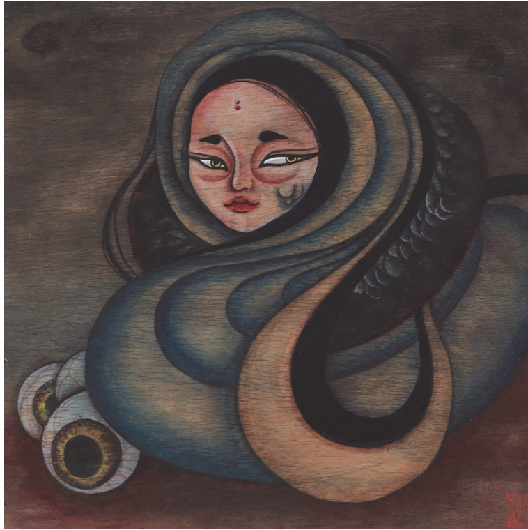
【작품12】 巳 (뱀), 나무에 채색, 30cm×30cm, 2015

두 번째로 초점(焦點)을 두었던 것은 동물 고유(固有)의 색 표현보다는 염원(念願)의 형상화를 뒷받침해줄 수 있는 색을 찾아 활용하는 것이었다.