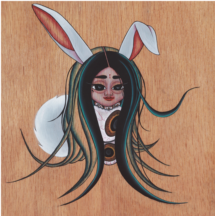
【작품13】 卯 (토끼), 나무에 채색, 30×30cm, 2016

즉, 그림 속에 주로 사용된 푸른색은 작품을 보는 이들의 마음이 하루라도 빨리 치유되고, 각자가 소원하는 바를 이룰 수 있기를 기원(冀願) 하며 복을 빌어주는 본인의 마음을 대변(代辨) 하는 색인 것이다.