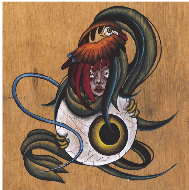
【작품10】酉 (닭), 나무에 채색, 30cm×30cm, 2017

종이에 할 때와는 다르게, 나무라는 소재에 직접 그림을 그리기 위해서 이 작업을 더 꼼꼼하게 진행해야 하는데 그렇지 않을 경우, 나무의 결 대로 그림이 번지거나, 벗겨질 수가 있기 때문에 적당한 농도의 아교 물로 가로, 세로, 대각선 방향으로 반복하여 칠해준다.