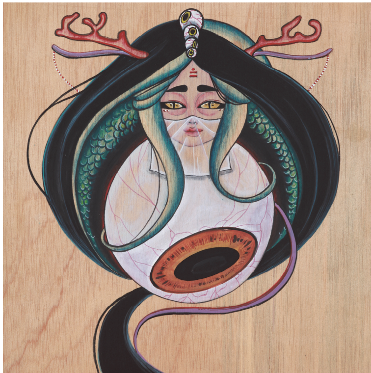
【작품8】辰 (용), 나무에 채색, 30cm×30cm, 2017

그 외에도 나무라는 소재(素材)를 선택하여, 작업을 하게 된 연유(緣由)에는 나무가 우리 민족의 정서(情緒)와 잘 맞는 소재라는 점, 자연을 상징하는 대표 이미지라는 점, 모진 역경(逆境)과 고난(苦難)을 이겨내는 인내와 끈기의 의미를 내포하고 있는 점 등, 작품을 통하여 전달하고자 하는 메시지와 잘 어울린다고 판단했기 때문이었다.