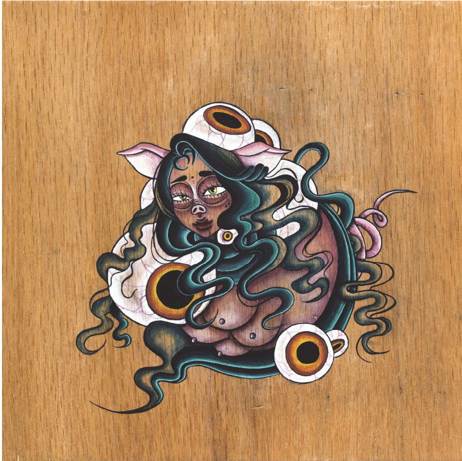
【작품2】 亥 (돼지), 나무에 채색, 30cm×30cm, 2018