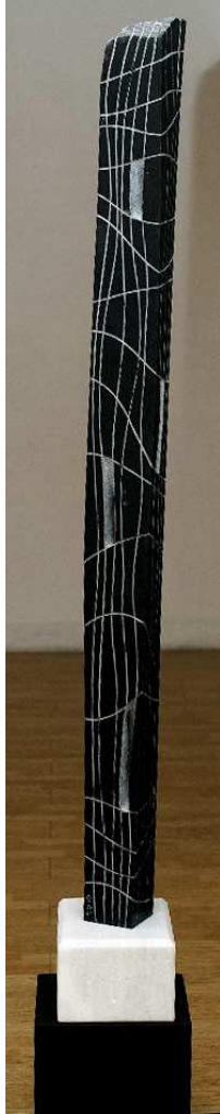
【작품 7】 어제의 부재, 오석, 100 x 50 x 1150 mm