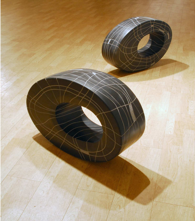
【작품 3】 어제의 부재, 오석, 660 x 190 x 480 mm (2점)