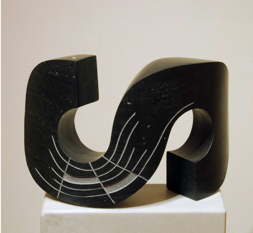
【작품 5】 어제의 부재, 오석, 400 x 300 x 220 mm