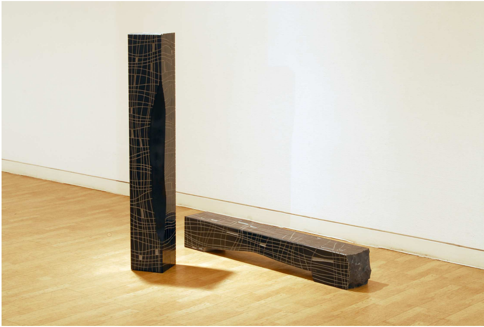
【작품 2】 어제의 부재, 오석, 190 X 190 X 1240 mm (2점)