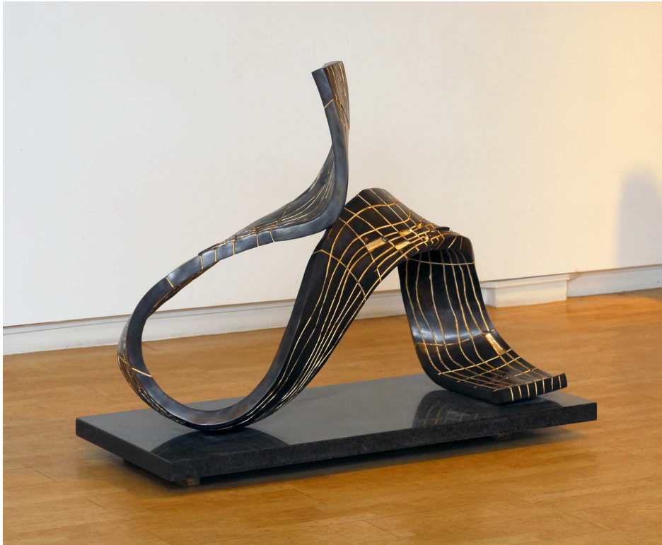
【작품 1】 어제의 부재, 1200 x 540 x 900 mm