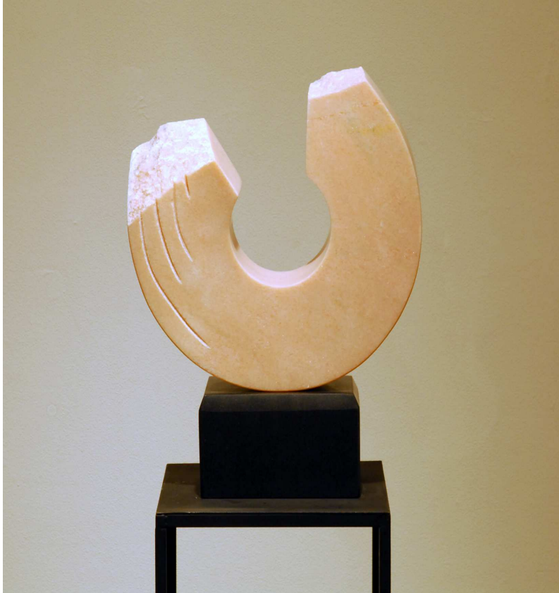
【작품 4】 어제의 부재, 이태리 대리석, 320 x 80 x 320 mm