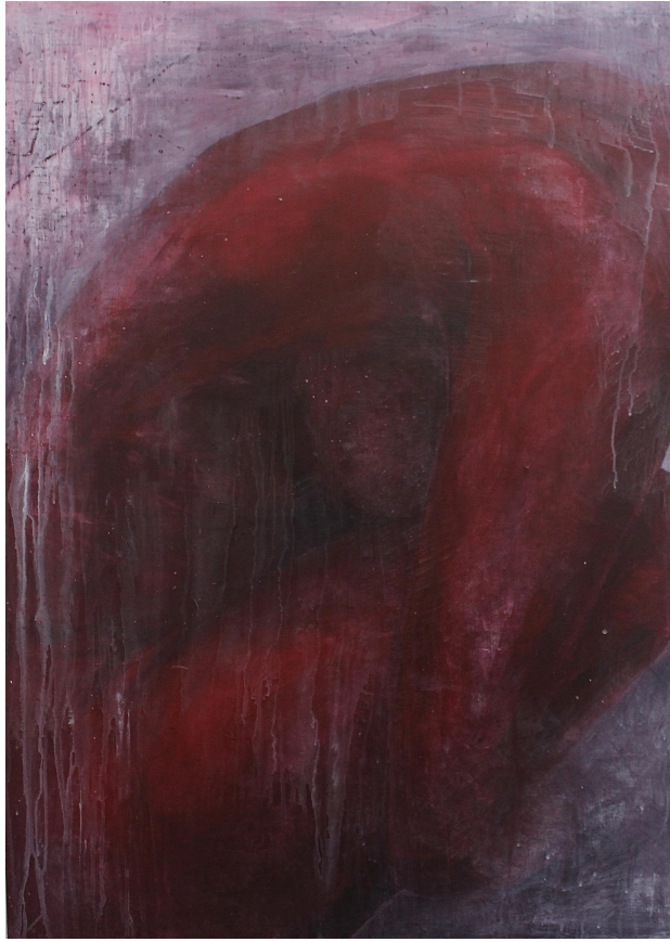
[작품 9] G35-13, 119.2x85cm, acrylic on panel, 2023

[작품 9]는 작품으로 활용한 이미지 선택과 처리에서 독특한 차별성을 가진다. 우선 가장 바탕이 되는 것은 몸을 최대한 웅크린 자세를 취한 뒤 촬영을 시도한 이미지이다. 캔버스 화면 중앙에 배치한 인물은 화면을 지배하는 것처럼 보이지만, 나는 신체를 구성하는 여러 요소의 경계를 불명확하게 만들고 인물의 묘사보다는 색 면을 강조하면서 평면적 인물을 화면에 구축하고자 하였다. 이에 반해 배경은 인물과 다소 대조적으로 처리했다. 평붓을 활용해 묘사보다는 붓의 역동적인 움직임을 강조하면서 인물을 표현했으나, 배경에는 물감을 흘리는 기법을 적극적으로 활용하여 붓질과는 다른 표현과