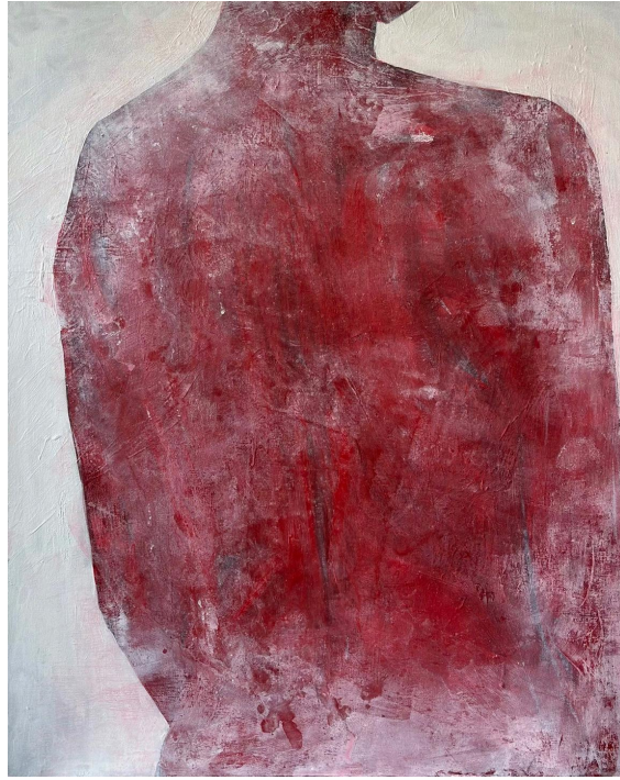
[작품 2] G35-03, 90.9x72.7cm, acrylic on panel, 2023

[작품 2]는 G35 시리즈의 두 번째 작업이다. G35 시리즈는 다발성경화증을 앓고 있는 나를 타자화하고 환자가 경험하는 고통과 그것의 해소를 시각적으로 표현하고 있다. 나는 캔버스에 인물 이미지를 그리는 과정에서 [작품 1]과는 다른 방식으로 나 자신의 신체를 그렸다. 나는 디지털카메라로 카메라를 등진 나의 뒷모습을 촬영하였다. 이후 촬영 이미지를 포토샵 프로그램으로 편집하여 여성의 신체 이미지로 보여지는 특성들을 강조하면서도 얼굴이라는 한 인물의 핵심적인 요소를 보이지 않게 하여 작품 속의 인물이 특정인으로 해석되지 않기를 의도하였다. 그 이유는 감상자들이 감정이입을 하는 등 작품과의 소통을 불러일으키기 위함이기도 하고 증상이 겉으로 확연히 드러나지 않는 나의 병의 특성을 담은 것이기도 하였다.