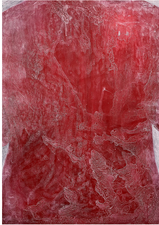
[작품 5] G35-02, 90.9x72.7cm, acrylic on panel, 2023

[작품 5]는 촬영부터 나의 몸을 더 가까이 촬영하여 초점이 명확하지 않은 신체 이미지를 소재로 삼았다. 그리고 회화 이미지 내에서도 작품에 사용한 이미지가 무엇인지 불명확하게 하고자 하였다. 화면을 가득 채우는 몸의 형상은 좌, 우 외각에 겨드랑이 정도만 보이는 단순화된 신체 이미지이다. 관람객은 이를 통해 사람일 수도 있다는 추측이 가능한데, 나는 즉각적으로 신체를 인지하지 못할 정도로 인체를 표현하였다. 다발성경화증을 처음 진단받았을 때 신체의 어떤 부분이 일반인과 달리 문제가 있는지, 어떤 증상으로 표출되는지, 아무것도 명확히 알 수 없었던 나의 모호한 전신 상태를 캔버스 화면 안에 확대한 나의 신체 이미지로 나타내고자 하였다.