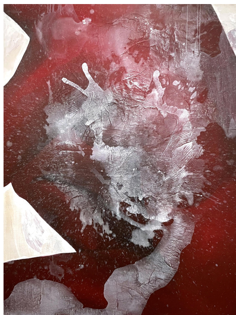
[작품 10] G35-16, 119.2x85cm, acrylic on panel, 2023

[작품 10]은 캔버스 표면 위에 먼저 파스텔 그라운드를 롤러로 압착시키고 건조 후 다시 모델링 페이스트를 쌓아 올려 표면 위에 다양한 질감을 만들려고 하였다. 여기에는 무엇인가에 기대지 않고 스스로 지탱하여 앉아 있지만 다소 불안해 보이는 인물 이미지를 포착하고 화면에 담고자 하였다. 인물 이미지는 이전보다 고채도의 빨간색 아크릴 물감으로 표현하고 화면과 배경 사이 분리성을 강조하여 사회와 고립되어 있는 상태의 나를 나타내고자 했다. 신체 이미지 위에 과감하게 올린 흰색 물감의 드리핑 표현은 내재된 나의 불안감을 표현하고자 하였다. 판넬 화면 상단에서 흰색 물감을 흘리는 기존의 방식과 달리 판넬을 바닥에 놓고 흰색 물감을 위에서 던지는 과정에서 불안과 상처가 전신에 점철된 인물 위에 흰색 물감의 탁한 물의 맺힘, 불규칙한 물의 줄기들이 불명확한 장기 형태를 연상할 수 있게 표현했다. 이러한 추상적 이미지의 요소들은 작품에서 나타나는 나의 막막한 감정과 불안을 효과적으로 전달하고자 한 것이다.