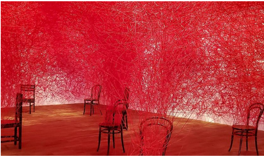
[도판 5] Chiharu Shiota, Between Us, 2020

창조해 내는 행위로 대신한다면 그것을 예술로써의 승화라고 할 수 있다고 했다. 이처럼 나는 내 몸의 상처와 제한된 상황을 흰색 아크릴 물감을 사용해 여러 기법을 활용하면서 표백하는 마음으로 그림을 그려낸다. 구체적인 방법적 측면에서 판화용 롤러를 사용하는 것은 나의 제한된 삶의 한계를 짓누르는 것을 표현하기 위함이다. 또한, 의료용 거즈를 사용하여 캔버스 표면에 접착하고 물감을 위에 바르는 행위는 캔버스 표면에 새로운 질감을 만들어내는 조형적 의도와 더불어 마치 나의 상처를 치료하는 장치로 접근하기 위한 것이다. 또 다른 방식으로는 목공용 샌드페이퍼로 몸의 상처를 떼어내면서 제거하듯이 화면 속 붉은색 신체를 반복적으로 문지르며 긁어낸다. 캔버스 화면에 투영된 나 자신을 롤러로 압착하여 문지르고 거즈를 붙이거나 닦아내고, 샌드페이퍼로 갈아내는 행위들을 통해 상처로 점철된 자신을 회복시키고자 한다.