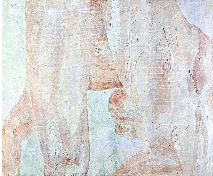
[작품 1] Untitled, 61x72cm, mixed media on panel, 2022

[작품 1]은 내가 감당해야 하는 병을 작품 제작을 위한 주요 소재로 삼고 진행한 G35 시리즈의 첫 작품이다. G35는 ICD-10 28) 에 따라 분류된 다발성 경화증의 질병코드를 뜻한다. 질병코드는 중증질환자로서 나의 자아를 정의하는 키워드라 할 수 있고, 나의 정체성의 중요한 일부를 나타낸다. 화면 속 인물은 운동선수로 육체의 건강미과 역동적인 동작이 두드러지는 모습을 하고 있다. 병중인 경직으로 인해 내가 모방하기 힘든 자세를 하는 것을 보며 나는 이를 선망하였고, 이 이미지를 활용해 회복에 대한 나의 정신적 의지와 소망을 표현하고자 했다.