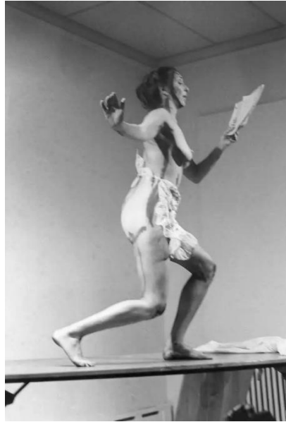
[도판 3] Carolee Schneemann, <Interior Scroll>, 1975

캐롤리 슈니먼의 대표작으로는 인테리어 스크롤(Interior Scrol)이 있다. 위 작품에서 슈니먼은 그녀의 생식기에서 종이 두루마리를 꺼내 읽는 퍼포먼스를 진행하였다. 예술의 필수적인 부분으로 신체를 사용하고 예술적인 창조성의 근원을 찾는 과정을 보여주는 작품이라 할 수 있다. 22) 자신의 신체를 관습적인 예술에 도전하고 정치적으로 탐구하는 데 활용하는 것은 나의 작품 주제와 다르지만, 몸과 신체적 경험을 작품 중심에 두는 태도는 나의 작품과 어느 정도 공통점이 있다고 할 수 있다.