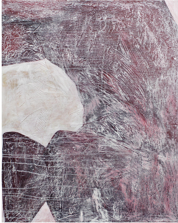
[작품 8] G35-10, 90.9x72.7cm, mixed media on panel, 2023

[작품 8]은 인물 이미지를 그리기 전에 화면 전체에 파스텔 그라운드를 판화용 롤러로 칠했다. 결과적으로 매끈한 흰 캔버스 화면 위에 마띠에르 31) 를 강조하면서 오랜 시간 병으로 인해 고착된 나의 육신과 내면의 상처를 시각화하였다. 이후 파스텔 그라운드 작업이 완성된 후 채도가 낮은 빨간색 아크릴 물감으로 신체 이미지를 그리고 최종적으로 흰색 오일 파스텔로 표면을 거칠게 문지르거나 그으면서 화면 위 인체의 존재감을 상실시키고자 하였다. 본 작업에서는 내면 깊숙이 응축된 비가시적 감정 상태를 나타내기 위해 인체 이미지의 자세나 형태를 드러내기 보다는 인체를 구성하는 표면의 질감 처리에 집중하였다.