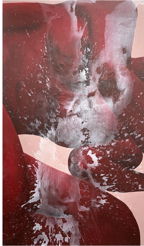
[작품 11] G35-15, 162.2x97cm, acrylic on panel, 2024

[작품 11]에서는 병의 공격과 그로 인한 고통으로부터 나 자신을 놓아버린 듯 지친 상태로 누워있는 자세의 인물 이미지를 선택하였다. 얼굴, 손, 발 등의 신체 요소를 화면에서 적극적으로 크롭하면서 내가 타인에게 드러내고 싶지 않은 나의 소극적인 내면의 모습과 태도를 숨기고자 하였다. 이를 구체화하기 위해 추상적인 요소를 화면 위에 나타내었다. 배경에는 자신의 내면을 감싸는 안도감과 포근한 느낌을 주기 위해 피부색을 연상할 수 있는 채도를 높인 난색 계열의 색을 활용했다. 화면 중앙에 폭탄과 같이 물감을 던져 터진 듯한 튼 물감들과 물방울들은 나에게 갑작스럽게 들이닥친 병의 존재를 상징하고 있다. 또한, 흩어진 파편 같은 흔적들이 채 마르기 전