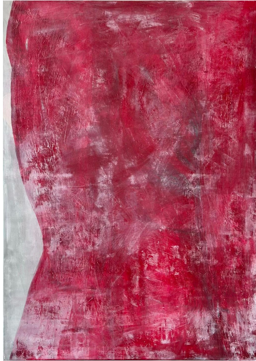
[작품 3] G35-04, 90.9x72.7cm, acrylic on canvas, 2023

[작품 3]은 [작품 2]에서 사용한 신체 이미지를 더 크롭하여 재사용하였다. 마치 동일한 피사체에 더 근접하여 촬영한 효과처럼 신체의 목 부분을 화면에 나오지 않게 하고 몸통만을 보여주어 덩어리 같은 느낌을 강조하였다. 내가 가지고 있는 병은 병세가 심해지기 전까지 겉으로 봤을 때 잘 드러나지 않는다. 말하자면 MRI로 관독하기 전에는 절대 진단이 불가능하다고 할 수 있다. 이러한 이유로 작품 속 신체 이미지에 개인의 특성이 나타나지 않게 하여 재해석의 가능성을 열어둠으로써 다양한 의미를 전달하고자 했다.