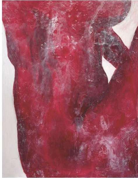
[작품 4] G35-01, 90.9x72.7cm, acrylic on panel, 2023

[작품 4]는 G-35의 네 번째 작업이다. 옆으로 쪼그려 앉은 나의 누드를 촬영하고 그것을 작업의 초안으로 삼았다. 화면의 구성적인 측면에서는 몸통과 배경이 만들어내는 몸의 형상과 공간감을 드러내고자 하였다. 앉은 형태의 신체 이미지를 강조하기 위해 얼굴, 팔 등은 크롭하였다. 몸의 입체감과 디테일은 큰 붓으로 단순화시켜 거칠게 표현하였고 배경과의 이질감을 주기 위해 색상 대비 효과를 강조하였다. 몸과 배경을 명확히 구분 지은 이유는 이전 작품을 제작할 때와 달라진 나의 심리 상태를 담기 위함이었다. 약해져 가는 나의 몸 상태를 보며 현실로부터 벗어나고 싶다는 생각이 들었고 이를 표현하기 위해 신체의 경계를 선명하게 표현해 현실에서 격리된 듯한 느낌을 주었다. 빨간색과 하얀색이 반복적으로 쌓여 만들어진 단순화된 형태는 신체 표현에 있어 기존 작업에 비해 흰색 물감 처리를 최소화하면서 절제된 표현을 시도하였다. 절제된 표면의 효과를 통해 자기 치유의 과정을 시각화하고자 하였다.