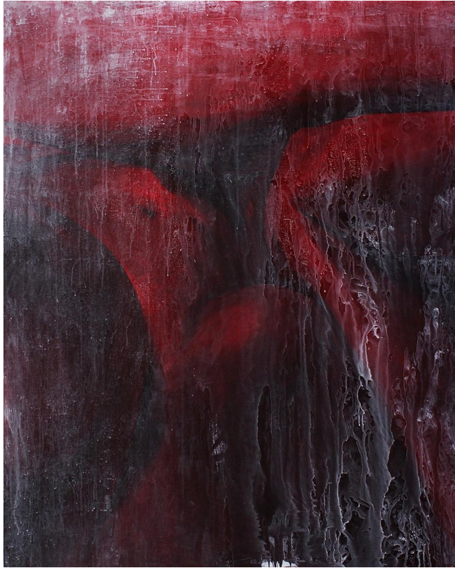
[작품 6] G35-14, 162.2x130.3cm, acrylic on canvas, 2023

[작품 6]은 캔버스 전체 화면에 인물 이미지를 가득 채워 배경을 없애고 인물 표현에 집중한 작업이었다. 빨간색과 짙은 마젠타색의 대비를 통해 웅크린 인물의 자세를 그렸고, 그 사이에 발생하는 명암의 대비 효과를 강조하고자 하였다. 한 인물의 특정 동작에 의해 만들어지는 주름이나 근육의 움직임에 포착하여 섬세하게 표현하기보다는 동작이 만드는 특징적 요소들을 화면 속에서 단순화시켜 추상적인 인물 이미지로 표현하고자 하였다. 클로즈업, 추상적 표현을 통한 인물의 모호성은 내가 병을 치료하는 과정에서 경험하는 심리적 상태를 표현하고자 한 것이다. 나는 화면 속 인물을 특정인의 모습으로 확정하기 어려운 상태와 구도로 담아내면서 내가 감당하고