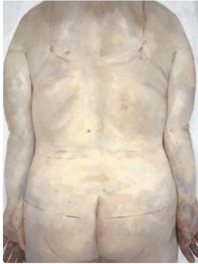
[도판 4] Trace, oil on canvas, 213.4x182.9cm, 1993-1994

자신의 신체를 사용한 또 다른 작가는 제니 사빌(Jenny Saville, 1970~)이 있다. 몸을 바라보는 새로운 인식체계를 열어준 제니 사빌은 여성의 아름다움이 양식화된 누드화의 편견을 깨트리고 여성의 몸을 왜곡하여 혐오스럽게 그렸다. 자신의 신체이미지를 확대하거나 몸의 부분을 부풀려서 표현한 점은 나의 작품과 공통점이 있다. 하지만 내가 확대와 같은 사진 편집을 활용해 작품 이미지를 만들었다면 그녀는 신체의 모양을 변형하는 방식을 사용했다. [도판 4]에서 볼 수 있듯이 돼지와 같은 흰 피부에 접히는 살의 무게를 적나라하게 드러내고 다듬어진 인체를 나타내기보단 날 것의 고기덩어리 같은 인식이 느껴지게 했다. 그녀는 거대한 화면을 사용하여 비대하게 살이 찐 여성 또는 울퉁불퉁 덩어리 같은 이미지를 통해 미의 일률성에 대해 고찰의 메시지를 전한다. 또한, 비만과 추한 것을 비도덕적인 것으로 간주하는 사회를 비판하고 아름다움은 단지 차이와 다름에 대한 해석에 불과하다고 작품을 통해 말한다. 23)