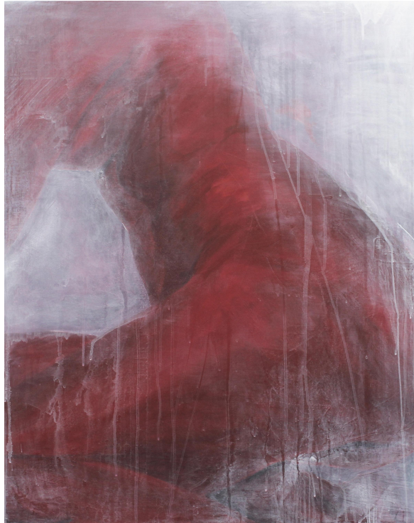
[작품 7] G35-08, 90.9x72.7cm, acrylic on panel, 2023

[작품 7]은 [작품 6]과 비교하여 신체의 클로즈업보다는 누워있는 인체의 이미지와 나의 내면적 감정 상태를 표현하고자 한 작품이다. 대각선 방향으로 비스듬히 누워있는 자세는 지쳐 나약해지는 나의 몸과 마음을 누군가에게 기대어 의지하고 싶은 마음의 상태를 시각화하고 있다. 구체적으로 캔버스 화면을 보면 손과 발은 배경 화면에 흡수되어 사라지게 만들고 이미지를 크롭하면서 몸통과 허벅지를 위주로 인물을 표현하였다. 제작 과정을 살펴보자면, 판넬 위에 젯소를 바른 후 1차 레이어로 인물 이미지 주변의 배경 화면을 보라색과 주황색을 선택하여 평붓으로 거칠게 칠하였다. 두 색의 선택과 거친 붓질을 통해 나의 무의식 속에 깊이 자리 잡고 있는 어둡고 부정적인 생각과 감정을 표출하면서 제한된 나의 일상적 삶을 담아내고자