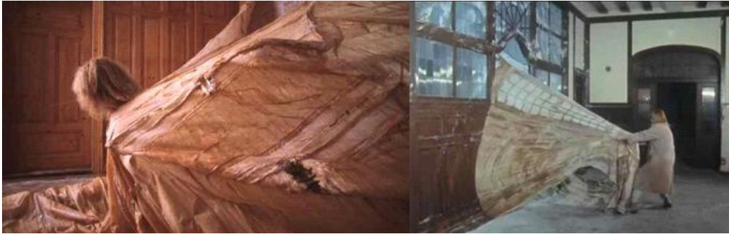
[도판 6] 하이디 부허가 건물의 표면을 라텍스로 뜯는 과정

한편, 하이디 부허(Heidi Bucher, 1982~1993)는 자신의 기억이 담긴 3차원적 실제 공간을 라텍스로 칠하고 천을 덮은 후 건조 후에 벗겨내 특정 공간에 재설치하거나 날려버림으로써 망각에 도달하고자 한다. 부허는 의사였던 아버지의 치료실 혹은 자신을 억압한 물건들을 캐스팅하여 본떠 뜯어냄으로써, 억압된 기억을 극복하고 작품이 되는 대상에서 벗어나고자 하는 의지를 보인다. 자신이 원하는 구조 면에 거즈 천을 덮고 라텍스를 발라 벗겨내는 격렬한 행위는 나의 작업 방식과는 다르지만, 반복적인 행위로 사적인 경험을 보존하고 라텍스를 자기 신체로 떼어내는 과정을 통해 자신의 한계에서 벗어나고 자기 극복을 시도한다는 점에서 연관성이 있다고 할 수 있다. 27)