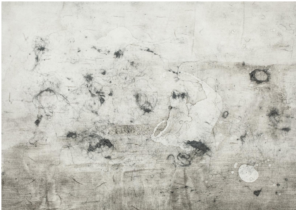
[작품3] Dust(studio)#1, 72×100cm, collagraph, 2017

[작품3] 은 머리카락의 선적인 요소와 니스 덩어리의 면적인 요소가 함께 화면을 구성한다. 본인은 이 작품을 통해서 선과 면의 조형적 구성을 통해 실기실의 다양한 흔적을 생생하게 표현하고자 하였다.