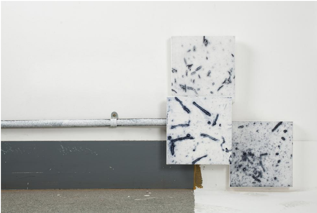
[작품7] 경기도 이천시 마장면 청강가창로389-94 #1, 20×20cm(each), collagraph, 2018 (Detail-cut)