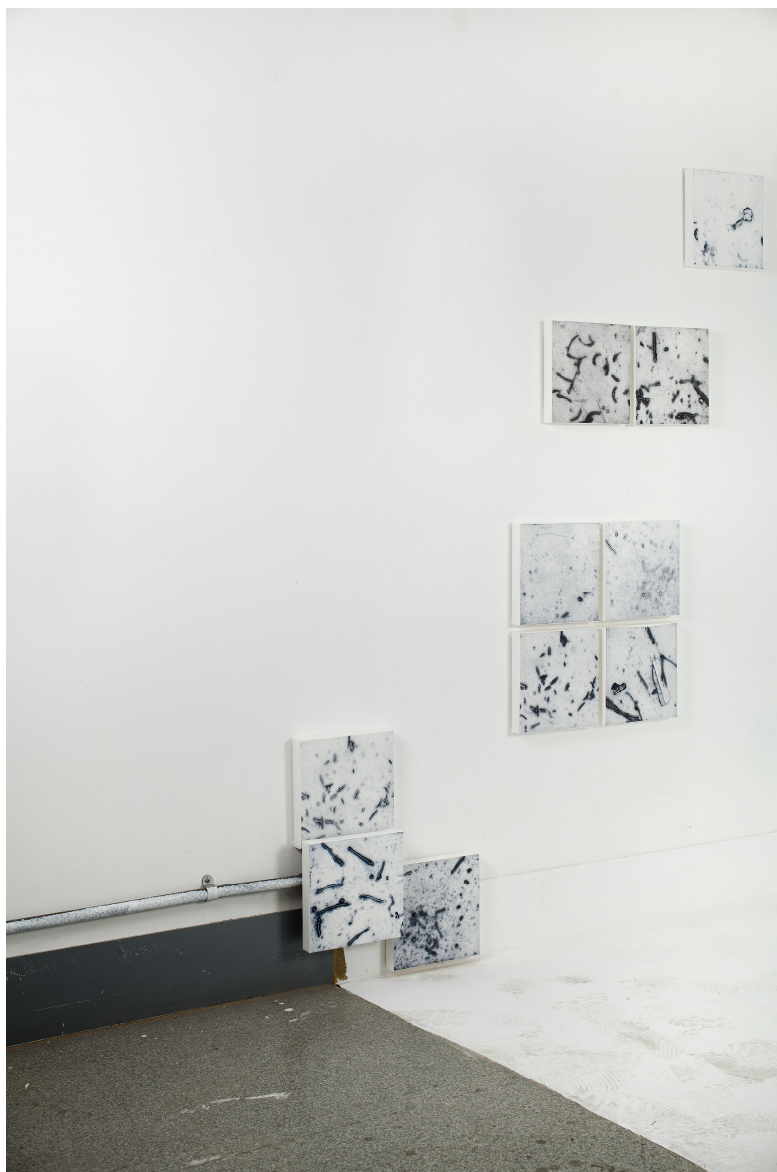
[작품6] 경기도 이천시 마장면 청강가창로389-94 #1, 20×20cm(each), collagraph, 2018