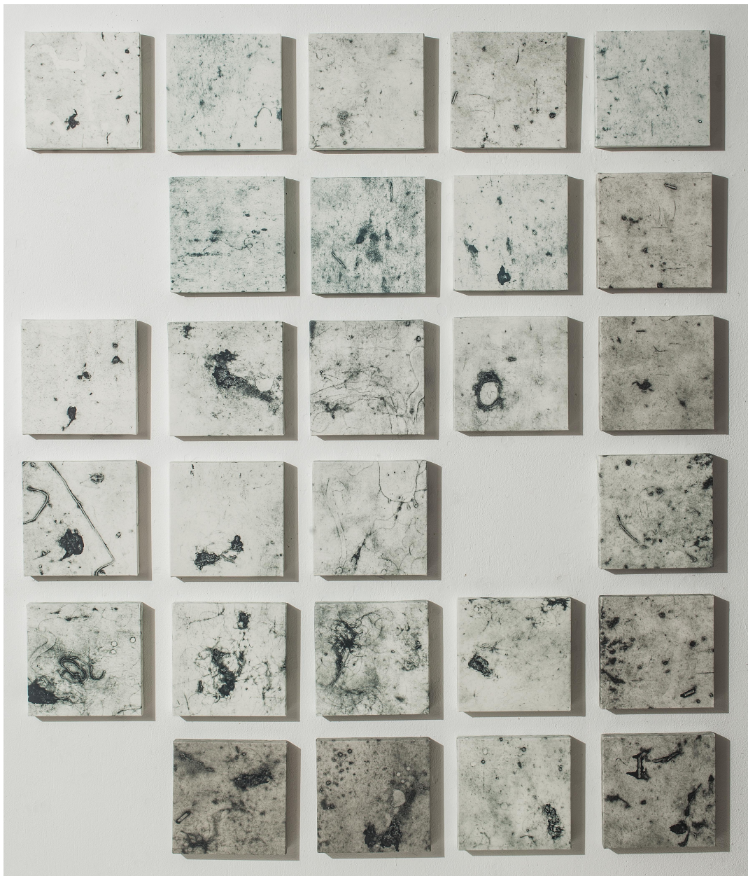
[작품4] Dust(studio)#2, 20×20cm(each), collagraph, 2017