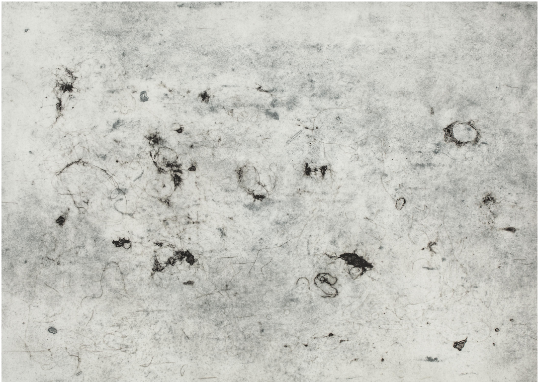
[작품5] Dust(studio)#3, 72×100cm, collagraph, 2017

[작품4] 도판화 작업실에서 채취한 먼지를 이용하였다. Dust(studio) 시리즈 제작 과정 중에 실수한 부분을 다시 재조합하여 만든 것이다. 제작 과정 중에 잉킹 과정 혹은 프린트 과정에서 에디션 제작이 어려워진 것을 사용하였다. 그 중에 일부분을 20×20cm 크기로 자르고, 다시 재조합하였다. 판넬의 20×20cm 정사각형 모양은 본인이 여가 시간에 주로 접속하는 instagram의 사진 형식을 차용하였다. 정사각형 모양은 instagram과 스마트폰으로 정방향 모드로 사진 찍는 것이 익숙한 본인에게 가장 안정적인 모양이다. 27개의 판넬로 구성된 [작품4]에는 세 군데의 빈 공간이 있다. 작품 속 빈 공간은, 먼지가 쌓이지 않은 물체가 있던 자리를 상징한다.