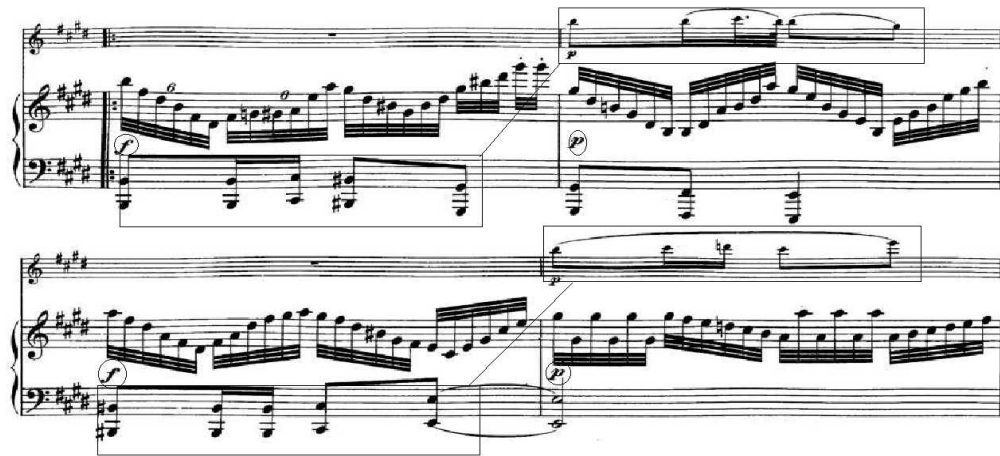
<악보 25> 《'시든 꽃' 주제에 의한 서주와 변주》, 변주 IV, 마디 17-20

17마디의 B부분에서는 A부분과 비슷하게 연주되는데, 각 성부에서 두 마디씩 나타나던 A부분의 주제선율과 셈여림의 변화가 B부분에서는 한 마디 간격으로 나타난다(악보 25).