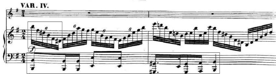
<악보 23> 《‘시든 꽃’ 주제에 의한 서주와 변주》, 변주 IV, 마디 1-4

제4변주는 제2변주에서도 나타났던 ‘방랑자 리듬’을 사용하여 피아노의 왼손에서 먼저 주선율을 연주한다. 피아노의 오른손에서 변화된 화성을 32분음표의 6연음 아르페지오로 연주하며, 두 마디마다 f와 p가 번갈아 나오면서 셈여림의 대조로 곡의 분위기를 더 극대화시킨다. 두 마디의 피아노 왼손 주선율 연주 후 플루트가 받아서 주선율을 연주한다(악보 23).