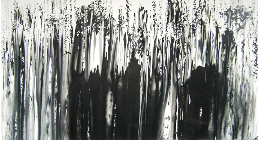
<작품 7> Reading the forest, 2010, 천에 먹, 145x257cm.