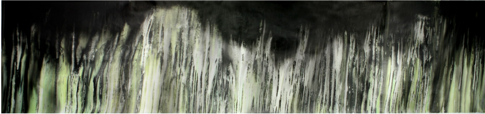
<작품 2> 낯선 숲, 2010, 천에 먹 채색, 145x510cm.