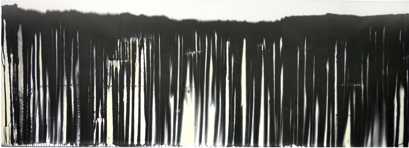
<작품 3> 낮선 숲, 2010, 천에 먹 채색, 145x510cm.