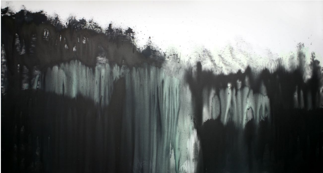
<작품 1> 숲, 2009, 천에 먹 채색, 137x254cm.