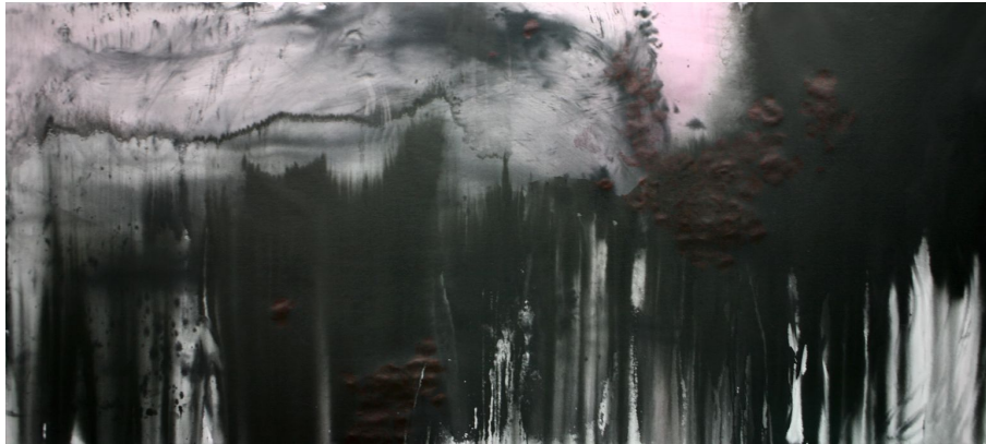
<작품 5> 낮선 숲, 2010, 천에 먹 채색, 103x230cm.