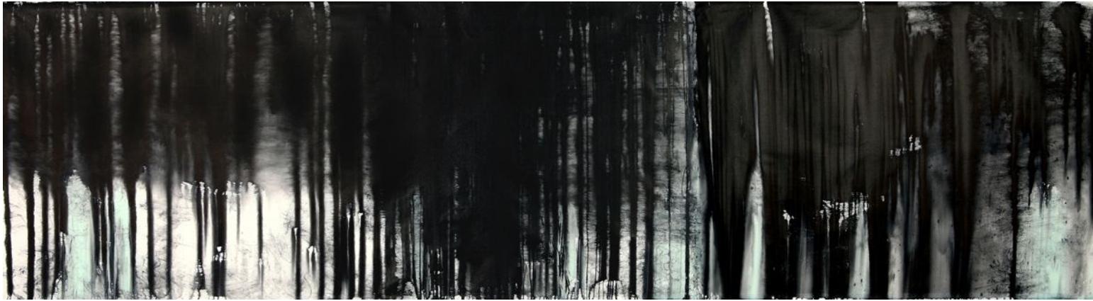
<작품 4> 낯선 숲, 2009, 천에 먹, 145x523cm.