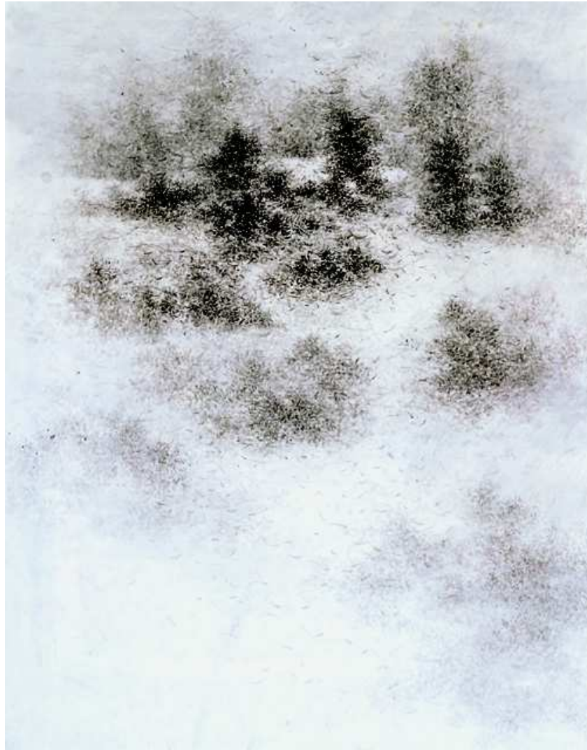
[작품 6] 안개 낀 수풀 , 130x96cm , 장지에 수묵 , 2004