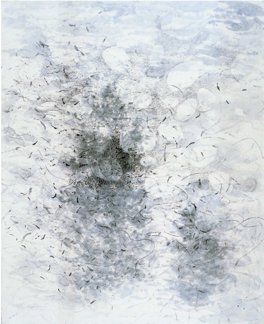
[작품 8] 나무 아래 , 130x96cm , 장지에 수묵 , 2004