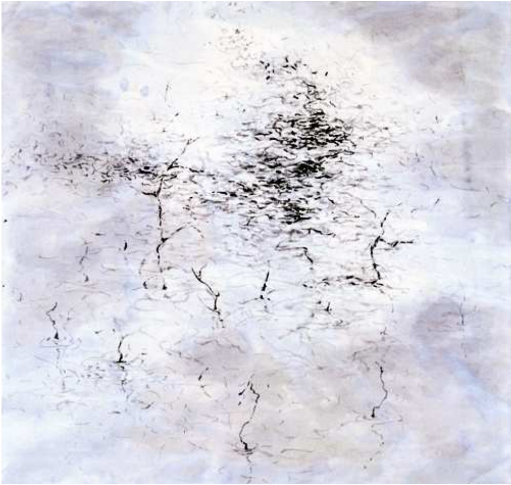
[작품 9] 비온 후의 연못가 , 72x77cm , 한지에 수묵담채 , 2004