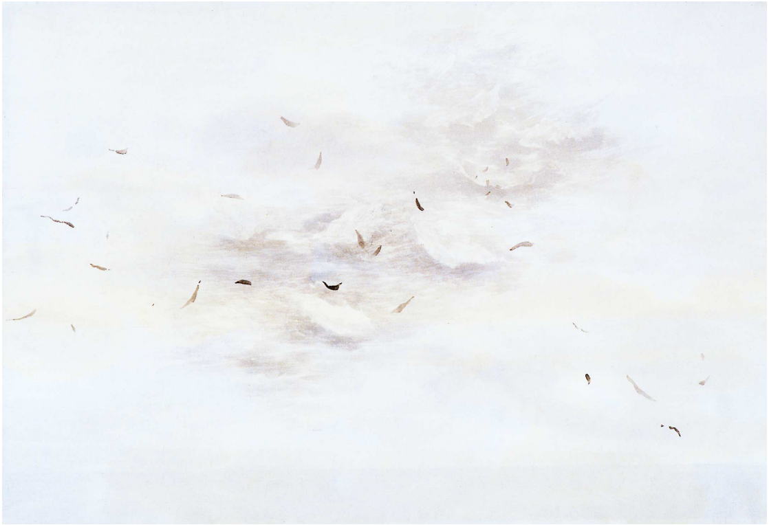
[작품 7] 떠오르는 나뭇잎 , 50x72cm , 한지에 수묵담채 , 2004