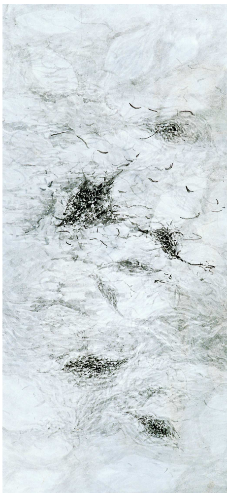
[작품 10] 떨어지는 낙엽들 , 84x38cm , 한지에 수묵담채 , 2004