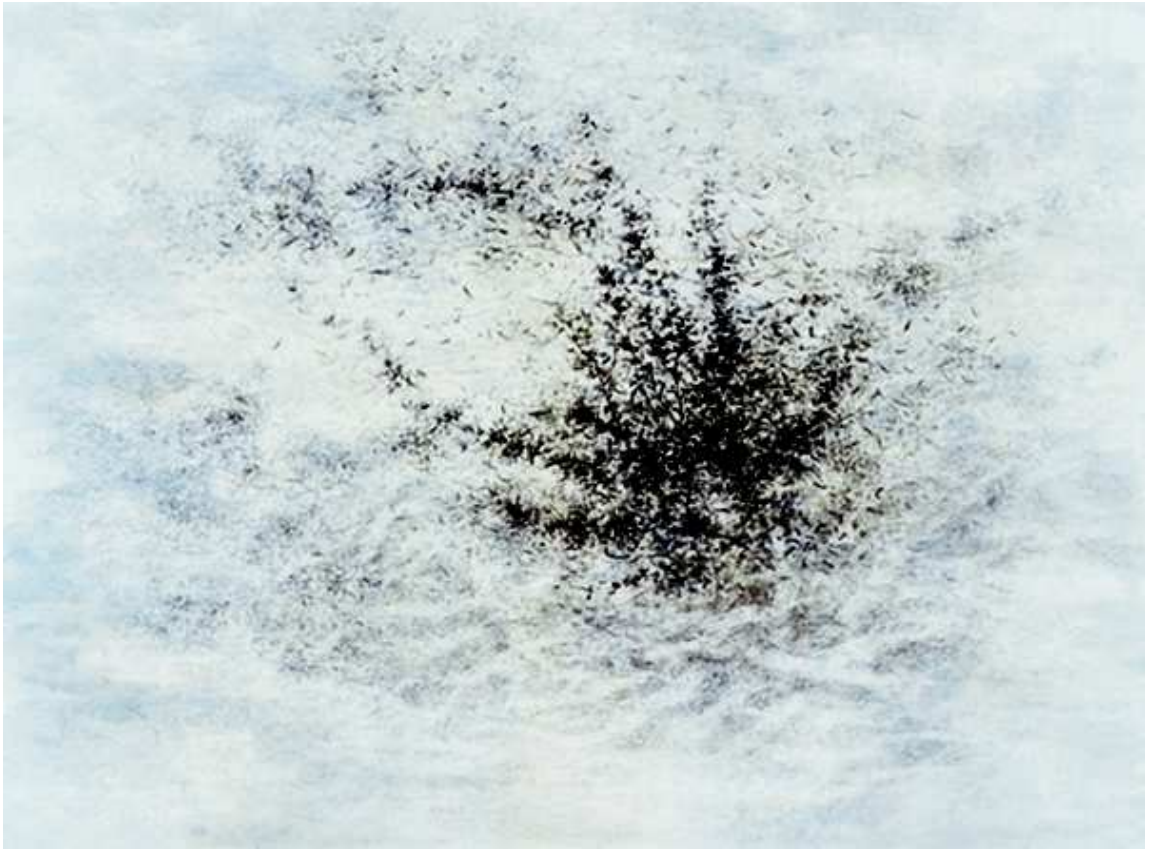
[작품 5] 바람부는 날의 들풀 , 130x96cm , 장지에 수묵 , 2004