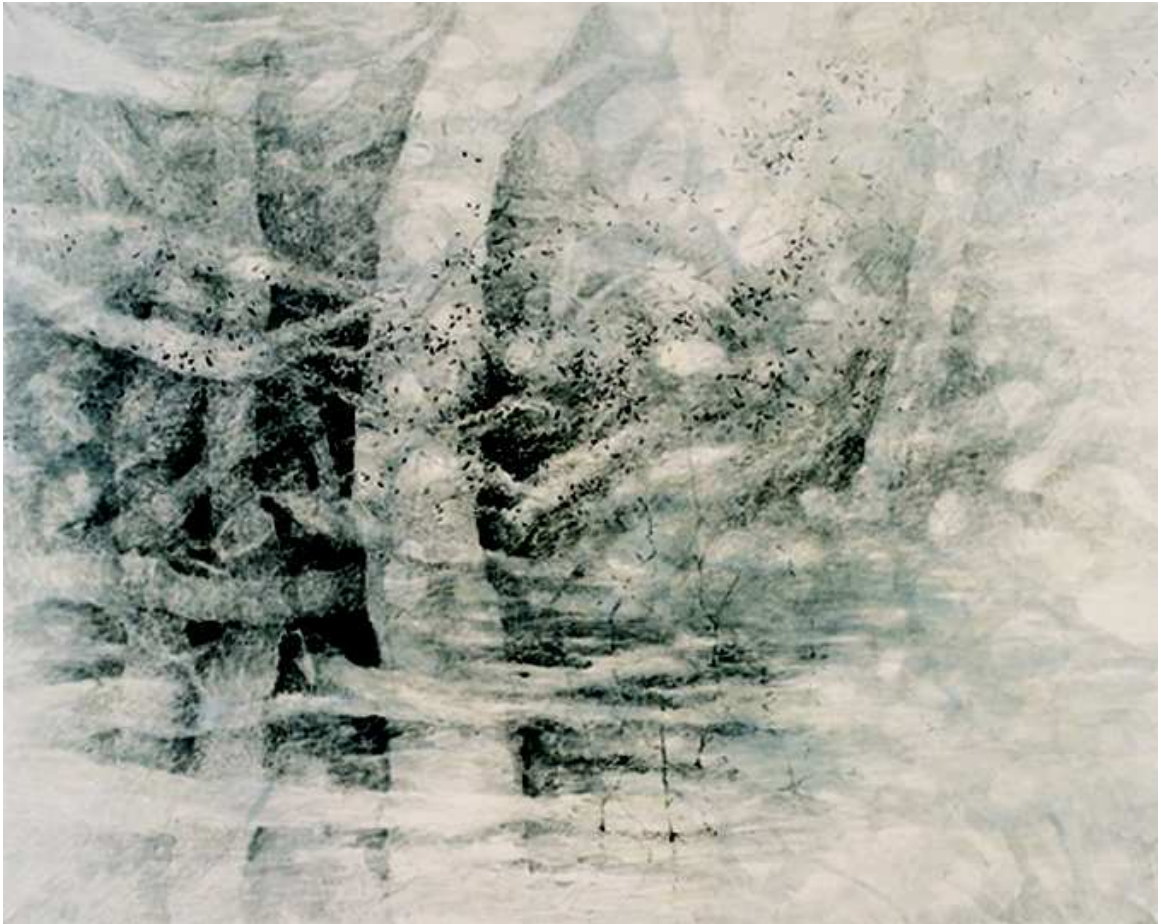
[작품 3] 숲속의 나무 , 122x155cm , 장지에 수묵 담채 2004