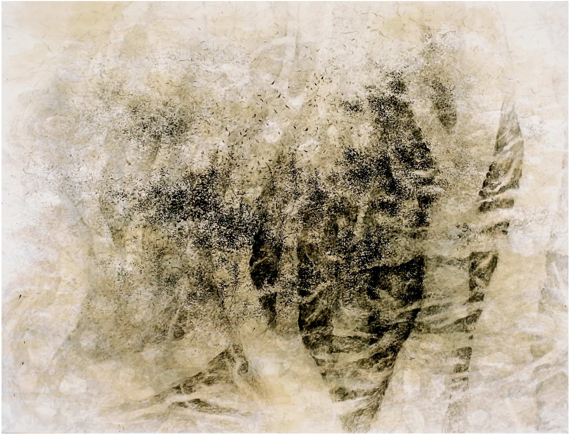
[작품 1] 나무 I , 122x155cm , 장지에 수묵 담채 , 2004