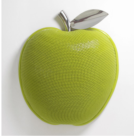
[작품1] yellow green apple