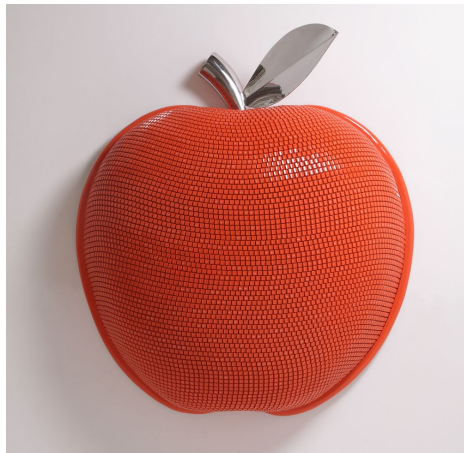
[작품2] orange apple