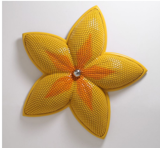
[작품8] yellow flower