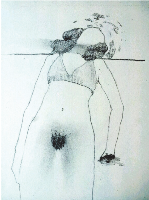
[작품 4] <29>, 19.5×14.5cm, 종이에 연필, 2013

그림의 성별에 관심을 가지게 된 계기는 2012년으로 거슬러 올라간다. 수업 중에 ‘여성의 성기에 털이 있으면 여성이 아니다.’ 라는 말을 듣고 나는 불쾌감을 느꼈다. 반론을 했지만, 강사는 입장을 고수했고 상대방의 강경한 태도는 나에게 충격으로 다가왔다. 나는 성별에 상관없이 성기의 털을 제거하지 않는 한 대부분의 사람들이 성기에 털이 있는 것이 당연하다고 생각했기 때문이다. 그래서 나는 이 일을 통해 그림에 대한 해석 차이가 어디서 오며 이것을 바꿀 수 있을 것인지 궁금해졌다. 질문에 답을 얻기 위해 신체의 모양을 변형하는 방법으로 실험했다. 여성 또는 남성으로 해석될 만한 부분들을 조금씩 줄이거나 완전히 표현하지 않는 방식을 택했다. 이는