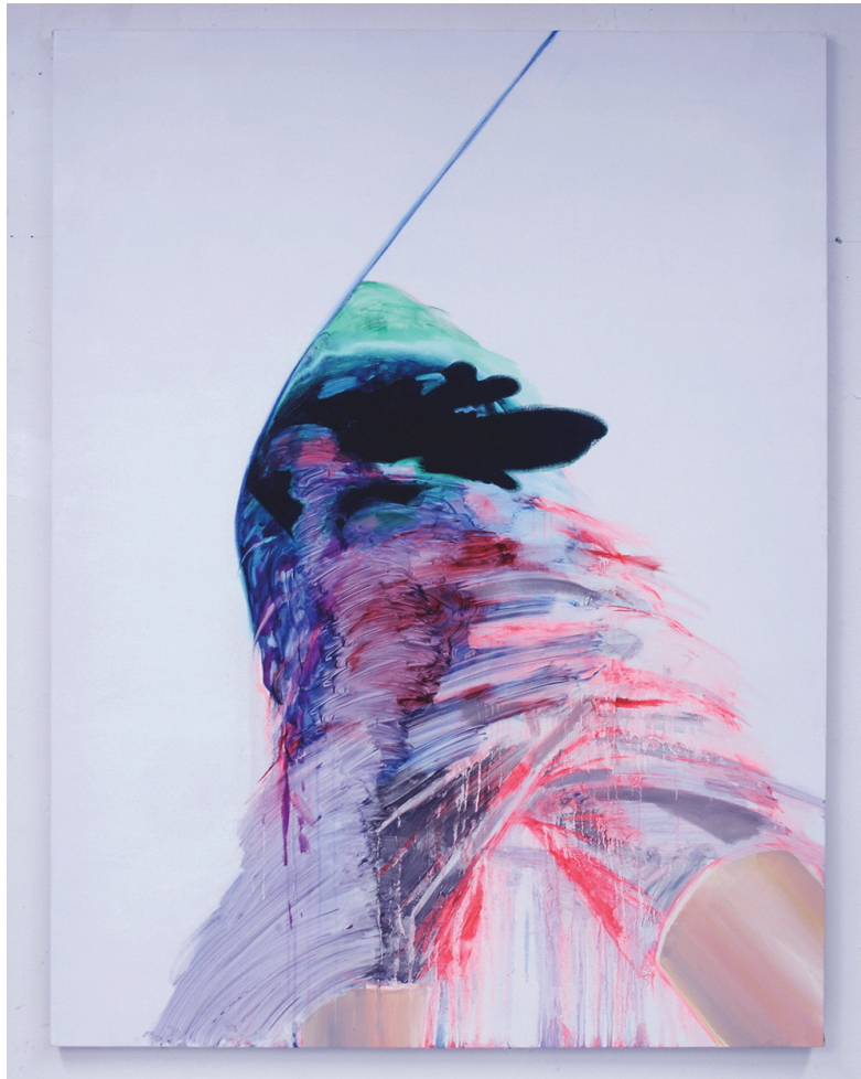
[작품 7] <700년 동안 내가 해온 것02>, 146×112cm, 캔버스에 유화와 파스텔,

텔은 위와 같은 드로잉 기법으로 시작하지만 오일로 파스텔을 굳히기보다 린시드오일과 패트롤을 혼합하여 대량으로 흘리거나 닦아내는 과정을 통해 신체를 이루는 틀을 깬다. 그리고 파스텔은 흐르는 오일의 중력과 지우는 손의 악력을 통해 공기로 날아가지 않고 화면 유화에 침투한다.