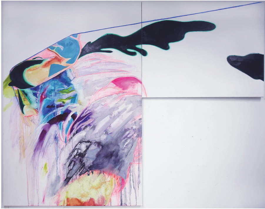
[작품 3] <스스로 장례 치르기01>, 195×230cm, 캔버스에 유화와 파스텔, 2020

선 때문에 얼굴이 걸려 보이지 않은 인물은 허공의 선을 향해 스스로 온몸을 내던진다. 이러한 얼굴 없는 자화상은 “김미연김도아: 주인공이 되는 방법”에 전시된 작품들에 꾸준히 등장한다. 얼굴의 묘사를 배제하는 이유는 얼굴에 사회에서 주어진 역할을 수행하기 위해 만들어진 모양이 가장 많이 담겼다고 생각하기 때문이다. 나는 얼굴을 가림으로써 우리가 보지 못했던 것들을 다시 보게 하기 위한 환기점이 발생하길 원했다.