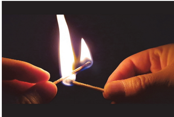
[작품 2] <불이 꺼져도 재는 남는다02>, 05:15, 단채널 영상, 2020

성냥들을 계속 태우고자 한다. 이러한 ‘김미연’을 제거하는 과정을 성냥을 태우는 행위에 빗대어 <불이 꺼져도 재는 남는다02>에 담았다.