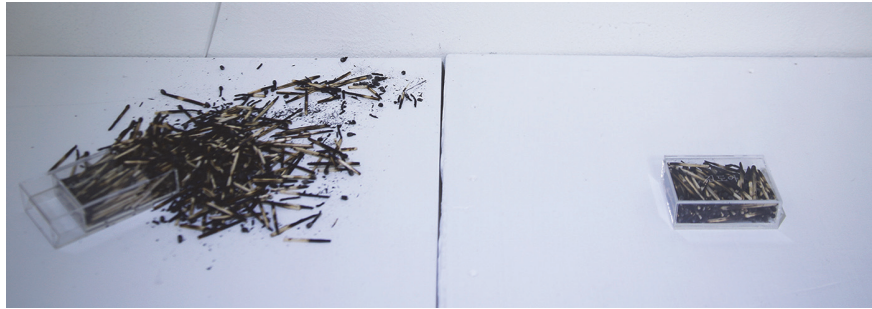
[작품 1] <불이 꺼져도 재는 남는다01>, 아크릴과 성냥, 2020

설치 작품인 <불이 꺼져도 재는 남는다01>는 ‘김도아’라고 새겨진 2개의 투명한 아크릴 성냥갑과 그 안의 가득 찬 성냥들로 구성된다. 각각 박스 안에는 연소한 성냥들이 쌓여있다. 두 박스 안의 모든 성냥들에 아세톤을 이용해 전사를 이용하여 ‘김미연’이란 이름을 새겼다. ‘김미연’은 ‘김도아’로 살기 전 태어나면서부터 받은 이름이다. 남자가 아니었기 때문에 집안에서 받지 못한 이름을 절 안의 스님에게 급하게 물어봐 얻은 것이 ‘김미연’의 시작이었다. 동생 이름에는 할아버지의 정성이, 다른 친척들의 이름에는 돈이 들어갔다고 한다. 나는 이름에 정을 붙이기 위해 노력했지만 이제는 이름에 쓰지 않는 한자 인 아름다울 미(美)와 연꽃 연(蓮)은 이름으로부터 느끼는 거리감을 더욱 커지게 할 뿐이었다. 나는 값어치 없는 이름을 값지게 만들기 위하여 개명을 결심했다. 개명할 이름에 스스로 정성을 쏟아부었다. 개명을 완료하고 관공서에 서류를 돌린 뒤 새 이름을 쓰기 시작했지만 ‘김미연’이란 이름을 잊을 때쯤 그 이름을 부르는 누군가가 나타났고 이는 내게 지울 수 없는 흔적으로 돌아왔다. 이렇게 ‘김도아’는 잊을만하면 나타나는 ‘김미연’이라는 이름의 죽음으로 만들어진 정체성이 되었다. 이를 ‘김도아’ 이름이 새겨진 투명한 아크릴 성냥갑과 그 안의 태워진 ‘김미연’ 성냥으로 표현했다. 나는 ‘김도아’를 생산하기 위해 이