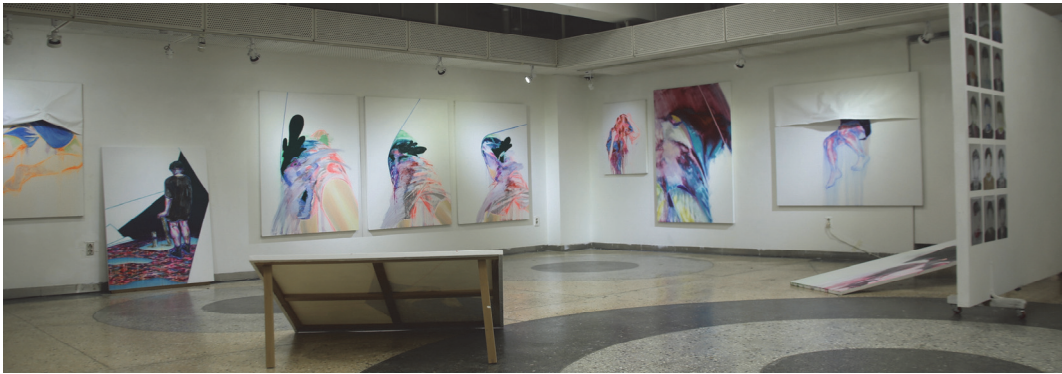
[사진 1] <김파연김도아: 주인공이 되는 방법> 전시 전경, 2021

남는다> 연작을 배치했다. 나는 이를 통해서 관객이 몰래 일기장을 보는 것 같은 기분을 느끼게 하고자 의도했다.