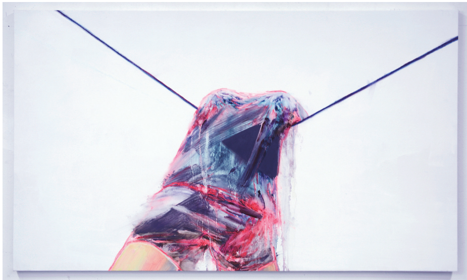
[작품 6] <선 위의 열담자01>, 77×130cm, 캔버스에 유화와 파스텔, 2020

나의 작품들은 삶의 뿌리와 존재를 찾는 과정에서 발생한 자기규정에 대한 결과물이다. 나는 스스로 존재의 당위성을 확보하기 위해 나의 정체성을 밝히고 그 과정에서 사회에서 은폐한 나의 사건을 폭로한다. 그리고 유동적으로 변하는 정체성을 나타내고자 한다. 앞의 두 가지를 화면 안에 표현하기 위해 적극적으로 ‘뉘기’를 활용한다. 둘 다 뉘기를 활용하여 변화의 분기점을 만드는 공통점이 있지만 신체와 공간 각각 다른 방식으로 쓰인다. 아래 두 작품을 통해 각각의 표현방식을 살펴보고자 한다.