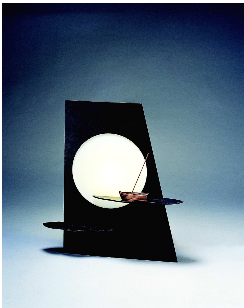
【작품 8】 달빛 강가에서 550×650×180(mm) 적동, 철, 아크릴