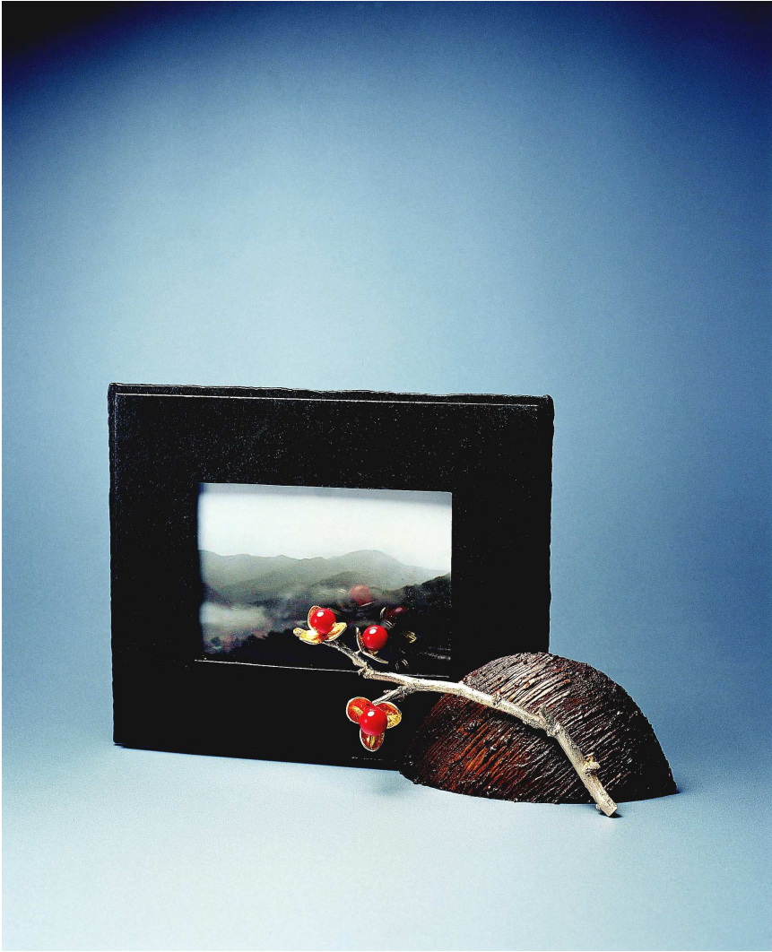
【작품 7】 새벽동산 240×70×155(mm) 적동, 철, 순은, 산호, 금박