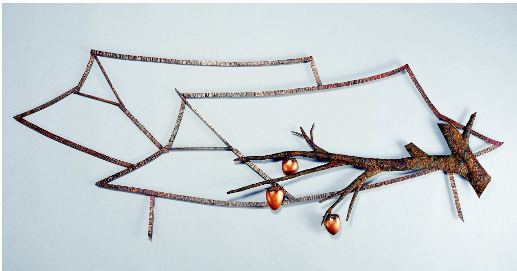
【작품 1】 기다림 1520×620×50(mm) 적동