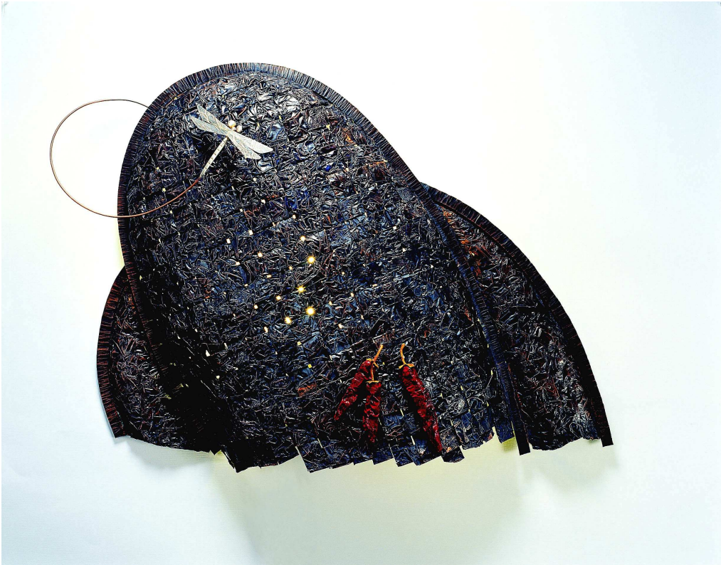
【작품 3】 가을풍경 720×540×180(mm) 적동, 순은, 아크릴컬러