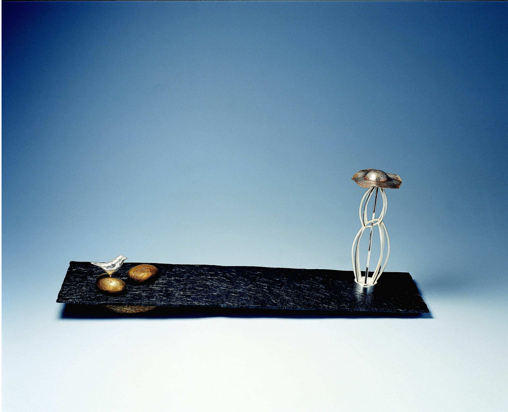
【작품 6】 허수아비의 겨울 420×110×160(mm) 철, 순은, 황동, 자연석, 자석