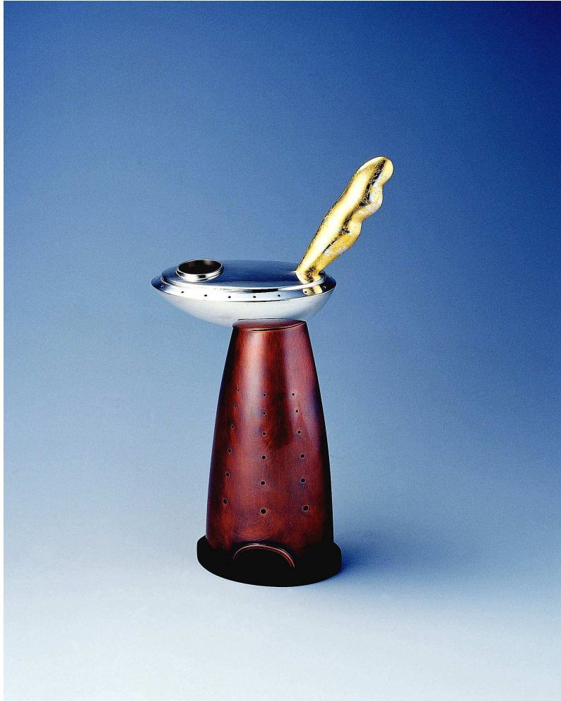
【작품 5】 해질녘 160×70×270(mm) 적동, 순은, 흑단, 금박