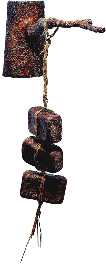
【작품 4】 모정(母情) 120×700×500(mm) 적동