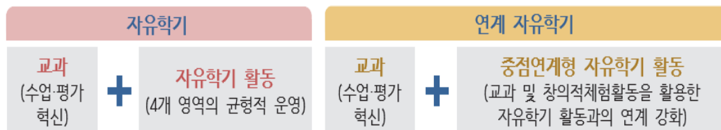
<그림 II-3> 자유학기·연계학기28)

자유학년제는 자유학을 확대 운영하는 것으로 1학년 학생을 대상으로 자유학기 전 또는 후 학기를 연계하기로 운영한다. 연계 자유학기는 교과 시수를 활용하여 해당 교과목의 연계 주제선택 활동을 운영하며 교과 간, 교과 내 융합수업, 교과 통합 프로젝트 수업, 진로 연계 교과 수업 등을 활성화한다. 또한, 학교 내 전문적 학습 공동체, 교과 협의회 등을 통해 교과별로 토론, 실험·실습, 협력학습 등 학생 참여형 수업을 확대하며, 수업 혁신을 위한 교내 연수를 확대하고 전문적 학습 공동체와 교사 동아리 등을 활성화하여 수업공개와 피드백의 기회를 확대한다.27)