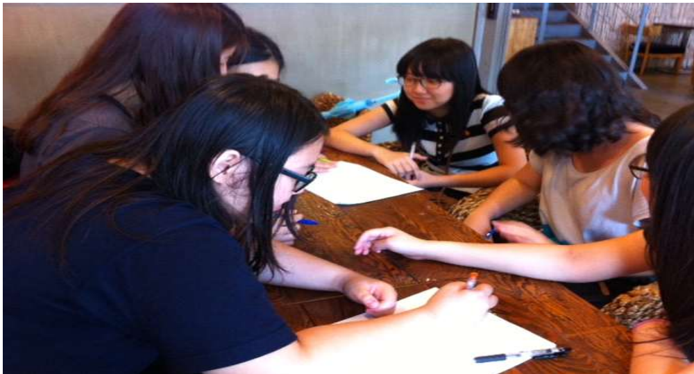
<사진2-모둠별로 대본을 만드는 모습>

실험은 참가자가 총 10명인 관계로 불가피하게 5명을 1모둠으로 구성하고, 2모둠으로 편성하였다. 수행 평가에 소요되는 시간을 파악하기 위하여 시간의 제약은 두지 않았으며, 교사의 개입 없이 자유롭게 대본을 구성하고 녹음하도록 지시했다.