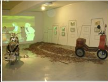
【도판-2】 2008 김광석 리포트전