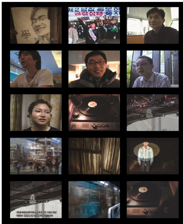
【작품4】 김광석 보고서