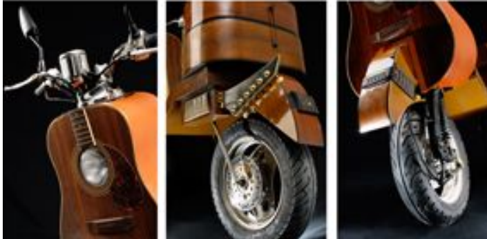
【작품2】 Touch me