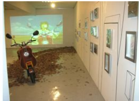
【도판-3】 2008 김광석 리포트전