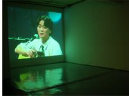
【도판-1】 2008 김광석 리포트전