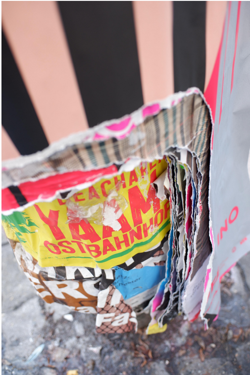
[도판1] 베를린 전봇대에 떨어진 포스터 사진