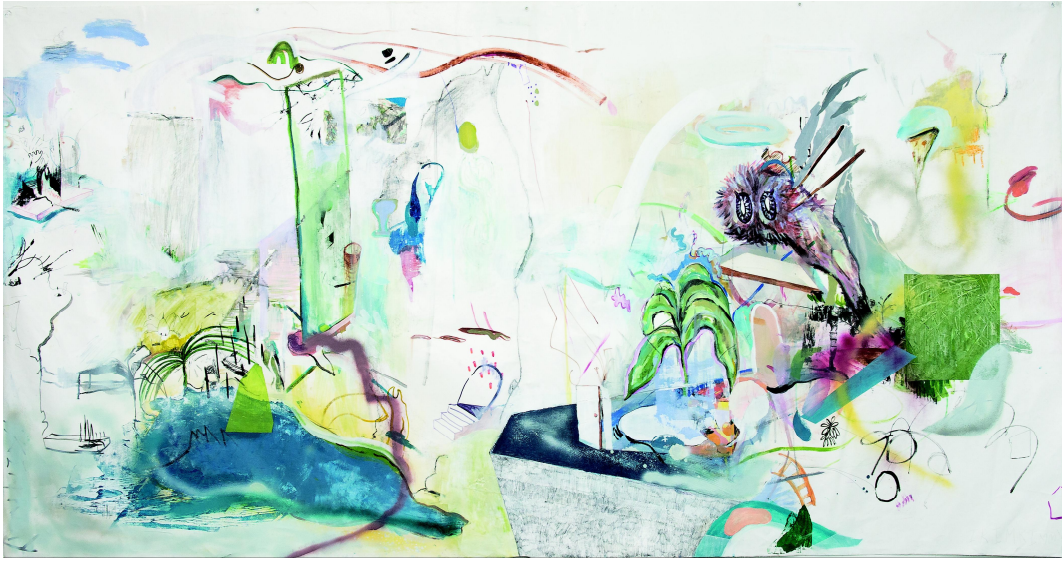
[작품5] Youngjoo Kim, Map Drawing#22, 70x160, Mixed media on canvas, 2019

오른쪽에 털복숭이 먼지 덩어리는 본인의 페르소나(Persona)이다. 지도를 지켜보며 돌봐주는 역할을 하는 주인이며, 내면의 섬 안에 모든 곳을 돌아다닌다. 자유롭게 흘러 다니는 ‘자신’인 것이다. 떠도는 물체들은 하나의 섬을 이루기도 하고 부스러기처럼 그저 떠다니기도 한다, 본인의 무의식 세계대로 흐르도록 내버려 두는 것이다.