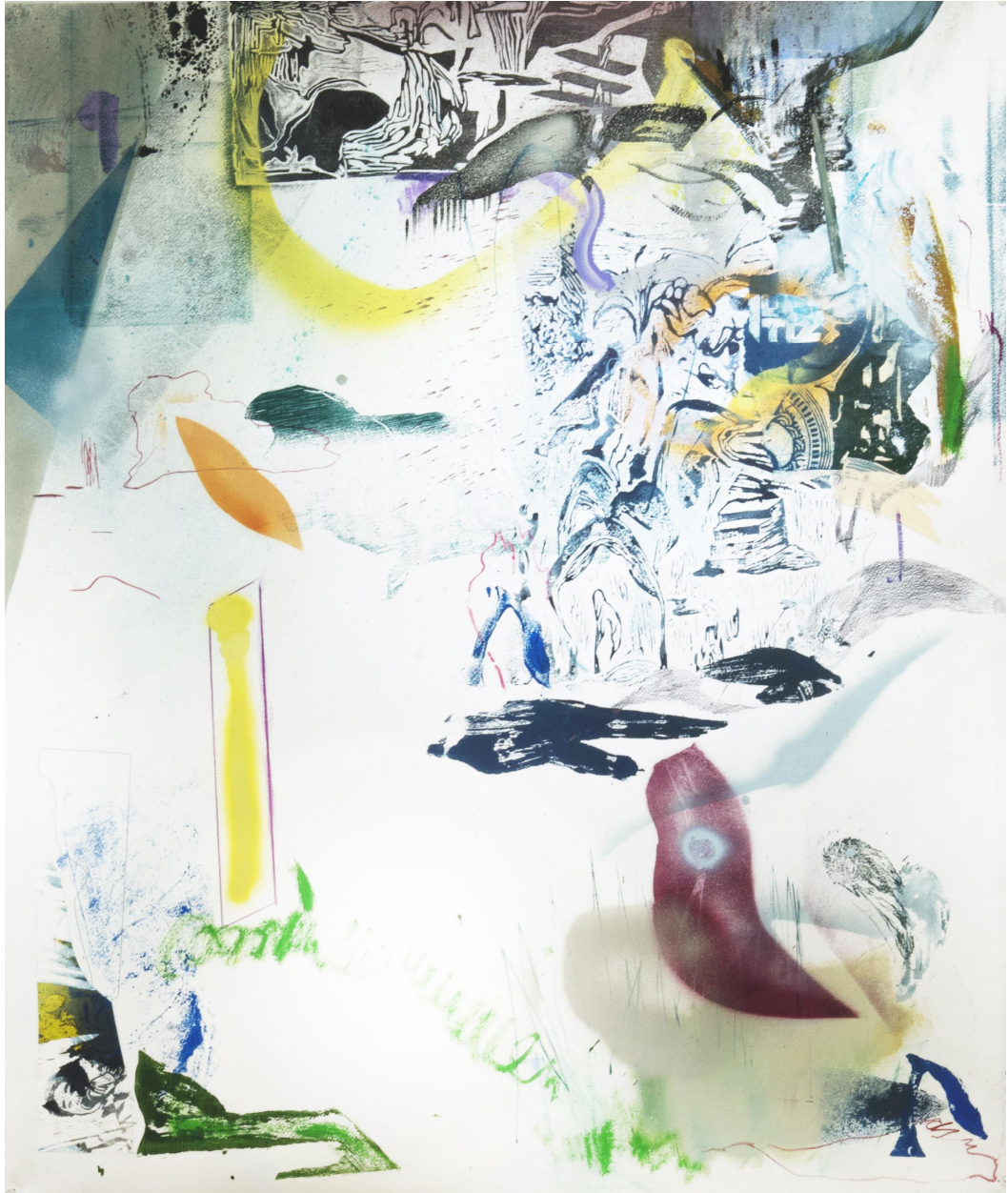
[작품10] Youngjoo Kim, Map Drawing#12 ,60.6x72.7, Mixed media on paper, 2019