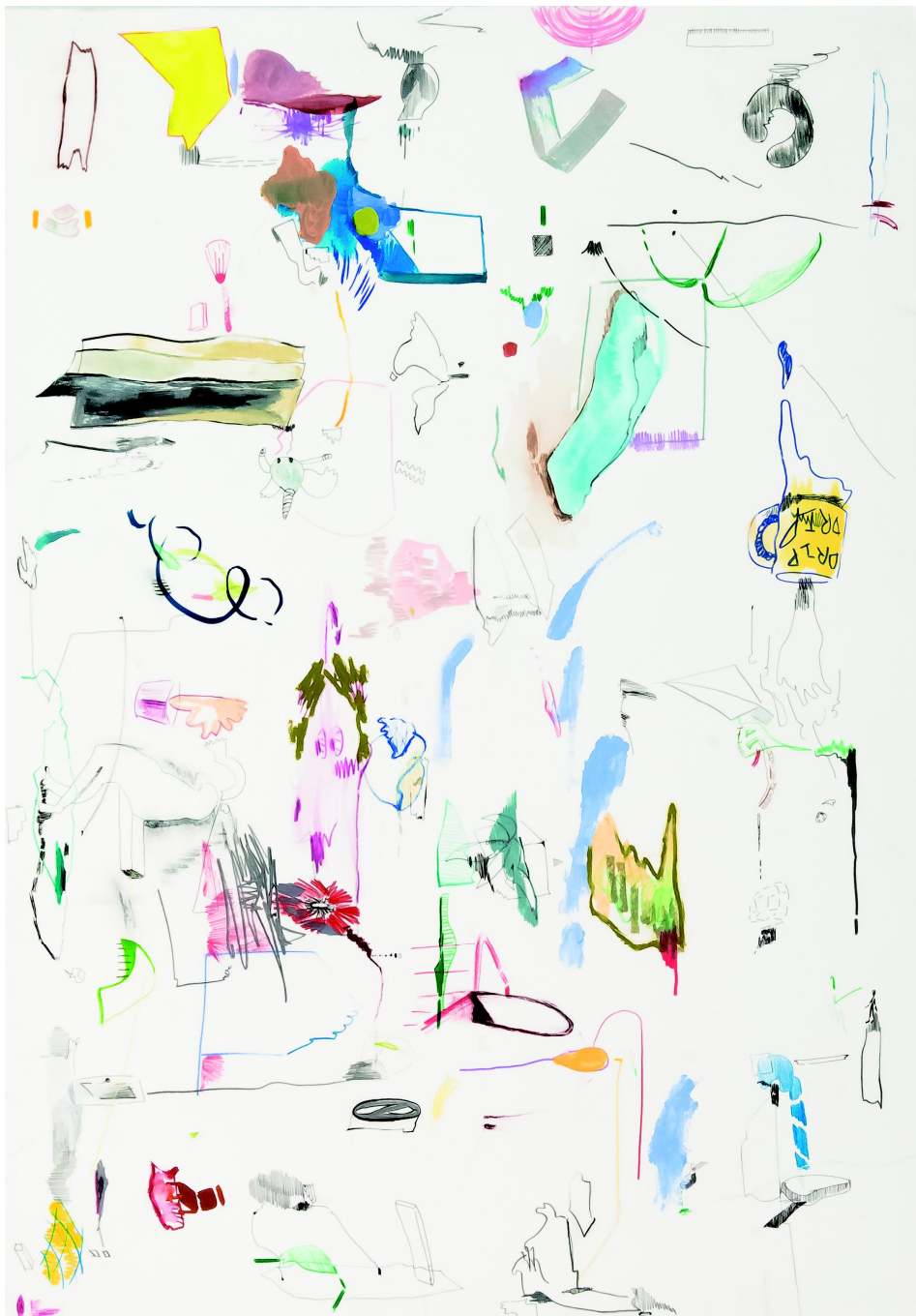
[작품2] Youngjoo Kim, Map Drawing#1, 70x100, Mixed media on paper, 2019