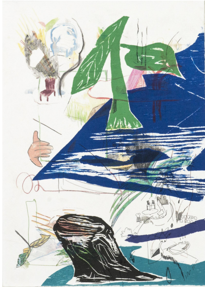
[작품9] Youngjoo Kim, Map Drawing#8, 29x42, Wood cut on Digital print, 2019

본인은 판화 기법 중 주로 목판을 많이 사용하는데, 나무 위에 드로잉하고 칼자국을 통해 이미지를 판 후, 퍼즐(Puzzle) 조각과 같이 잘라내어 각각 다른 색상을 잉킹하여 찍어낸다. 나뭇결이 가지고 있는 균일하지 않은 틈들은 본인이 의도하지 않은 자국을 내며 목판 판재의 고유한 특성을 드러낸다.