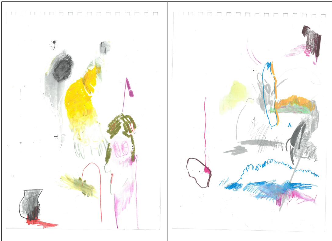
[작품3] Youngjoo Kim, 드로잉#03, 22.7x15.8, Mixed media on paper, 2019

MAP DRAWING 작업은 평소에 일기를 쓰듯이 종이 위에 본인의 감정을 표출하여 매일 드로잉 한 소재를 한 화면에 띄운 것이다. 각각 다 다른 시간, 다른 공간, 다른 감정으로 드로잉(Drawing)하였고, 판화지라는 넓은 바다 위에 면과 선, 색과 농담으로 이루어진 드로잉 이미지 들은 하나의 점으로서 서로 조화를 이루며 지도를 형성한다.