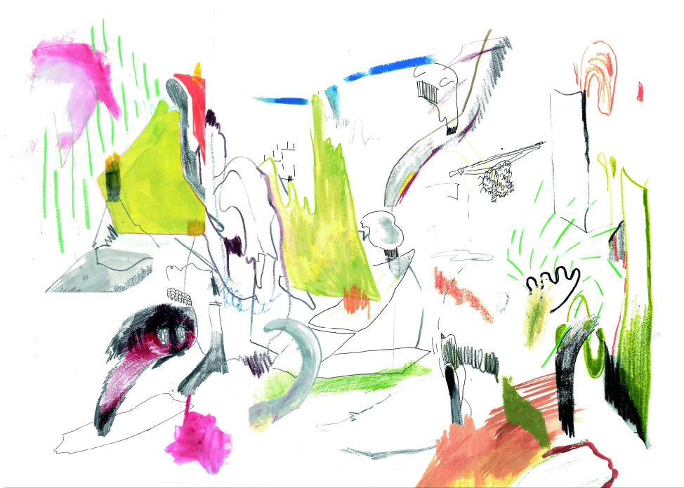
[작품6] Youngjoo Kim, Map Drawing#3, 30.6x37..7, Mixed media on canvas, 2019

본인이 경험과 무의식적으로 느끼는 감정들과 개인적 욕망, 불안감 등의 정서를 드로잉과 판화라는 매체를 이용하여 표출하며 치유를 받는다. 본인의 내부세계는 외부와 끊임없이 교감을 하며 자아를 형성해 나간다. 삶은 혼돈 그 자체 같지만, 어떻게든 자신의 규율 속에서 질서를 잡고 살기 위해 노력한다.