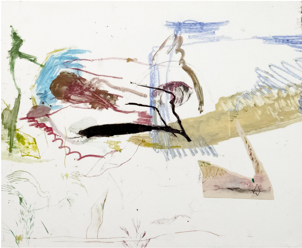
[작품7] Youngjoo Kim, Island Drawing, 60.6x72.7, Mixed media on paper, 2019

삶은 인간의 뜻대로는 되지 않는다고 생각하기에, 신에게 많은 부분을 의지하며 삶을 영위하고 있지만, 본인에게는 무의식적인 걱정과 불안감이 늘 존재한다. 이 불안감은 본인의 작품에서 여러 가지 다양한 선과 면들이 함께 어우러져 드러난다. 이는 본인의 평소 감정들을 화면 위에 끄집어낸 것들이며, 그 파편들을 재조합하여 생각들을 연결하기도 한다. 이렇게 모인 이미지는 다시 본인의 감성을 통해 형태와 구조, 색으로 분류되어 다시 새로운 하나의 화면을 형성하게 된다. 표면 위에 자리 잡게 되는 형태와 색은 본인의 생각 속에서 화면 위에 드러날 때까지 의도적이든 비의도적이든 여러 경로와 감각,