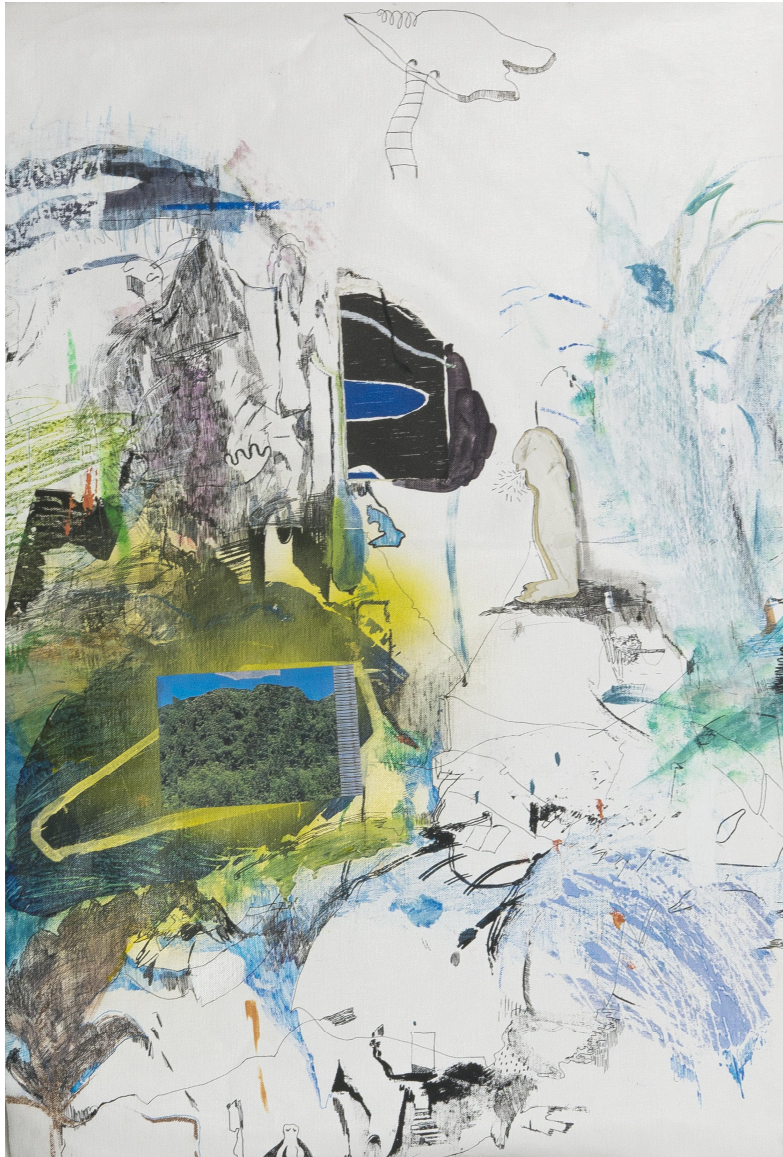
[작품8] Youngjoo Kim, Map Drawing#5, 60.6x72.7, Mixed media on canvas, 2019

감정을 통해 다양한 모습으로 나타난다. 화면 속의 각각의 형상들에서 출처의 원인이나 의도, 이유를 찾기보다 완료된 화면이 주는 시각적인 뉘앙스 (Nuance) 자체와 본인이 순간적으로 감각으로 느끼고 기억하는 것을 정리하며 재구성한 화면 자체를 보는 것이 중요하기 때문이다.