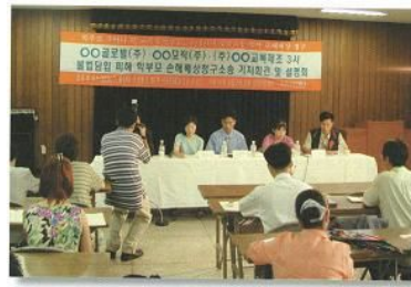
<삽화 6-2> 중3(지학사) 88쪽.

공청회란 일정한 사항을 결정함에 있어 국민의 여론이나 전문가의 의견을 공개적으로 듣기 위한 제도라고 할 수 있으며, 기자회견은 어떤 사건이나 현상에 대하여 신문, 통신, 방송과 같은 대중 매체를 통하여 그 내용을 설명하거나 해명하려고 기자들을 불러 모아서 개최하는 담화나 모임을 말한다 12) .