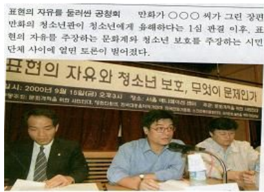
<삽화 6-1> 고1(중앙) 220쪽.