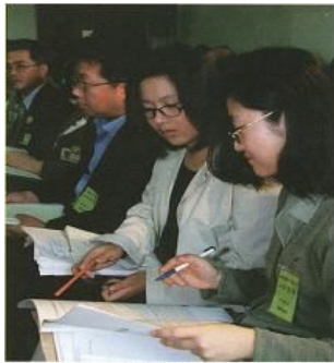
자료 1-26 의정 감시단 활동 시민들은 의정 감시 활동을 통해 정치 과정에 참여하기도 한다.