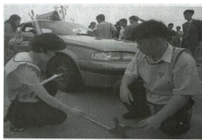
서울 YMCA 시민 중계실이 차량 급발진 실험을 하고 있다.