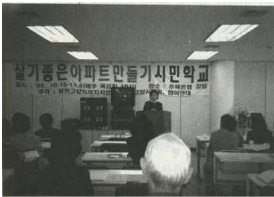
<삽화 9-1> 정치(대한) 147쪽.