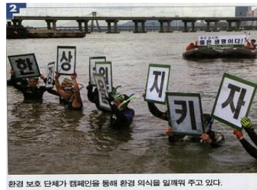
환경 보호 단체가 캠페인을 통해 환경 의식을 일깨워 주고 있다.