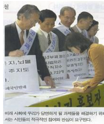
<삽화 5-1> 사회문화(지학사) 184쪽. <삽화 5-2> 고1(디딤돌) 291쪽.

서명운동이란 어떤 주장이나 의견을 더욱 분명히 나타내기 위해 찬성의 뜻으로 국민 개개인에게 서명을 받는 것을 말한다. 11) 서명운동 또한 삽화 배경에 일정 주제에 대한 호소를 적은 플랜카드를 들고 있는 사람들이