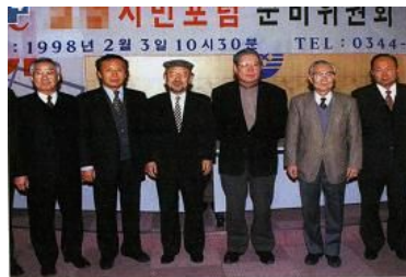
지방 자치제 실시 이후로 지역 주민이 주체가 된 지역 시민 단체의 활동이 활발해지고 있다.