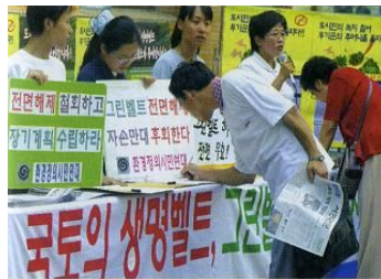
<삽화 1>고1사회(디딤돌) 193쪽.

는 분석대상으로 분류하였지만, “주민들, 노동자들, 의사들”과 같이 단체의 조직이 아닌 개인들의 집합체를 나타내는 설명의 경우에는 앞서 살펴 보았던 시민사회단체의 요건 ‘단체의 조직화’, ‘조직의 계속성’에 해당되지 않기 때문에 분석대상에서 제외하였다. 또한 본 논문의 연구 대상은 시민사회단체의 ‘활동’이기 때문에 <삽화 3>과 같이 활동을 나타내지 않은 삽화는 본 연구에서 제외하여 분석하였다.