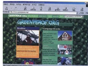
<삽화 2>고1사회(두산) 201쪽.