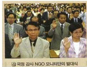
④ 국정 감사 NGO 모니터단의 발대식