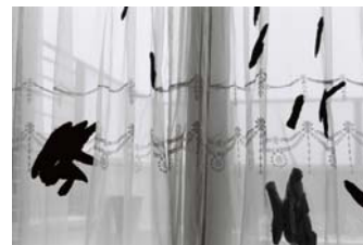
[작품 4] movement, each 5×7cm, ink jet print 2013