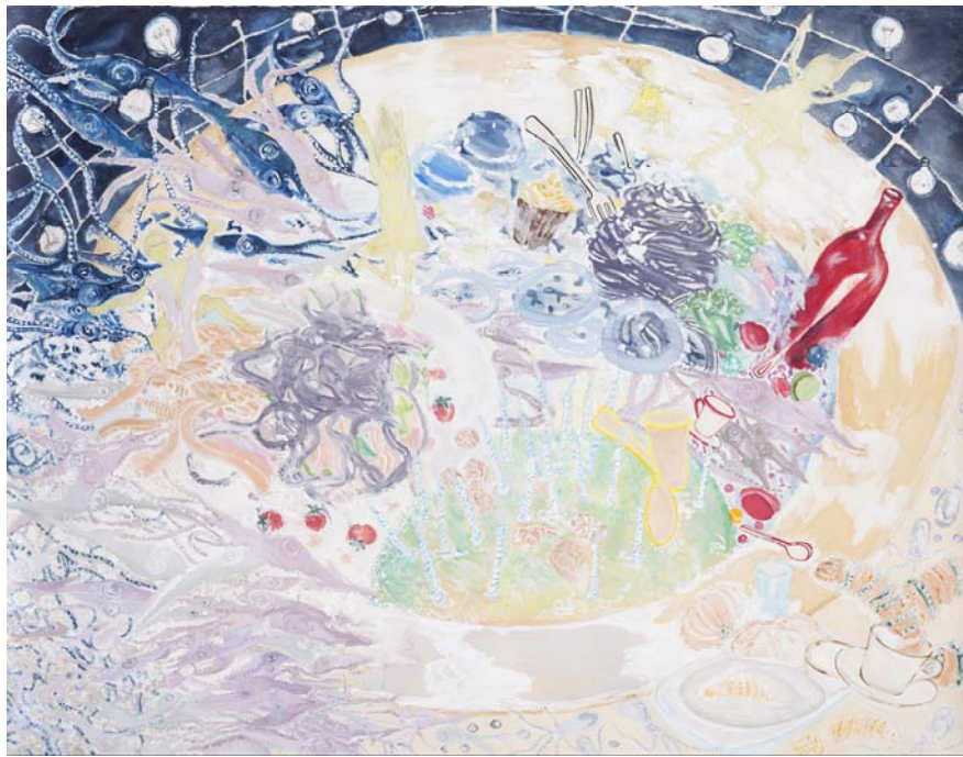
[작품 13] 바다 한접시, 91×116.8cm, 장지에 혼합재료, 2015