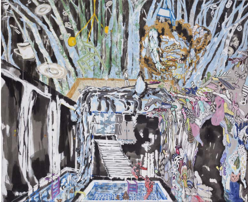
[작품 2] intuition and insight 2, 장지에 수묵채색, 167×137cm, 2011