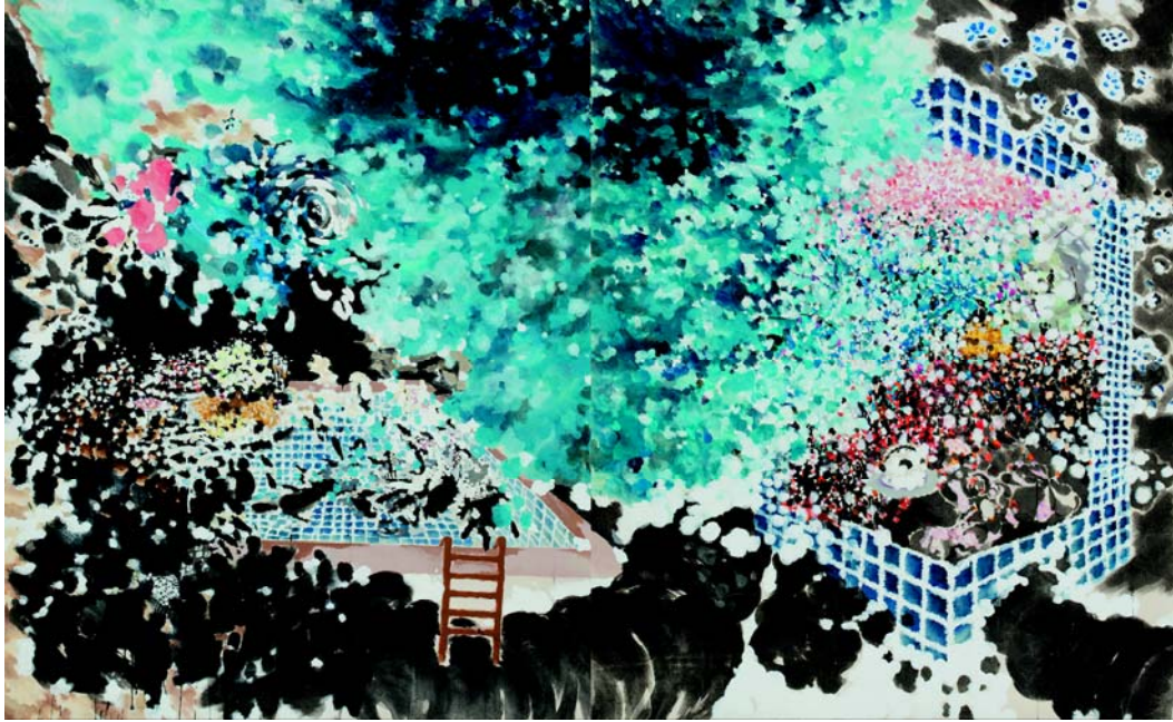
[작품 6] 한 장면_증발, 167×270cm, 장지에 수묵채색, 2013