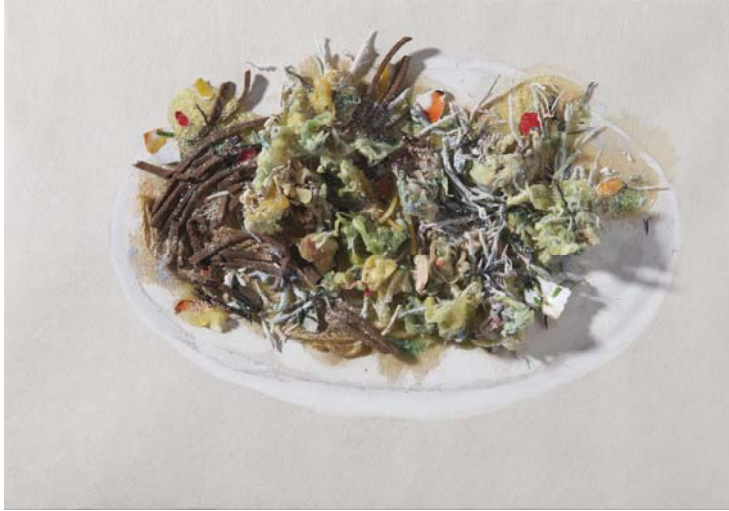
[작품 14] recycle food, 36×32cm, 장지에 혼합재료, 채색, 2015