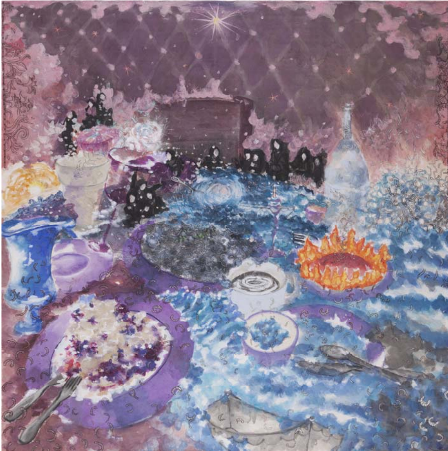
[작품 17] Last side dish, 135×135cm, 장지에 채색, 2015