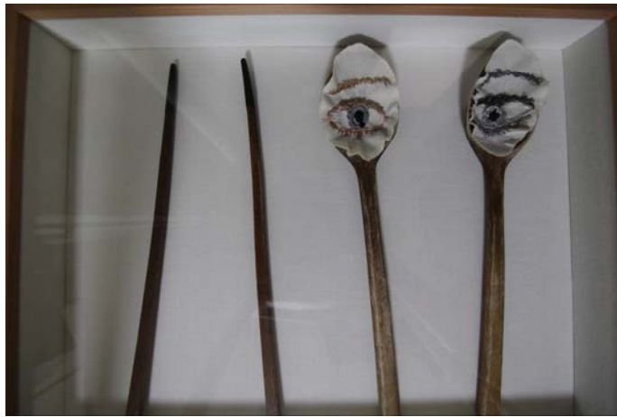
[작품 15] Always watching, 36.5×31, wood on canvas, 2015