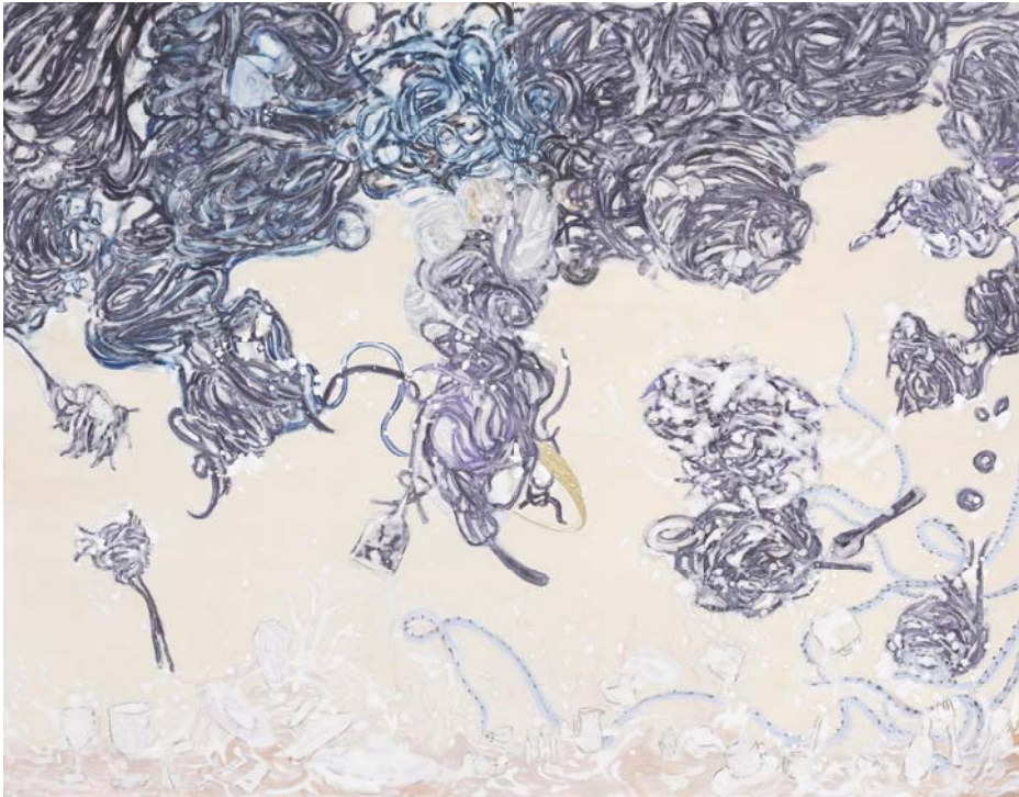
[작품 8] pollutant, 91×116.8, 장지에 혼합재료, 2015