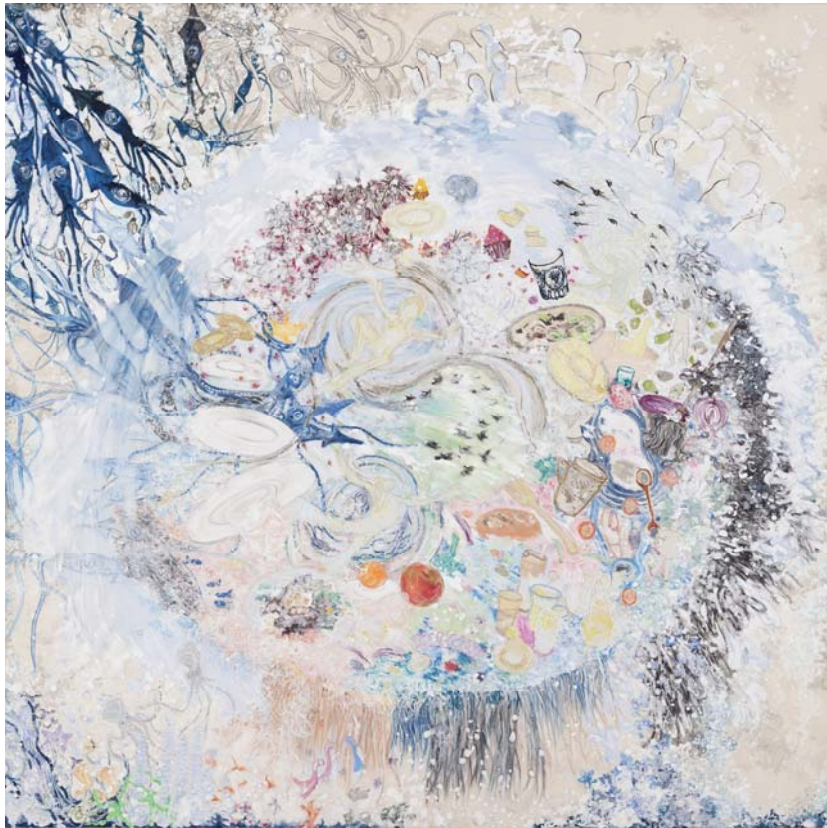
[작품 7] 바다 한접시, 135×135cm, 장지에 혼합재료, 2015