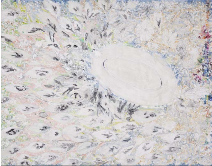
[작품 12] 굴꽃, 91×116.8cm, 장지에 호분, 2015