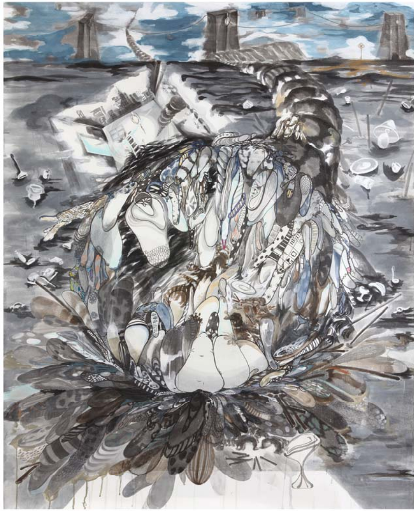
[작품 3] intuition and insight 3_inflow, 장지에 수묵채색, 137×167cm, 2012