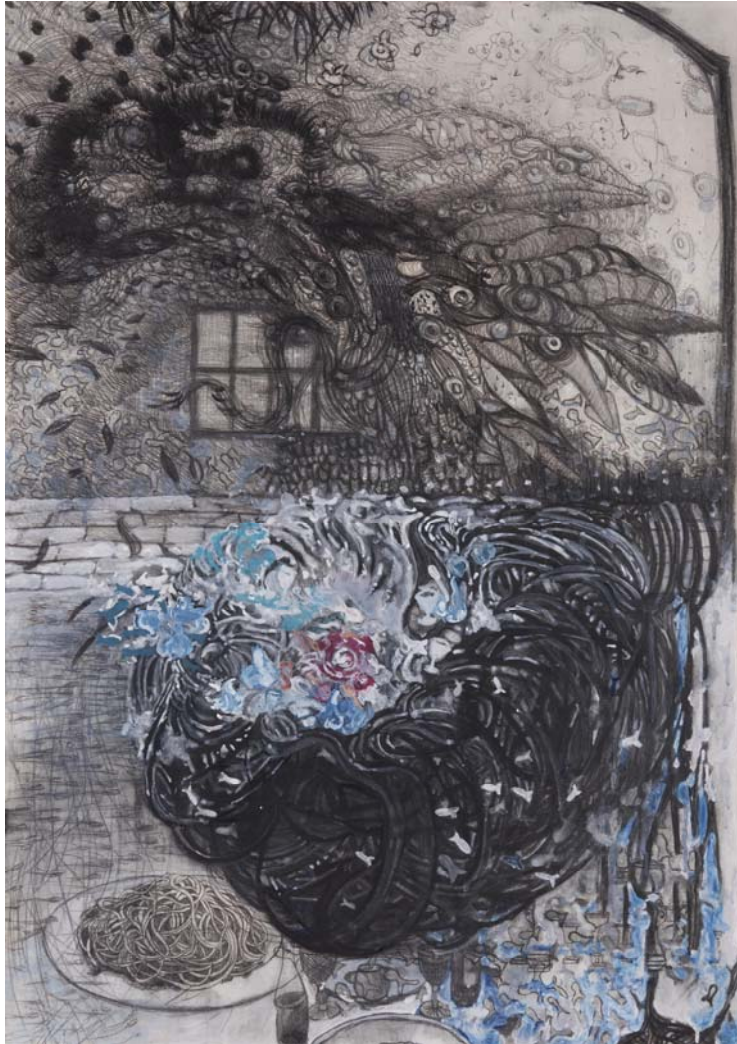
[작품 16] squid ink spaghetti, 116.8×91cm, 장지에 혼합재료, 2015