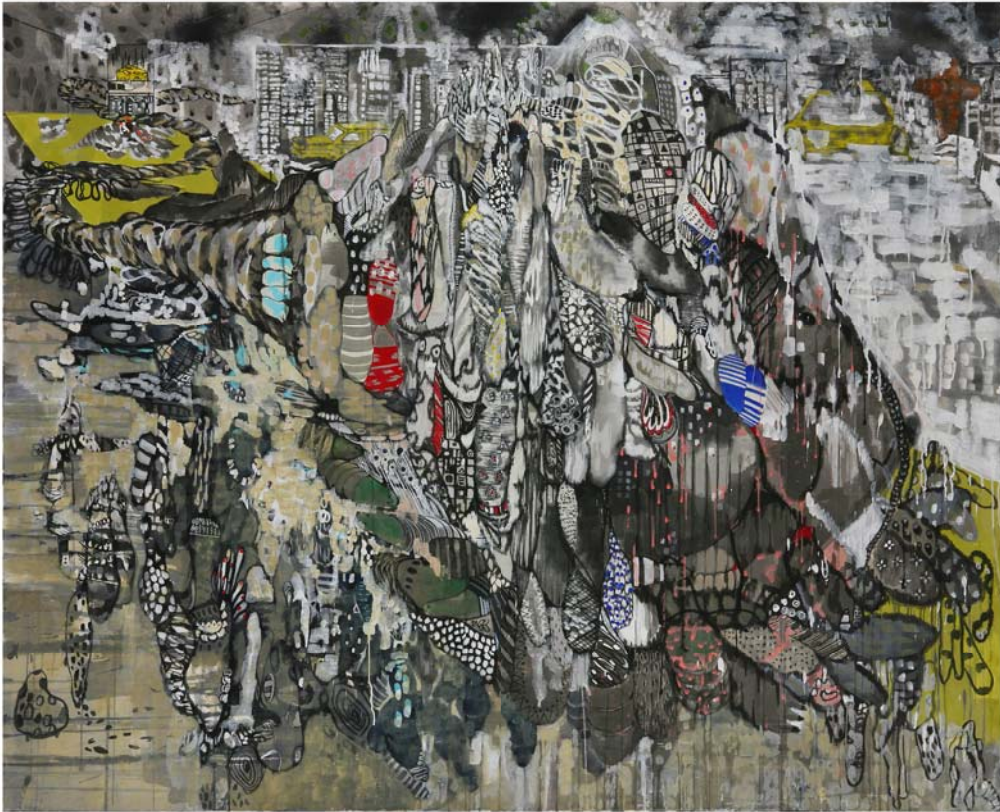
[작품1] intuition and insight 1, 장지에 수묵채색, 167×137cm, 2011