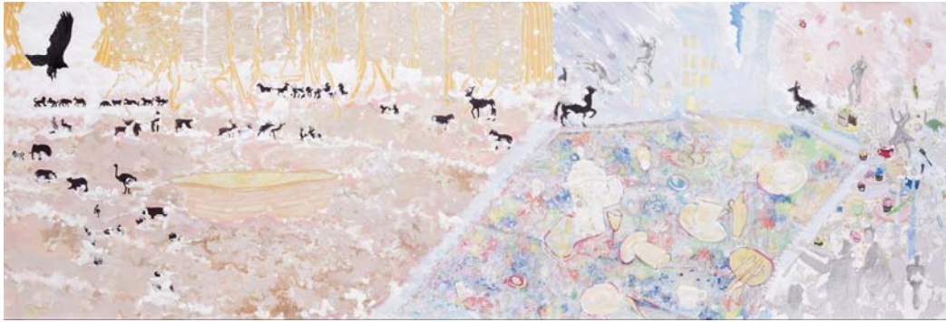
[작품 10] Ark party, 75×190cm, 장지에 채색, 2015