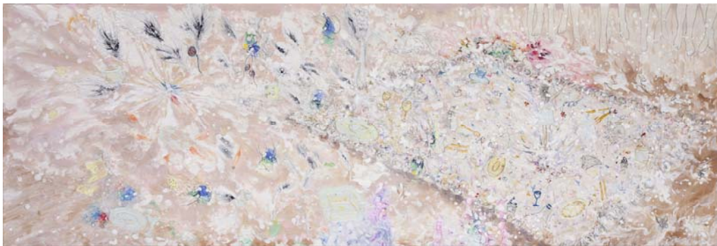
[작품 11] 바다 속 향연, 75×190cm, 장지에 채색 2015