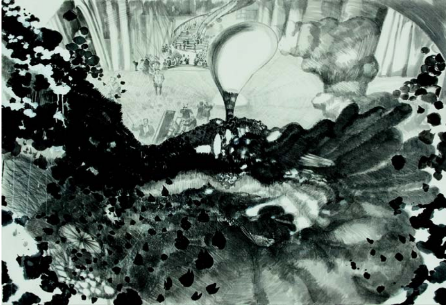
[작품 5] 변이1, 137×167cm, 장지에 먹, 2013