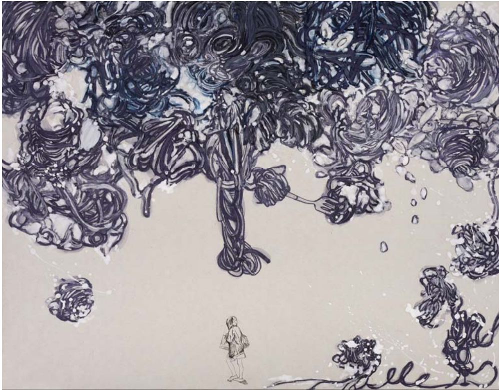
[작품 9] pollutant 2, 91×116.8cm, 장지에 채색, 2015