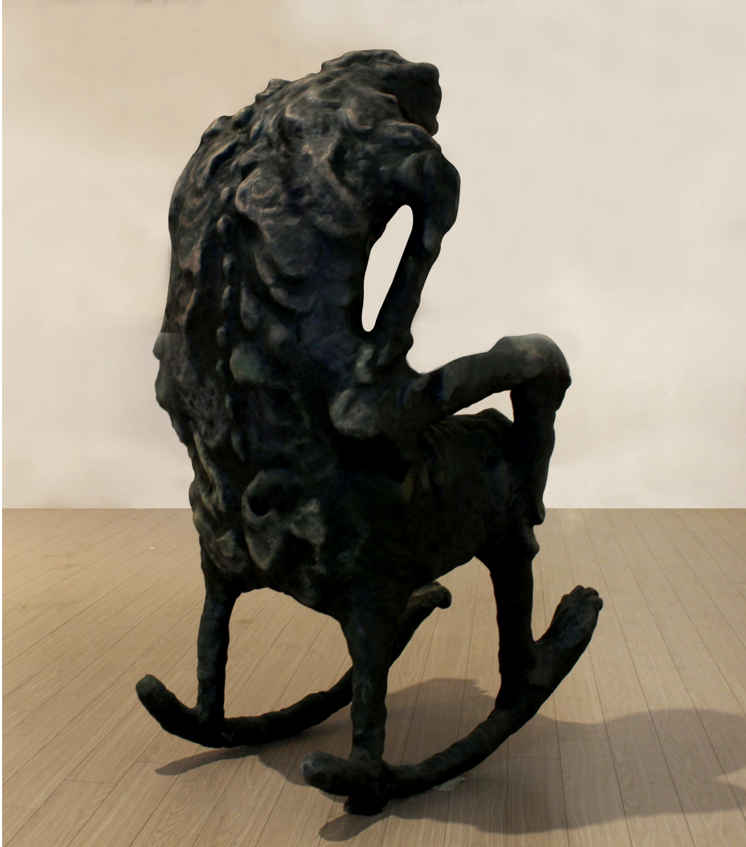
【작품 2】 방관자/ 810x640x1230mm/ Resin(Sibatool),acrylic/ 2020