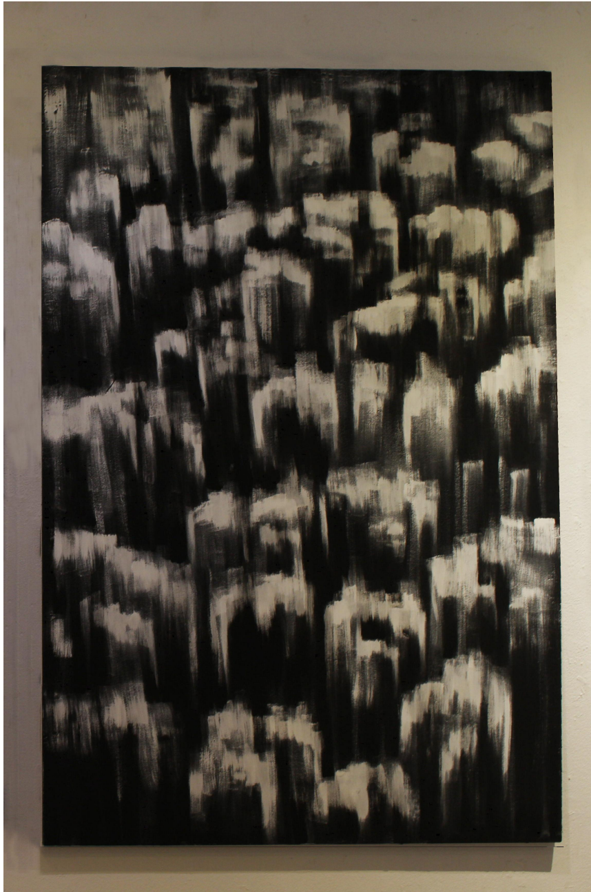
【작품 5】 담/ 1220x1800mm/ 합판, 수성 페인트/ 2020