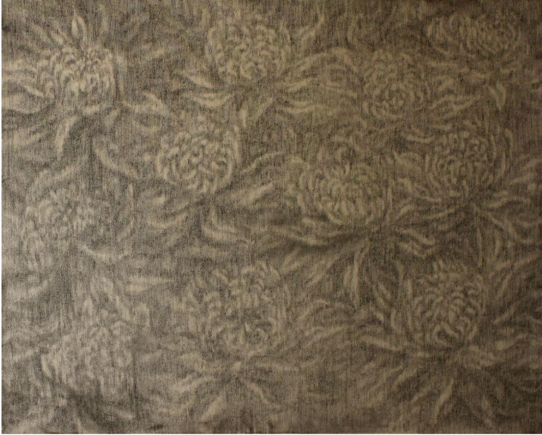
【작품 10】 국화/ 캔버스 20호/ 콩테 드로잉/ 2020