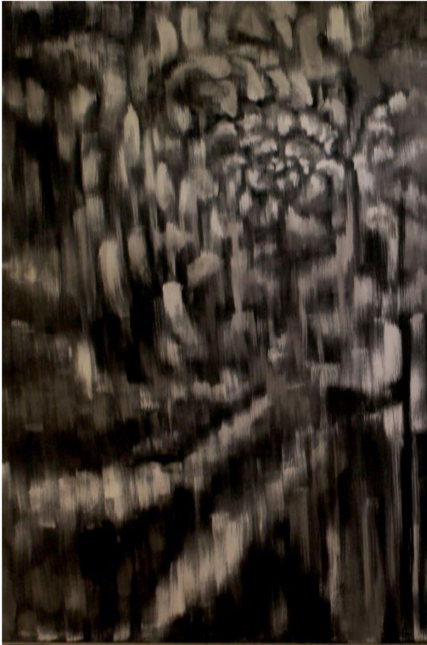
【작품 8】 국화/ 1220x1800mm/ 합판, 수성 페인트/ 2020