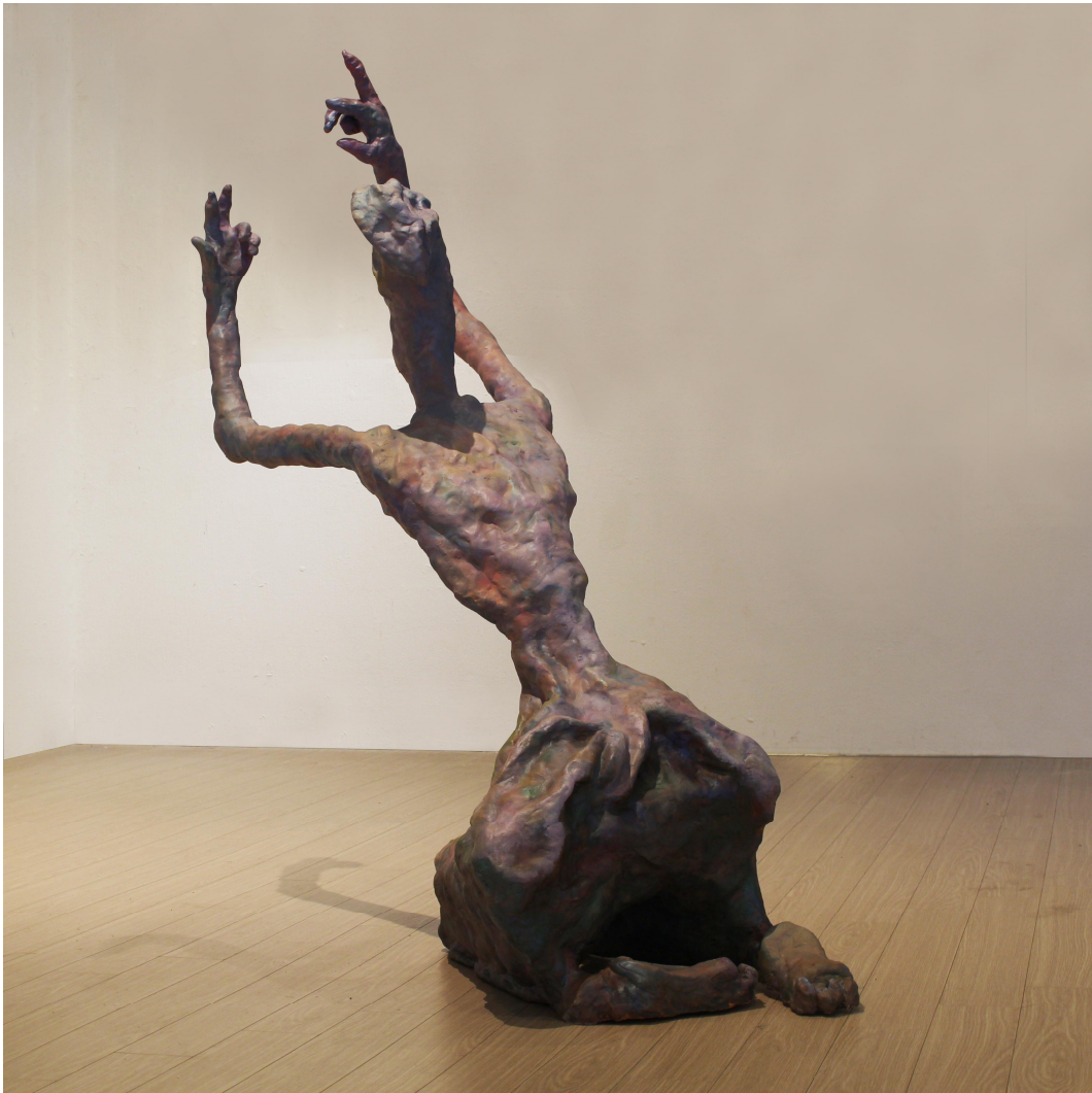
【작품 1】 자이 구루 데바 움/ 1082x427x1305mm/ Resin(Sibatool), acrylic/ 2020