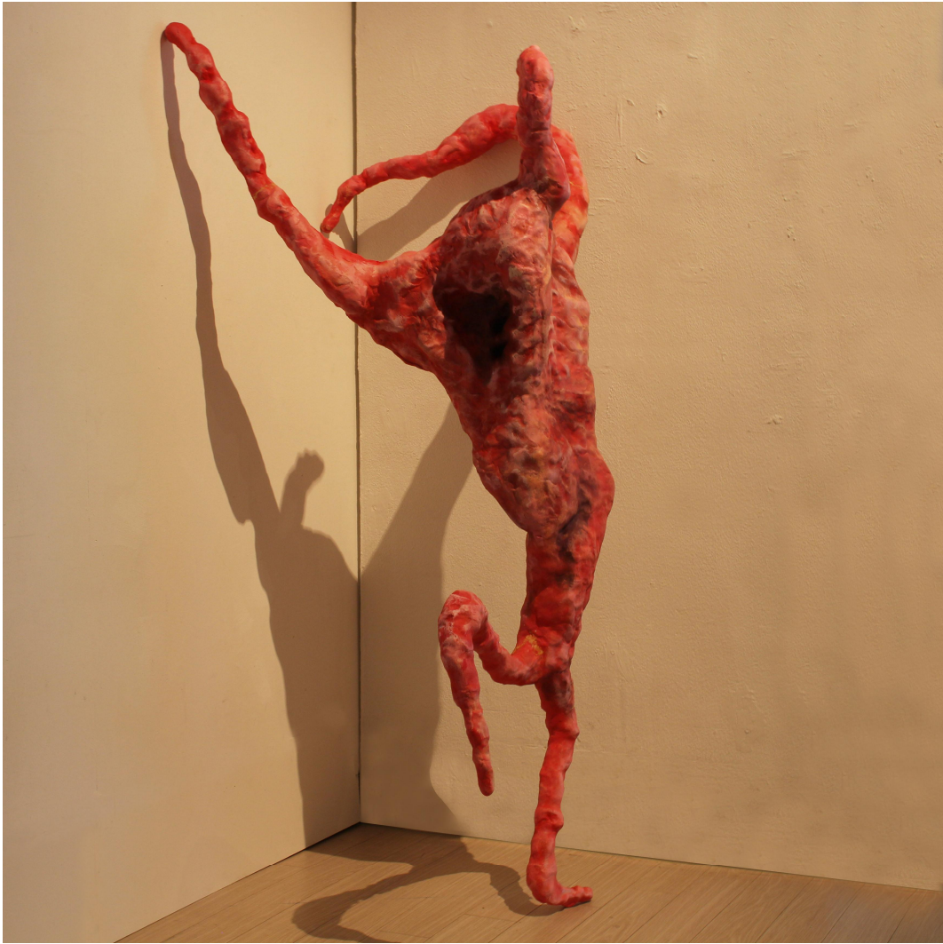
【작품 3】 은둔자/ 1분50초/ 1470x690x670mm/ Resin(Sibatool),acrylic/2020