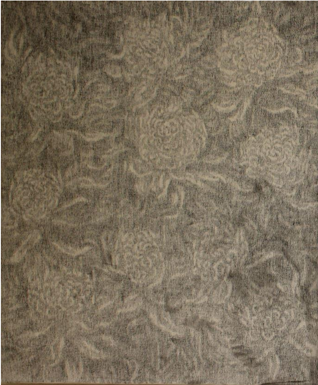
【작품 9】 국화/ 캔버스 20호/ 콩테 드로잉/ 2020