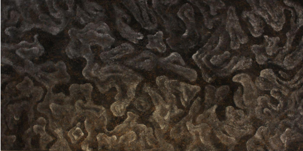
【작품 4】 엽/ 2440x1220mm/ osb합판, 수성 페인트/ 2020