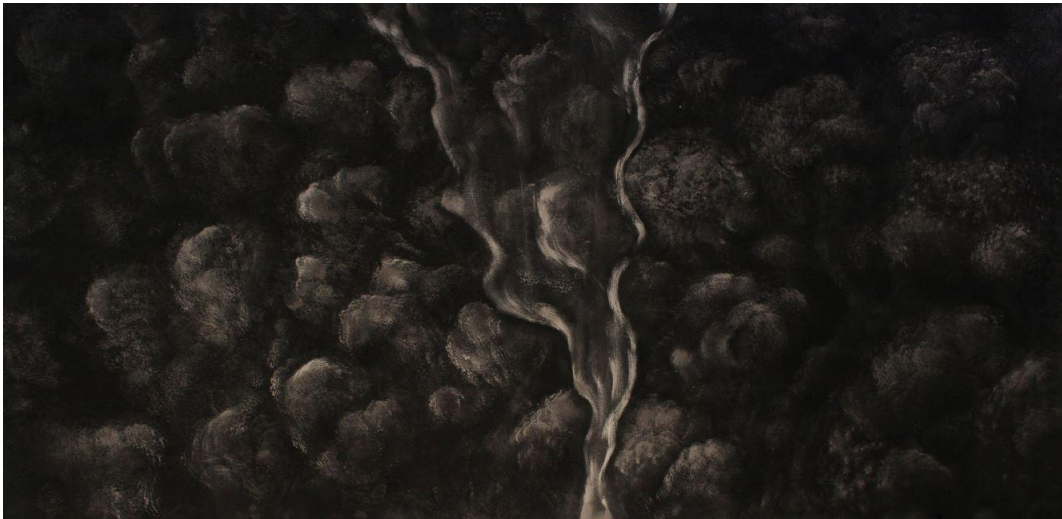
【작품 6】 담/ 1220x600mm/ 합판, 수성 페인트/ 2020