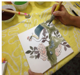
[초벌 기물에 하회채색]