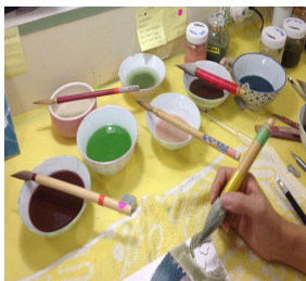
[다채색 안료 준비]