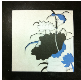
[우드락 높낮이 구성]