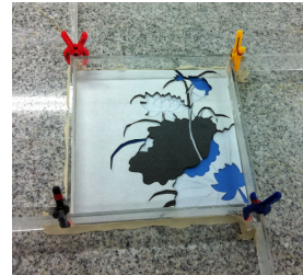
[석고 붓기 전]