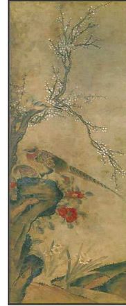
<도판3>화조도 8폭병풍중 2폭, 각 43x111cm, 종이위에 채색, 19세기 중기, 작가미상