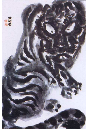
<도판8>호랑이 43.8x33.3cm, 수묵화, 미상, 박생광작