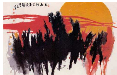
<도판6>석양의 군마도 143x93cm, 종이에 수묵 채색, 1993 년, 김기창작