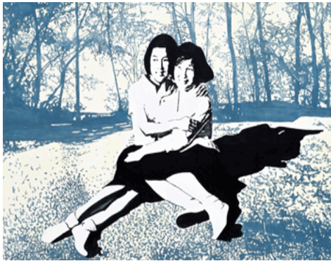
<도판18>우리단둘이(Two of Us) 152x200cm, 캔버스에 아크릴 릭, 2002, 씨니킴작