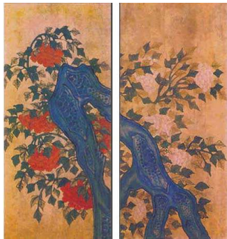
<도판10>목단도(모란그림) 8폭중2폭, 각33x117cm, 종이위 채색, 19세기 초기, 작가미상