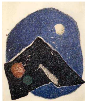
<도판5>태고의 이미지 135x165cm, 종이에 채색, 1960~1964년, 김기창작