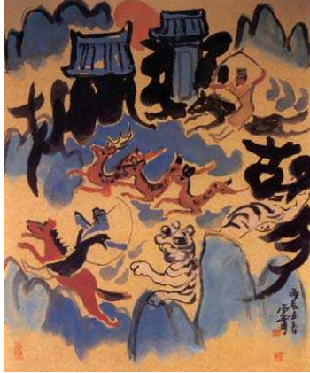
<도판1>바보수렵도 45x53cm, 두방(금지)에 수묵담채, 1976년, 김기창작