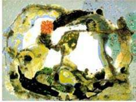
<도판16>무제 90x121cm, 한지위에수묵채색, 1987년, 황창배작