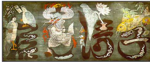
<도판11>문자도 84x47cm, 목판, 19세기초기, 작가미상