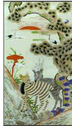
<도판9>십장생도 1폭, 38x79.5cm, 종이위에 채색, 20세기초기, 작가미상