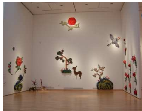
<도판19>심장생도 미상, 플라스틱페폼위에 아크릴릭, 2004, 서희화작