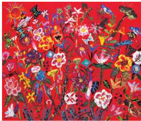
<도판15>설악산풍경 80.3x100cm, 캔버스위에 오일, 2003, 김중학작