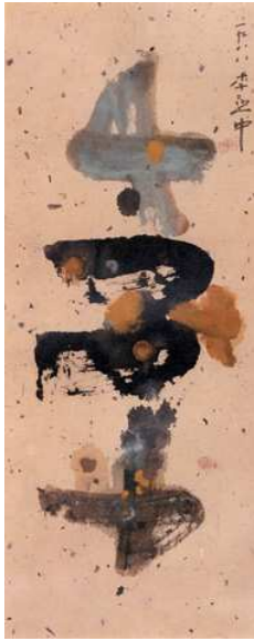
<도판12>무제(문자도) 29x74cm, 화선지위에 먹, 1998, 이희 중작