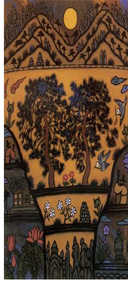
<도판13>풍류의 고을 72.5x53cm, 캔버스위에 오일, 1997, 이희중작