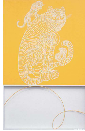
<도판17>reproduction-yellow line, 137.8x92x6.7cm, 아크릴 채색 와이어, 2004, 한만영작