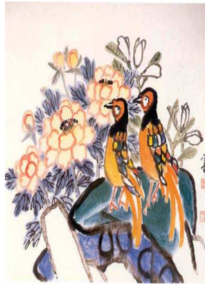
<도판2>바보화조 미상, 종이에 채색, 1960~1977년 김기창작