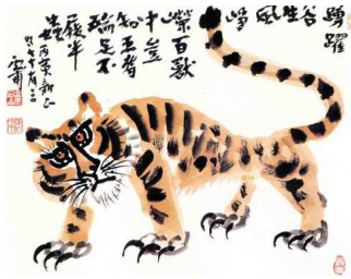
<도판7>호랑이 60.5x50cm, 두방에 수묵담채, 1986년, 김기창작